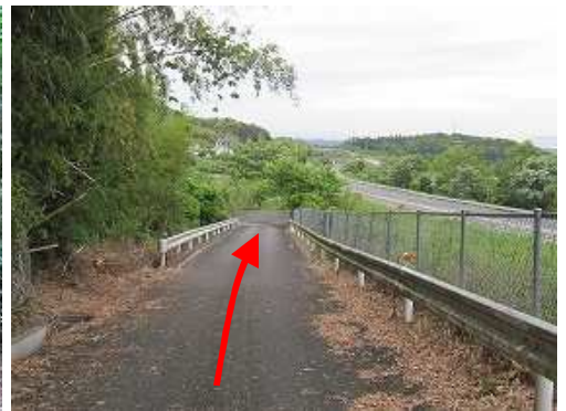
バイパスの側道に行く。