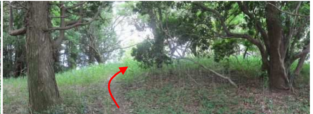
前方が明るくなってきた。