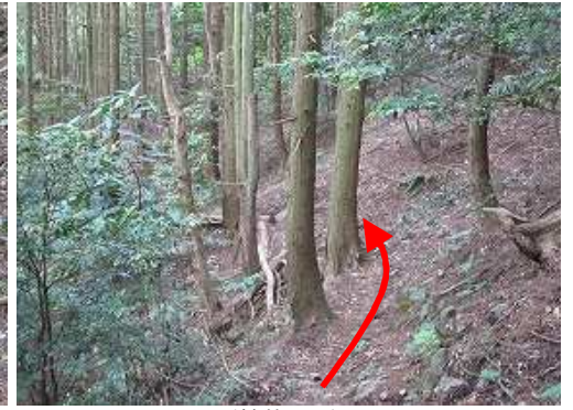
スギ植林地に行く。