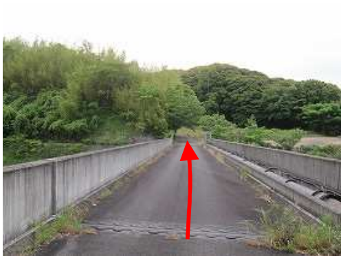
国道10号バイパス上の跨道橋を渡る。