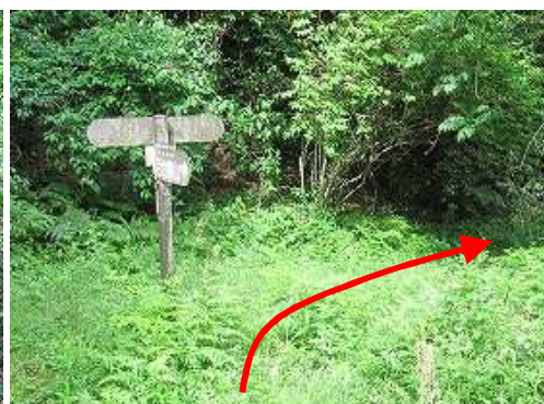
百合野山分岐を右折し山香方面へ向かう。