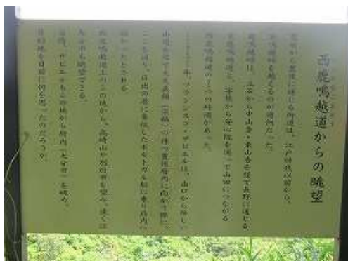
展望地に立つ案内板と眺望。