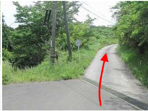
右折して道なりに緩く登って行く。