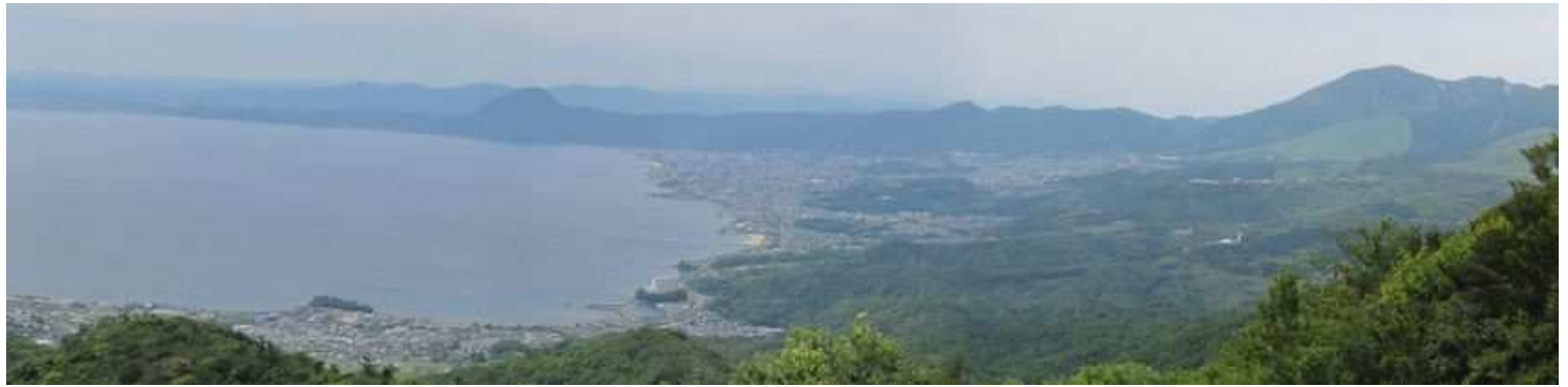
南の展望。 一息ついて次へ向かう