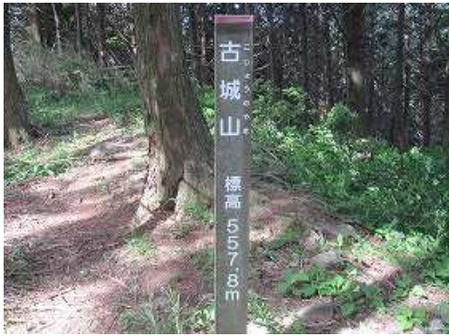
古城山(558m)(こじょうのやま)の山頂は、ヒノキの植林に囲まれ此処からの展望は得られない。