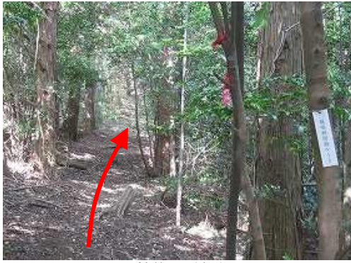
ヒノキ植林地を緩く行く。