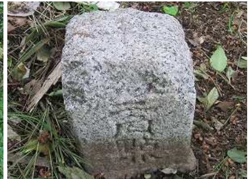
百合野山(569m)の山頂には、三等三角点:百合野が設置されているが、周囲を雑木で囲まれ展望は得られない。