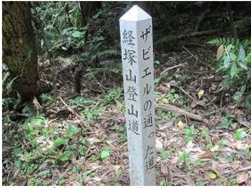
「ガビエルの通った道」標柱を見る。