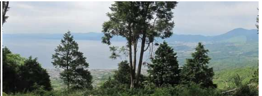
南側の斜面の一部が伐採され、部分的に杵築市から大分市、別府市、鶴見岳が望まれる。 一息ついて次へ向かう