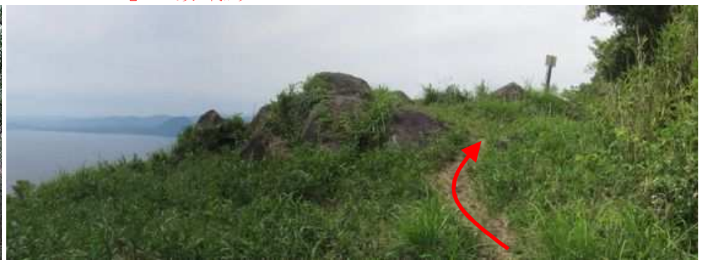
緩やかに登ると七ツ石山の山頂が見えた。