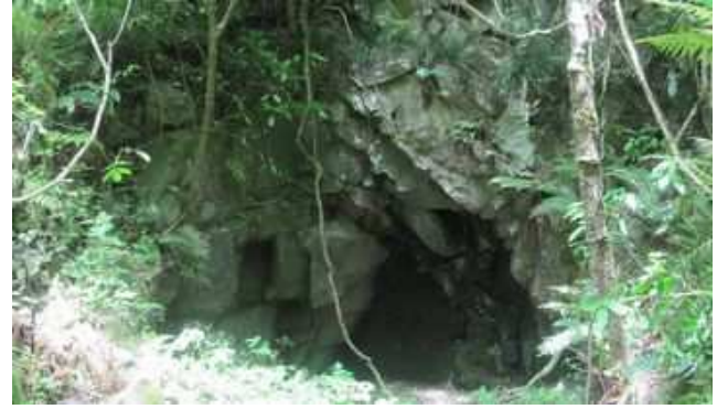
東側に立つ石切場の案内板と石切場を見て通過する。