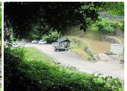
山田湧水と駐車場が見えた。