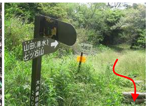
擬木階段を降って林道に出会う。