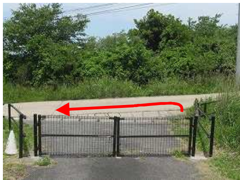
ゲートを出て左折し、道なりに降って行く。