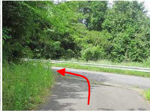
広域農道に出会い左折する。