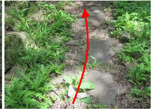
部分的に石畳が残っている。