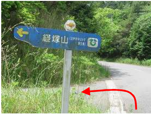
150m程進むと経塚山入口の案内板を見て左折する。