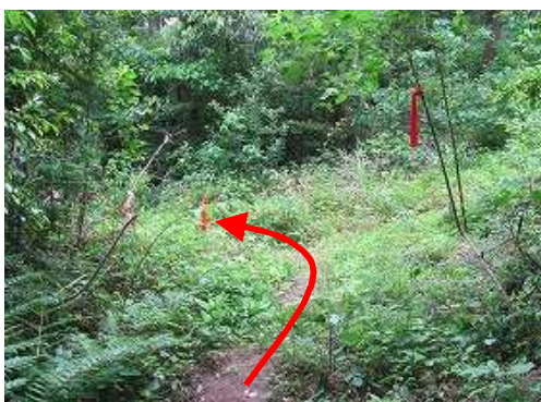
三叉路を左折する。