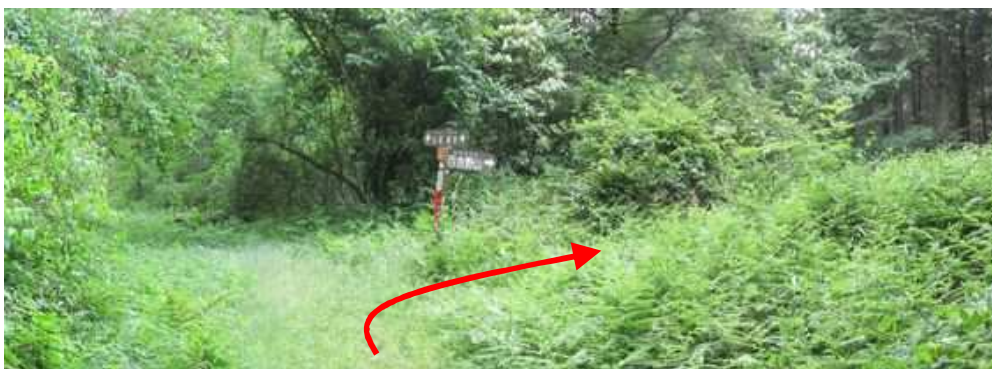
百合野山分岐に出会い、右折して百合野山へ向かう。