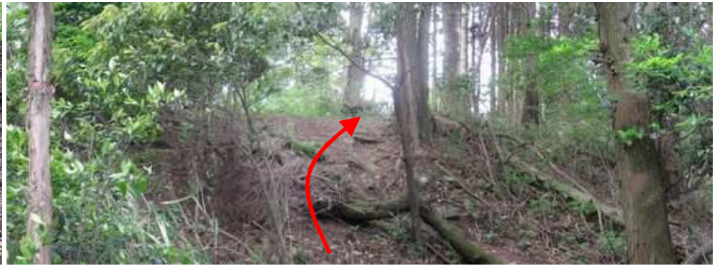
山頂部は小高い丘状の地形をしている。