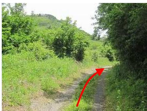
林道を道なりに進む。