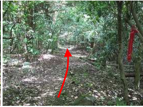
雑木林を緩やかに降って行く。