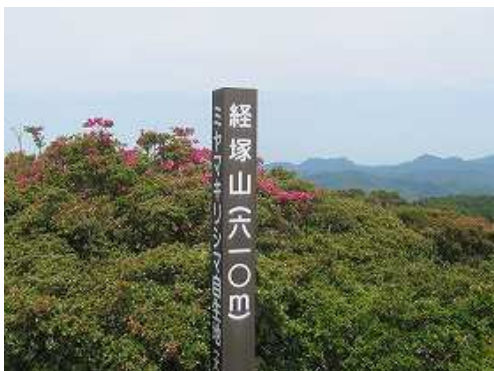
ミヤマキリシマ自生地の経塚山(610m)に到着。