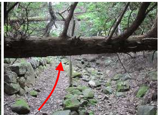
倒木をくぐり抜ける。