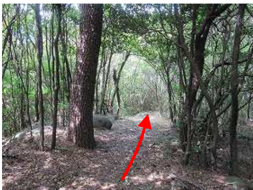
緩やかな尾根筋に行く。