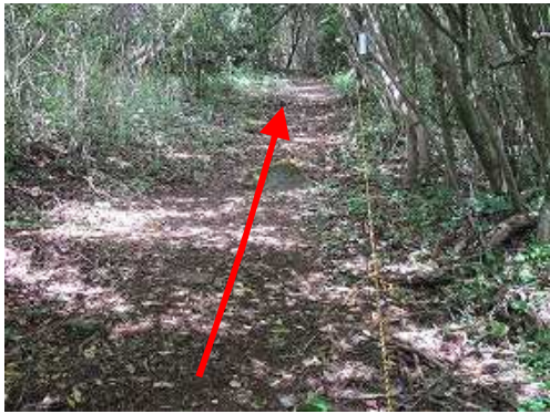
トラロープ斜面を登って行く。