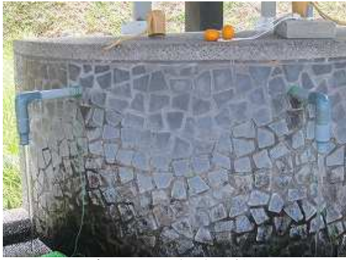
冷たい山田湧水で顔を洗う。