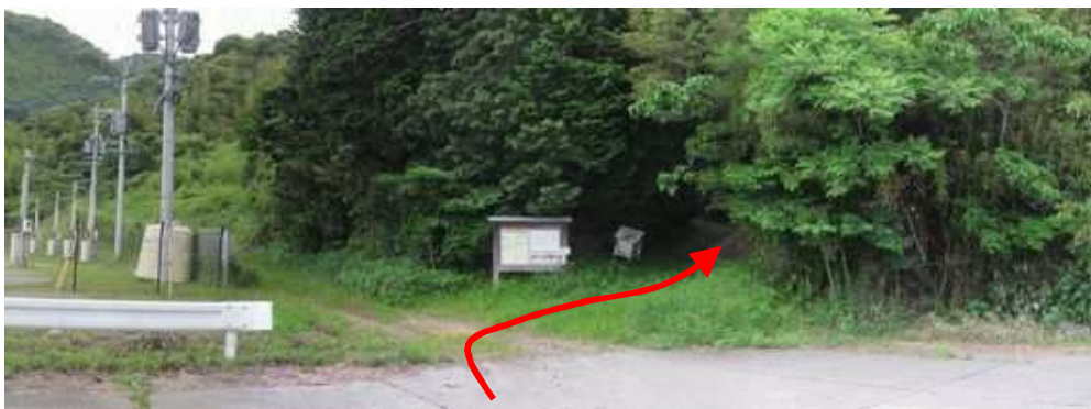
殿様道登山口に到着。