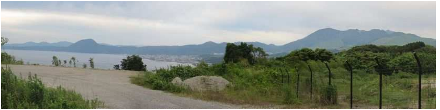
振り返ると高崎山から鶴見岳が望まれる。