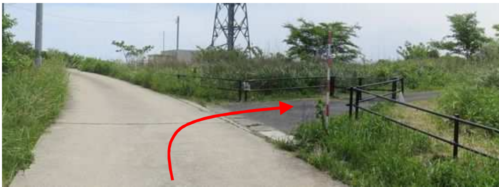
右のゲートを抜ける。