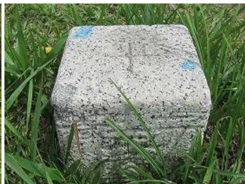
七ツ石山(623m)の山頂には、二等三角点:豊岡が設置されており東から西にかけての展望が得られる。