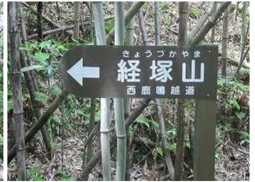
左に案内板を見る。