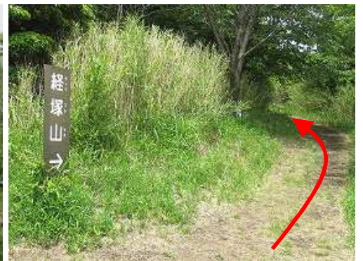
案内板を見て緩く登って行く。