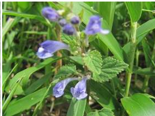
コバナツナミソウ