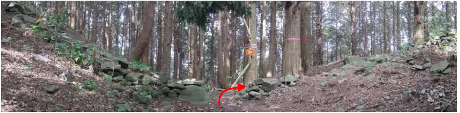
直ぐ、シシ垣に出合い案内板を見て右へ向かい、緩やかにヒノキ植林地を降って行く。