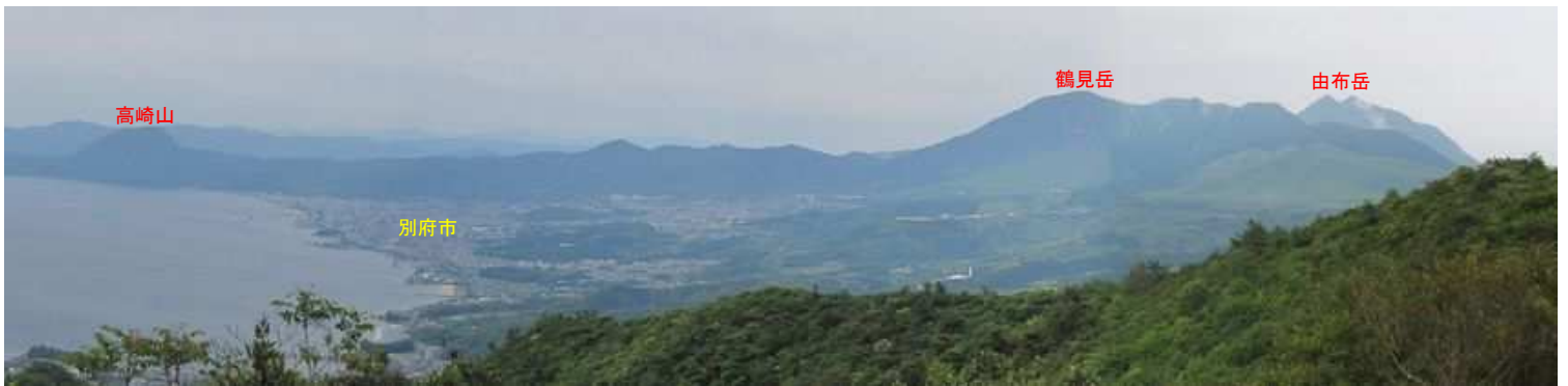
南斜面からの展望。 一息ついて次へ向かう