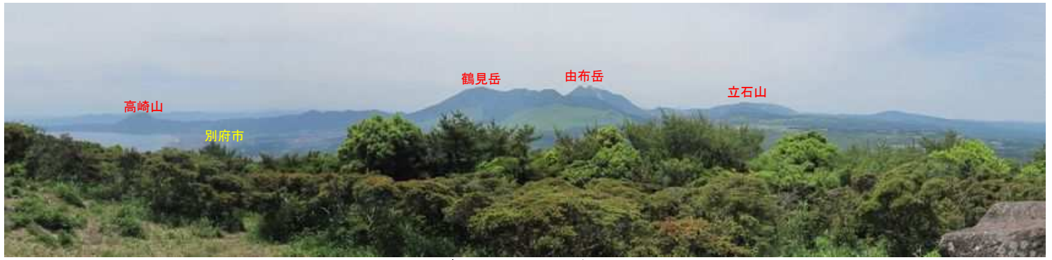
南から西にかけての展望。 一息ついて帰路につく