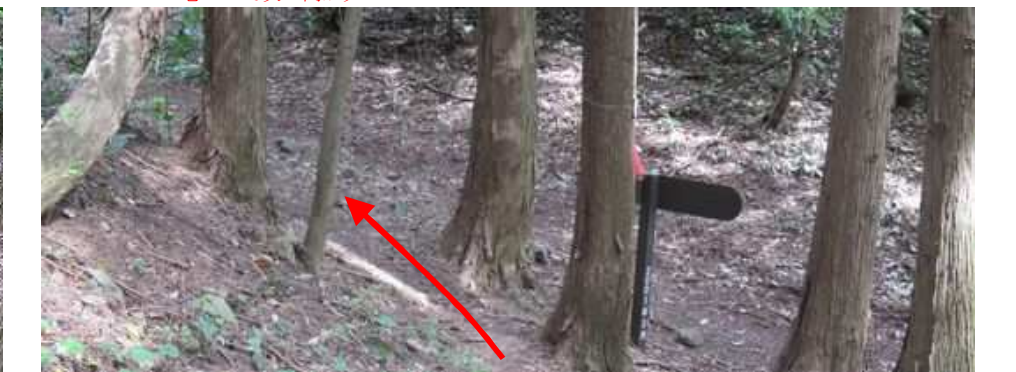
古城山分岐から左へ向かう。