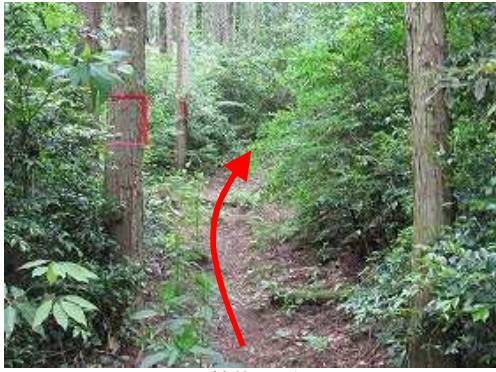
ヒノキ植林地に行く。