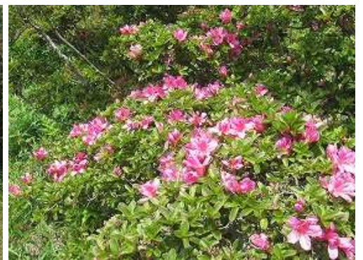
まだミヤマキリシマが咲いていた。