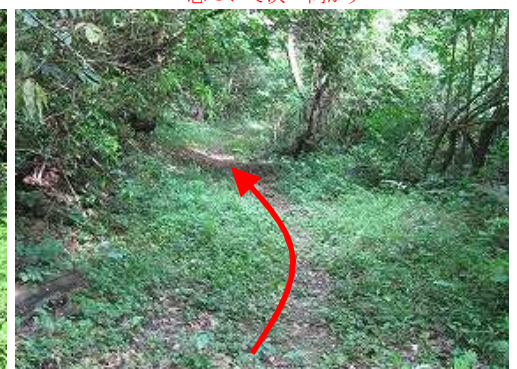
平坦路を北西へ進む。