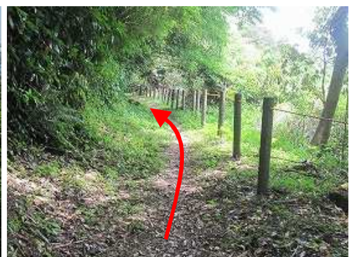
トラロープが通された柵沿いの平坦路を行く。