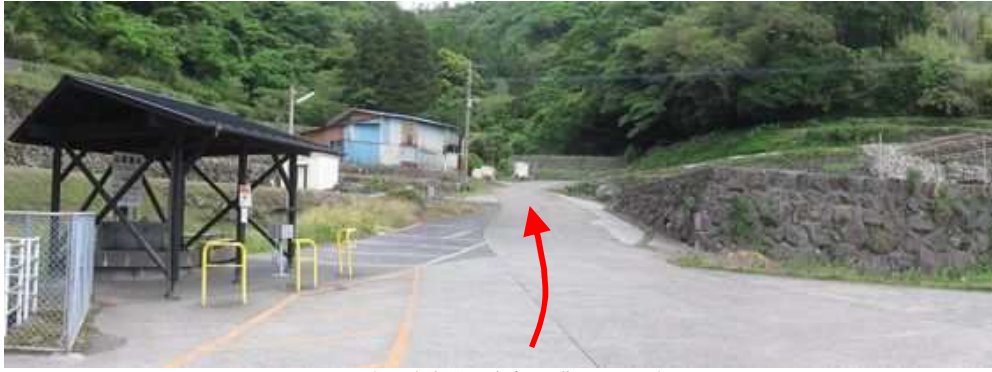
山田湧水の駐車場に駐車し、北へ登って行く。

山田湧水駐車場→殿様道登山口→百合野山分岐→百合野山(569m)→百合野山分岐→古城山分岐→古城山(558m)→古城山分岐→板川山(603m)→七ツ石山(623m)→西鹿鳴越→経塚山入口→経塚山(610m)→展望地→西鹿鳴越→展望地→石切場→水口神社→山田湧水駐車場