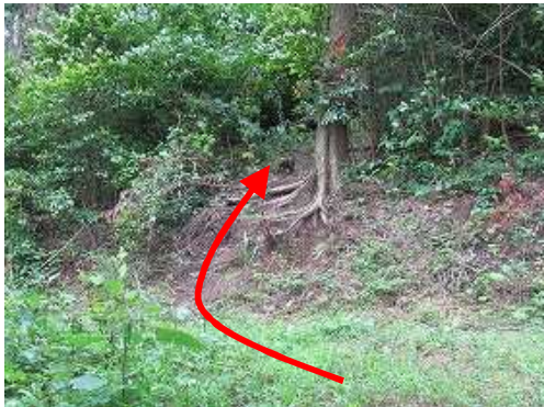
作業路を6回横断する。