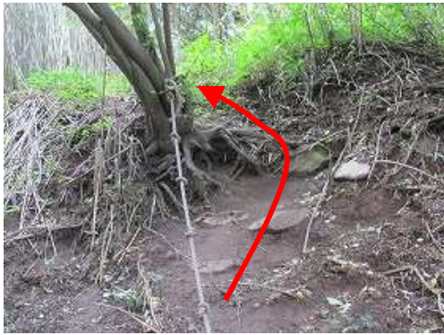
ロープの急斜面を登り上がる。