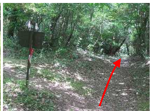
西鹿鳴越に出会い直進する。