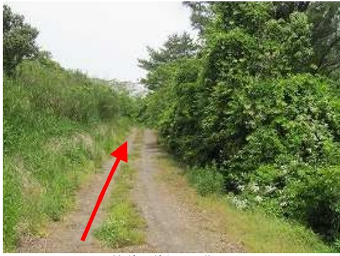
林道を道なりに進む。