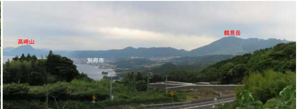
町道から南に別府市や鶴見岳が望まれる。