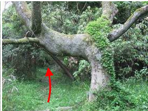
幹が曲がった奇木を通過する。