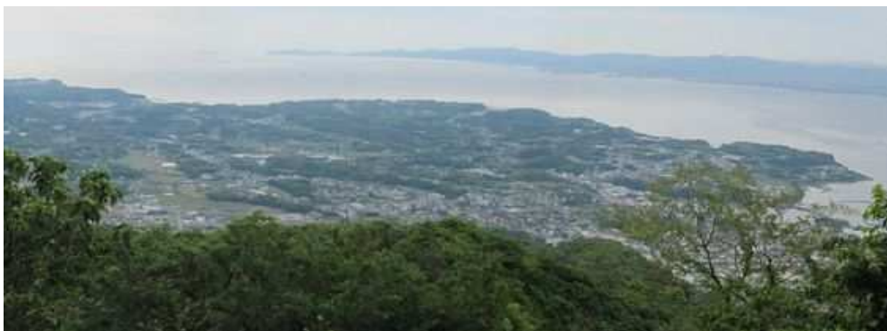
東側に伐採された斜面があり、此处から杵築市や大分市が望まれる。