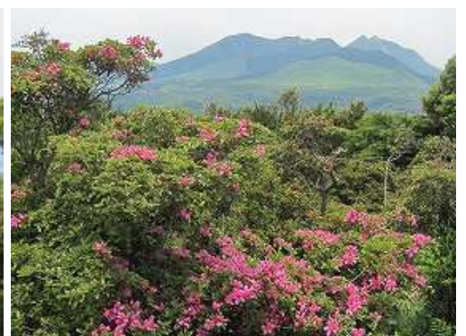
ミヤマキリシマの奥に鶴見岳と由布岳を望む。