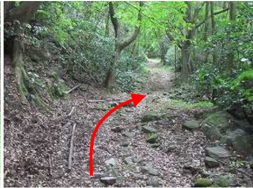
緩やかに登って行く。