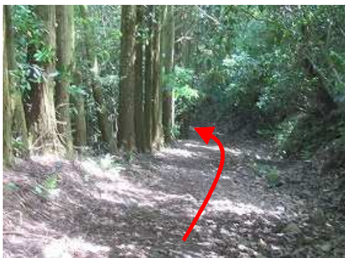
右カーブ後、道なりに降って行く。