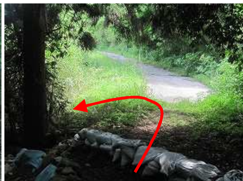
舗装路が見えた所を左折する。