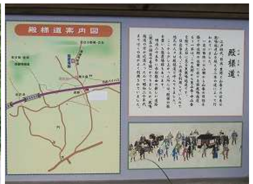
殿様道の案内板に目を通す。