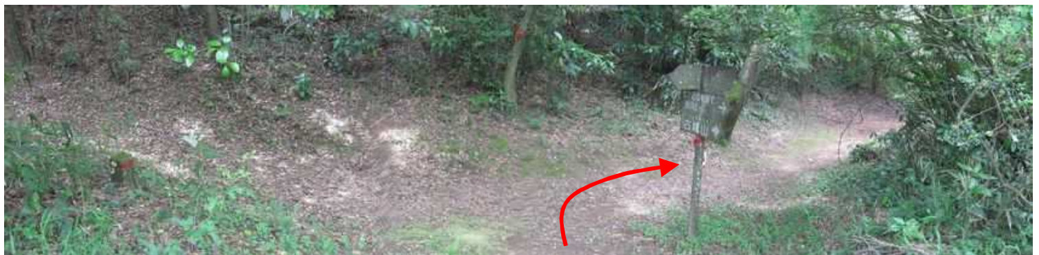
西鹿鳴越に出会い右へ向かう。