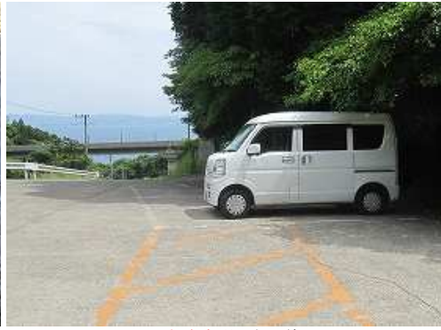
山田湧水駐車場に帰ってきた。