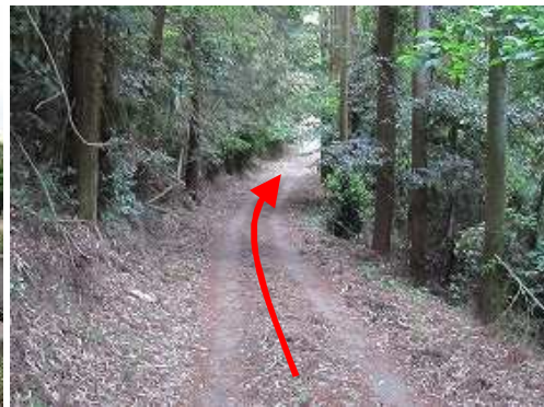
山側に墓地を見て通過する。