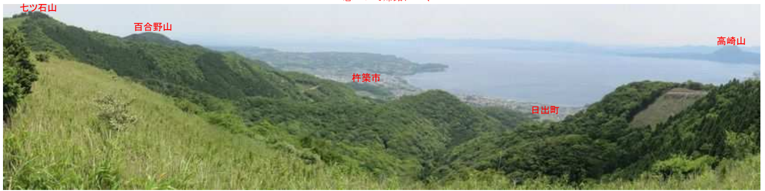
展望地からの眺め。