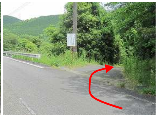
広域農道から右折して林道に入る。