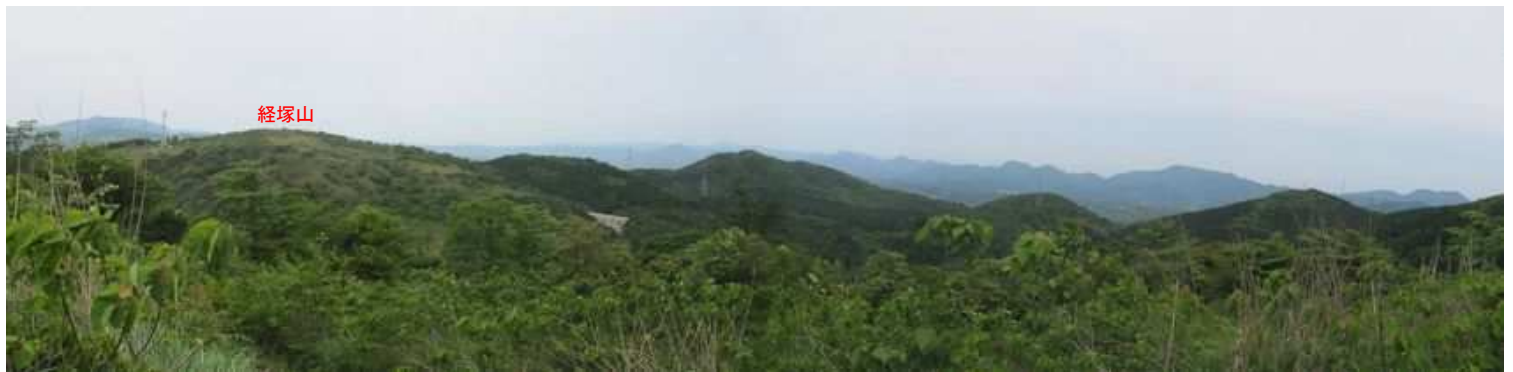
これから向かう経塚山と北西の山並みを見ながら緩く降って行く。