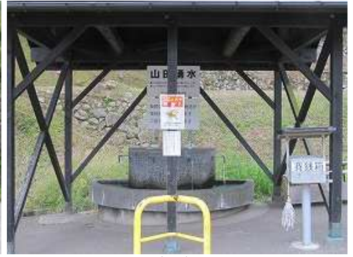
山田湧水を左に見る。