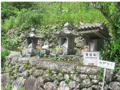
山田水元である水口神社に立ち寄る。