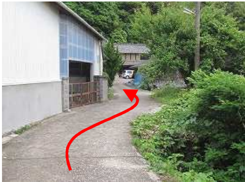
民家際の町道を進む。