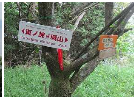
各種案内板を見る。 一息ついて次へ向かう