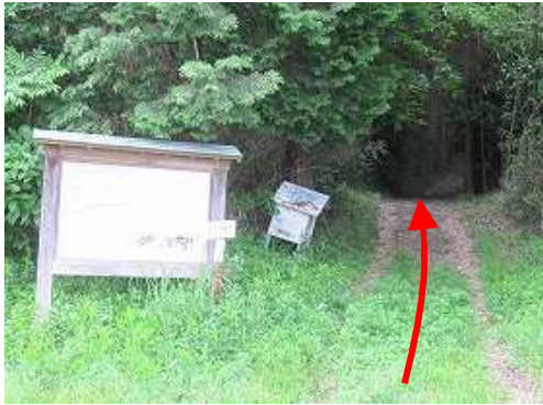
殿様道へ踏み込む。