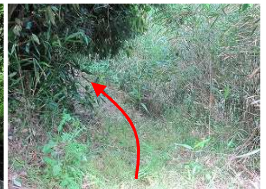
此処から踏み込む。