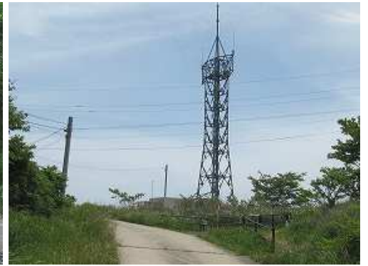
前方に中継塔が見えて来た。