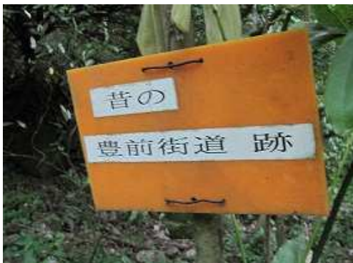
駕籠立場辺りを通過する。