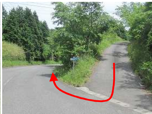
経塚山入口から右折して広域農道を降る。