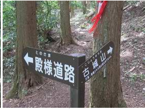
古城山分岐に出会い、古城山へ向かう。