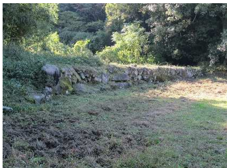
東から見た第1水門。