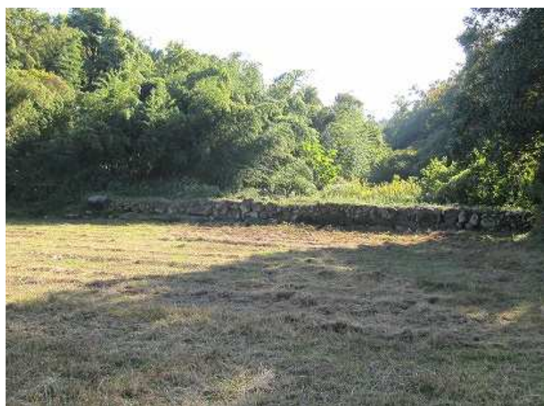
北の道路から見た第1水門。