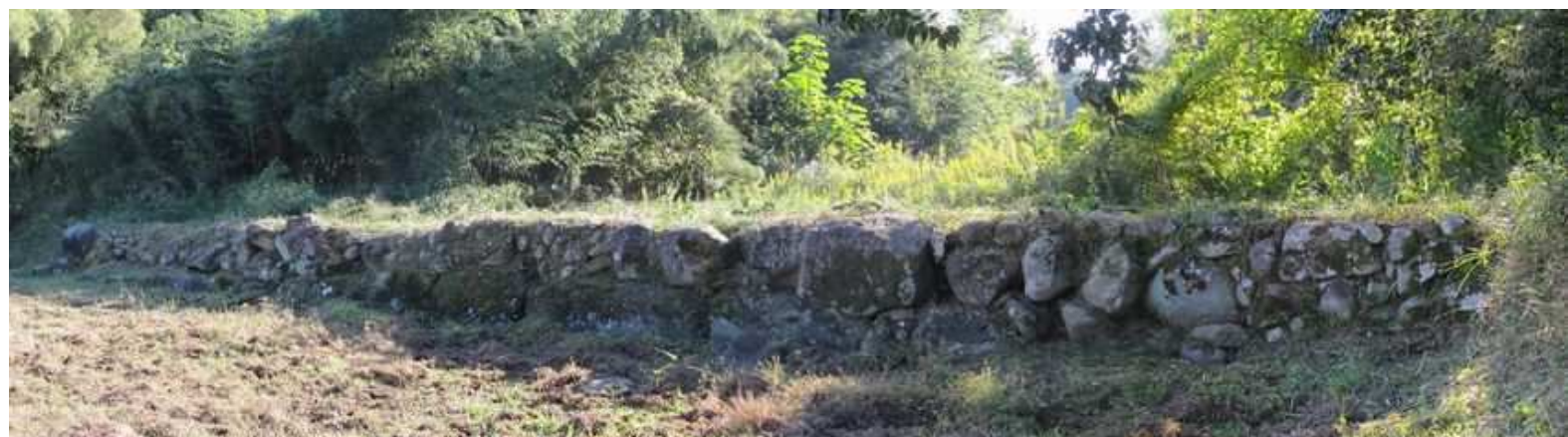
北から見た第1水門。