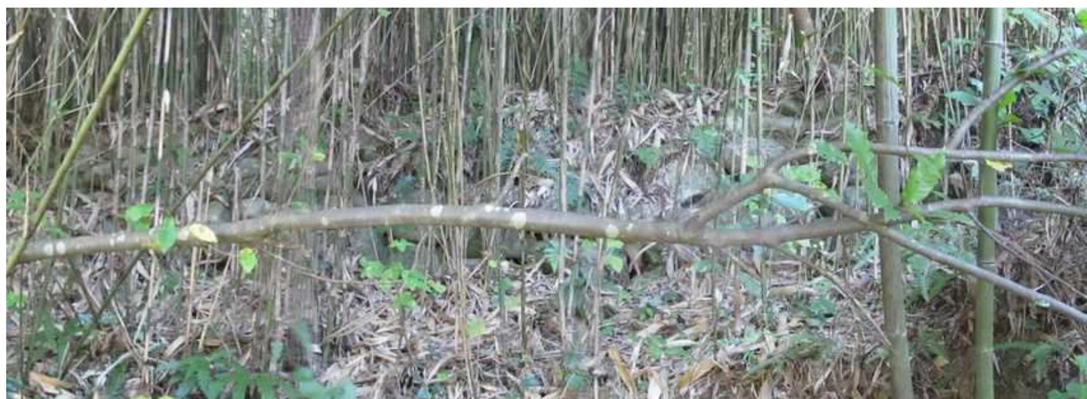
東側ササ藪の中に積みを見る。