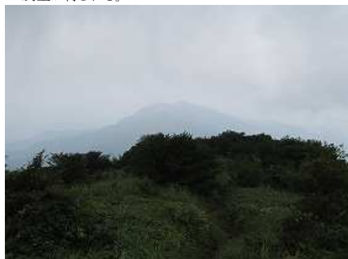
前方に彦岳が望める。