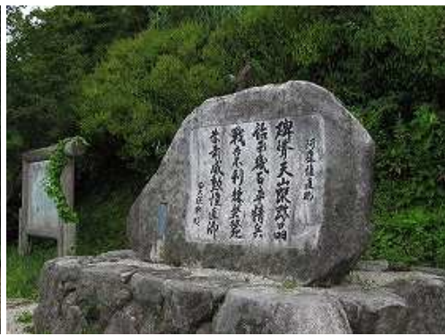
抜け出た右に阿蘇惟直の碑を見る。