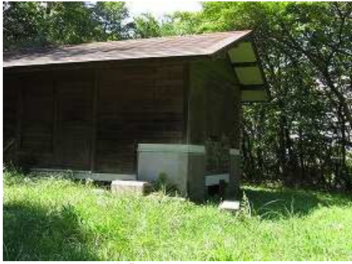
作業小屋に飛び出る。