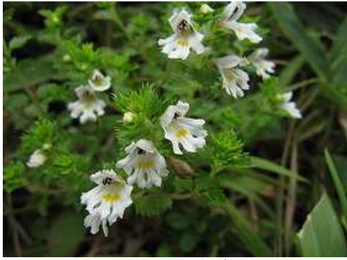
キュウシュウゴメグサ