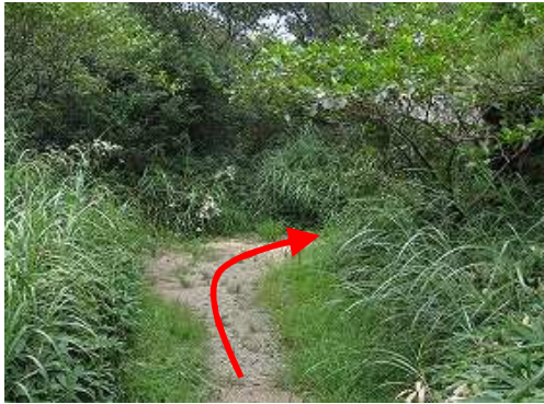
岸川 分岐を右折する。