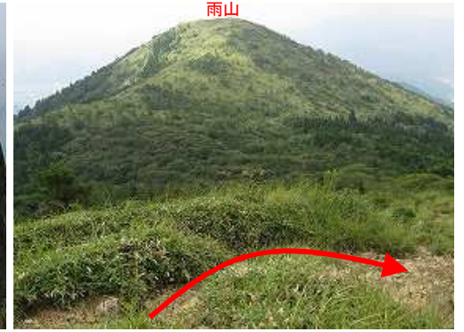
浸食がひどくなった山道を下って行く。