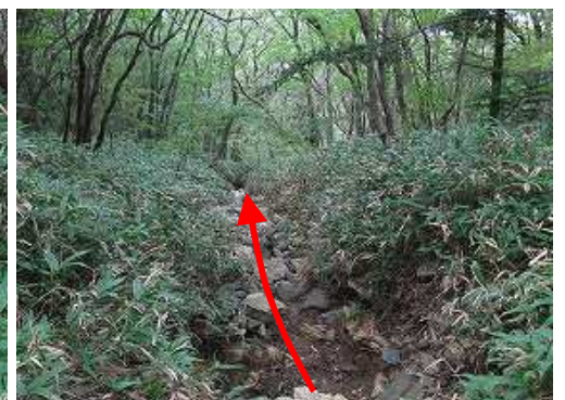
涸れ沢に出会い、これを下る。