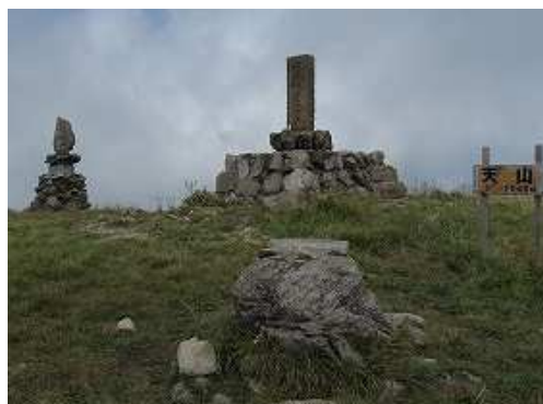
天山(1046m)の山頂には一等三角点が設置され360°の展望が得られる。