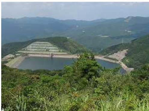
北西下に 天山 ダムを見下ろす。