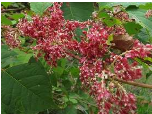
イタドリ (メイゲツソウ)