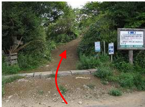
天川駐車場に駐車し、天川登山口から歩き始める。