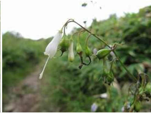
サイヨウシヤジン シロ