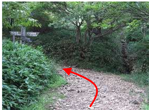
雨山分岐を通過する。