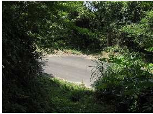
林道まで下り、引き返す。