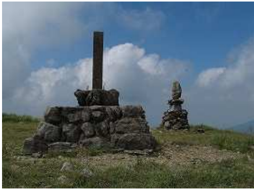
再度、 天山 山頂を踏む。