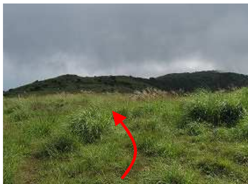
九州自然歩道を東へ道なりに進む。