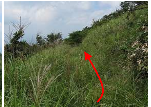
ススキの生い茂る山腹周回路をかき分け進む。