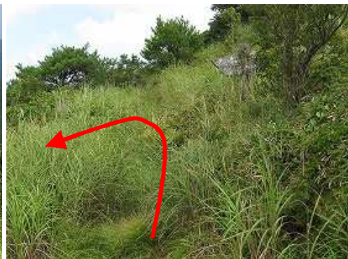
山側に 車道 分岐の案内板を見て左折する。