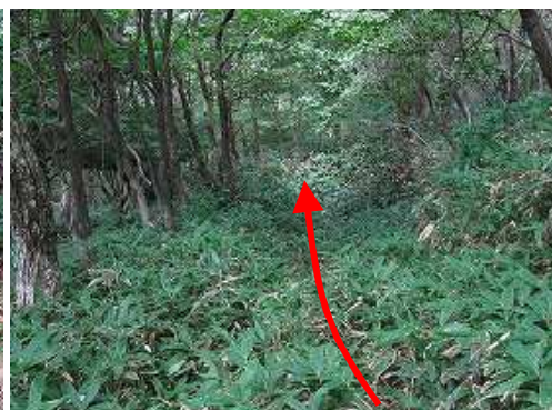
ササを漕いで緩やかに下って行く。