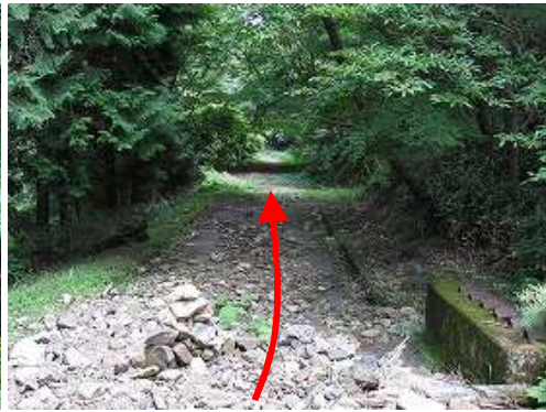
林道を天川駐車場へ向かう。