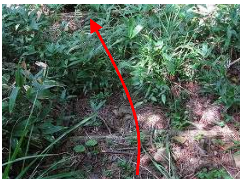
丸太階段が残っている。