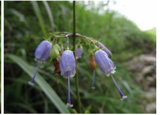
サイヨウシャジン