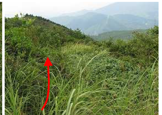
細い踏み跡が残る左折した取付き。