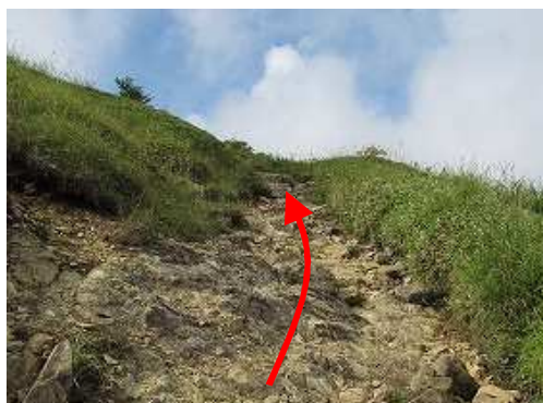
道なりに岩場を緩やかに上って行く。