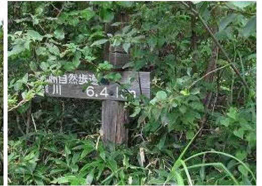
天川 分岐の案内板。