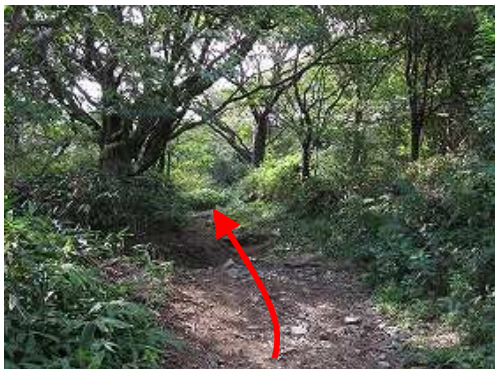
緩やかに上って行く。