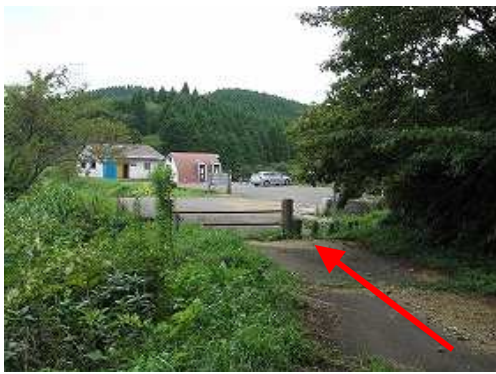
天川駐車場が見えた。