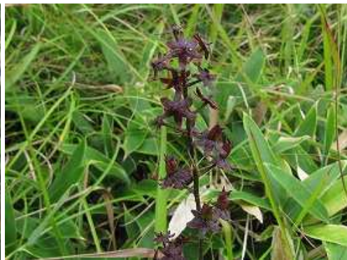
ホソバシュロソウ