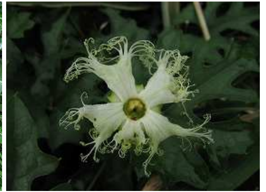
モミジカラスウリ