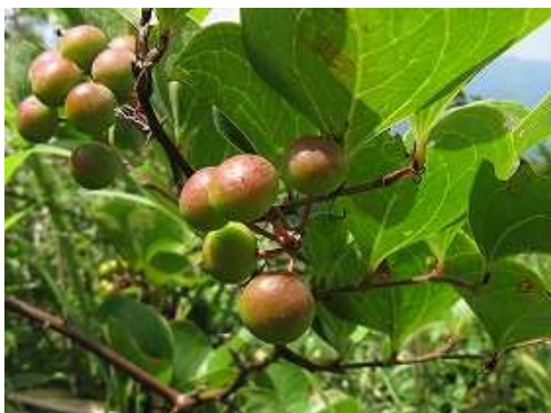
サルトリイバラ 実