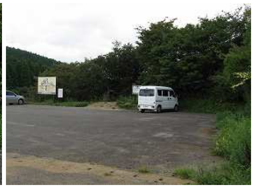
天川駐車場に帰着いた。