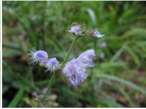
アキノタムラソウ