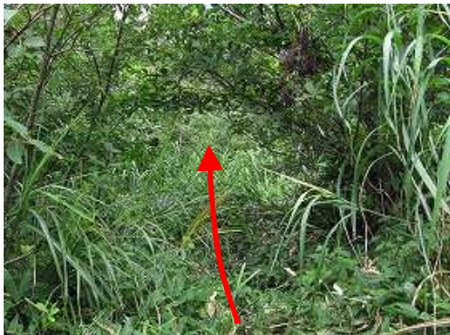
天川 駐車場へ至る山腹周回路は夏草が繁茂している。