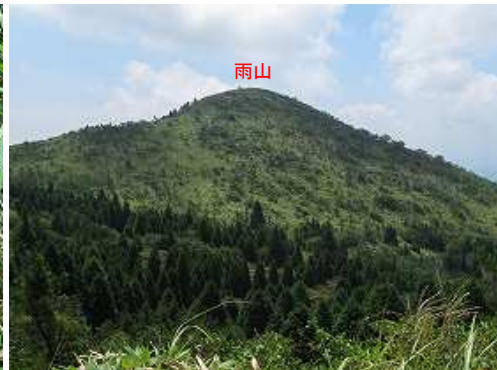
南に 雨山 を望む。