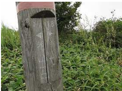
天山1.1kmの標柱を見る。