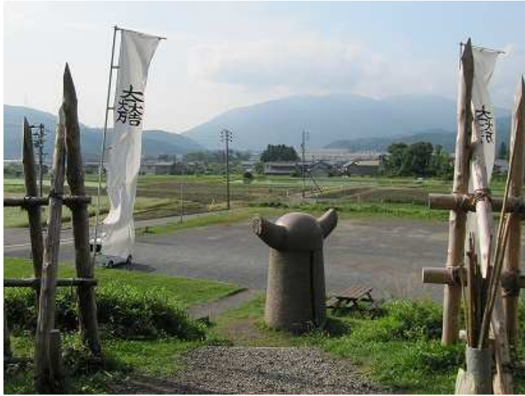
7:28 モニュメントまで下りてきた。