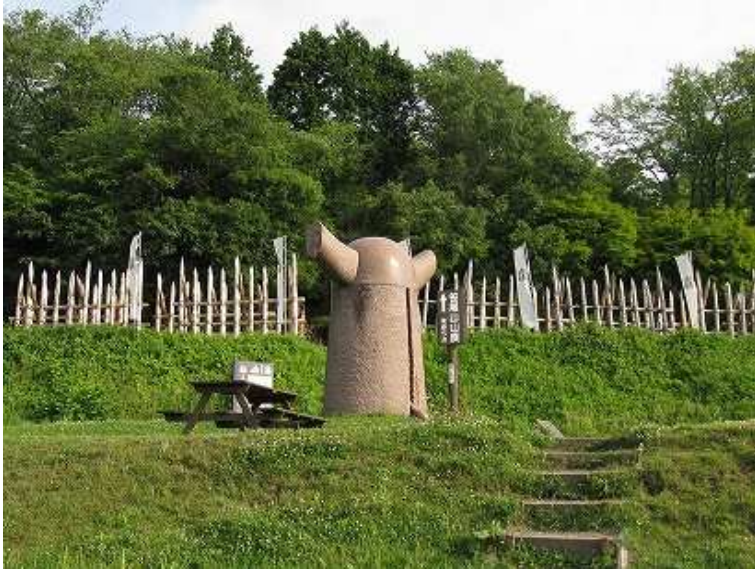
7:03 広い駐車場から兜のモニュメントのある方へ向かう。