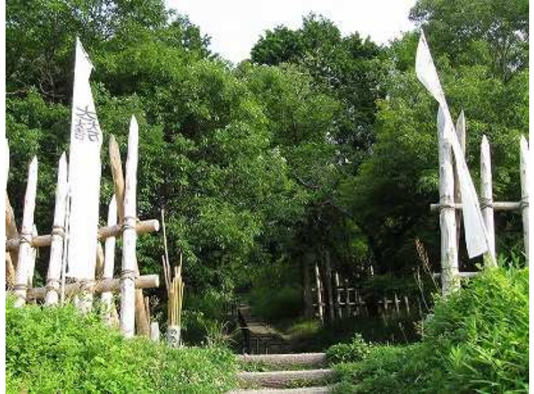
7:04 案内板に目を通し、擬木階段を上って行く。