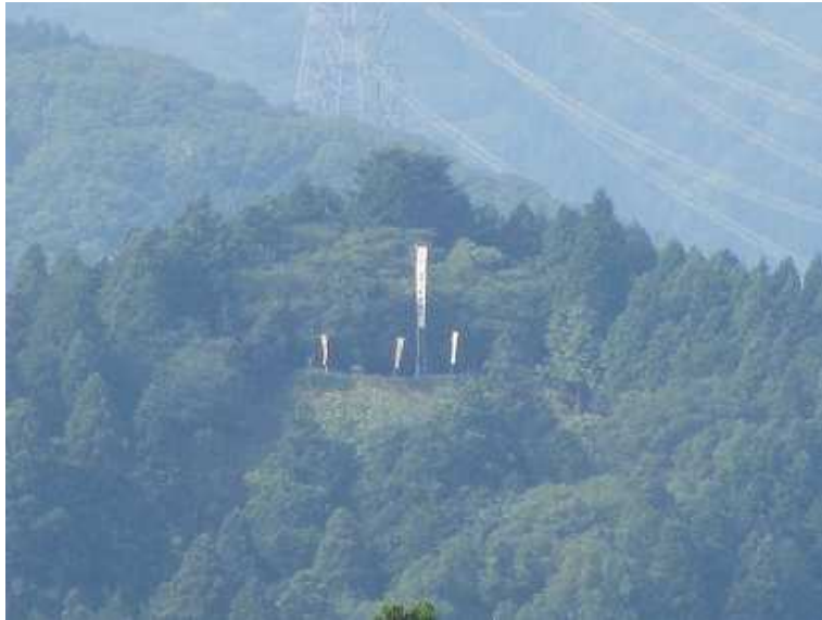
7:41 南の松尾山には小早川秀秋の陣が望まれる。