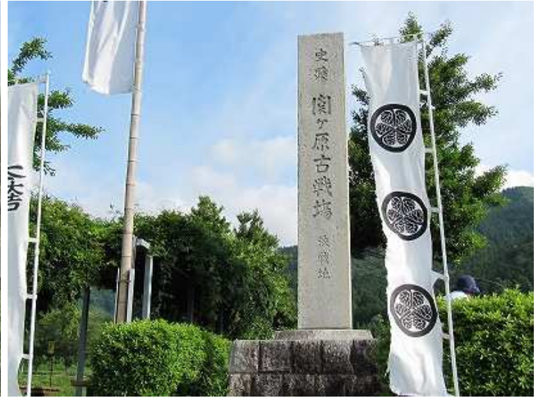
7:39 車で移動し、決戦地の碑を見る。