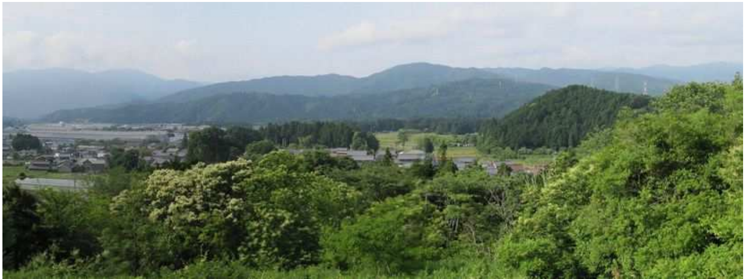
関ヶ原のパノラマ(2)。