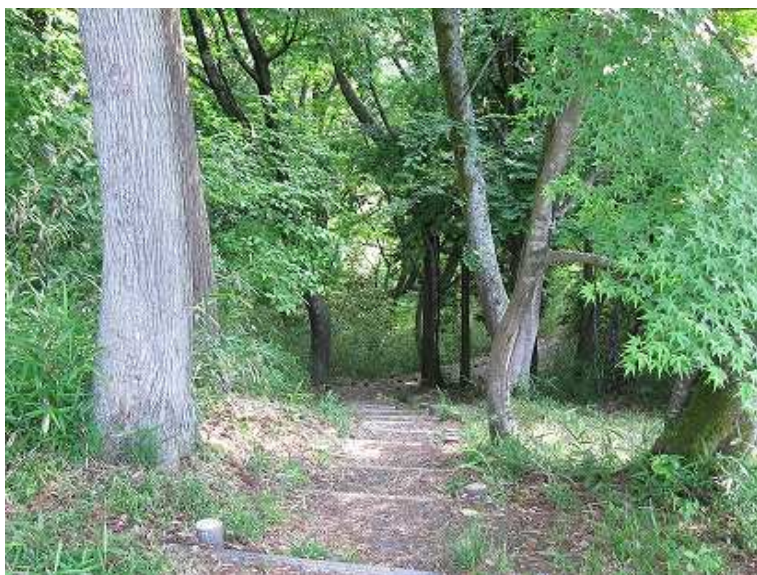
7:20 東側の擬木階段を下る。