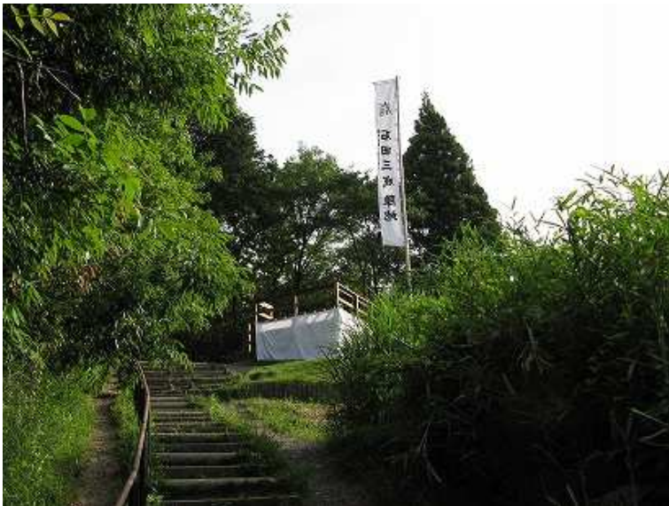
7:07 山頂部の指揮場が見えてきた。