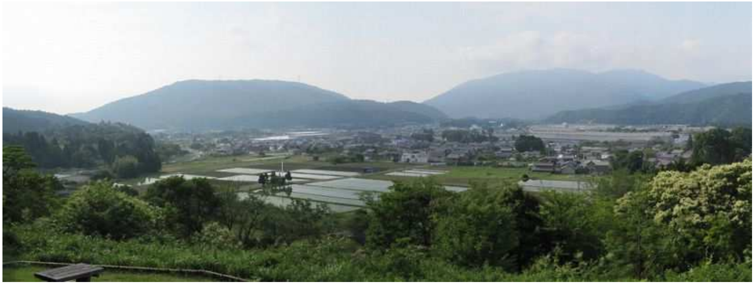
7:16 関ヶ原のパノラマ(1)。