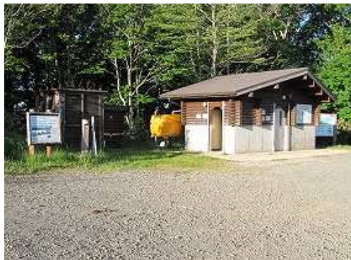
バイクトイレや四阿もある。