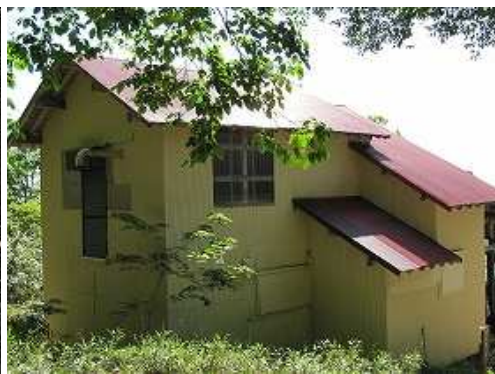
神大ヒュッテを通過。