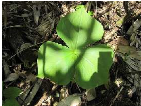
エンレイソウ 花後