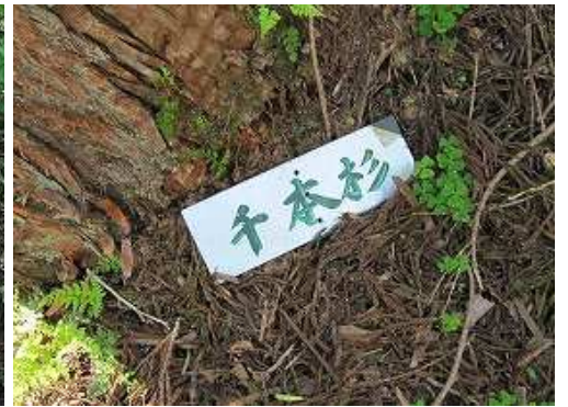
千本杉を見上げて通過する。