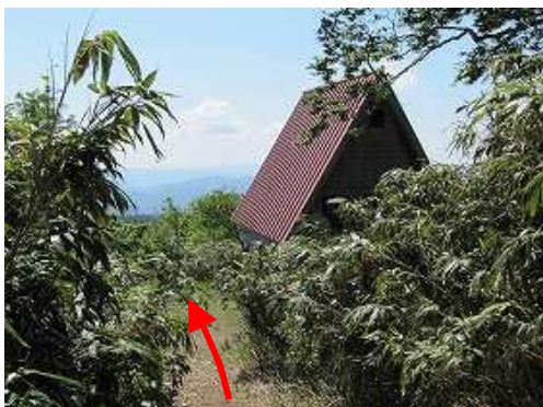
大屋町避難小屋を通過。