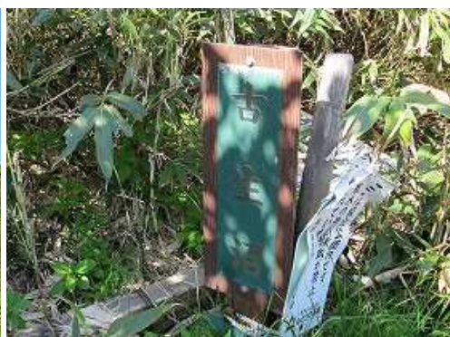
古生沼入口を左に見る。