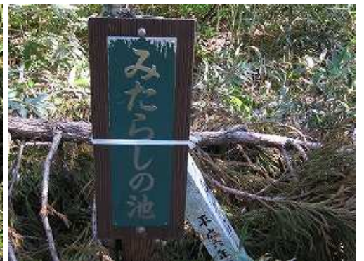
みたらしの池入口を右に見る。