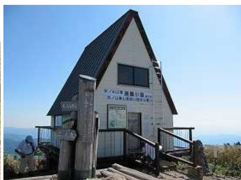
氷ノ山(1510m)の山頂には一等三角点が設置され360°の展望が得られる。避難小屋やトイレもある。