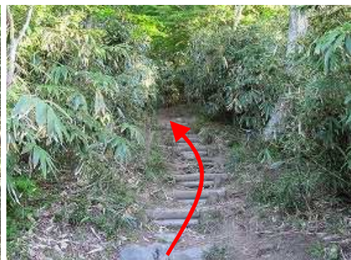
擬木階段を緩く下って行く。