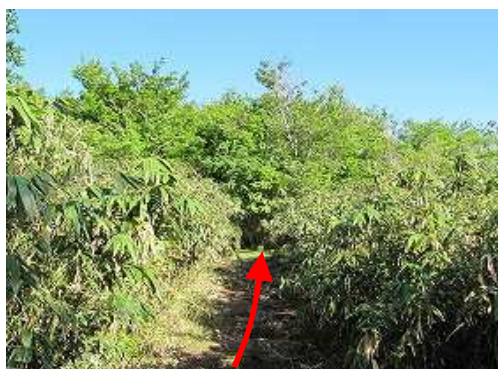
クマザサ帯を抜ける。