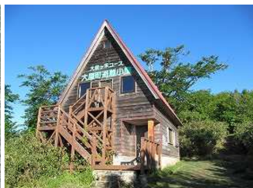
大屋町避難小屋に到着。