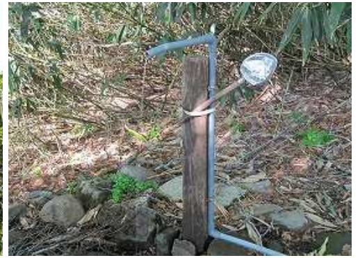
傍には水場もある。