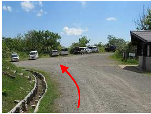
駐車場に帰着いた。