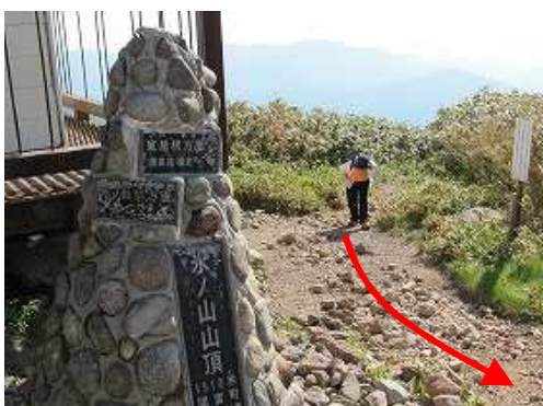
登り来た方を見る。