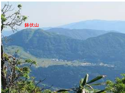
北に鉢伏山(1221m)を望む。