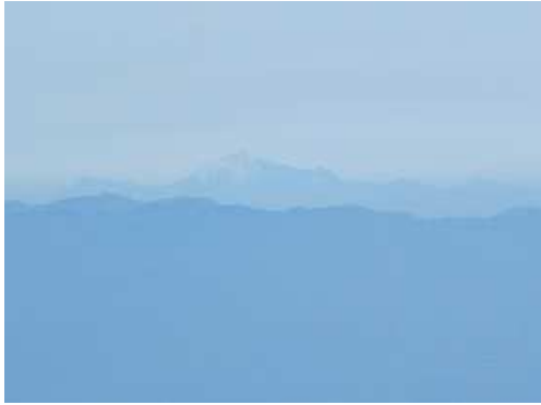
望遠で大山を望む。