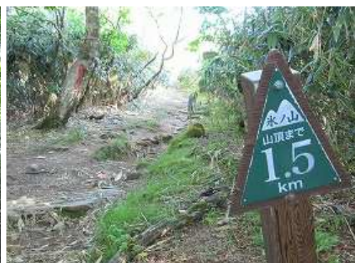
山頂まで1.5kmを通過する。