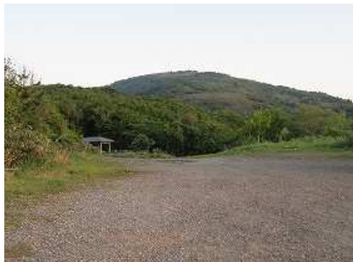
広い駐車場からは氷ノ山が望まれる。