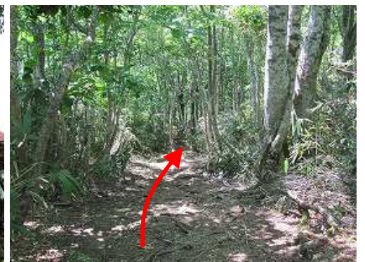
ブナ林を緩やかに下る。