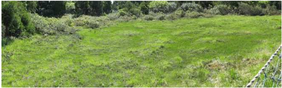
帰路、古生沼に立ち寄るが周囲を網で囲まれ中には入れない。