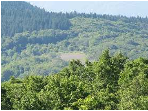
展望地から駐車場が確認できる。