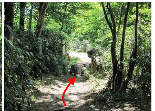
大段ヶ平登山口が見えてきた。