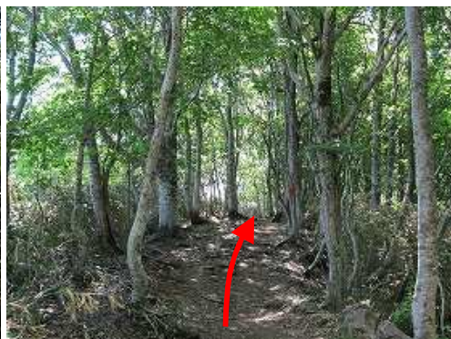
ブナ林の平坦路を行く。