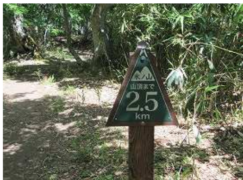
山頂まで2.5kmを通過する。