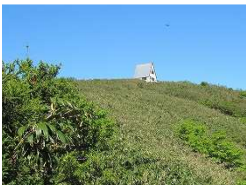
山頂小屋が見えた。