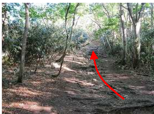
緩やかに上って行く。