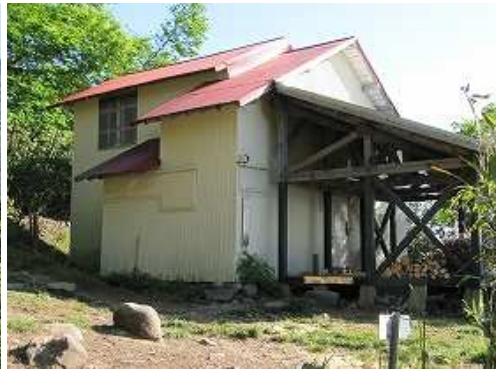
神大ヒュッテに到着。