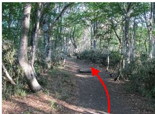
平坦な尾根筋を行く。