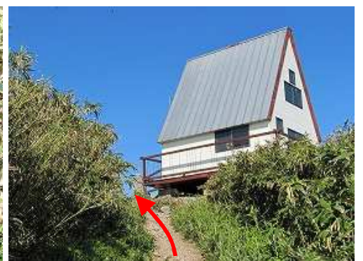
目前に山頂小屋が見えた。