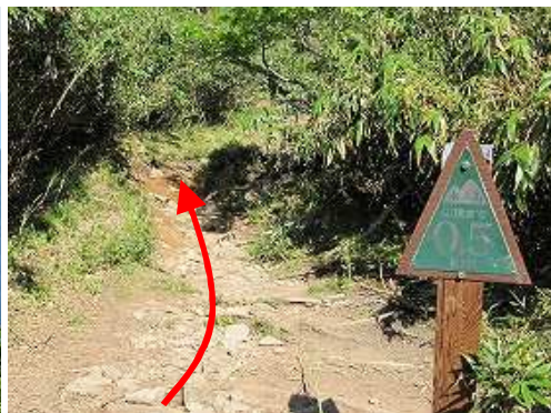
山頂まで0.5kmを通過する。