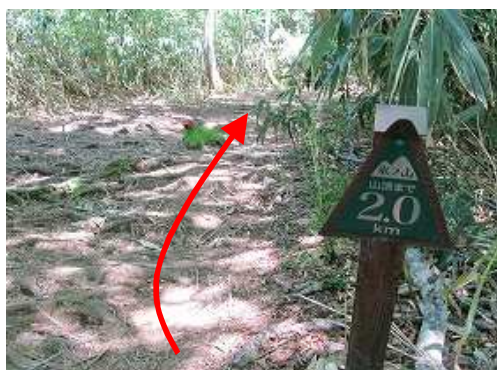
山頂まで2.0kmを通過する。