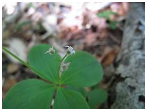
オオバノヨツバムグラ