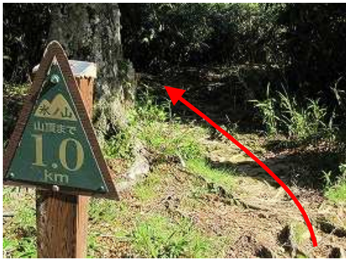
直ぐに山頂まで1.0kmを通過する。