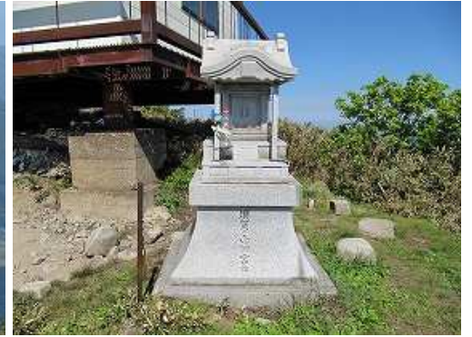
須賀ノ山神宮跡に建つ祠。