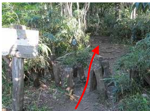
大段ヶ平登山口 案内板を見て木杭を抜ける。傍に山頂まで2.8kmの表示板を見る