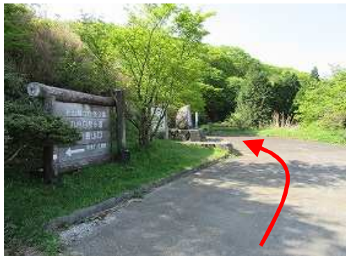
天川駐車場に駐車し、南西方向に歩き始める。