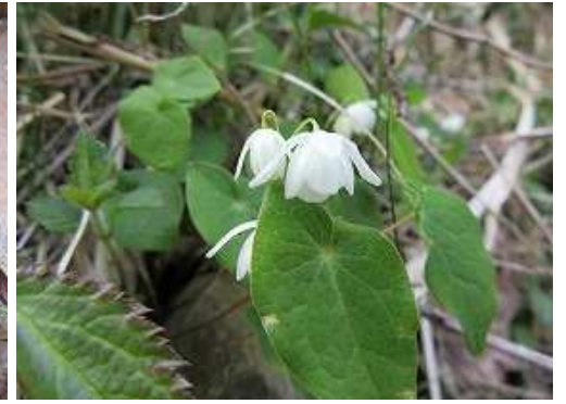
バイカイカリソウ