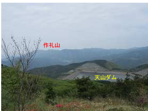
山腹周回路から右の展望。