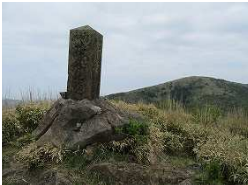
雨山(996m)の山頂に立つ植林記念碑。360°の展望が得られる。