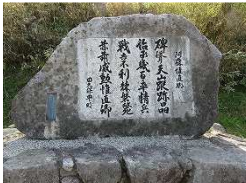
直ぐ左に阿蘇惟直の石碑を見る。その右に判読しにくい説明版が立つ。