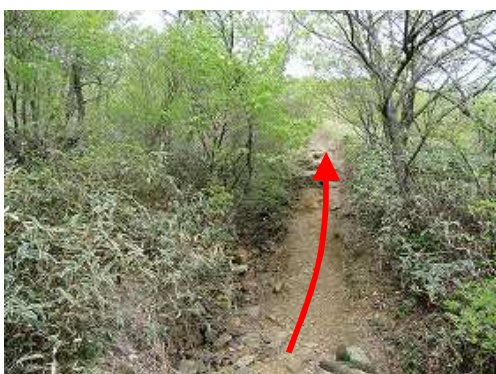
緩やかに上って行く。