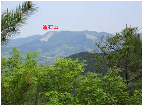
北東に斜上すると北西に通石山が望める。