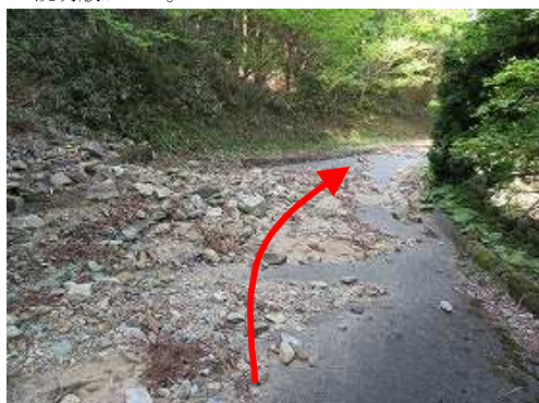
山側からの流出土砂を通過する。