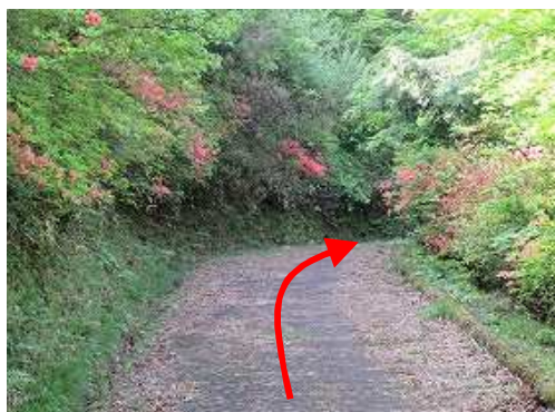
両側にヤマツツジが咲く遊歩道を道なりに行く。