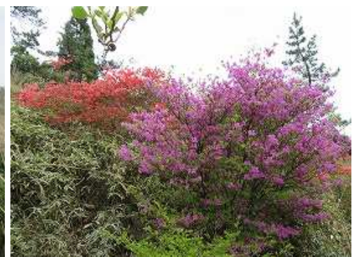
ヤマツツジとミツバツツジのコラボ。