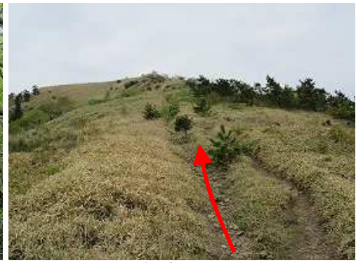
抜けるとササ原となり奥に雨山の山頂が見える。