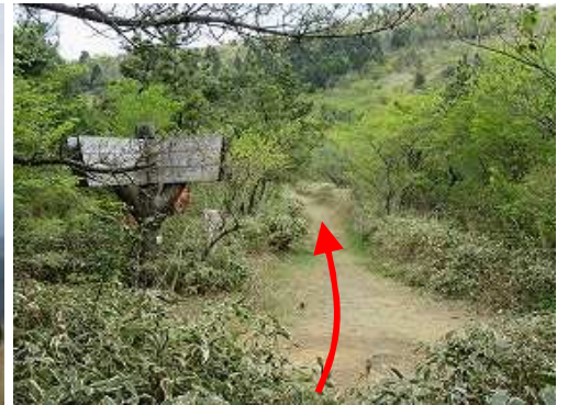
岸川分岐に戻り、直進する。