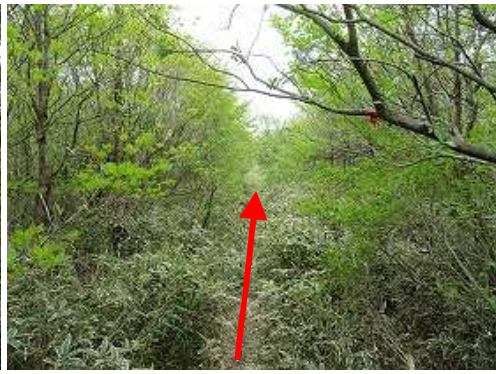
ササを分けて雨山へ向かう。