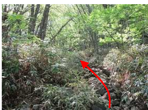
転石の転がる道を緩やかに上って行く。