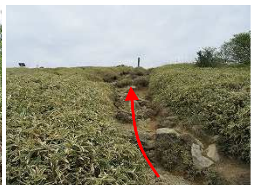
山頂部が見えてきた。