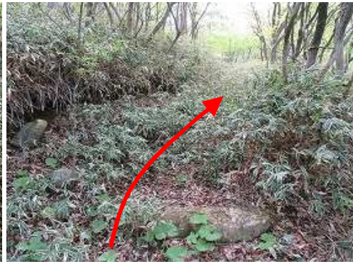
笹の踏み跡には、石段や丸太階段が残っている。