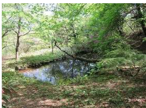
作業小屋の裏手を下った所に池がある。