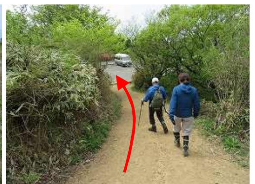
天川ルートを下り天川駐車場に帰着いた