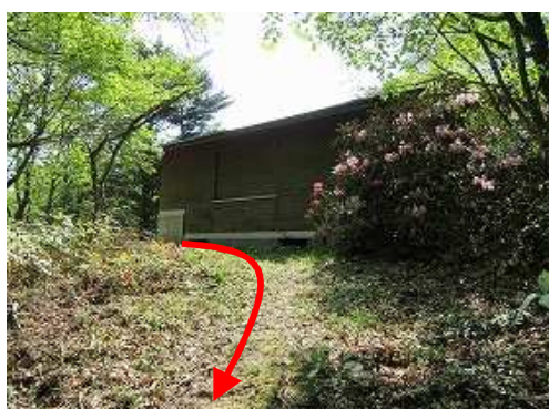
池から作業小屋を見る。