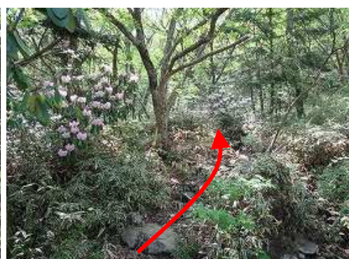
側溝の案内板傍から踏み跡に取付く。