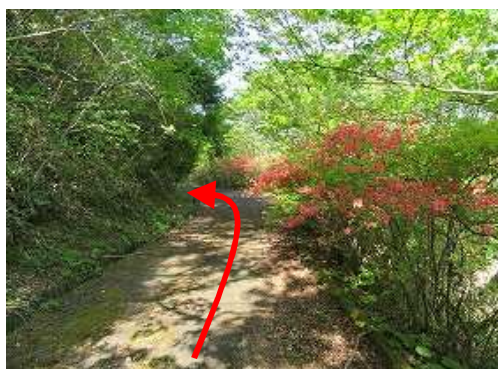
新緑の中、道なりに進む。