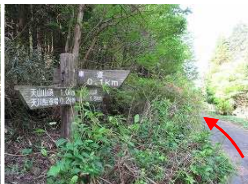
山側に立つ案内板を見るが、車道への取付きは見当たらない。