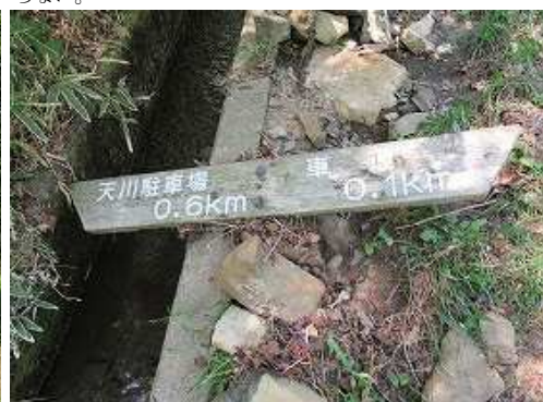
路肩の側溝に案内板を見る。