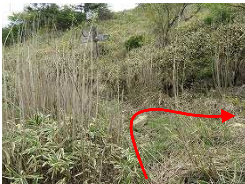
前方に案内板が見えてきた。