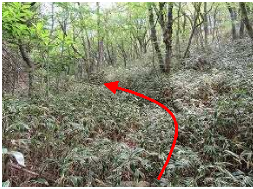
笹に覆われた薄い踏み跡を緩く上って行く。