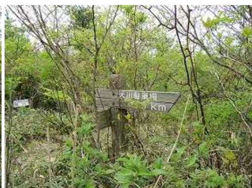
天川分岐に出会い左へ向かう。