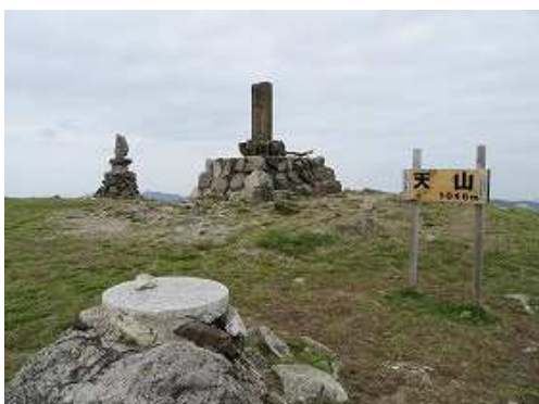
天山(1046m)の山頂には一等三角点が設置され360°の展望が得られる。