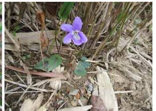
ナガバナタチツボスマレ