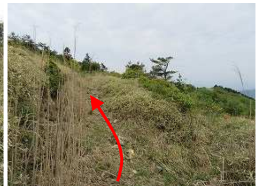
山腹周回路を南西方向へ向かう。