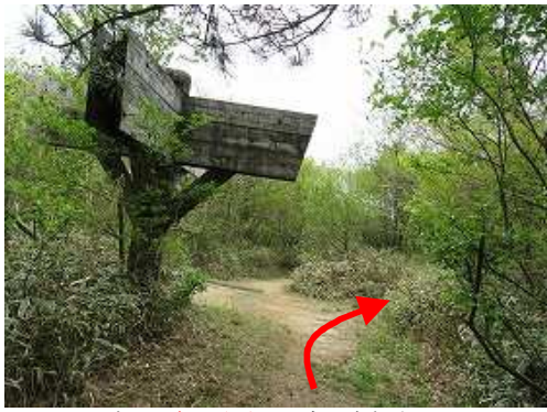
直ぐに岸川分岐に出会い右折する。