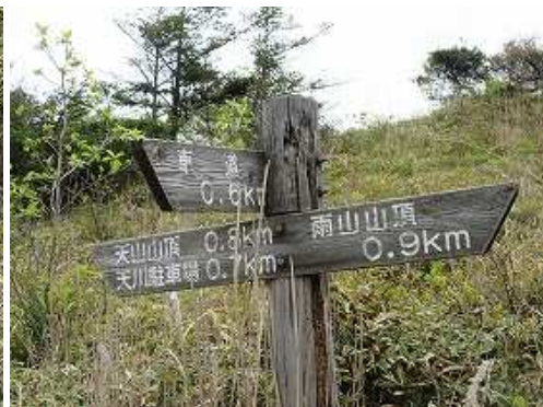
車道分岐のある山腹周回路に出会い右折する。