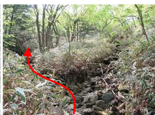
直ぐ先の分岐を左へ向かう。