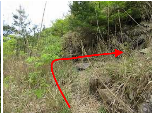
転回して南西方向に斜上する。