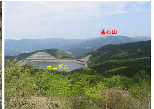
右下に天山ダムを望む。