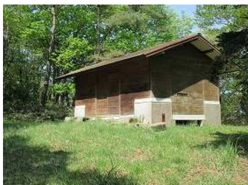
開けた広場に建つ作業小屋に到着。