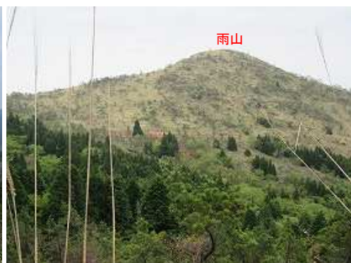
山腹周回路が南東に向かうと南側に雨山が望める。