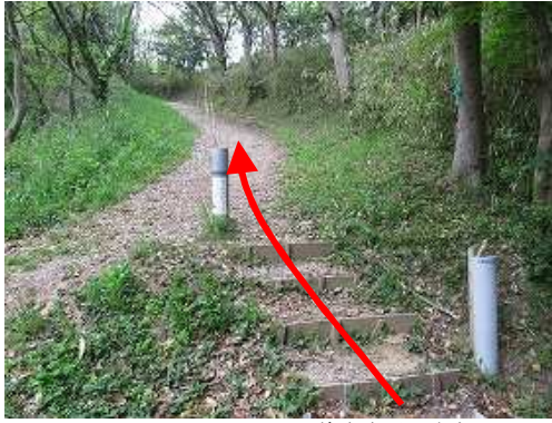
道路路肩に駐車しロマンスケ丘取付から登り始める。