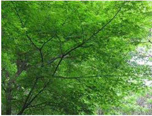
モミジの新緑が美しい。