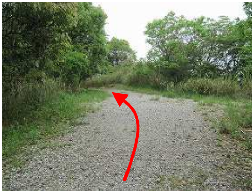
平坦となった遊歩道に行く。