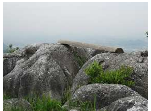
山名板等見当たらないが、此処をロマンスケ丘(255m)の山頂とする。360°の展望が得られる。