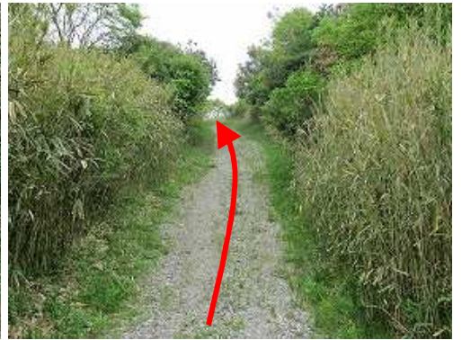
砂利道を緩やかに上り返していく。