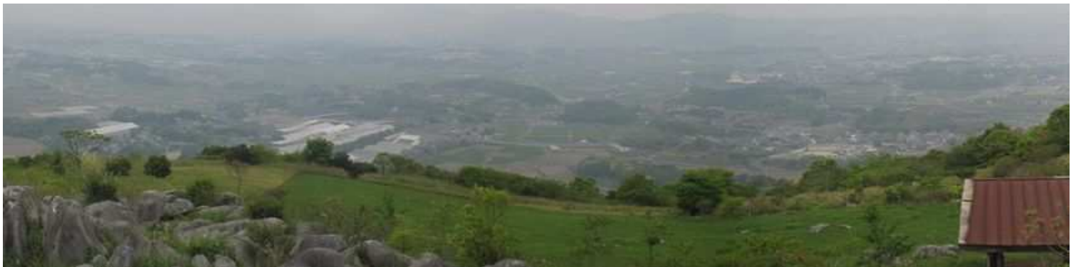
山頂から西の展望。