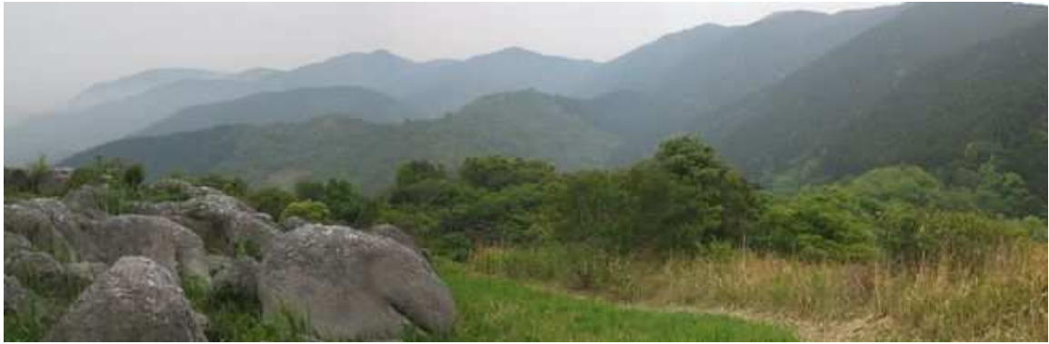
山頂から北に福智山系の山並みを望む。