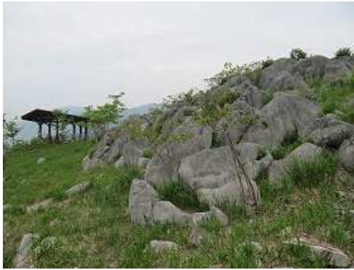
南端部から東屋を望む。