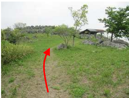
前方に草付斜面が広がり、山頂部には石灰岩が羊群原となって広がる。