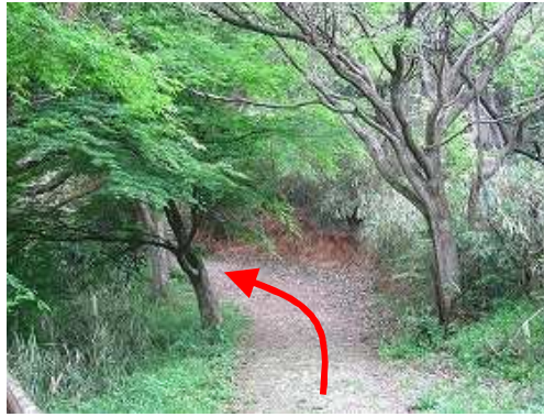
道なりに緩やかに上って行く。