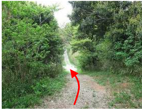
緩やかな砂利の下りが現れる。