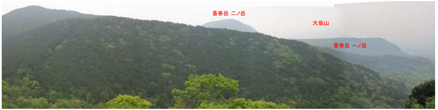
山頂から南の展望。