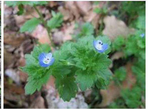
オオイヌノフグリ