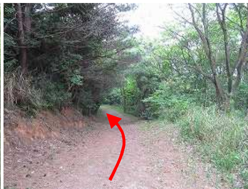
道なりに遊歩道を緩やかに下って行く。