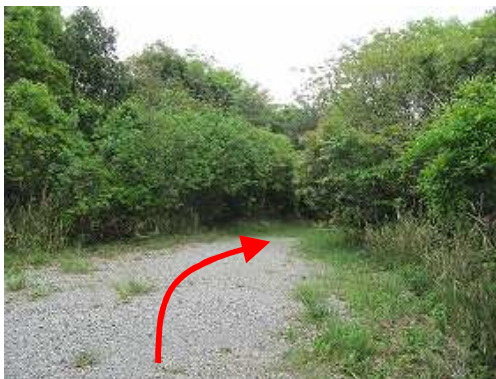
砂利の平坦路を行く。