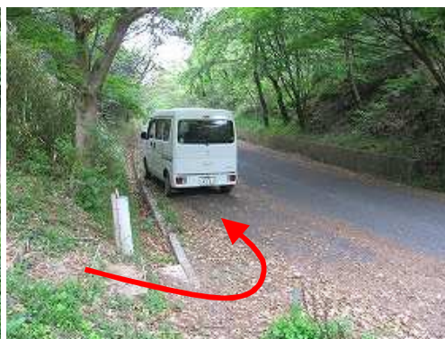
登山口のすぐ横が駐車地。