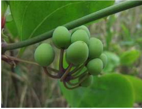
サルトリイバラ 実