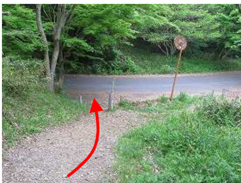
ロマンスヶ丘取付が見えてきた。