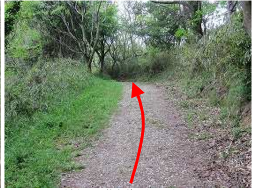
緩やかに遊歩道を上って行く。