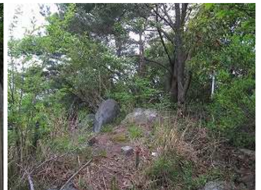
山頂なのか？杭がある。