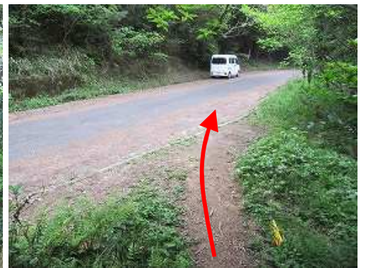
磁石山登山口へ戻る。奥が駐車地。