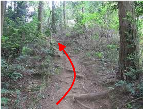
ヒノキの植林をひと上りする。