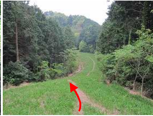
奥に磁石山を望み、草付の防火帯を西に向かう。