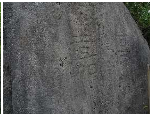
左の岩に文字が彫ってある。