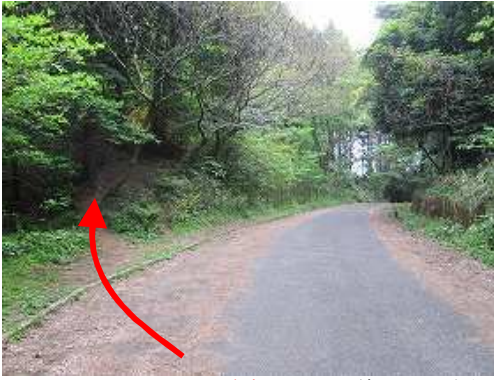
駐車地から少し峠へ戻ると左側に磁石山登山口の案内板を見る。