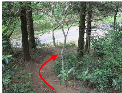
ヒノキの植林帯を下る。