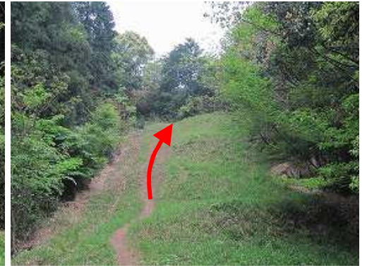
緩やかに草付防火帯を登り上がる。