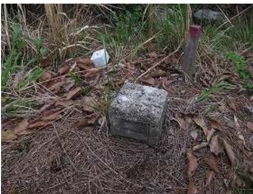
杭を磁石山(317m)の山頂とする。