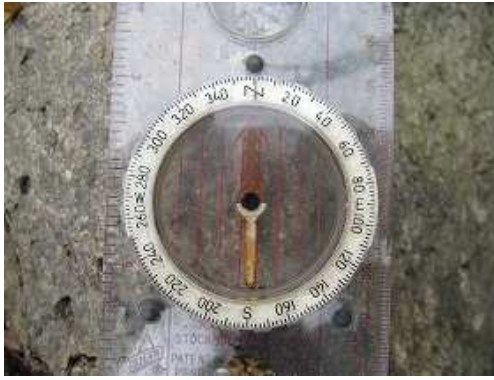
ちなみに方位磁石を置いてみたが変化なし。