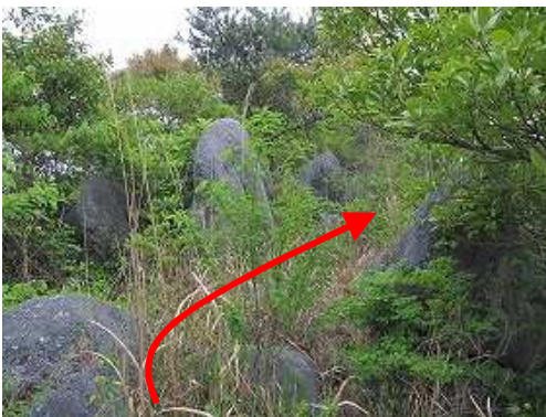
尾根筋の露岩を縫う。