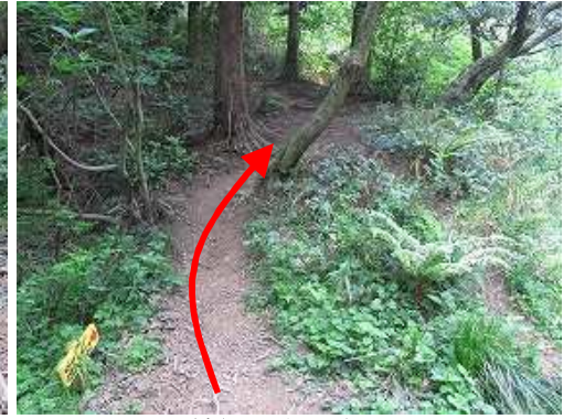
緩やかに上って行く。