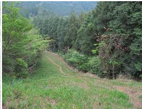
草付防火帯に出る。