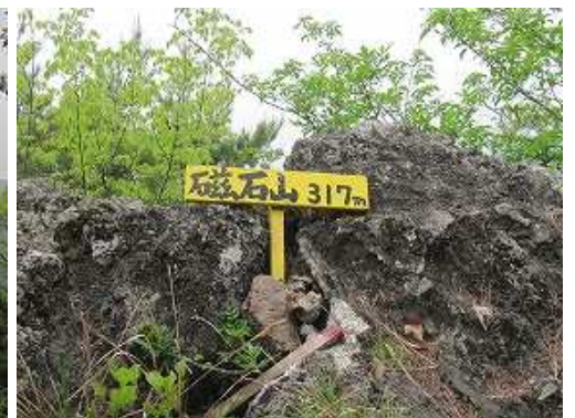
尾根筋を西へ向かうと露岩に山名板を見る。