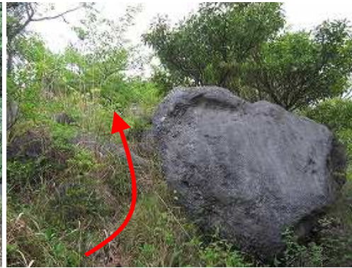
この岩が尾根筋への分岐で傍に案内板がある。