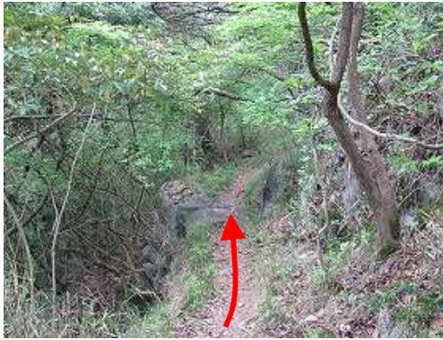
尾根筋の裾を東へ向かう。