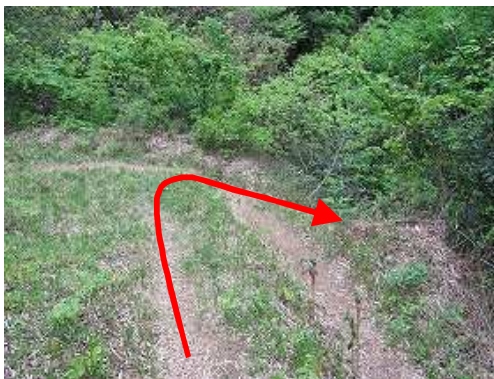
右折して植林に入る。