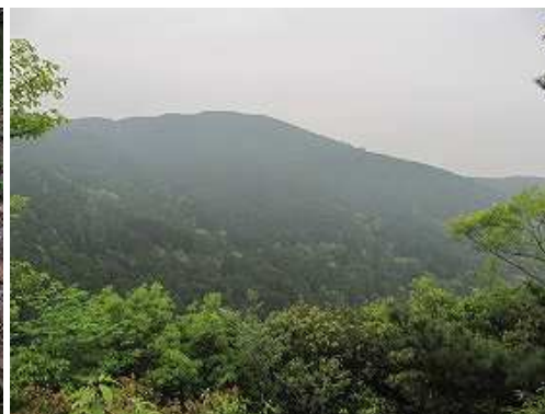
杭の南側に展望岩があり南東の山並みが望まれる。