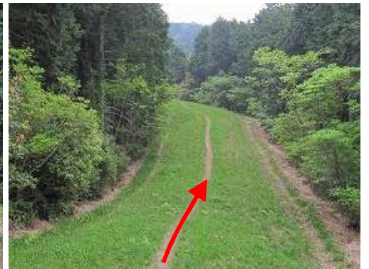
草付防火帯を緩く下る。