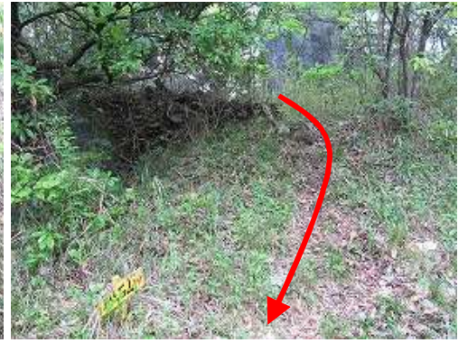
磁石山への案内板へ降りてきた。