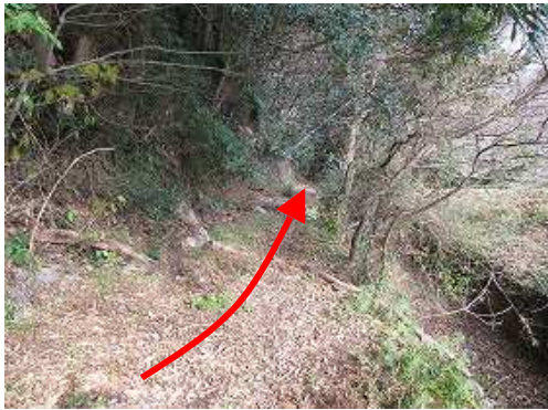
土手の突き当たりが古路入口で此処を下る。