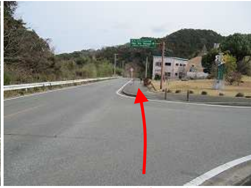
クリーンパークわかすぎを通過する。