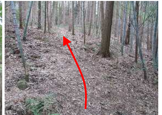
竹とヒノキの混成帯を緩く上って行く。