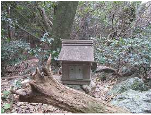
尾根筋に安置された祠を見る。