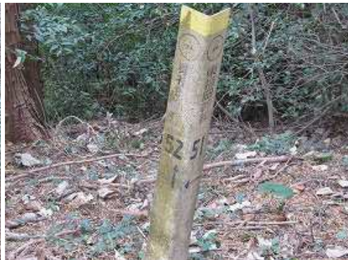
鉄塔52分岐を右に見る。