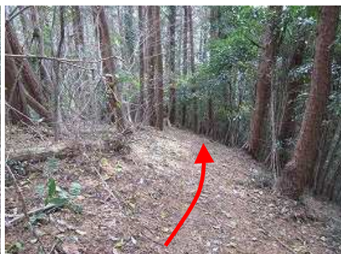
尾根筋に沿って緩く下って行く。