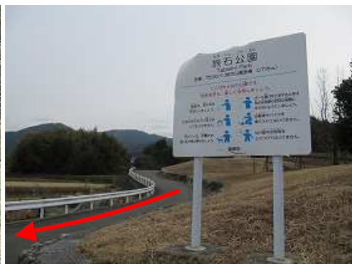
旅石公園を通過する。