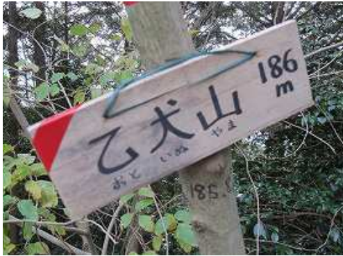
乙犬山(186m)の山頂には四等三角点が設置されているが、周囲を樹木に遮られ展望は得られない。