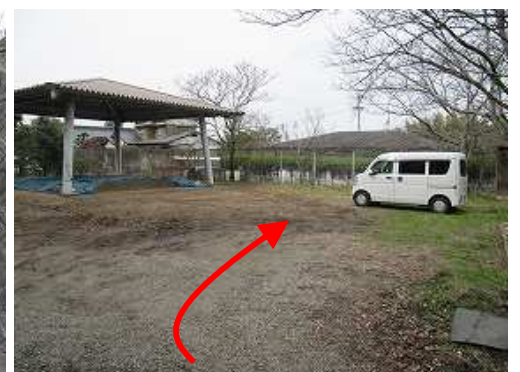
相撲場Pに帰り着いた。