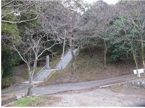
相撲場の空き地に駐車し、乙犬八幡宮の石段を上って行く。