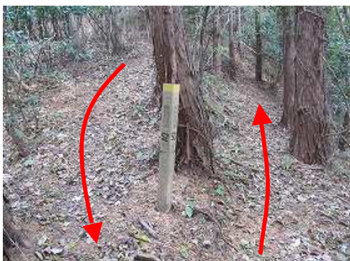
鉄塔51分岐の杭を見る。Uターンするように右へ向かう。