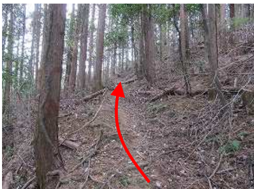
尾根筋を左に回り込むように斜上する。