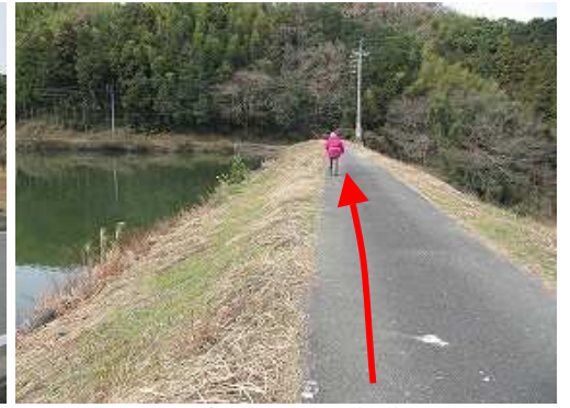
切通池の土手を西へ向かう。