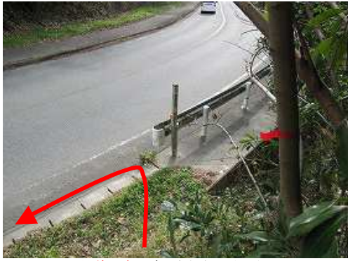
県道出合に降り立ち左へ向かう。