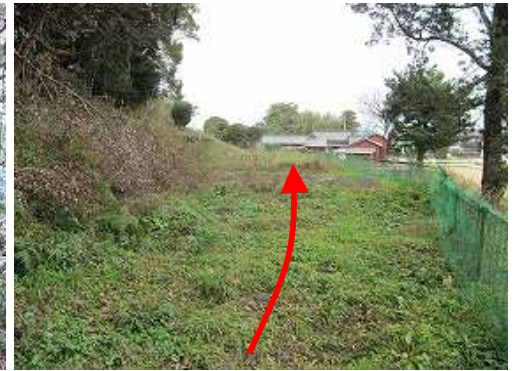
草付平地を通過する。