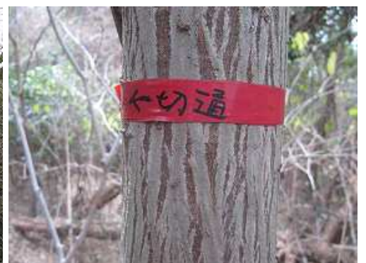
切通の案内を見る。