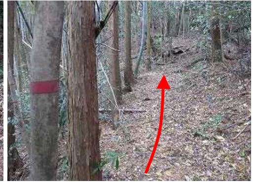
赤テープを追いながら緩やかに上って行く。