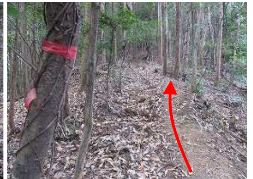
尾根筋に沿って赤テープを拾って行く。