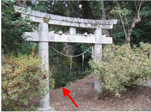
左手の鳥居をくぐり石段を降り、右の踏み跡へ入る。