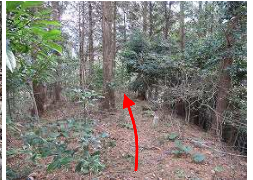
南東に伸びる尾根筋に踏み跡が伸びている。