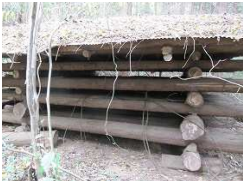
集材地を通過する。