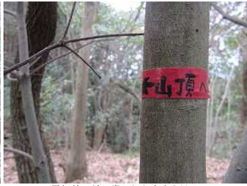
尾根筋の幹に巻かれた案内を見る。