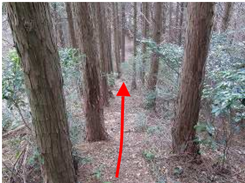
ヒノキの植林帯を降る。