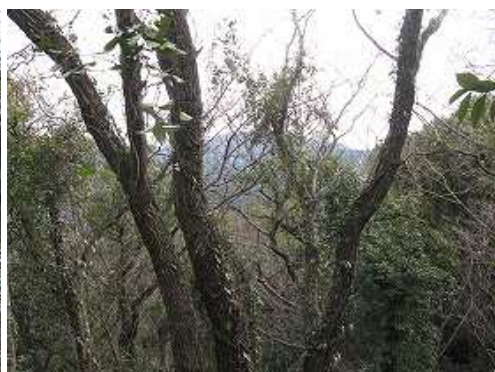
弱いピークから幹越しに若杉山方面の山並みを見る。