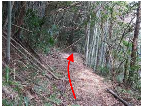
古路は一部歩きにくいヤブがある。