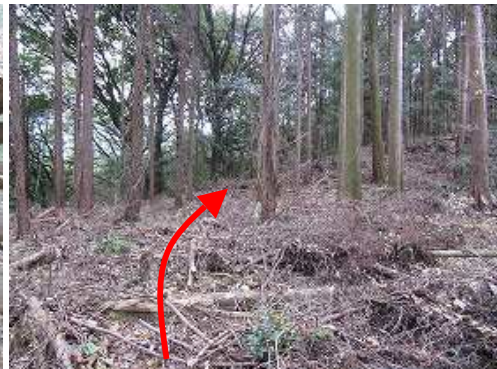
下草が刈られた植林帯を東端に抜ける。