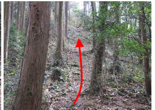
緩く尾根筋を登り返す。