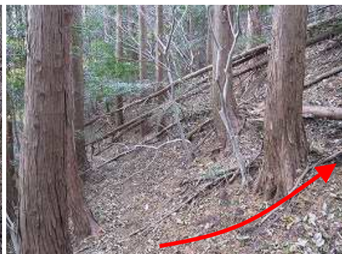
此処から右斜面を上る。