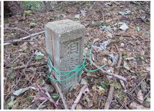
尾根筋の境界杭を追って行く。