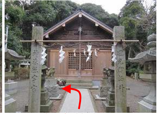
乙犬八幡宮に参拝し左へ向かう。