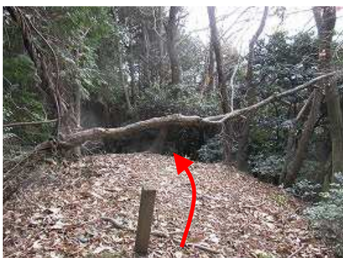
展望のないピークを越える。