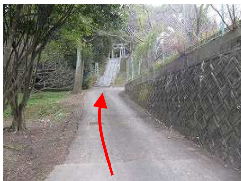
乙犬八幡宮の石段が見えて来た。