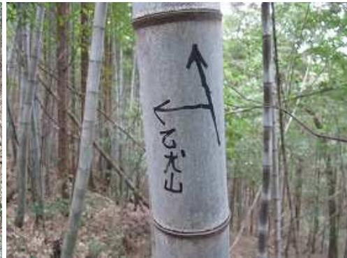
竹に書かれた案内を見る。