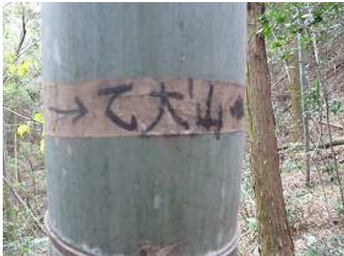
竹に巻かれたテープの案内を見る。