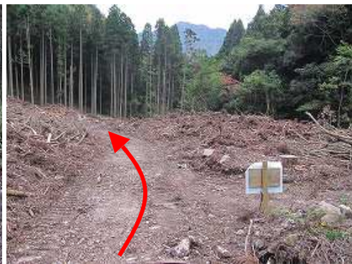
伐採地の古峠分岐を通過する。