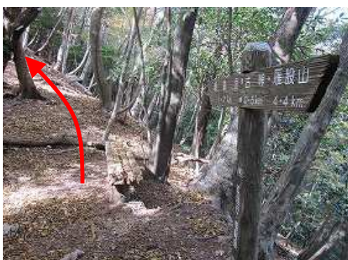
自然歩道は東に下るが、県境尾根に踏み込む。 ※これより先は熟達者の領域です。