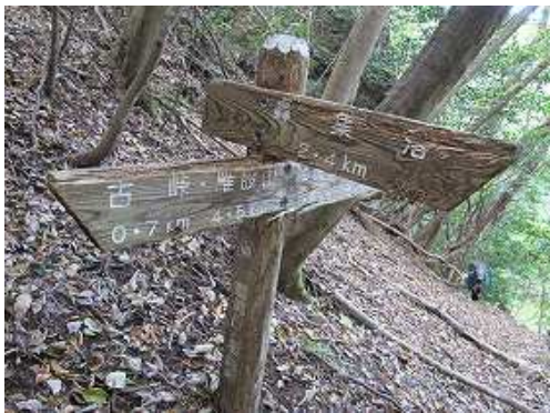
轟分岐の案内板に出会う。