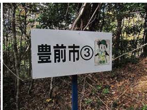
豊前市③の案内板を見る。