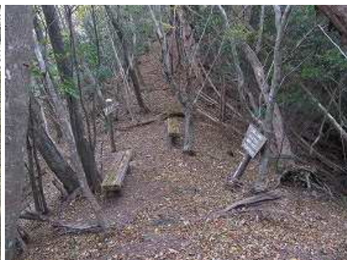
尾根ベンチに出る。