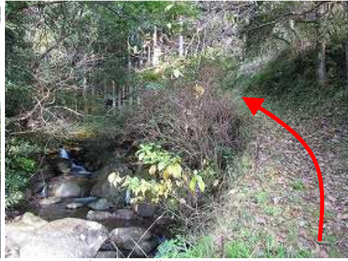
橋を渡り左岸に沿って進む。本来の取付きは橋を渡って30m左折。