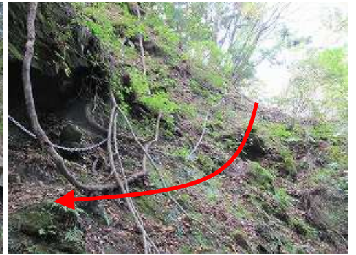
滑り易い岩壁の鎖4を慎重に降る。