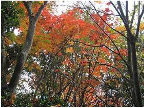
尾根筋のカエデの紅葉。