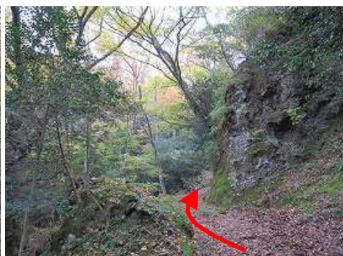
作業路を緩く上って行く。