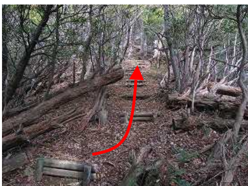
丸太階段を緩やかに上って行く。