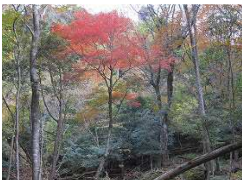
紅葉したモミジを眺めながら緩やかに上って行く。