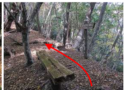
尾根ベンチに到着。