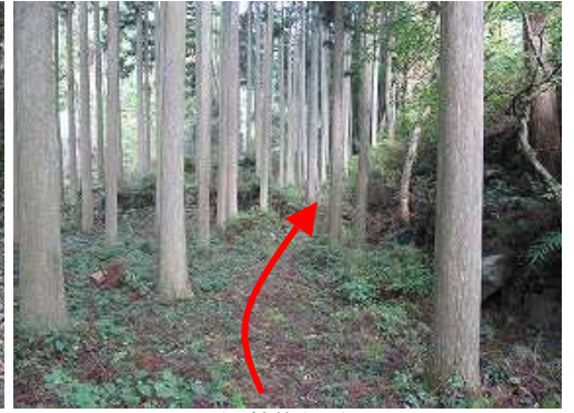
スギの植林帯に行く。