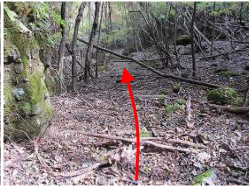
荒れた自然歩道を探しながら進む。