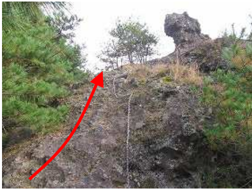
展望岩1の鎖を上り返す。