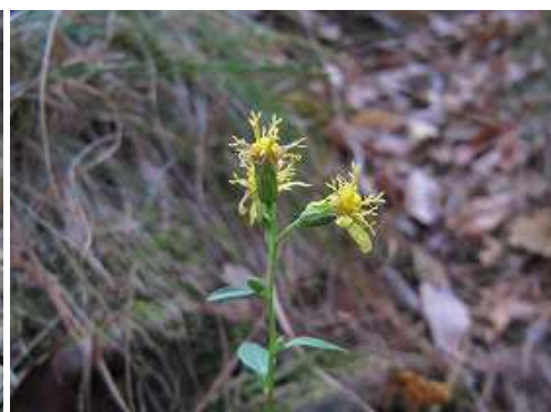
アキノキリンソウ