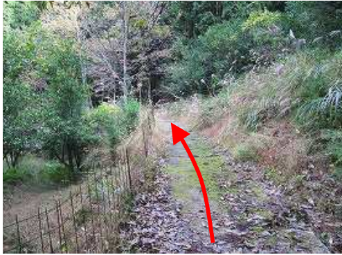
東へミカン畑を抜け正規のルートに出会う。