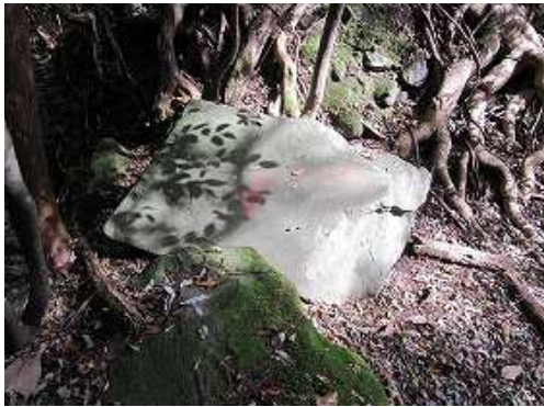
自然歩道に合流する。