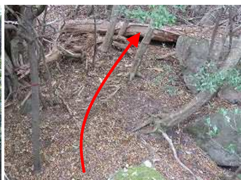
最後に見た赤テープ。