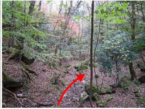
色付いた弱い沢を緩やかに下って行く。