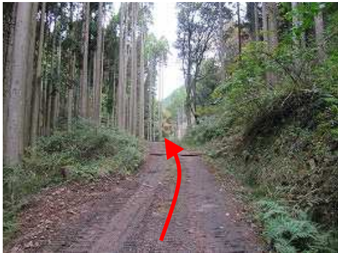
林道を緩やかに上って行く。