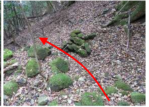
右に炭焼窯跡を見る。