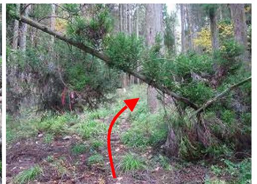
尾根筋分岐を左に見て直進する。