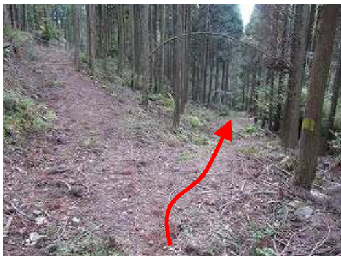
作業路を下って行く。