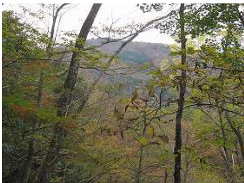
樹間に経読岳を望む。