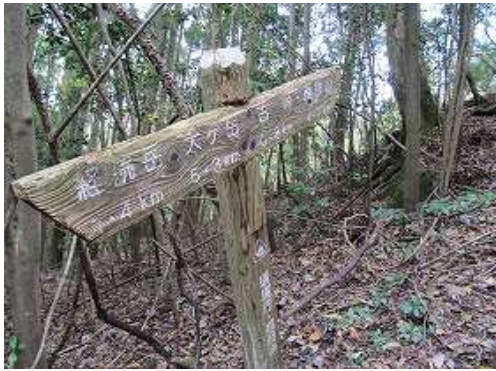
左に朽ちかけた案内板を見る。