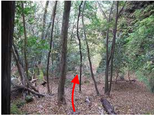
此处までから東側の涸れ谷に下る。