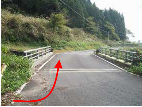
小屋ノ原駐車地に駐車し、杰木橋へ戻る。

小屋ノ原駐車地～林道合流～古峠分岐～古峠～尾根ベンチ～ 此处まで ～自然歩道合流～轟分岐～尾根ベンチ～古峠～古峠分岐～小屋ノ原駐車地