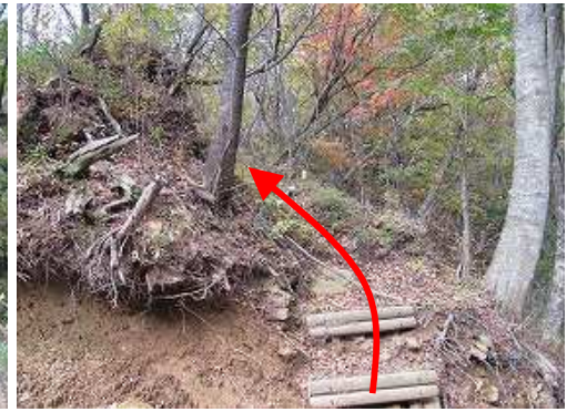
北側の丸太階段を上り尾根筋の自然歩道に行く。