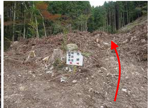
古峠分岐の案内板を見て右へ向かう。