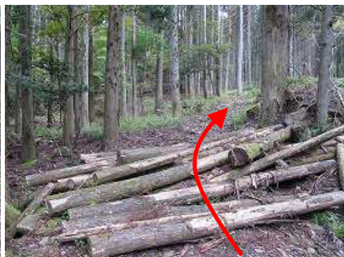
作業路を緩やかに上って行く。