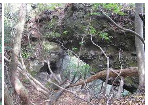
洞岩を見る。尾根筋西側の獣道を辿る