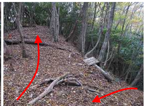
左の尾根筋に登り、右から戻って来た。