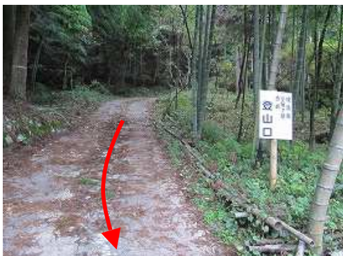
林道の入口に立つ案内板。