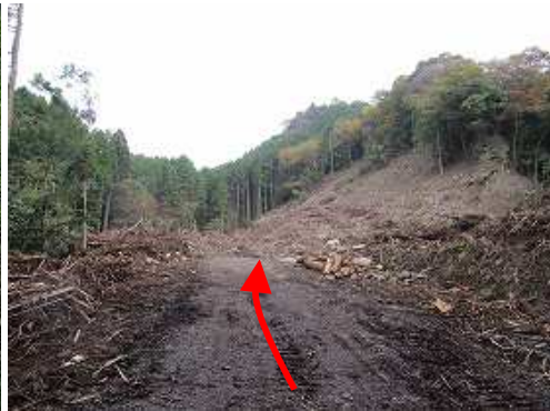
伐採地が前面に広がる。