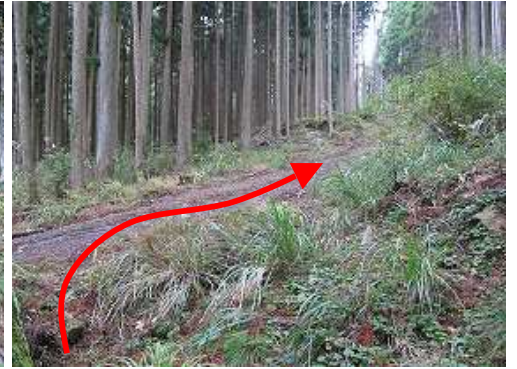
道なりに進み林道に合流し、右へ向かう。