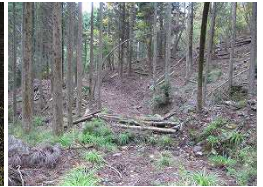
尾根筋分岐を右に見る。