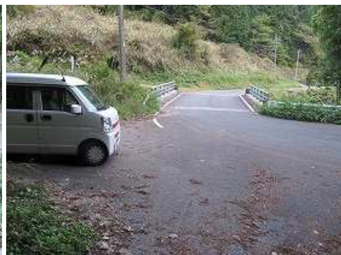
小屋ノ原駐車地に帰り着いた。