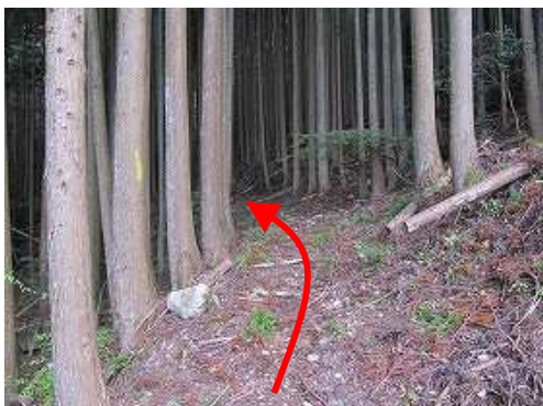
スギの植林帯に入る。