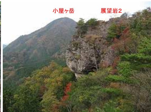
展望岩1から展望岩2と小屋ヶ岳(991m)を望む。