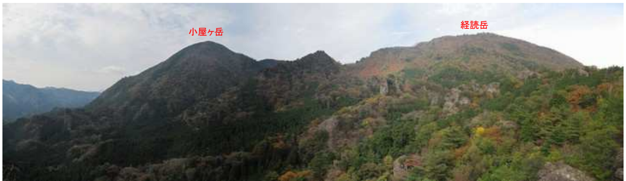
展望岩2から小屋ヶ岳(991m)と経読岳(992m)を望む。