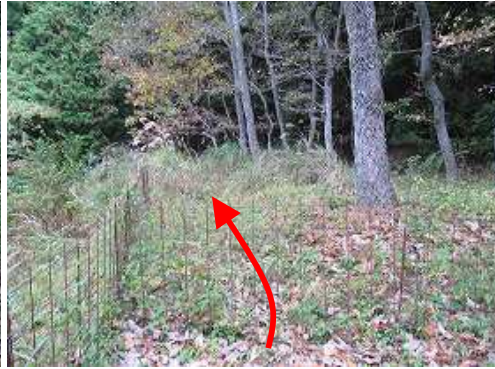
金網ゲートを抜ける。