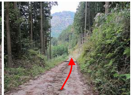
林道を緩やかに下って行く。