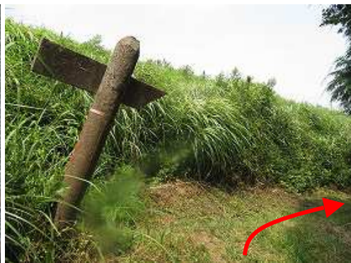
引返し、史跡コース分岐を右に向かう。