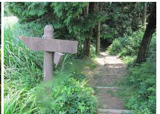
北帝門跡分岐の案内板で引き返す。