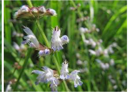
アキノタムラソウ