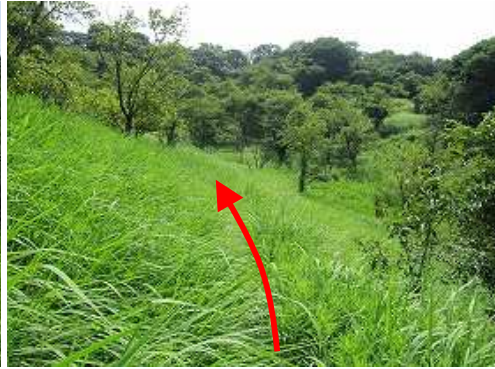
四阿屋分岐から草を分けて行く。