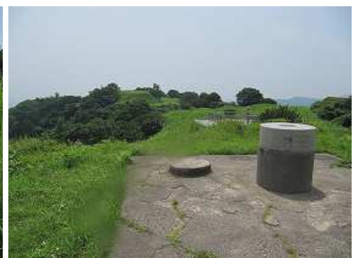
展望台から山頂方面を望む。