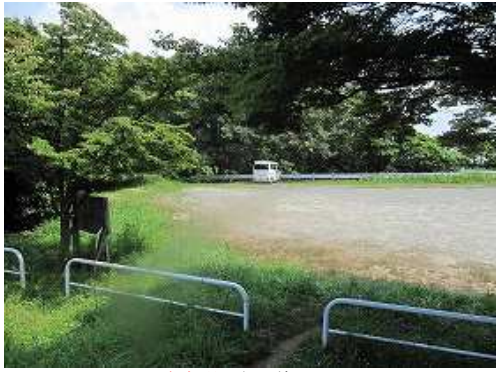
駐車場に帰り着いた。