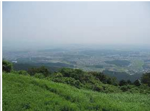
休息所から東(甘木方面)を望む。