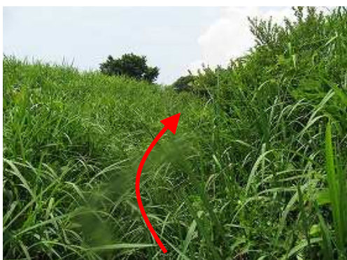
草付斜面を分けて行く。