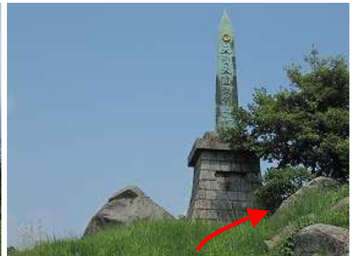
引返し、天智天皇欽迎之碑の脇を抜ける。