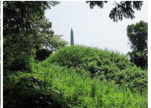
前方が開け天智天皇欽迎之碑が見えた。