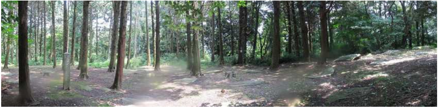
大礎石のパノラマ。