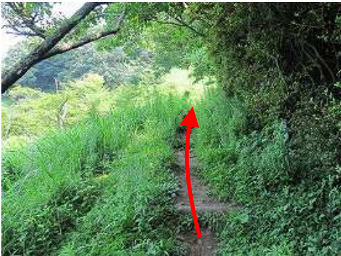
擬木階段を緩やかに上って行く。