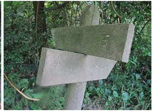
大礎石入口の案内板を見る。