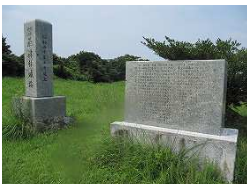
基肆城跡石碑を通過する。