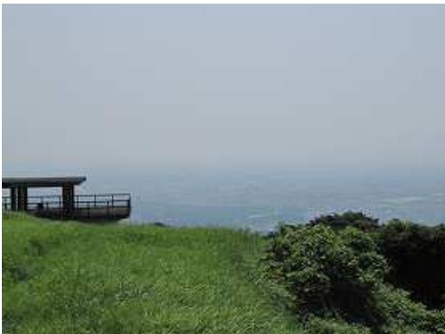
東休息所へ立ち寄る。