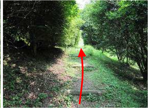
擬木階段を緩やかに上って行く。