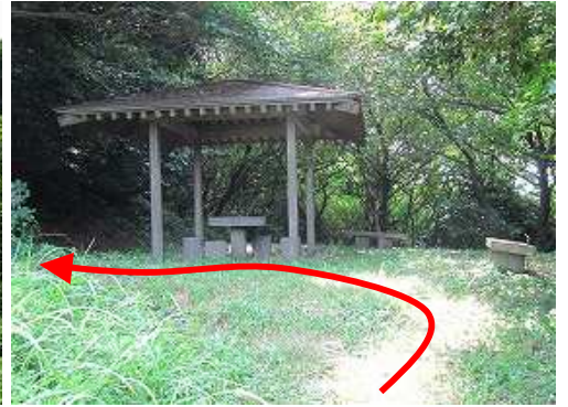
四阿屋に到着。左へ向かう。