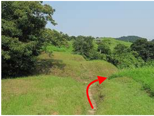
いものがんぎを通り抜ける。