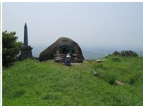
壺々石と天智天皇欽迎之碑を振り返る。