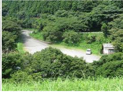
緩やかな草付斜面を行くと、左下に駐車場を望む。