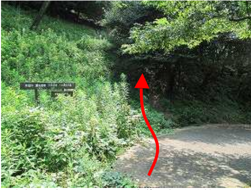
駐車場に車を止め、きのくに古道の脇から取付く。

駐車場～四阿屋～東休息所～ 基山(404m) ～大礎石～北帝門跡分岐～西休息所～駐車場