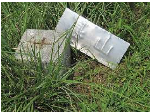
基山(404m)の山頂には一等三角点:防住山が設置されており360°の展望が得られる。