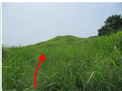
土塁線の尾根に行く。