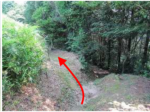
史跡コース分岐を左へ向かう。