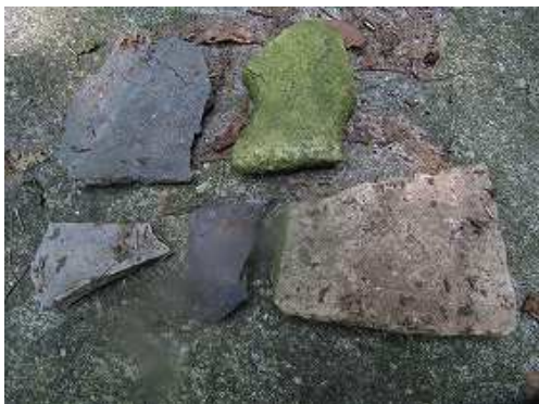
瓦片や土器片を見ることが出来る。