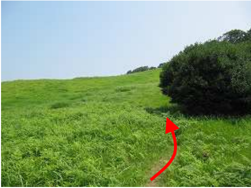
草スキー場斜面の右端に行く。