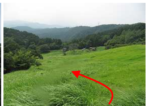
草スキー場の端を下る。