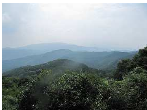
西の九千部山方面を望む。