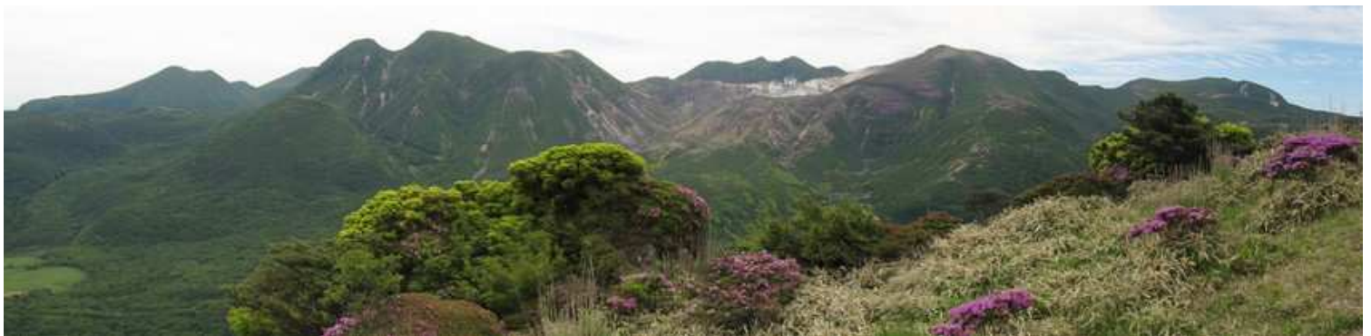
上泉水山手前から望むくじゅう連山。