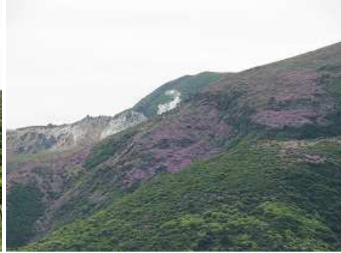
振り返ると星生尾根の斜面はミヤマキリシマに彩られている。