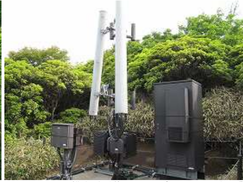
ソフトバンクの携帯電話基地局に出会い、アセビ帯を漕ぐ。