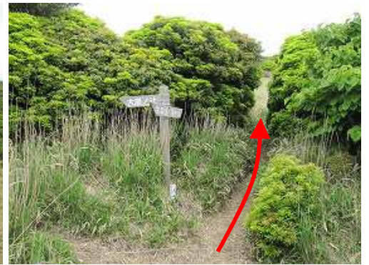
大崩ノ辻分岐を左に見て通過する。