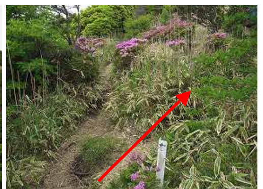
たぬきピーク分岐を右折し緩やかに斜面を上って行く。