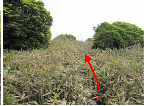
ササの中の獣道を上方へ漕いで行く。