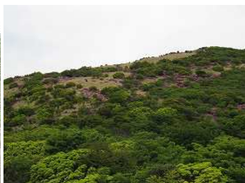
たぬきピークへの斜面。