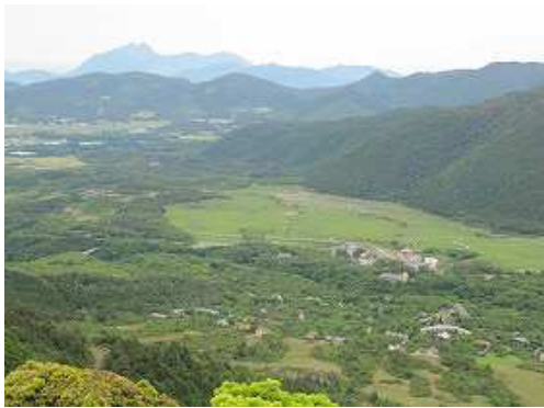
長者原を見下ろす。