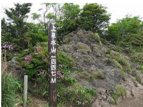
上泉水山(1447m)の山頂からは東方面に展望が得られる。此処で引き返す。