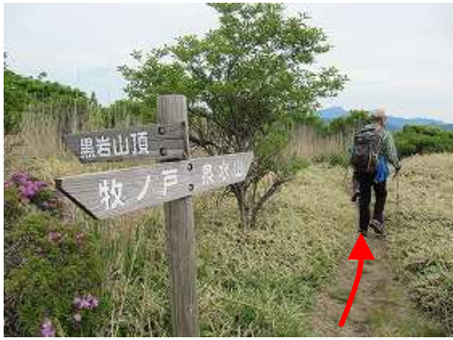
黒岩分岐に下り尾根筋を東北東へ向かう。