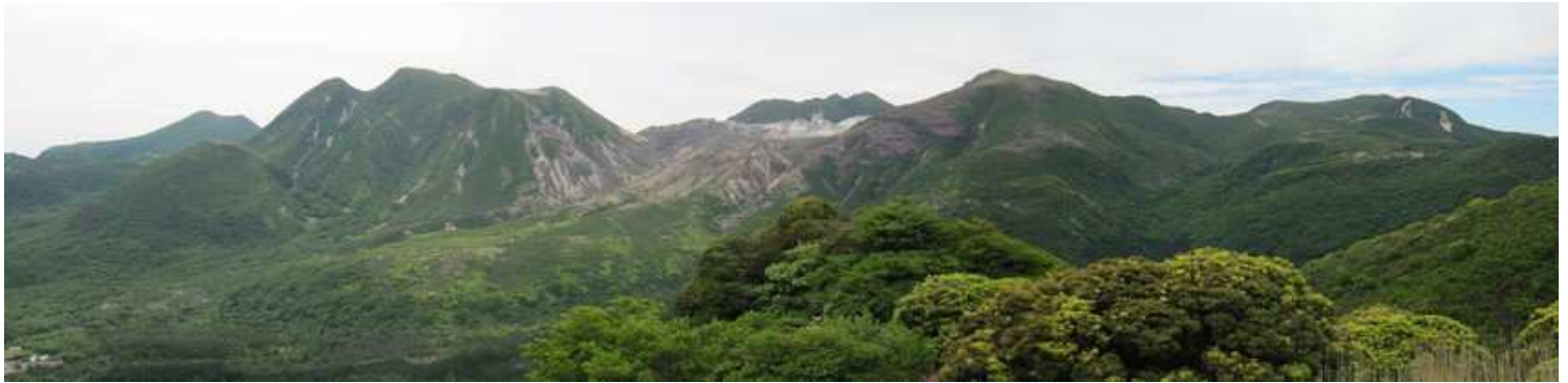
岩峰を下った先から望むくじゅう連山。