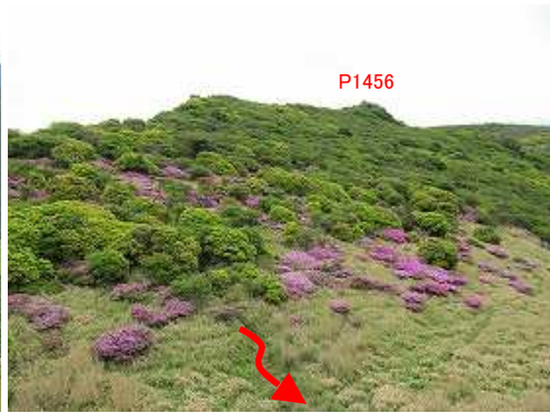
P1459の岩峰を振り返る。