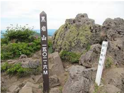
黒岩山(1503m)の山頂には三等三角点が設置されており360°の展望が得られる。