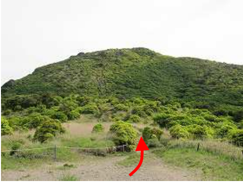
北に黒岩山が望める。