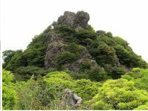
前方にP1456の岩峰が近づいた。