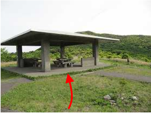
四阿屋が正面に見えた。初心者は牧ノ戸へ出て正規のルートを歩く事！