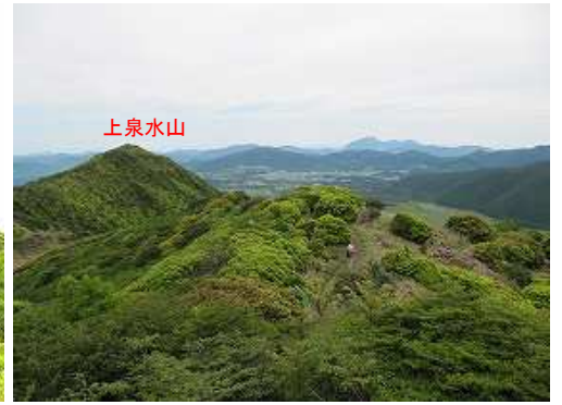
岩峰から北東の眺め。