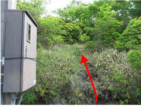
黒岩林道に車を止め、傍の踏み跡から取付く。

駐車地～四阿屋～黒岩山(1503m)～P1456～上泉水山(1447m)～ためきピーク分岐～大崩ノ辻(1458m)～シャクナゲ谷分岐～コル～黄金アセビ～四阿屋～駐車地