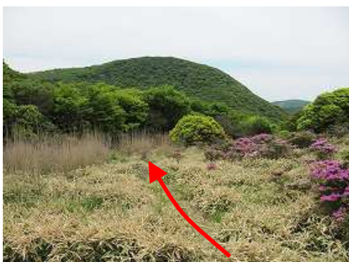
シャクナゲ谷分岐から南南西に降る。