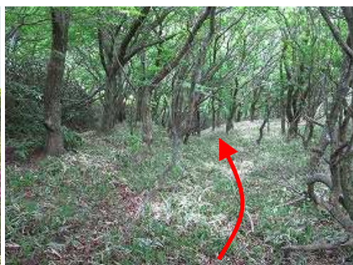
薄いササの斜面を下って行く。