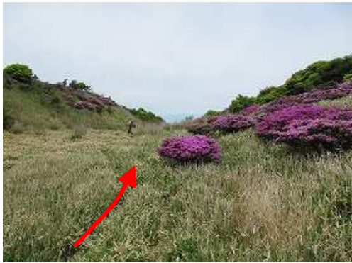
コルに登り上がる。