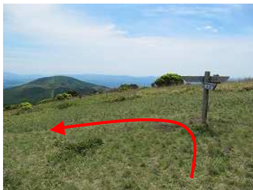
泉水分岐の案内板を左折して下って行く。