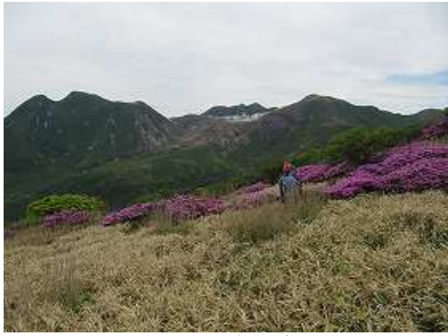
三俣山から星生山を望む。