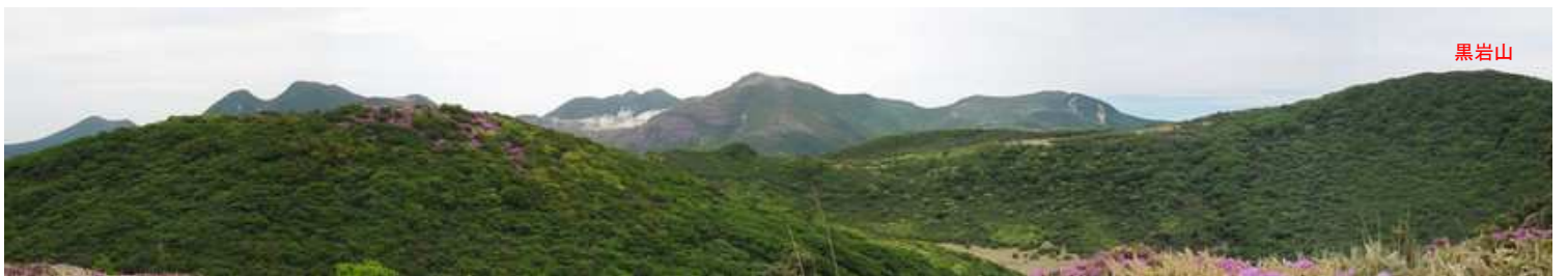
大崩ノ辻南斜面からの眺め。