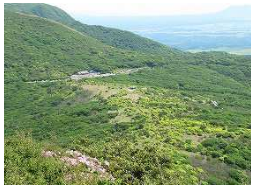
牧ノ戸を見下ろす。