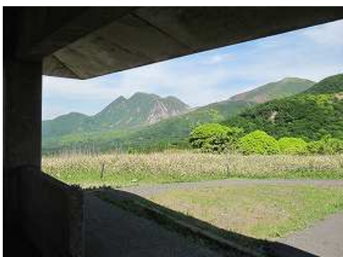
四阿屋から三俣山を望む。