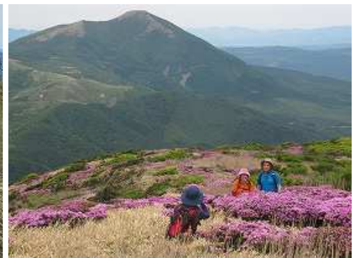
北斜面のミヤマキリシマと涌蓋山。