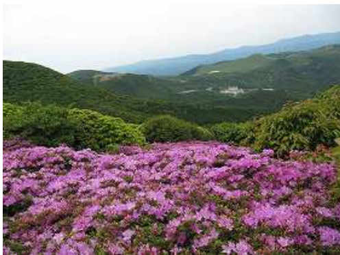
八丁原地熱発電所を望む。