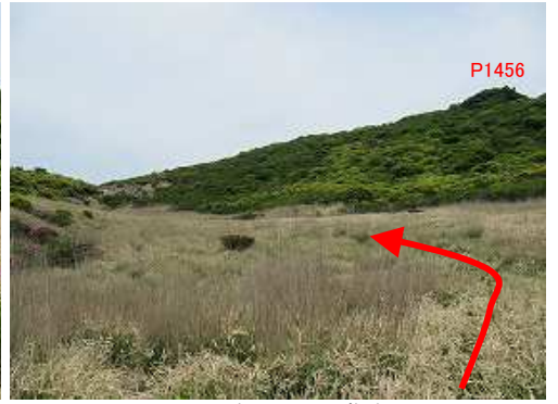
カヤトの中、コルを目指す。