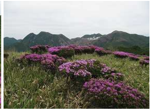
平治岳から星生山を望む。