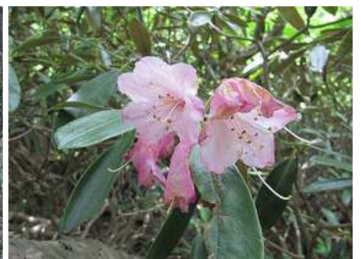
まだ咲いていたツクシシャクナゲ。