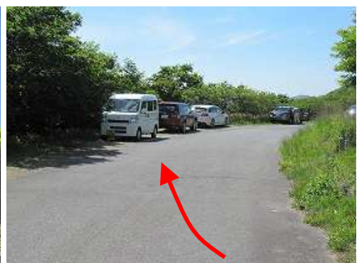
駐車地に帰着いた。