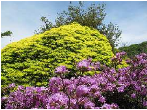
探し出すとアセビであった。