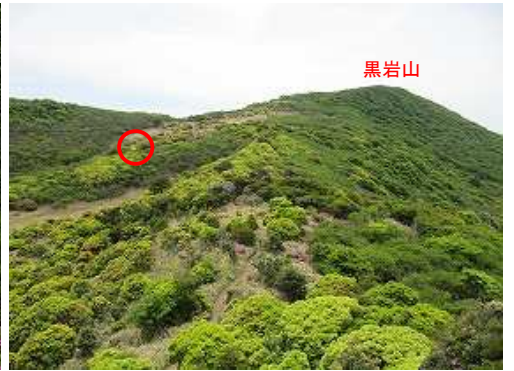
斜面の中に金色に輝く物が見えた。