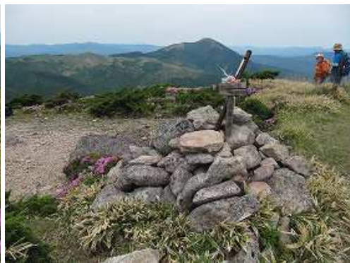
大崩ノ辻(1458m)の山頂からは360°の展望が得られる。