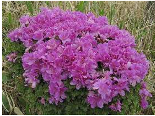
色違いのミヤマキリシマ。