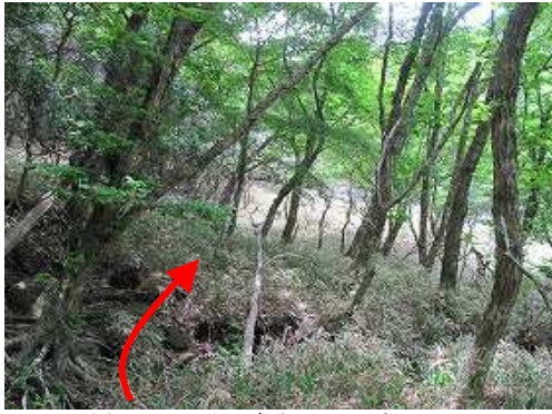
小さな涸れ沢を渡り南東へササを掻き分ける。