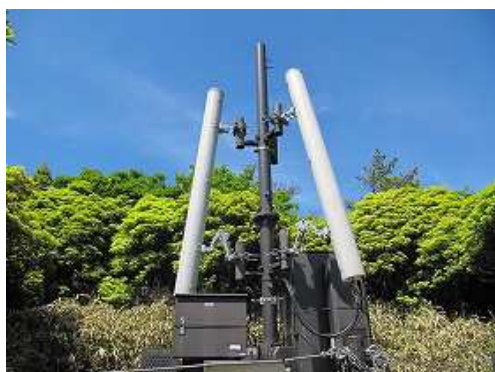
アセビ帯を抜け出て携帯基地局を見る。