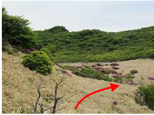
喬木帯を抜けるカヤト原が望める。