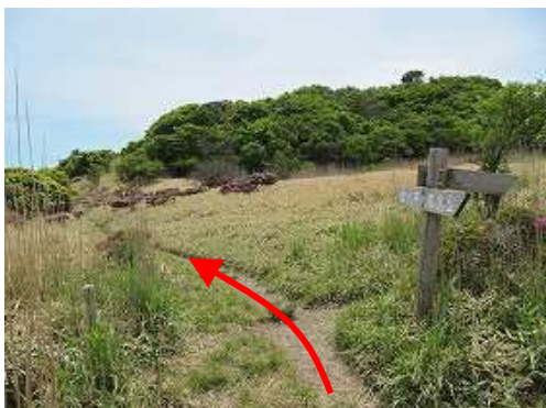
黒岩分岐を通過する。