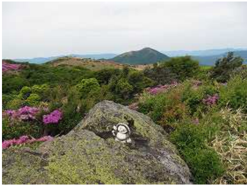
たぬきピーク(1460m)。奥に涌蓋山を望む。