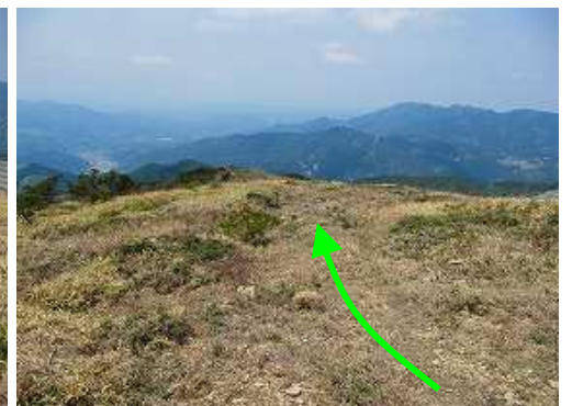
歩きやすい所を探しながら進む。