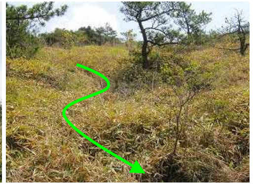
周回路に合流し降りて来た斜面を振り返る。