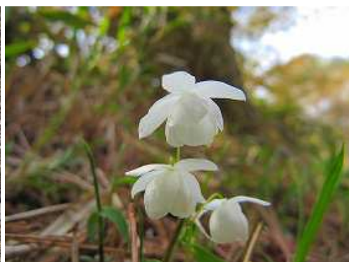
バイカイカリソウ