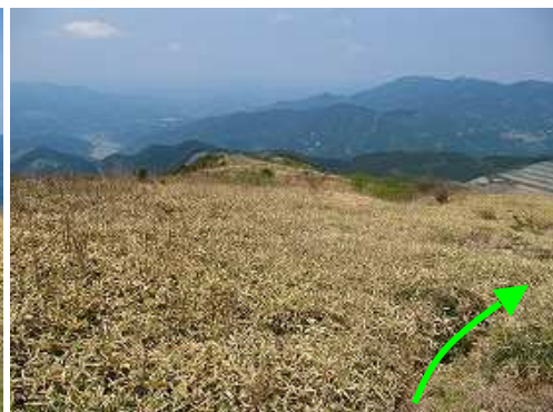
弱い踏み跡のササ原へ分け入る。