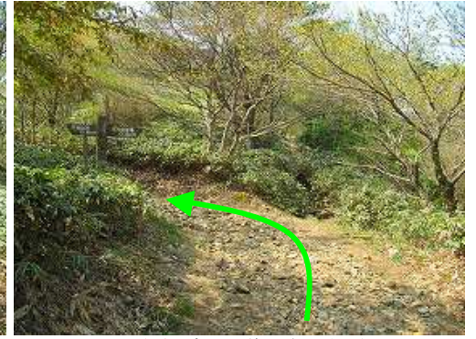
雨山分岐を右に見送り、左へ向かう。