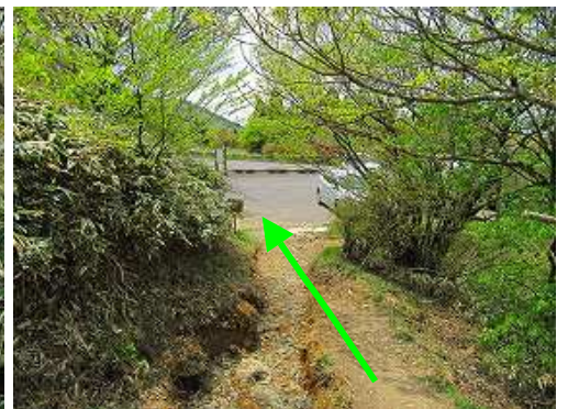
緩やかに下って天川駐車場に戻る。