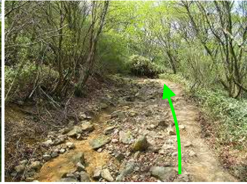
やや荒れた道を緩やかに上って行く。