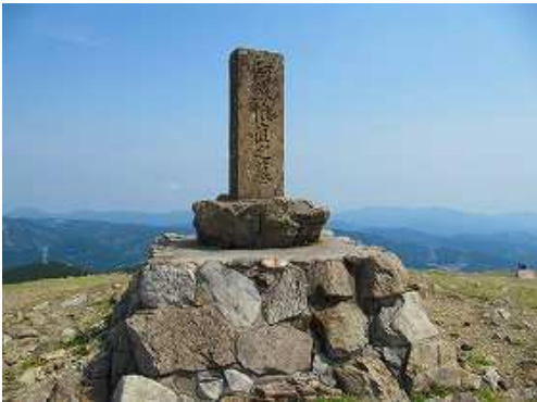
南を向いて阿蘇惟直之墓は建つ。