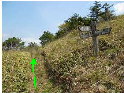
直ぐに車道分岐に出会い直進する。