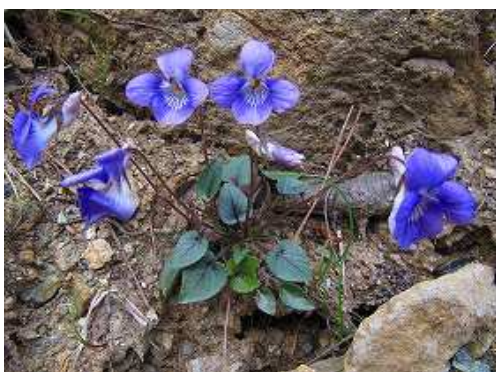
ナガバナタチツボスミレ