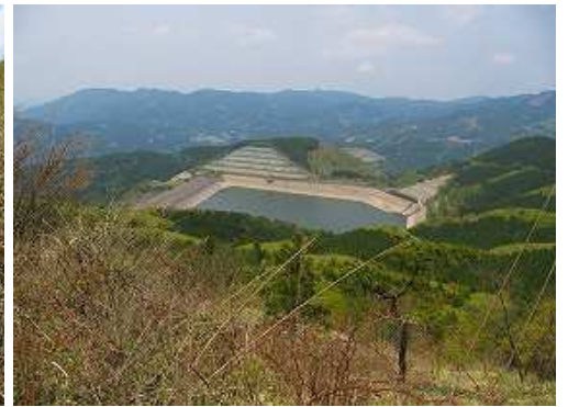
左手下に天山ダムを見下ろす。