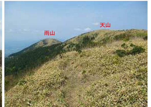
引返し点から天山を望む。