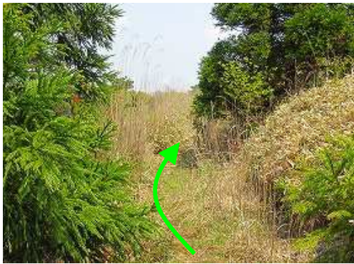
周回路を北東へ向かう。