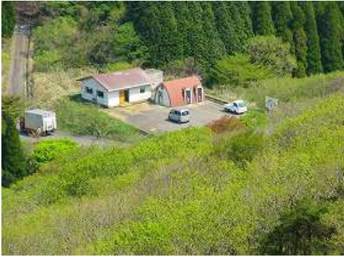
振り返ると出発地の天川駐車場が望まれた。