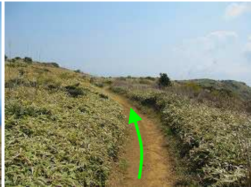
東へ九州自然歩道に行く。