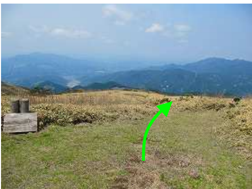
再度、山頂に立ち西斜面へ踏み込む。