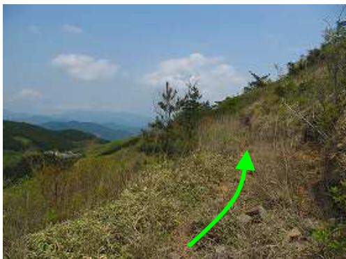
左前方に天川駐車場が望まれた。