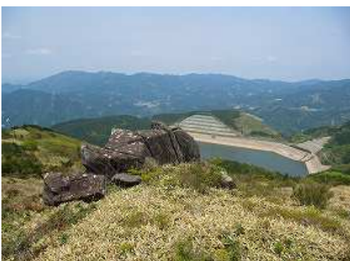
岩がもたれ掛った5連岩に到着。