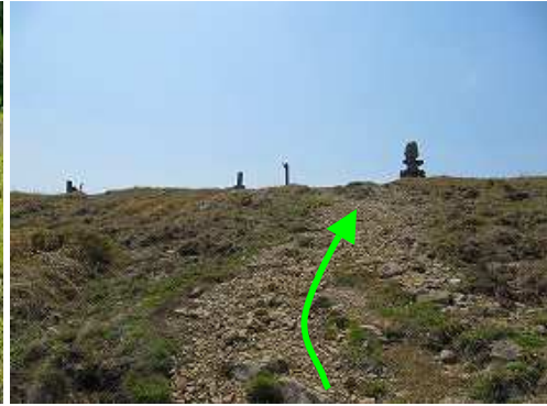
ジグザグに上り詰めると、山頂部が見えて来た。