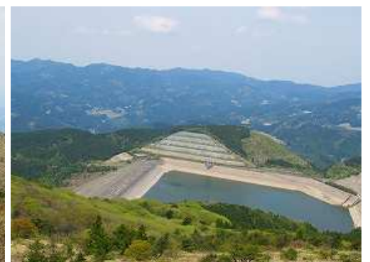
北西に天山ダムを見下ろす。