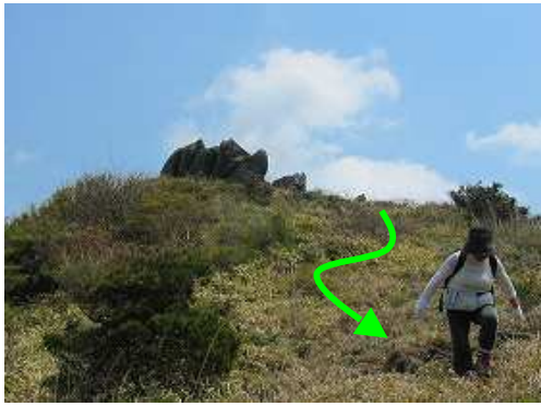
5連岩から北西に斜面を下る。