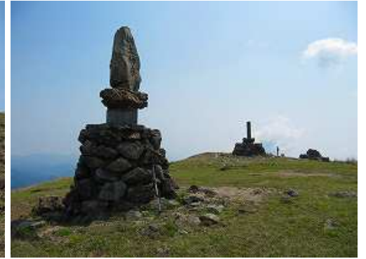
天山(1046m)の山頂には一等三角点が設置され360°の展望が得られる。