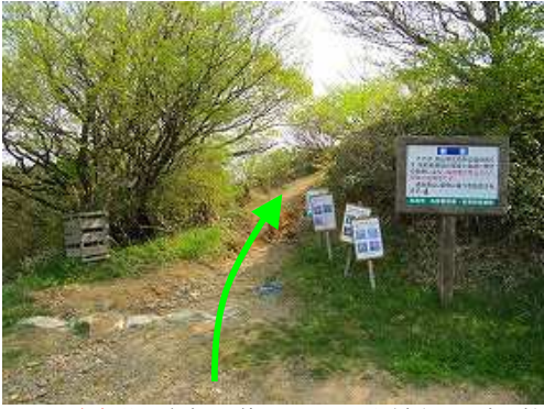
天川駐車場に駐車し、傍の登山口から緩やかに歩き始める。