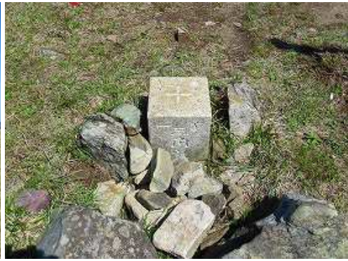
一等三角点が設置されている。