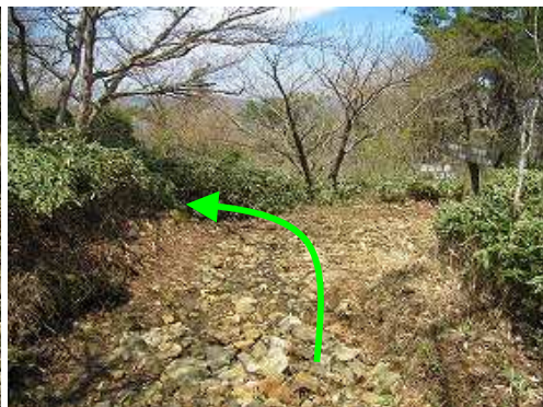
雨山分岐を左折する。