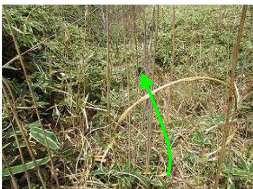
朽ち果てた丸太階段が残るヤブを掻き分け下る。