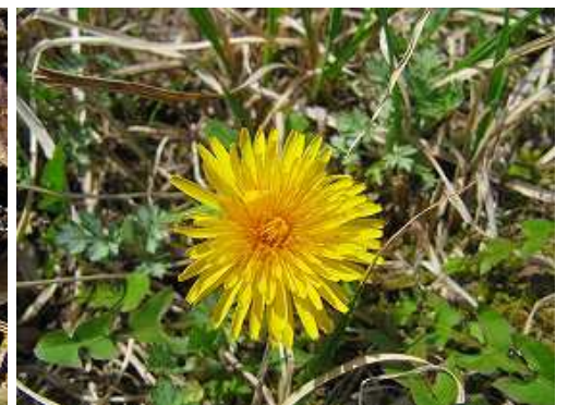
カンサイタンポポ