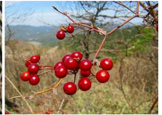
サルトリイバラ 実