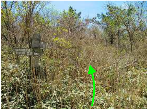
車道の案内板方向にササを掻き分け踏み込む。