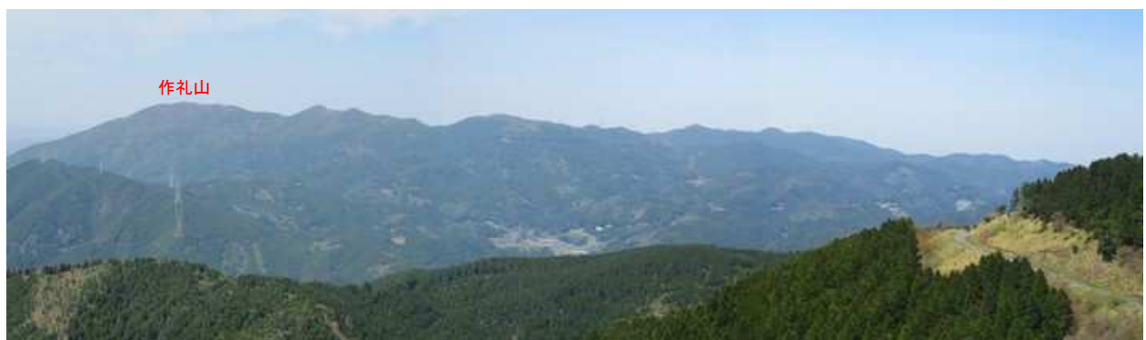
作礼山方面を望む。