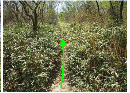
岸川分岐を右折して雨山へ向かう。