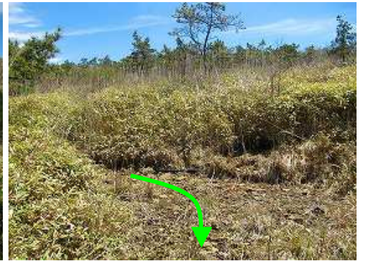
ササ原を掻き分けて踏跡に合流する。