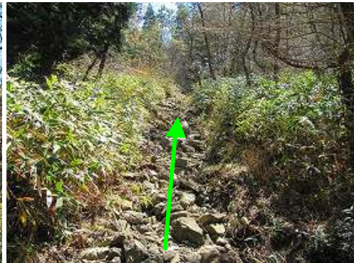
ゴロ石の中を行く。