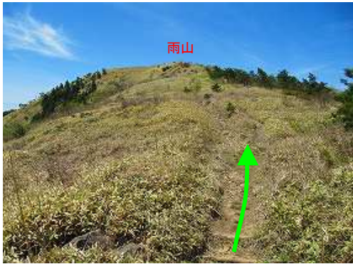
雨山の山頂部が望める。