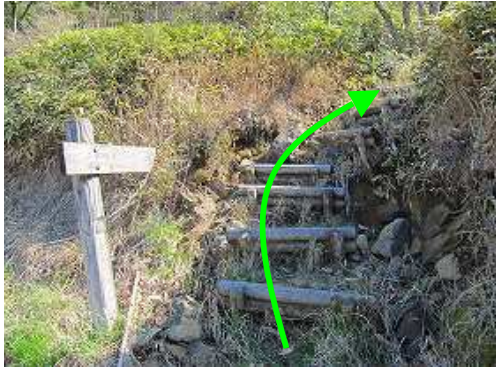
自然歩道取付 丸太階段に取付き上って行く。