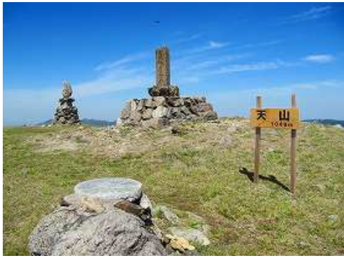
天山(1046m)の山頂。360度の展望が得られる。