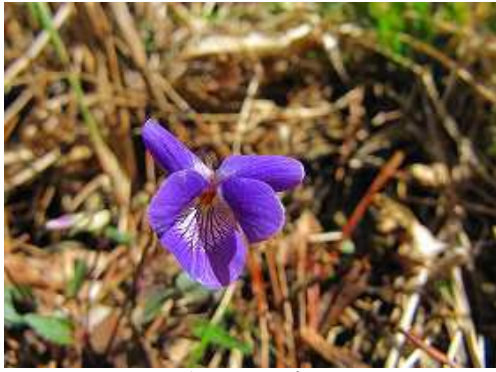
ナガバナタチツボスミレ