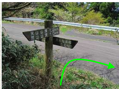
車道取付に降り立つ。 ※このルート荒廃が激しく上部の取付き不明。