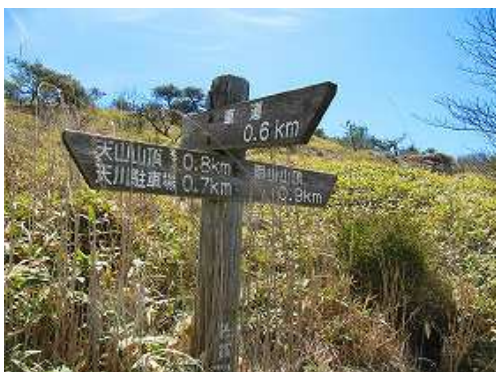
車道分岐を通過する。