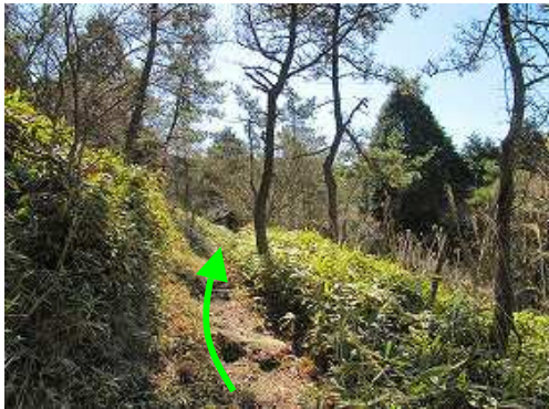
傾斜が緩み斜面を行く。