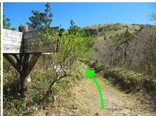
前方に天山の山頂部が望まれる。