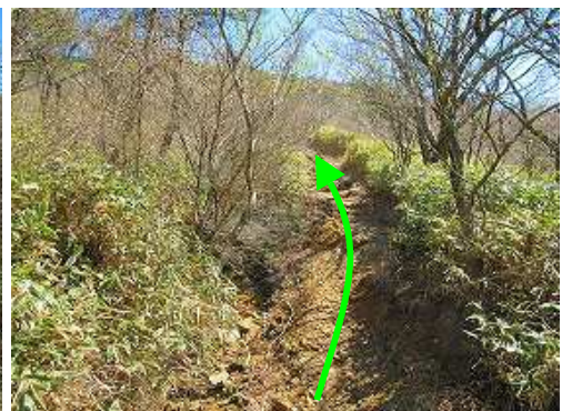
斜面を緩やかに上って行く。