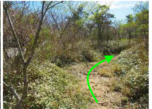
天川分岐を通過する。