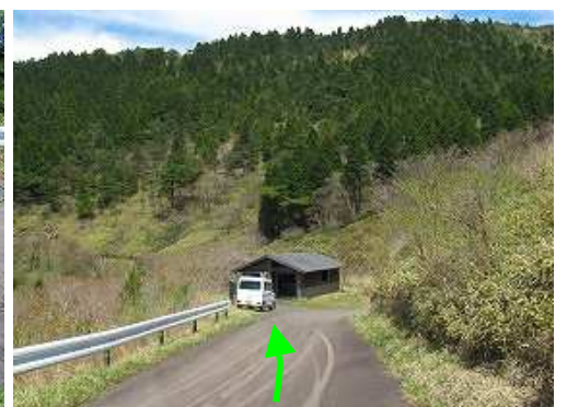
右前方に駐車地が見えた。