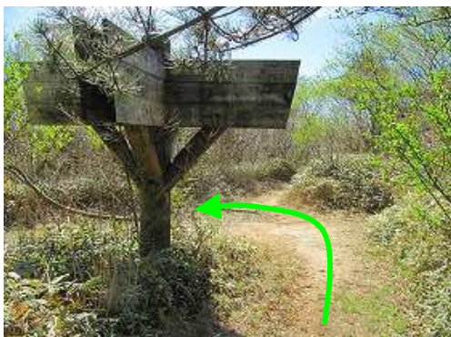
岸川分岐を左折する。