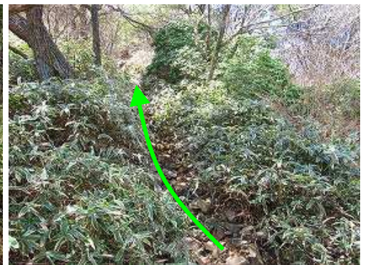
ササを分けて行く。