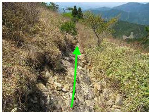
いくらか路らしくなる。