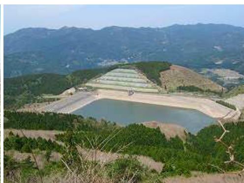
右下に天山ダムを見下ろす。