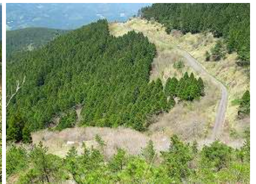
右下に道路が見えた。