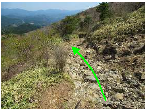
ガレ道を緩やかに下って行く。