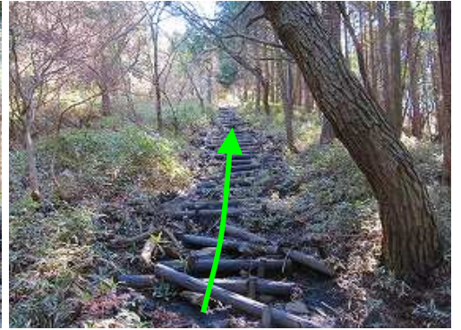
荒れ気味の丸太階段を上って行く。