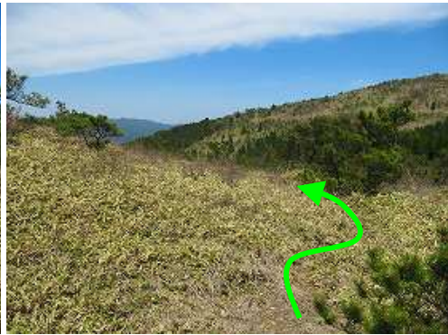
右斜面へ 此処からササの中の獣道を下る。