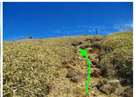
山頂部が見えて来た。