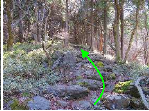
ヒノキ林の石段を緩く上って行く。