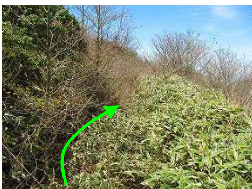
短いヤブ漕ぎもある。