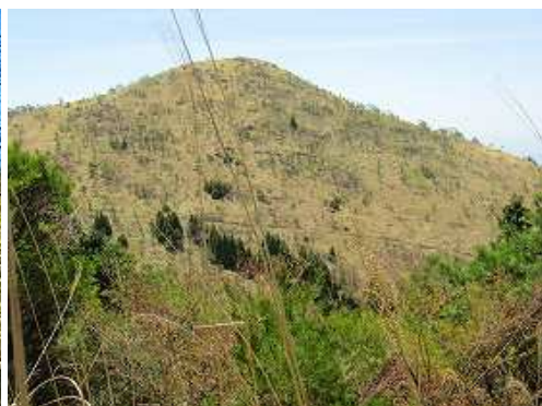
雨山と踏跡ルートが見えた。