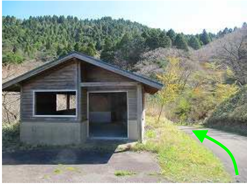
天川駐車場と天山上宮駐車場間の避難小屋脇に駐車する。傍の案内板に目を通し北方向に歩き始める。

駐車地～自然歩道取付～岸川分岐～天山(1046m)～雨山分岐～天川分岐～車道へ道探し～岸川分岐 ～右斜面へ～踏跡合流～車道取付～駐車地