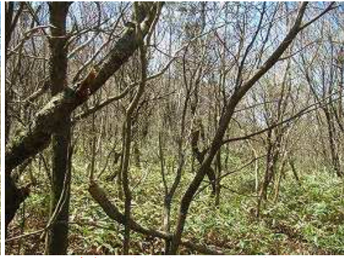
踏跡が見当たらないので引き返す。