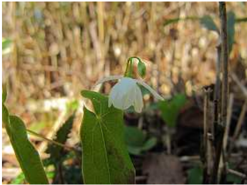
バイカイカリソウ