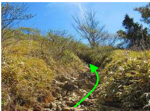
ガレ道を緩やかに上って行く。