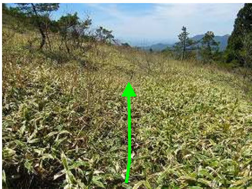
ササ原を掻き分けて行く。