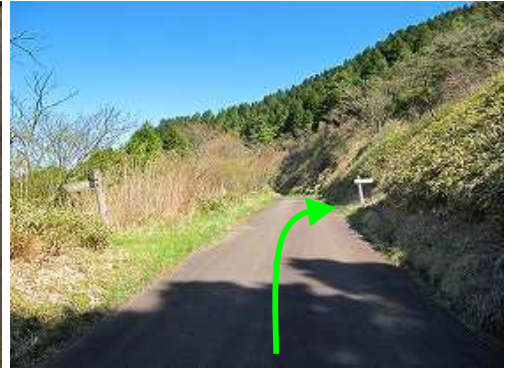
程なく岸川から通じる自然歩道の指導標が見えて来た。