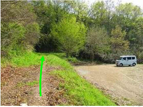
エヒメアヤメ自生地の駐車場に車を止め、上段の作業路を歩き始める。

駐車場～尾根取付～帯隈山(175m)～北列石～帯隈山(175m)～神龍池石碑～エヒメアヤメ自生地～駐車場