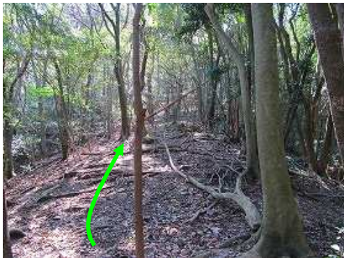
北の尾根筋を上り返す。