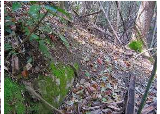
列石は斜面に消える。