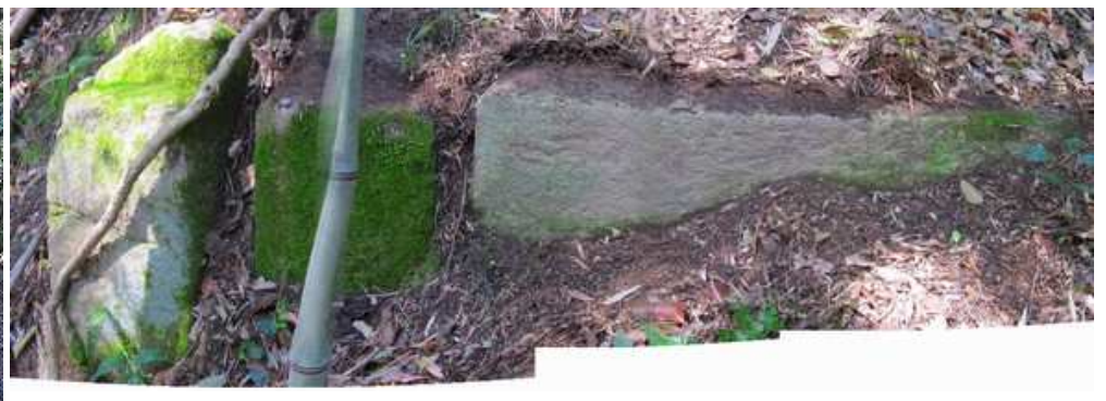
東列石2 東の急斜面に3個の列石を見る。右は直方体に加工されている。