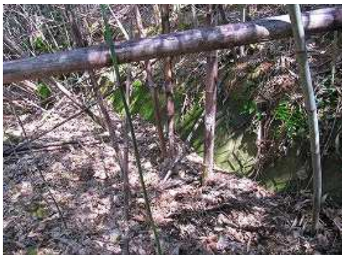
ブロック積み作業路に降り立つ。