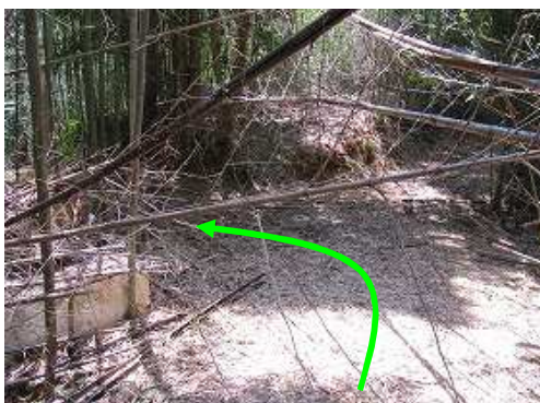
分岐に出会い左折する。