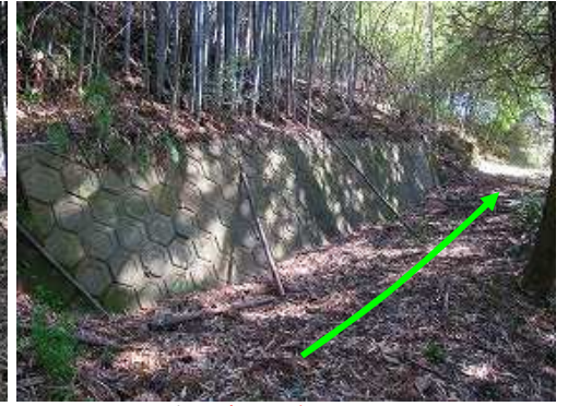
左にブロック積みを見る。