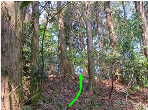
前方が開け、山頂部が近づいた。