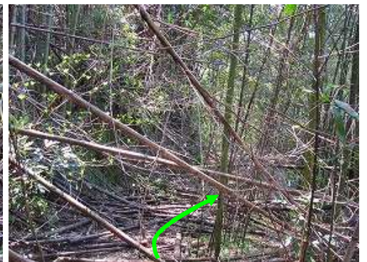
作業路はタケに覆われており掻き分けて行く。