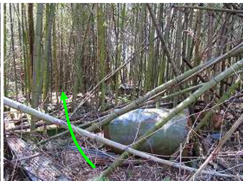
廃屋の竹藪を掻き分ける。