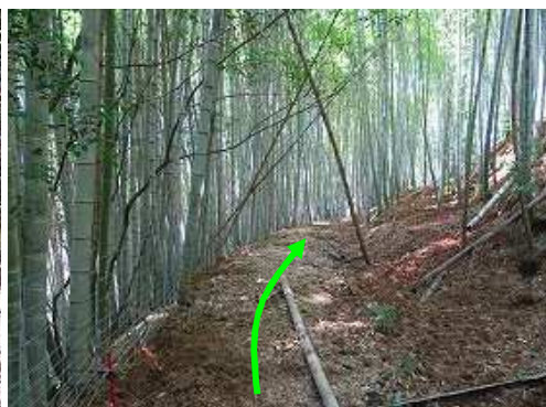
竹林沿いの作業路に行く。