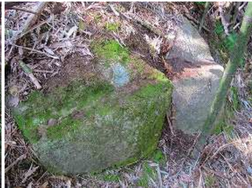
東列石1 東斜面に2個の列石を見る。