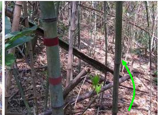
尾根筋の赤テープを追いながら斜面を上る。