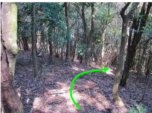
北へ尾根筋を下る。