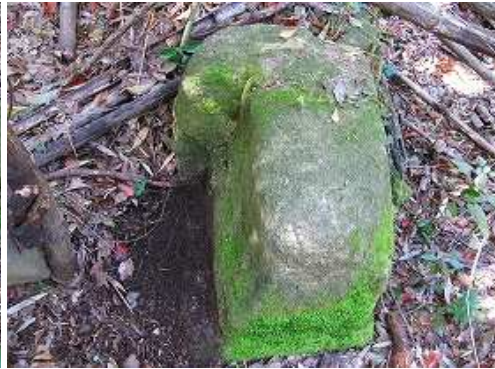
開口部の右。内側が加工されている。