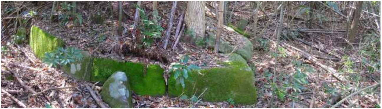
北列石 右側は開口しており門跡か？