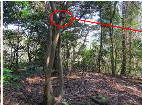
帯隈山(175m)の山頂。周囲を樹木に覆われ展望は得られない。