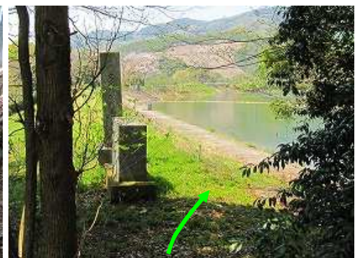
神龍池石碑に飛び出した。