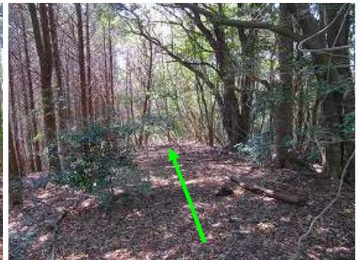
南の尾根筋を下って行く。