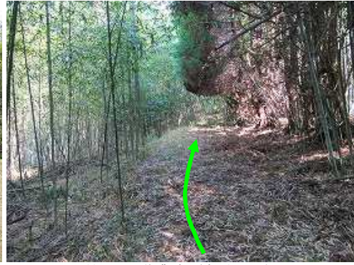
小竹沿いの作業路を緩く上って行く。