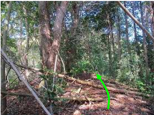
尾根筋を緩やかに上って行く。