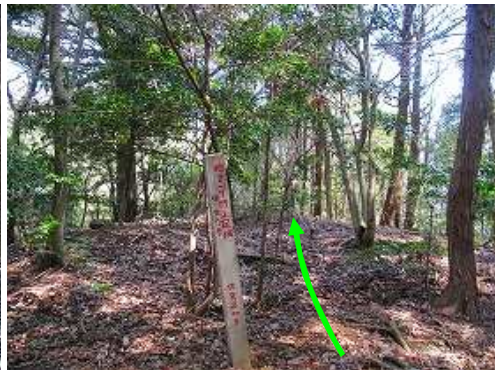
帯隈山(175m)の山頂を通過する。