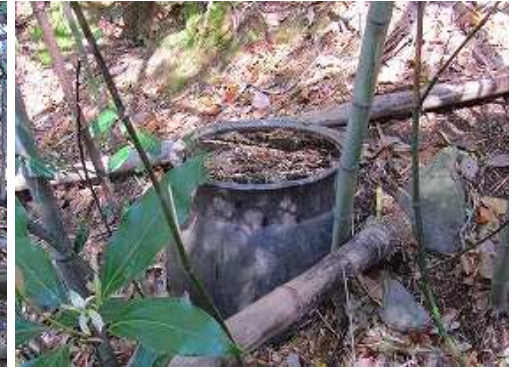
放置された水ガメ。