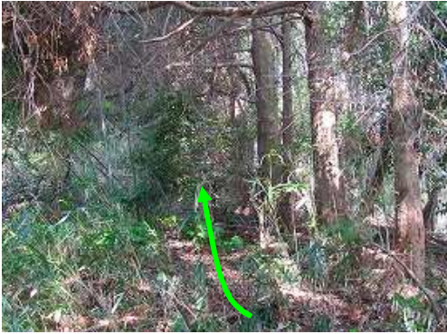
尾根取付 尾根筋の竹藪を上って行く。