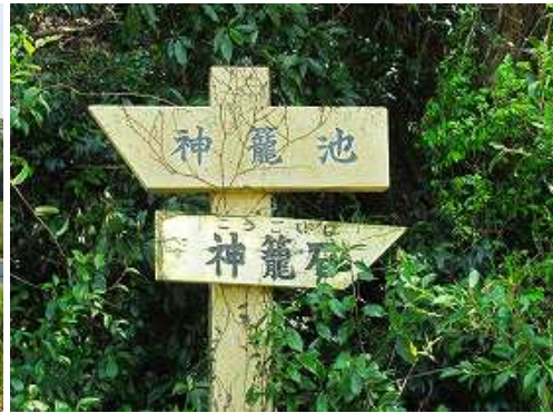
左折すると前方山側に目にする案内板。