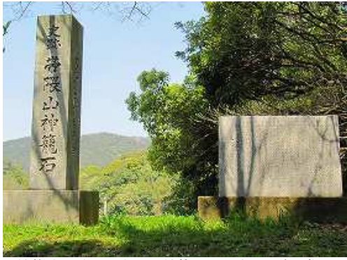
神龍池石碑には帯隈山神籠石に関する記述が刻まれている。