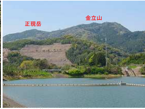
神龍池から北西に金立山を望む。