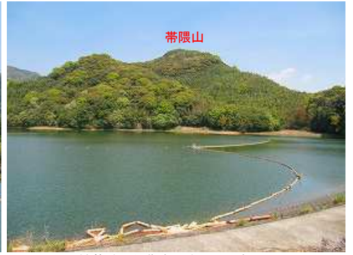
神龍池から北東に帯隈山を望む。