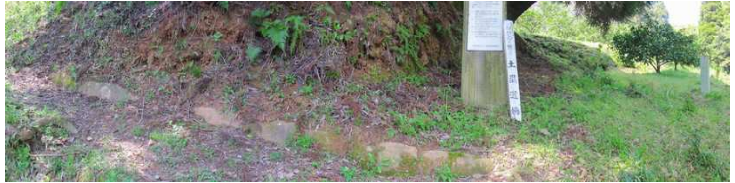
左手に土塁遺構を見る。