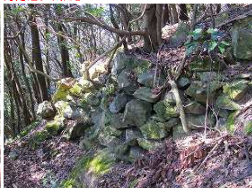
尾根筋に石垣が残る。戦国時代の山城であった竹野城に関連したものか？