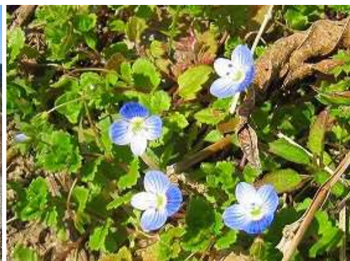
オオイヌノフグリ