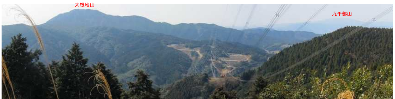
鉄塔82号から南方向の展望。