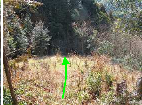
鉄塔跡に飛び出した。