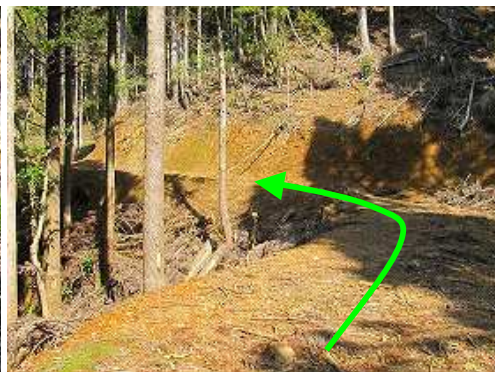
作業路合流 左に向かう。下の作業路の延長線と思われる。