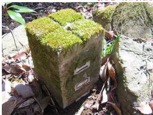
尾根筋に二〇コン杭を見る。