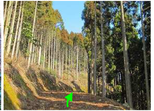
道なりに緩やかに上って行く。