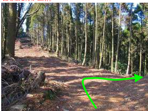
尾根分岐 X状に交差する分岐。