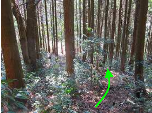
前方が開けて来た。