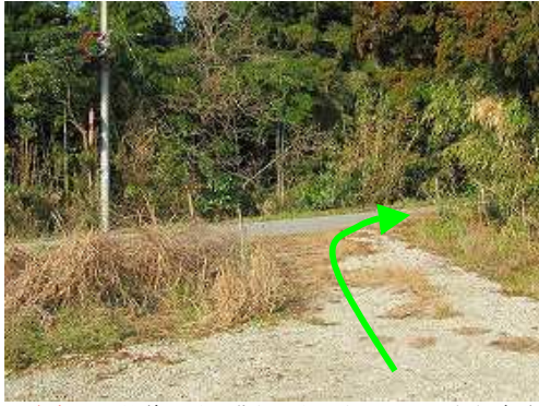
駐車地は県道65号の北側にある空き地で10台程度駐車可能。県道65号を右折する。

駐車地～鉄塔81号取付～鉄塔81号～作業路端部～作業路分岐～作業路合流～尾根分岐～鉄塔82号～竹の尾山(540m)～石垣～尾根踏跡出合～県道出合～駐車地