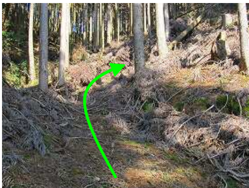
直ぐに左側斜面に入り植林斜面の上部を目指す。作業路を上の方が正解。