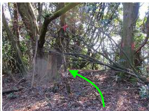
作業路終点 尾根筋を伝う。