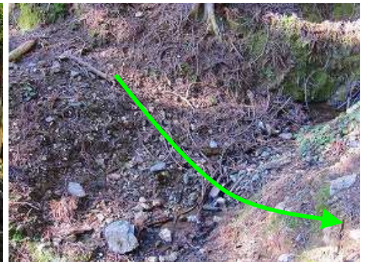
弱い沢に出会い抜け出る。