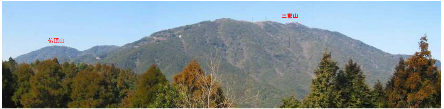
鉄塔82号から北西方向の展望。