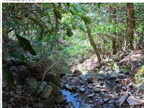
沢に出合い西側のスギの植林斜面を登り上がる。