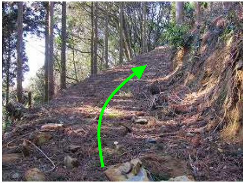
作業路端部に出会い左へ向かう。