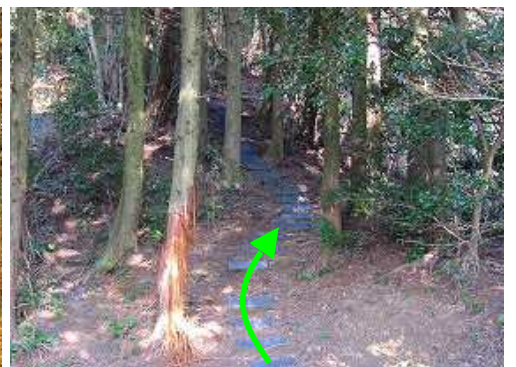
プラ階段の斜面を上って行く。