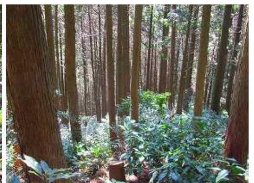
尾根踏跡に出合い、スギの植林帯を下って行く