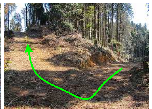
Uターンするように尾根筋の作業路を行く。