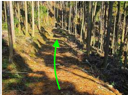
作業路を道なりに緩く下って行く。