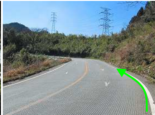
道なりに緩やかに上って行く。