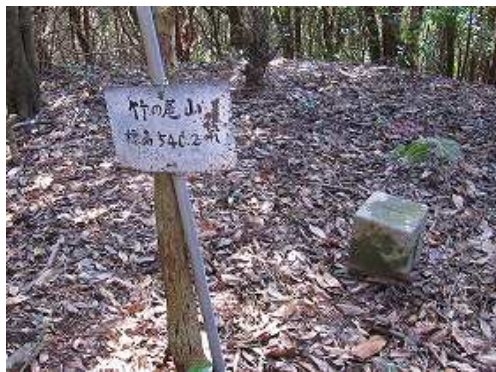
竹の尾山(540m) 三等三角点:竹野城が設置されているが周囲を樹木に覆われ展望は得られない。 初心者の方は、此处で引き返してください!!