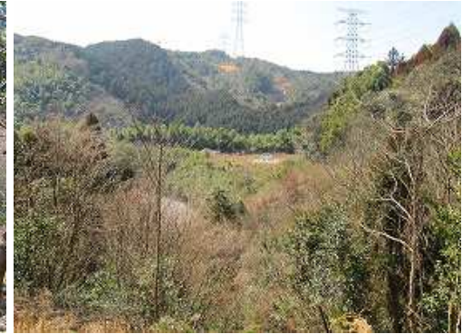
南西に駐車地が見える。