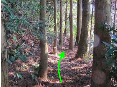
スギの植林地に行く。