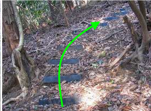
九電巡視路のプラ階段を上って行く。