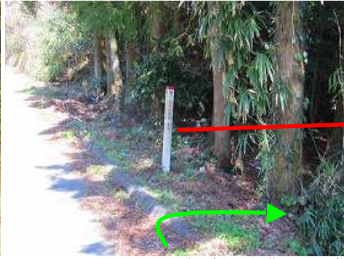
直ぐ右側に鉄塔81号の標柱を見るので、此処から取付く。