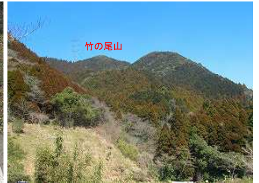
振り返ると竹の尾山が望まれた。