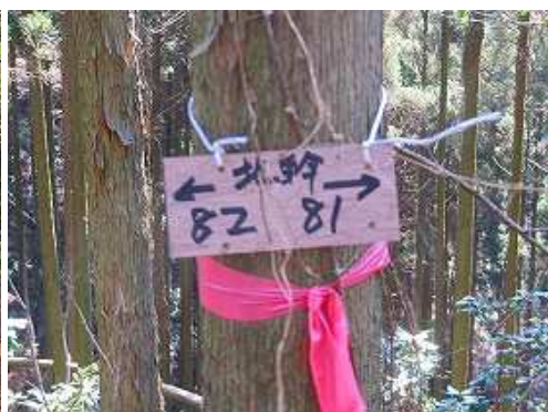
奥の左側作業路の幹に掛かる案内板。