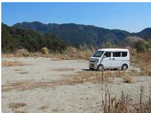
駐車地に帰着いた。