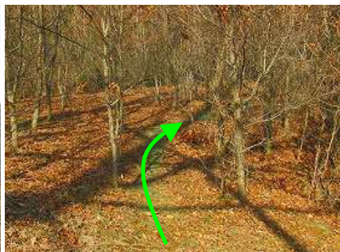
北西側のコナラ林に入る。