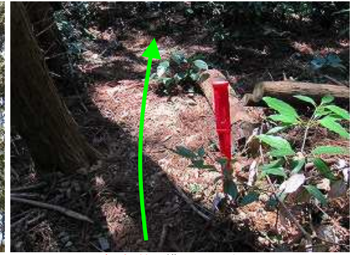
赤プラ杭の横を下って行く。