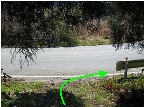
県道出合 県道65号に出合い右に向かう。