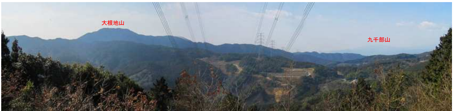
鉄塔81号からは南の展望が得られる。