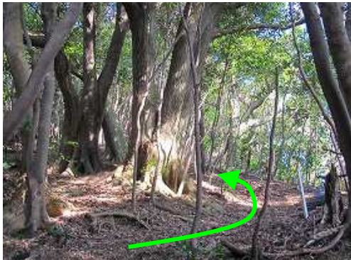
四又木 イヌシデの幹が四又に伸びており脇を抜ける。