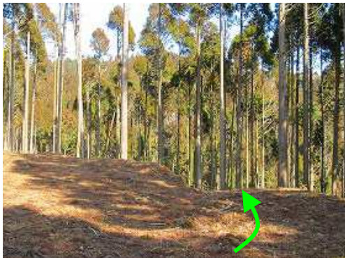
作業路分岐 左上が正解 右下へ向かう。