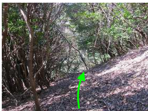
踏跡出合 南西に斜面を下って行く。