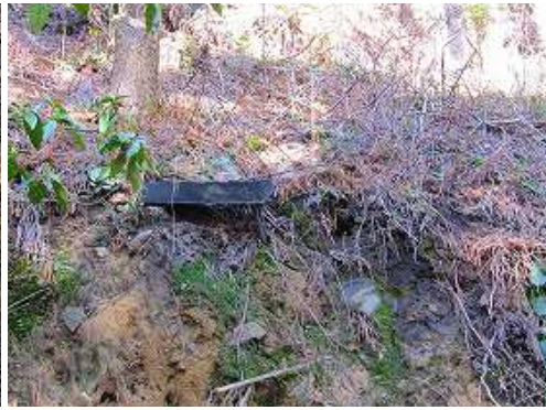
右側の斜面上部にブラ階段を見る。