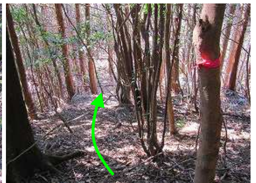
赤テープを頼りに間伐際を下る。