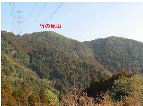
北北東には竹の尾山の山頂が望まれる。