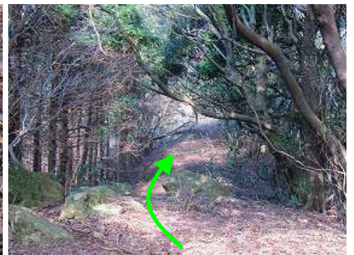
尾根筋を東へ下る。