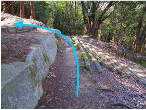
牧野神社への参道に出会い、左折する。