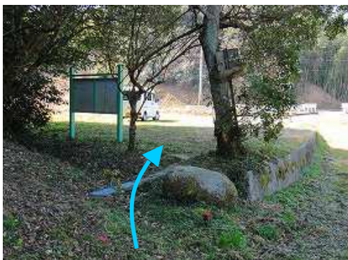
駐車場に帰着いた。