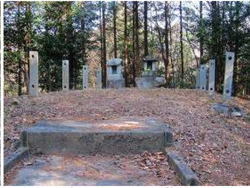
登り詰めた左手に石の祠が鎮座する。