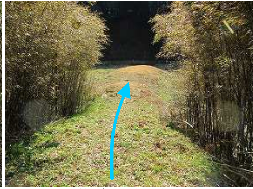
竹の先に土塁が見える。