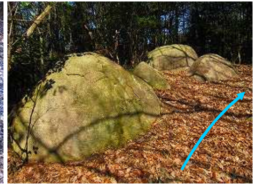
尾根の大石 花崗岩のようだ。