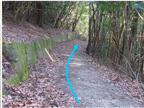
斜面の起伏に沿って列石が並ぶ。