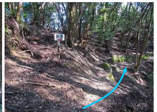
途切3 尾根筋に斜路の踏み跡があり列石が分断されている。