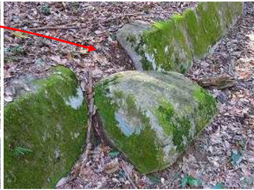
90° 前方に回転して飛び出した列石。