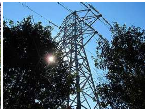
左手に66鉄塔を見る。