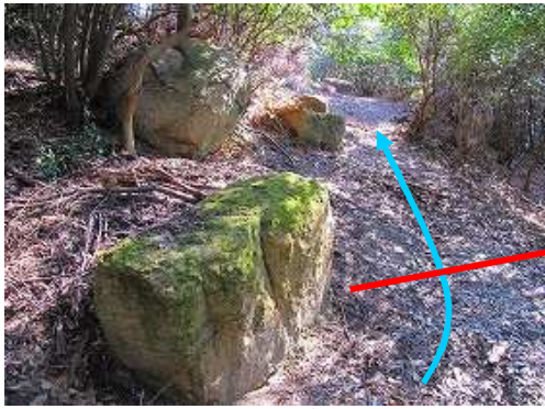
南列石4 加工済みの切石がボツンとライン上にある。