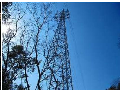
左手に大鉄塔を見る。