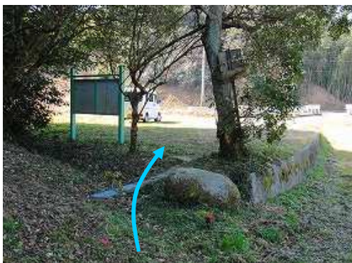
駐車場に帰っていた。