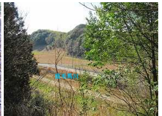
展望2 南の展望が得られる。傍に鹿毛馬川が流れる。