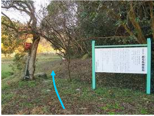
駐車場に車を止め、奥の案内板に目を通す。