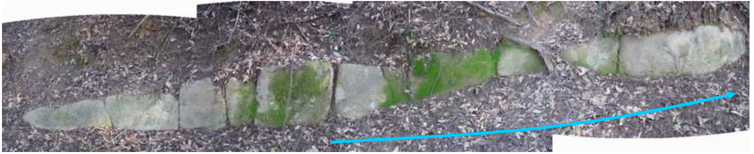
山側に南列石1が現れた。