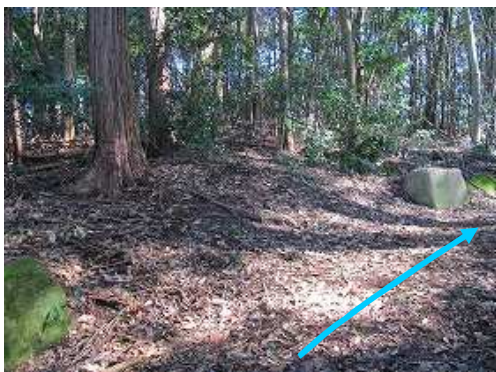
列石の途切1。持ち去られたのか？