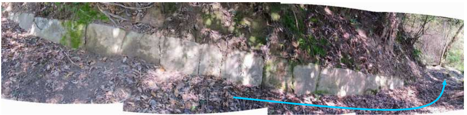
北列石5 下り気味に並ぶ列石。この先で列石は見えなくなる。