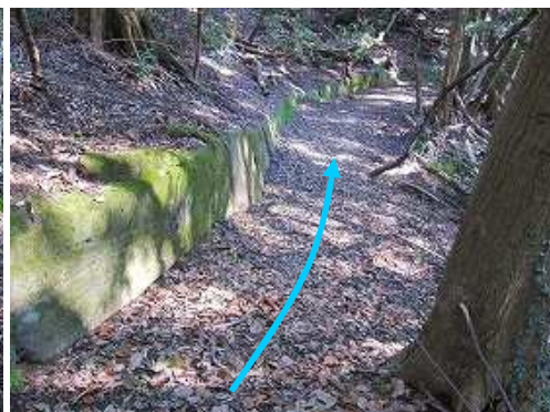
南列石2 地形に沿って列石が続く。