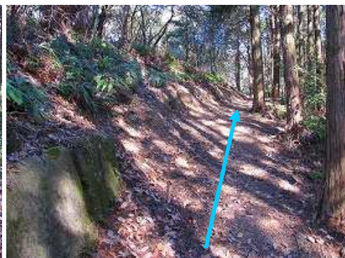
この先なし これより先、列石はない。