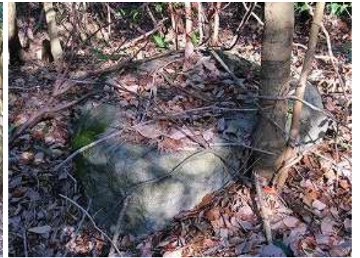
傍の谷側には放置された切石が転がっている。