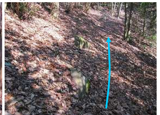
所々に切石が見られる。