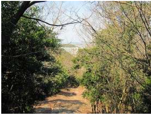
参道からは北西が望まれる。