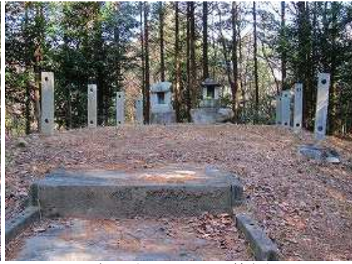
登り詰めた左手に石の祠が鎮座する。