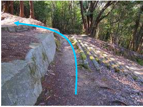
牧野神社への参道に出会い、左折する。