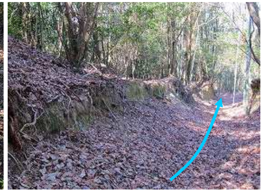
堀切のような通路を緩やかに下る。