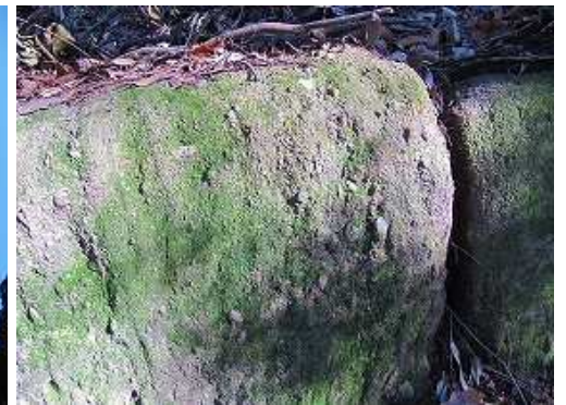
列石は堆積岩が使用されている。