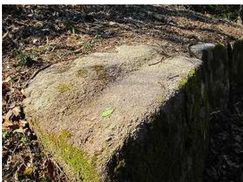
列石6から7個毎に加工された窪み石が見られる。