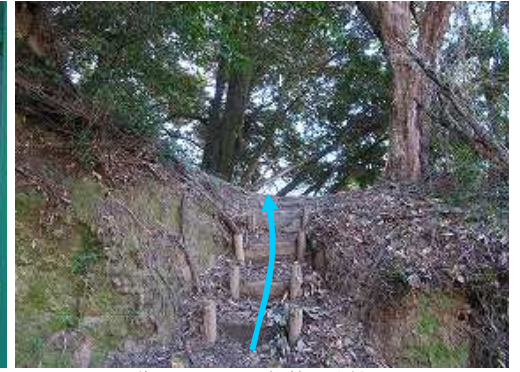
階段を登って尾根筋に取付く。