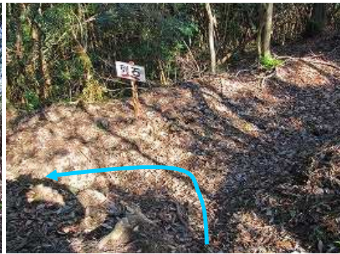
尾根分岐に出会い左へ向かう。