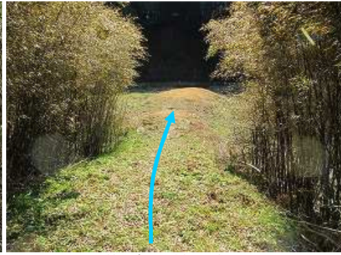
竹の先に土塁が見える。