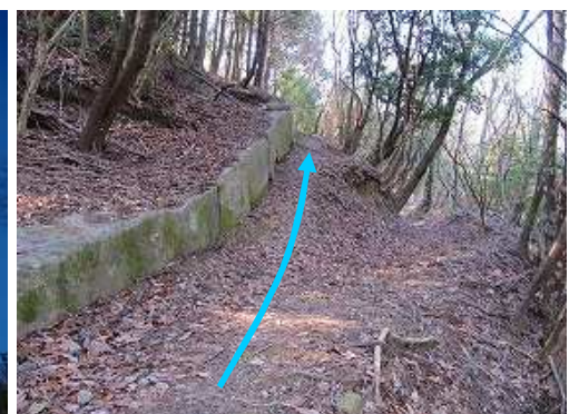
列石が斜面を緩やかに上っている。