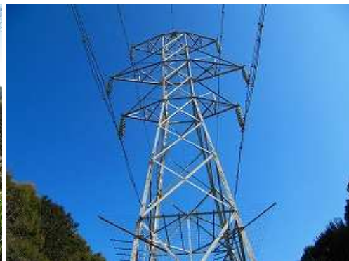
左側に68鉄塔を見る。