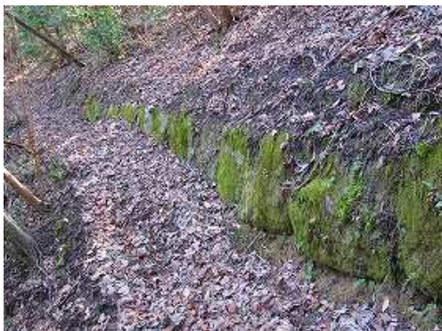
下り開けた所から谷側に斜面を行くと北列石1を見る。