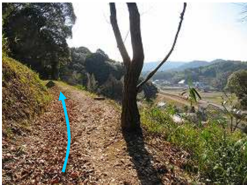
展望1 南東方向の展望。