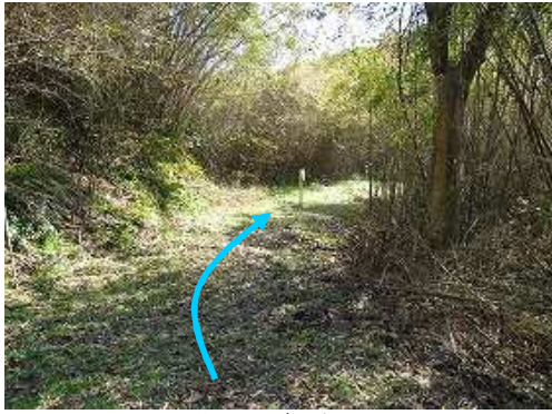
平坦地に降り立つ。