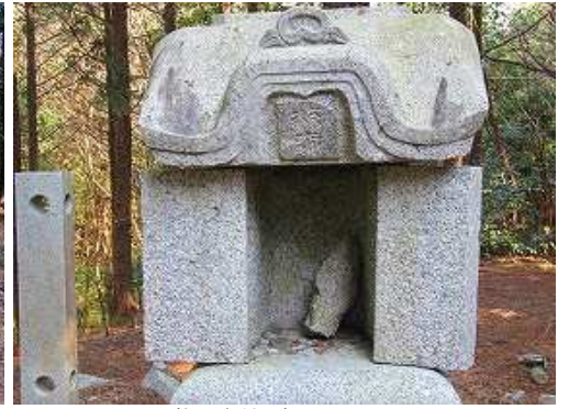
牧野大神と刻まれた祠。