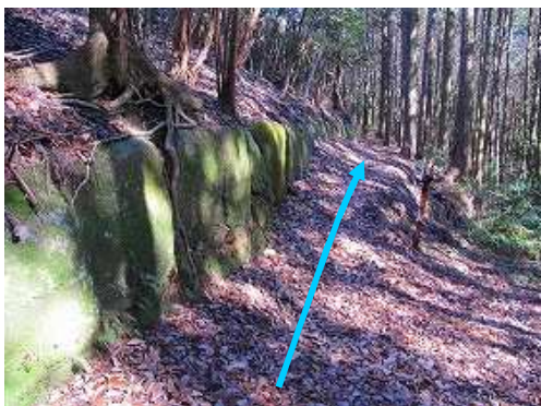
南列石3 植林地の中、地形に沿って列石が続く。