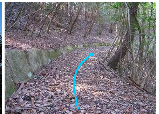
地形に沿って北列石2が続く。