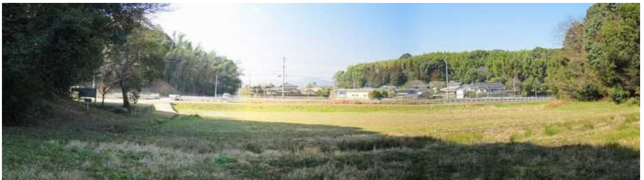
水門跡から平野部を望む。