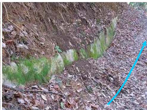
北列石4 この辺りでは列石が埋もれている。