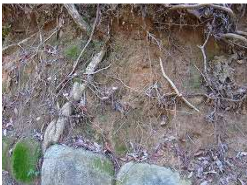
法面 列石上部の斜面に層は見られない。