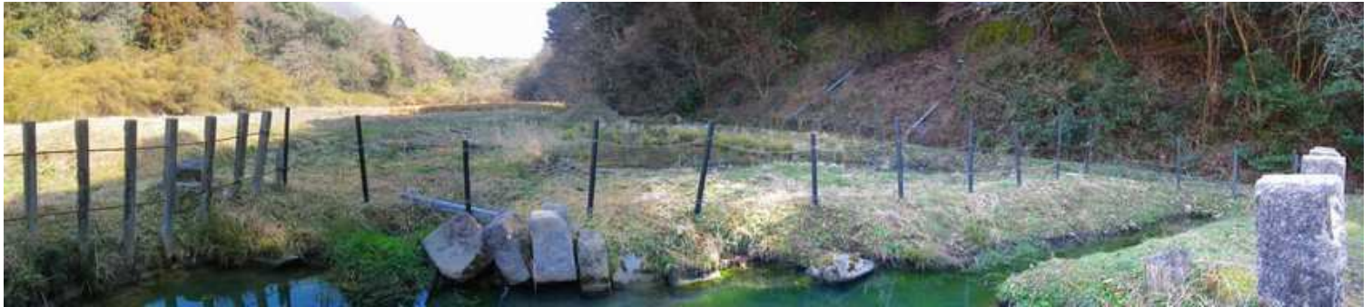
水門跡と、その上流部。