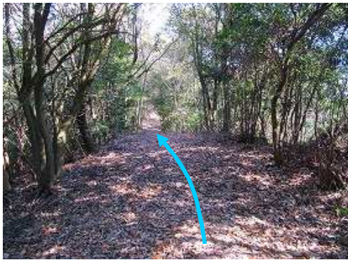
尾根筋の平坦部に行く。