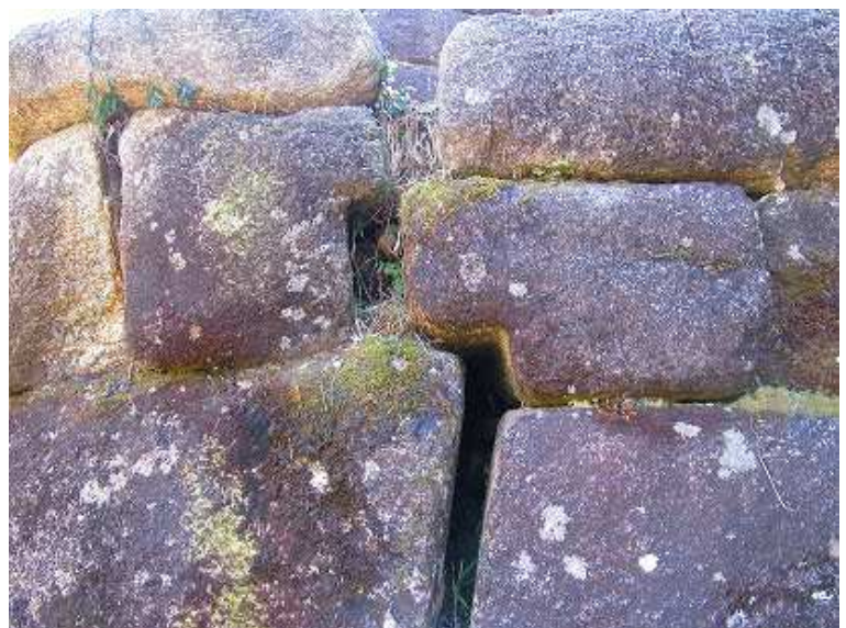
見事な石の加工と構築。