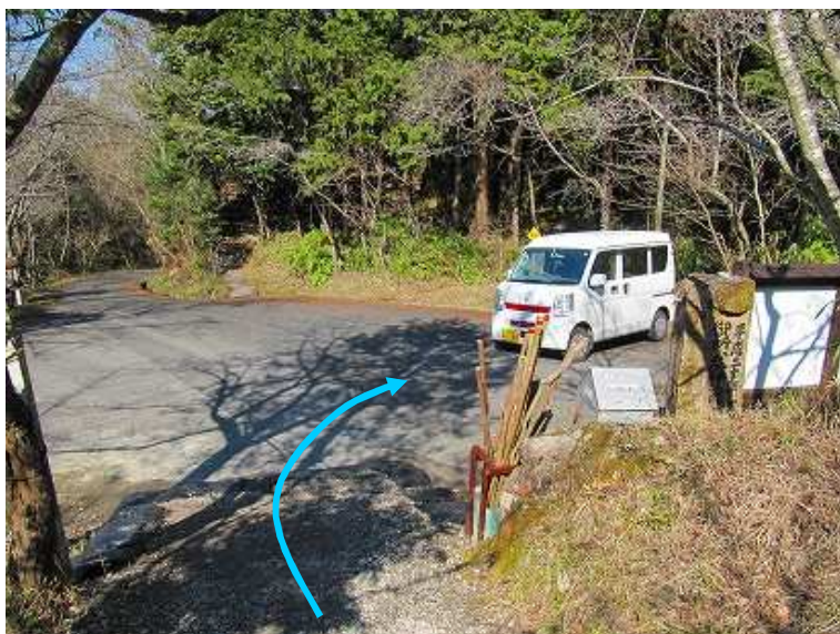
13:55 登山口に降り着いた。