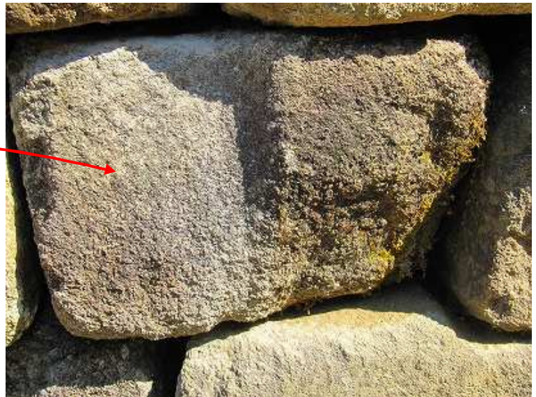
窪みのある石材が積まれている。