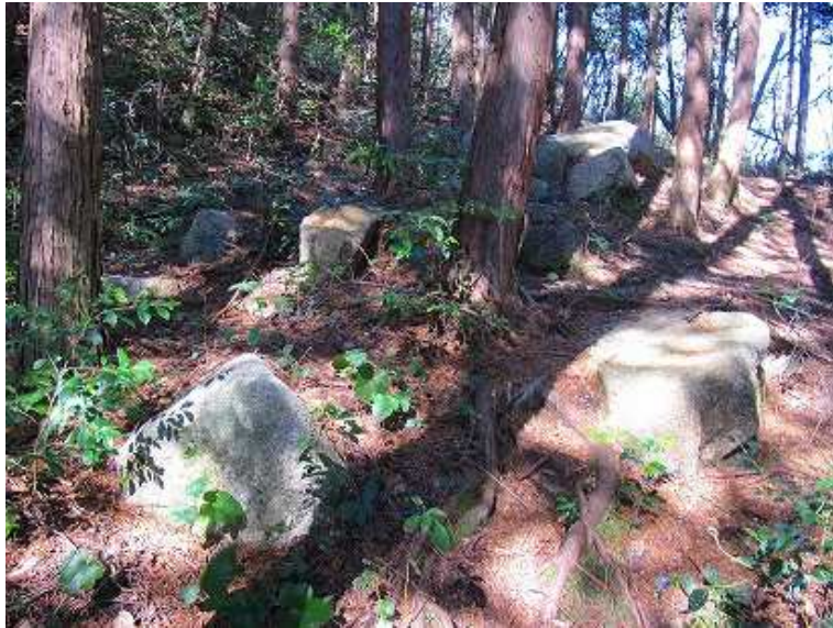
11:49 南門は石材が散乱している。