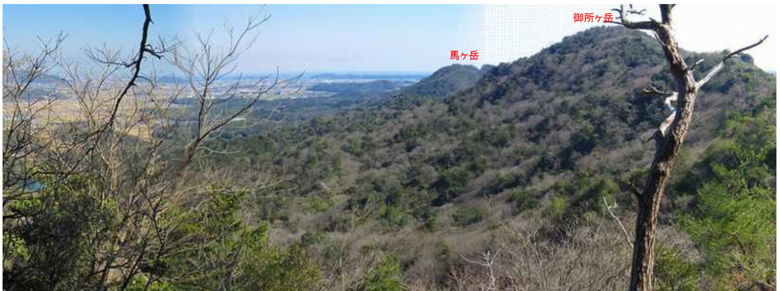
11:42 展望ピークからの展望。