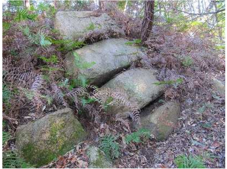
内部から見た左側の石積み。