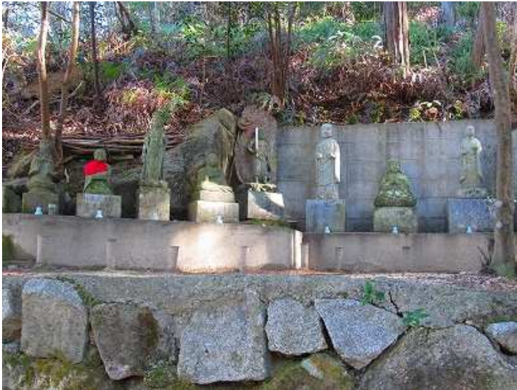
10:02 山手側に石仏が祀られている。