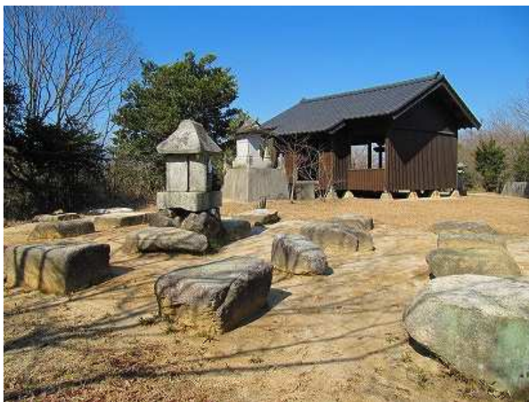
13:20 礎石の残る景行神社に到着。