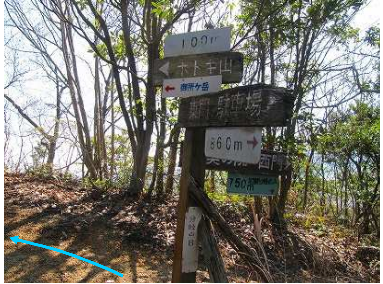
10:51 B分岐に出会い、左へ向かう。