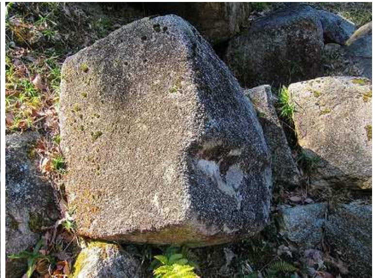
端部に窪みを付けられた石材。