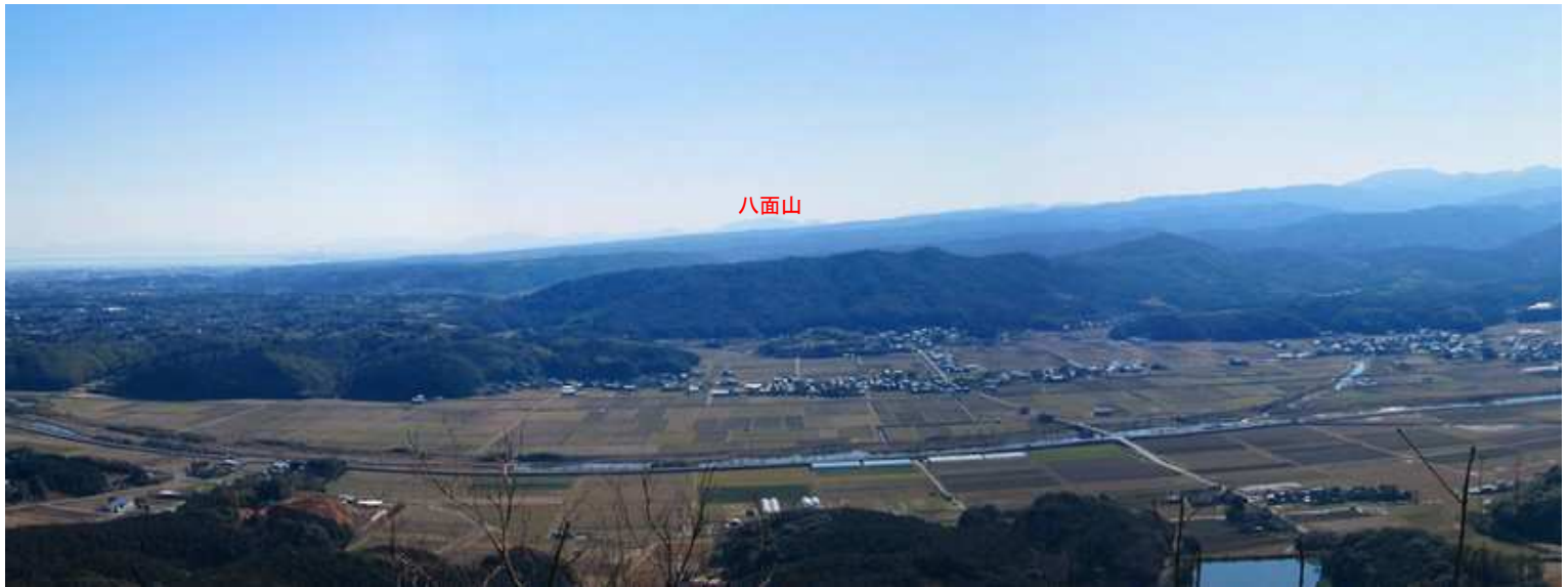
10:54 展望岩から南の展望(1)。