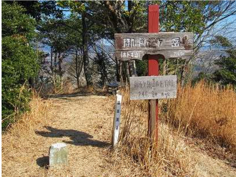
10:57 御所ヶ岳(247m)の山頂。別名:ホトギ山。三等三角点:木山が設置されており、南の展望が得られる。