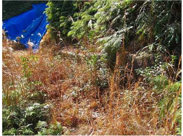
斜面に列石が認められる。