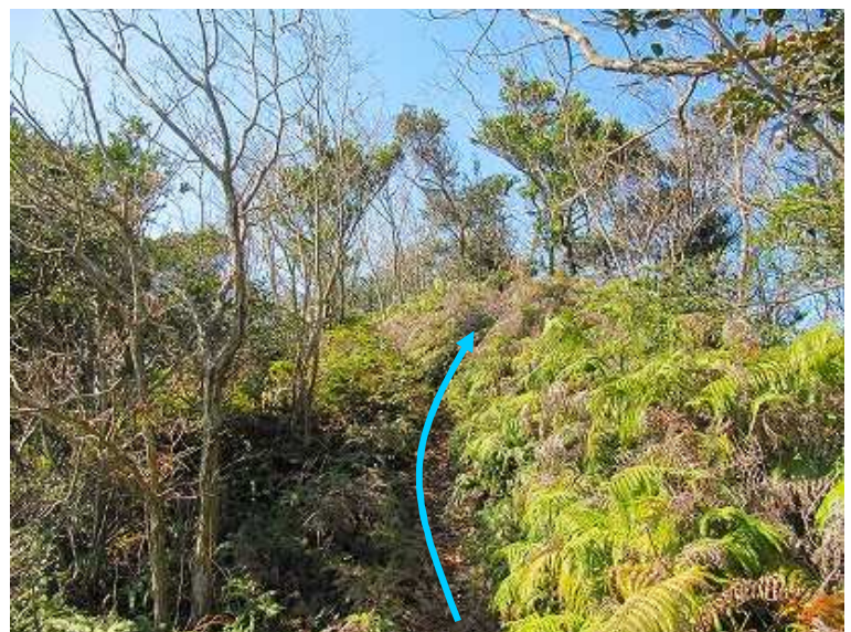
11:12 尾根筋を西へ向かう。