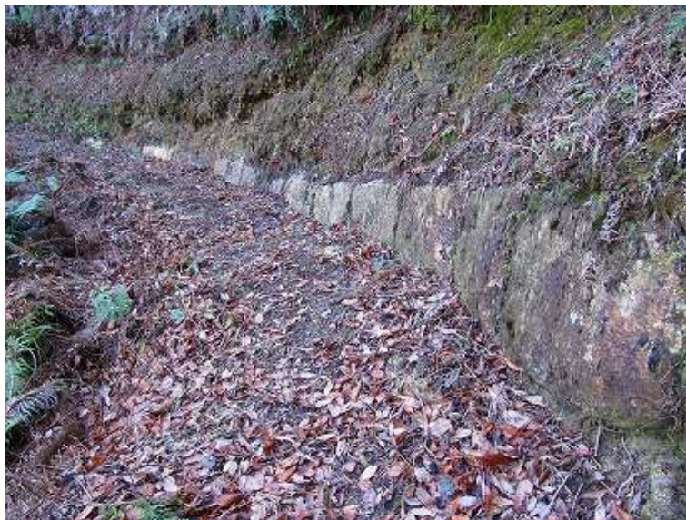
10:19 その先で左斜面に列石を見る。奥は斜面に埋もれている。