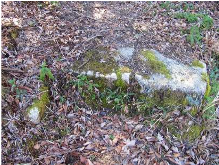
13:16 出口には加工石が並べられていた。