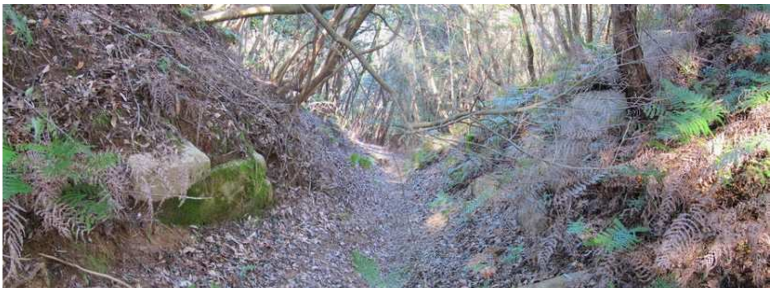
12:48 第2西門を外側から見る。