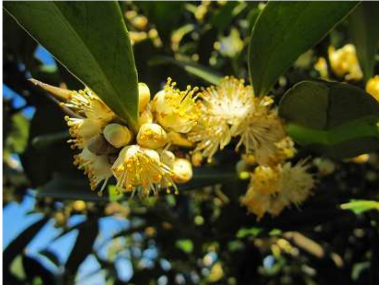
12:40 クロキの花が傍に咲いていた。