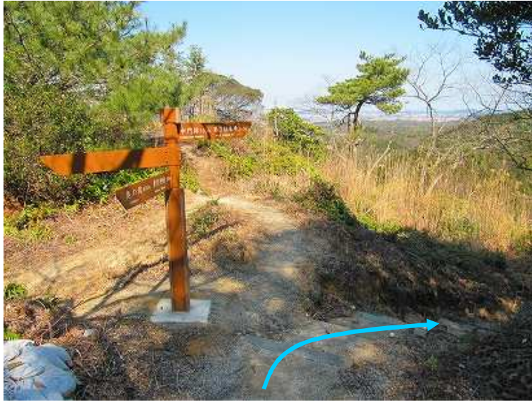
13:25 西門分岐に出会い右折する。