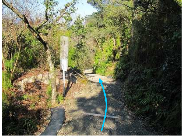
13:53 緩やかに下って行く。