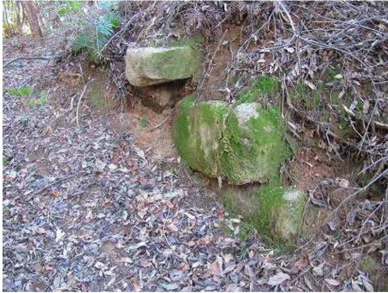
内部から見た右側の石積み。