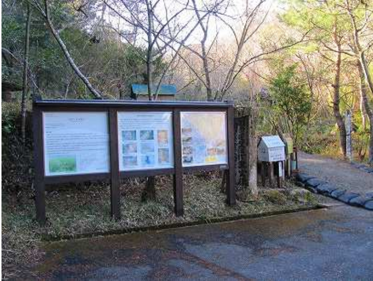
10:00 登山口に車を止め、案内板に目を通す。

登山口～東門～第二東門～B分岐～御所ヶ岳(247m)～第2南門～A分岐～南門～展望台～第2見張台～見張台～第2西門～西門～馬立場～奥の院分岐～景行神社～中門～登山口