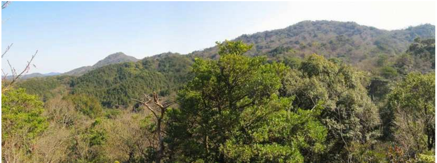
12:53 開けた尾根から東の尾根筋を望む。