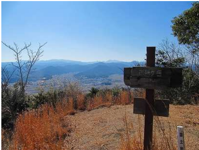
11:05 英彦山を望む。一休みした後、引返す。