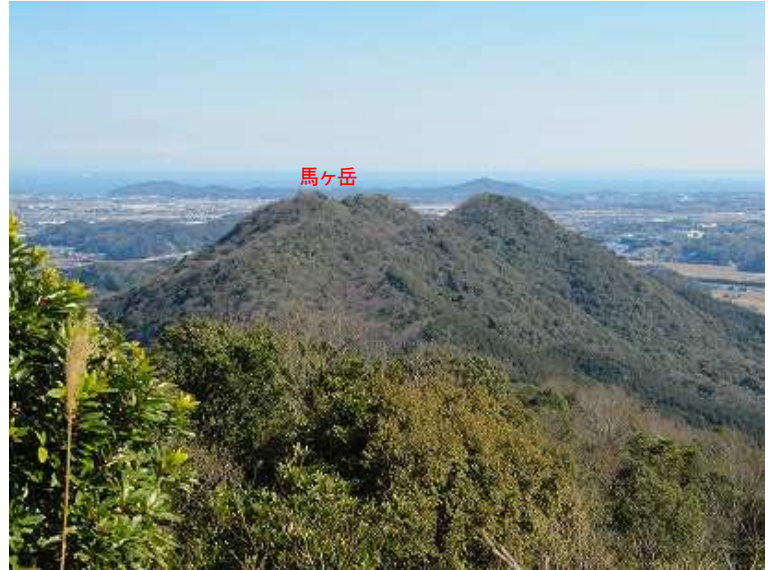
馬ヶ岳を望む。馬ヶ岳へは、尾根筋の縦走で行ける。