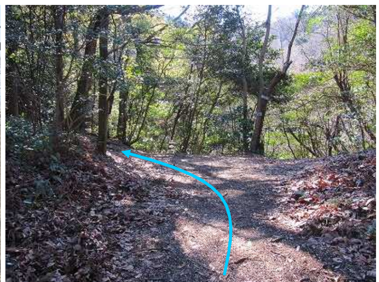
大師堂分岐に到着。水晶谷跡地とも言う。左へ尾根筋を伝う。