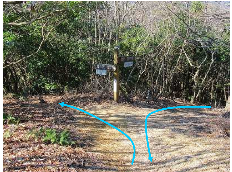
11:07 B分岐に戻り、左へ向かう。