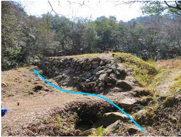
13:13 馬立場に到着。此処の石積みは、転石の野面積みで粗く幼稚に見える。背後は、平地で湿地であったか？