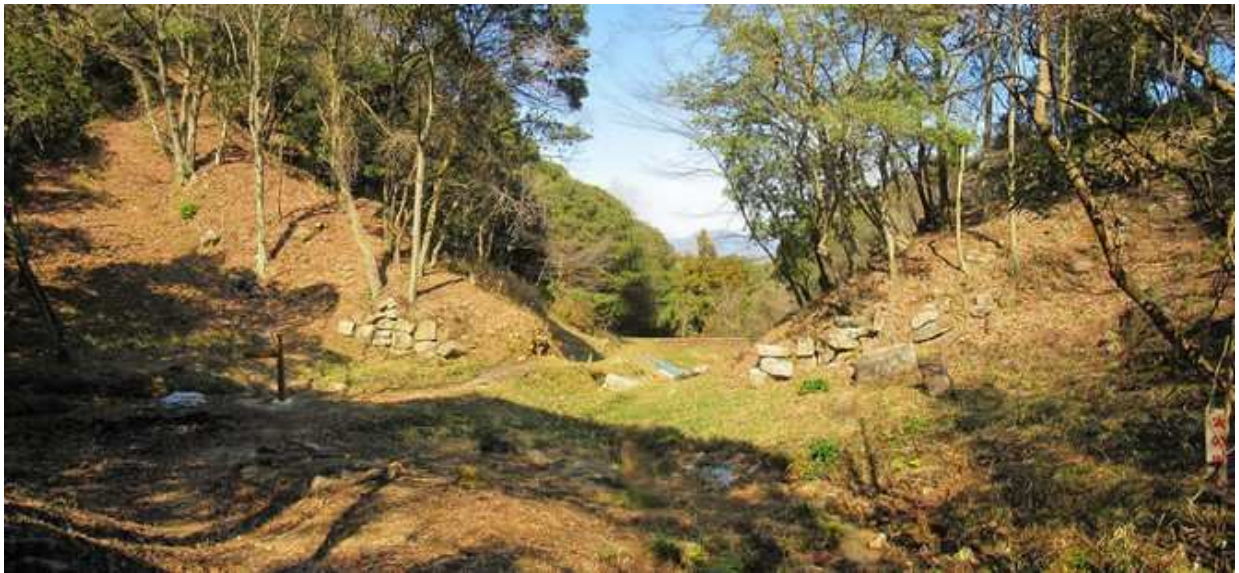
13:06 西門を内側から見る。