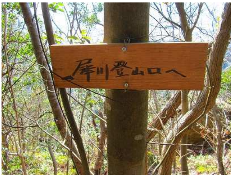
11:11 左に犀川分岐の案内板を見る。