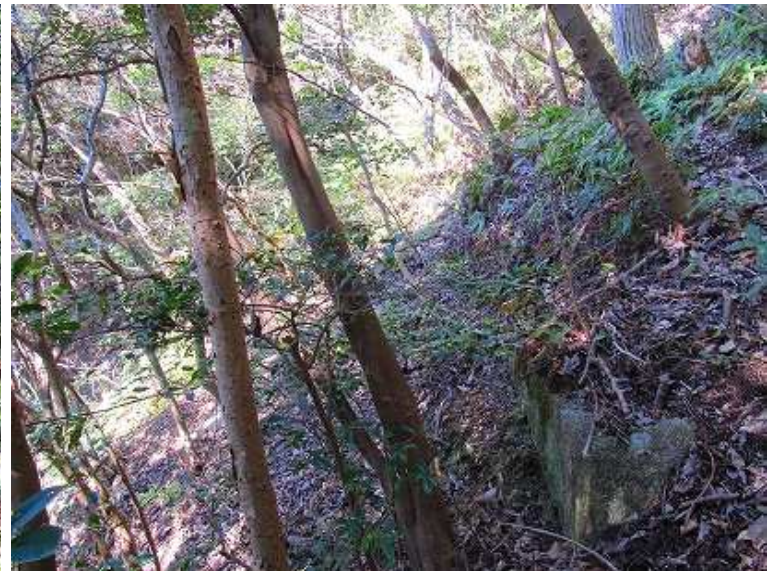
11:21 南側に第2南門の案内板を見る。斜面の弱い踏み跡を辿って50m程下るが、跡が見当たらず。引き返すと案内板傍の左斜面に切石を見つける。