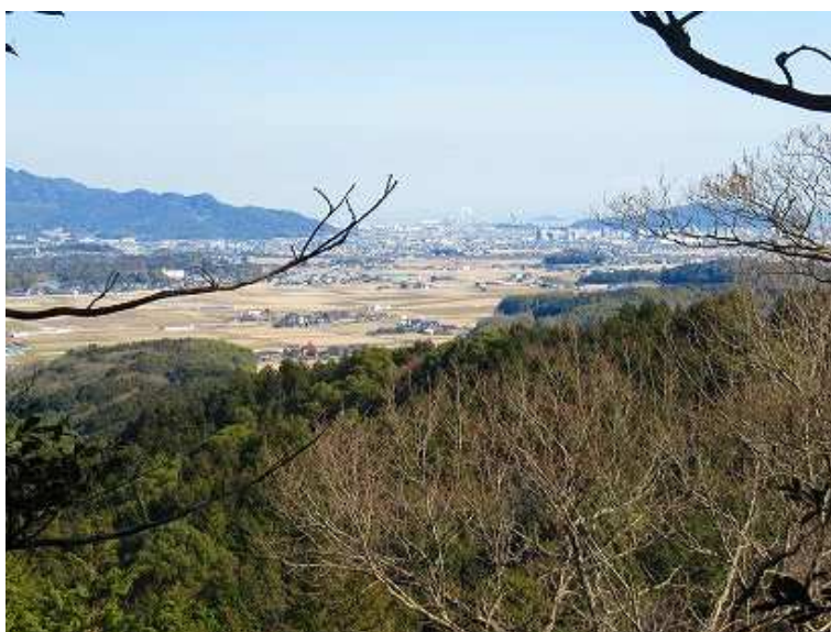
10:23 展望地から行橋市方面を望む。