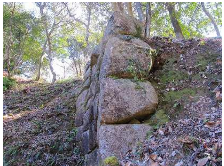
左側の石積みの断面。