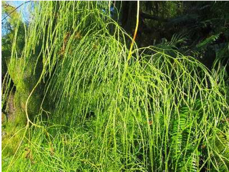
13:54 絶滅危惧種のヒモヅル。