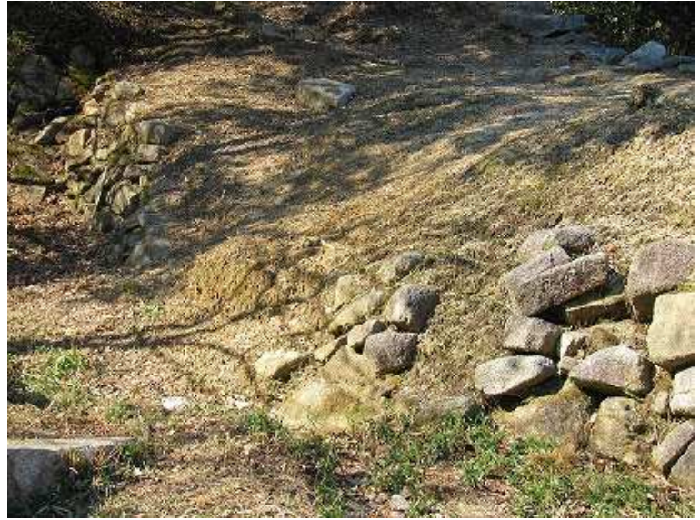
背後の石積みは雑に見える。