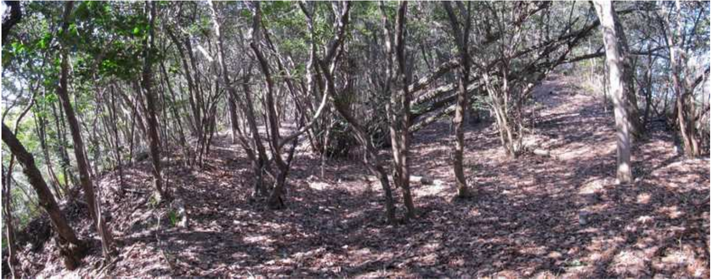
11:16 南側には小段状の平坦化した所が見受けられる。土塁の頂部で通路となっていたのか？