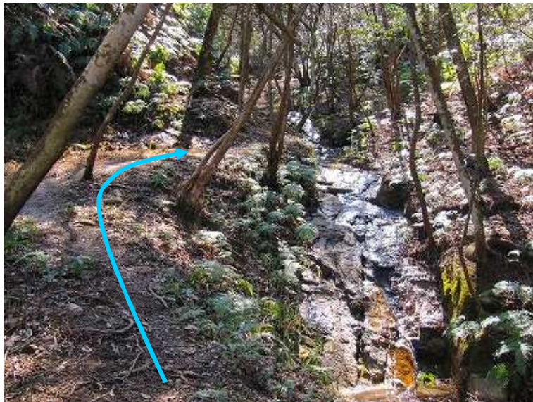
13:10 沢沿いに緩やかに行く。