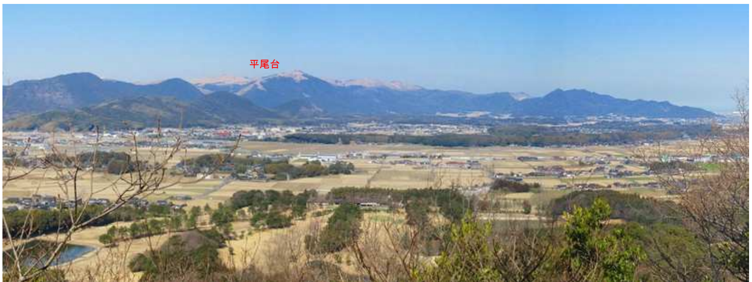
12:38 見張台からの展望。