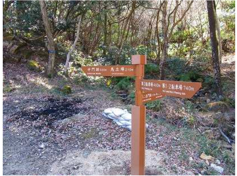
13:05 背後地に立つ案内板。