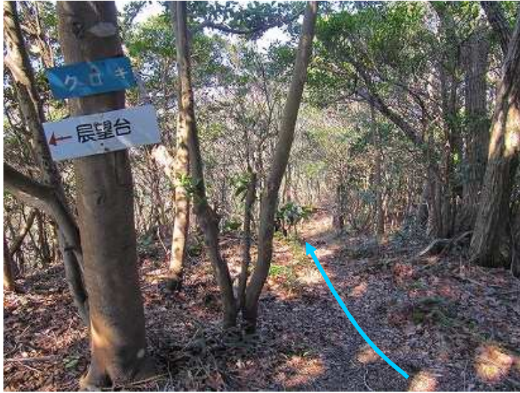
12:20 展望台から北の尾根筋を辿る。