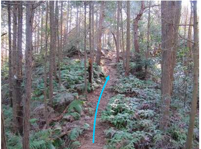
10:07 緩やかに尾根筋を上って行く。