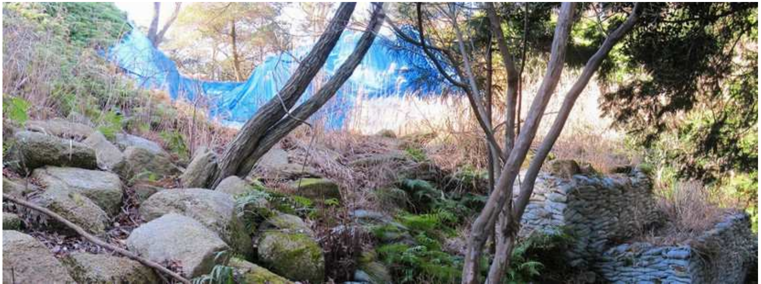
第2東門を谷側から見る。切石が散在している。