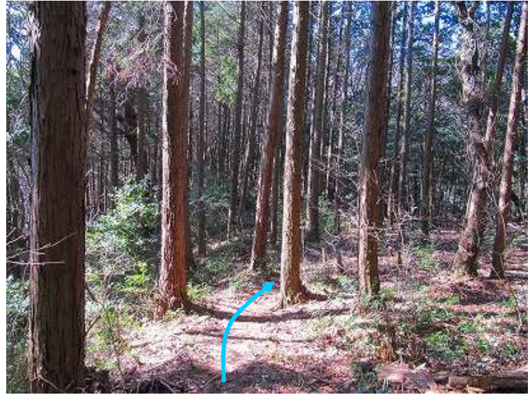
11:46 ヒノキの植林帯を抜ける。