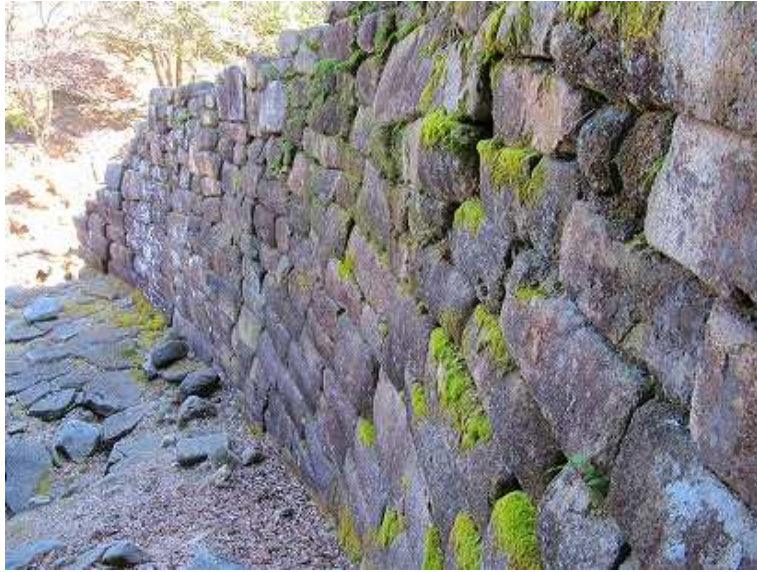
曲線状に構築している。