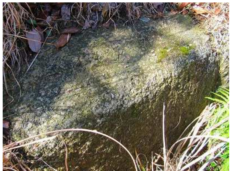
列石には窪みが見られる。