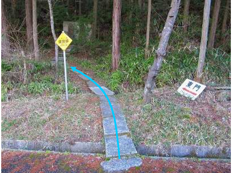
10:01 隣の東門の案内板から入る。