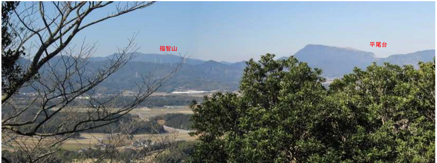
第2見張台からの展望。