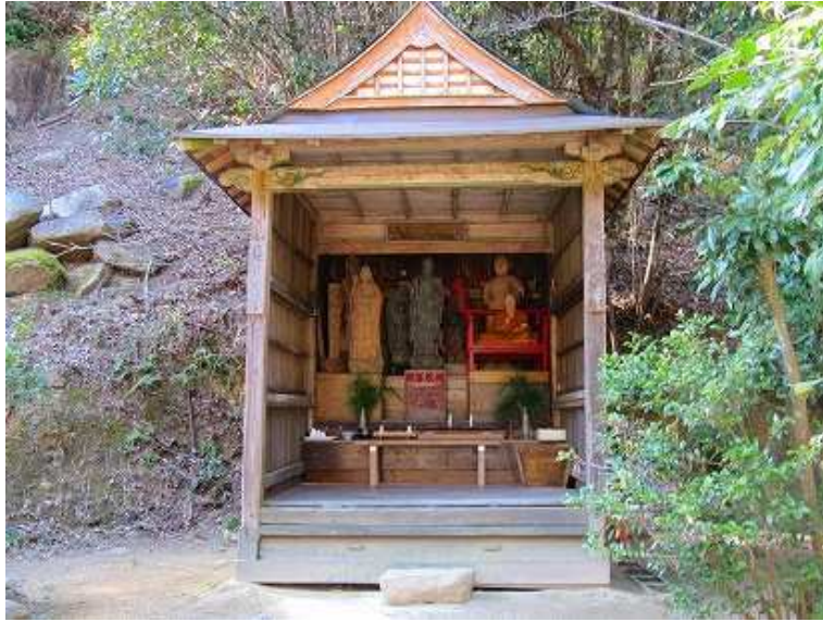
13:48 下流側に建つ第十九番地藏菩薩堂。