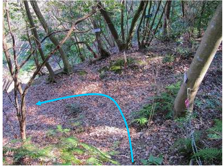
12:43 尾根筋から左の平場に下り左へ向かう。