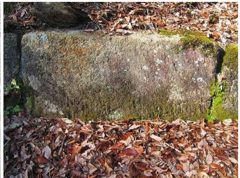
切石は80x40cm程に加工されている。