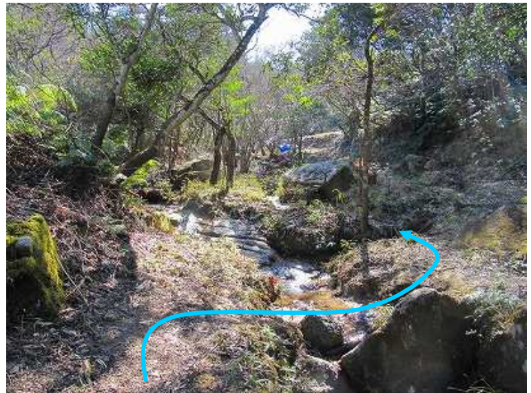
13:12 中門分岐を左に見て、渡渉して奥へ向かう。