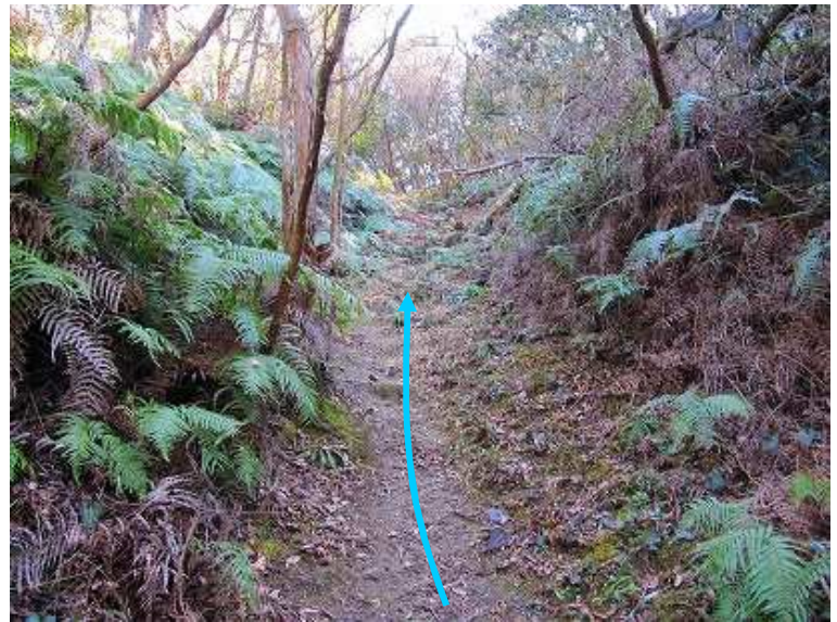
13:17 急坂を抜けると奥の院分岐に出会い左折する。