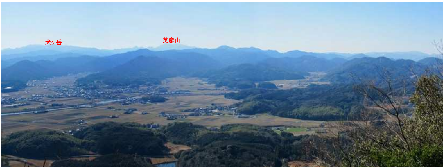
展望岩から南の展望(2)。