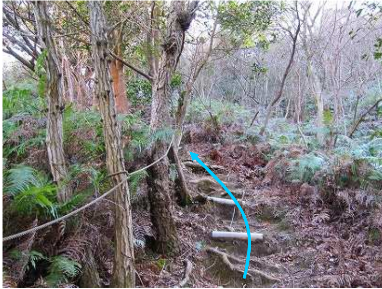
10:40 やや急な塩ビパイプの階段を上って行く。