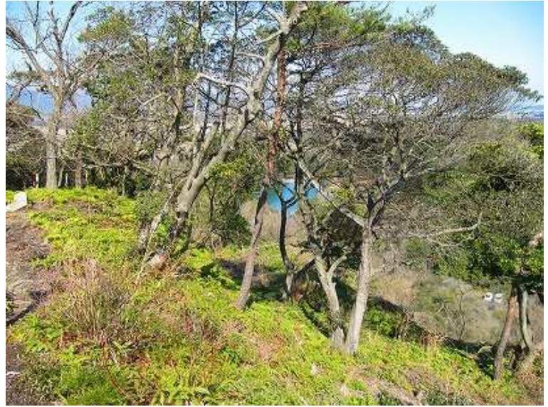
13:26 登山口と住吉池が垣間見えた。