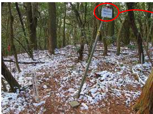
宮地岳(339m)の山頂。三等三角点:宮地岳が設置されているが、周囲を植林により囲まれ展望は得られない。