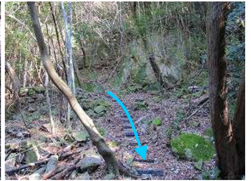
ブラ階段を下って来た。