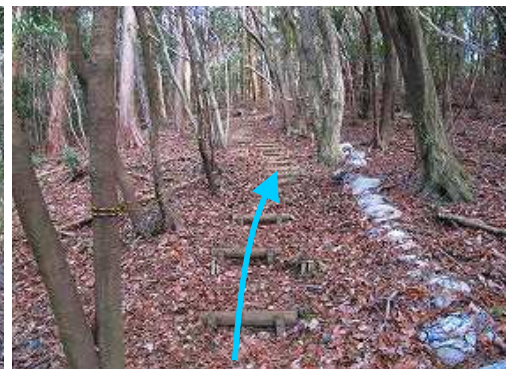
丸太階段を緩やかに登って行く。