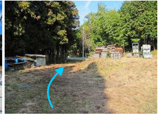
資材置き場の左を抜ける。