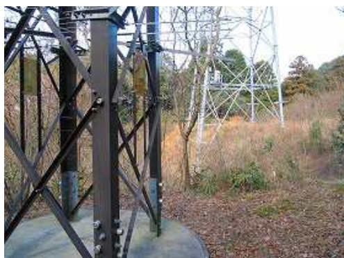
奥に60号鉄塔を見る。