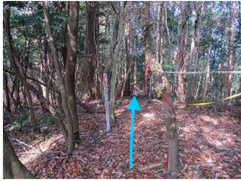
61号鉄塔分岐から北西の尾根に入る。