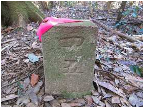
奥の蘆城城の跡へ踏み入ると45杭を見る。周囲に遺構らしき物は見当たらない。