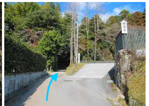
西方寺入口を通過し、その先を右折する。