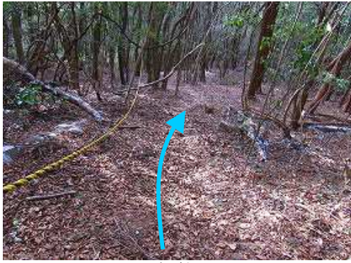
トラロープの斜面を下る。