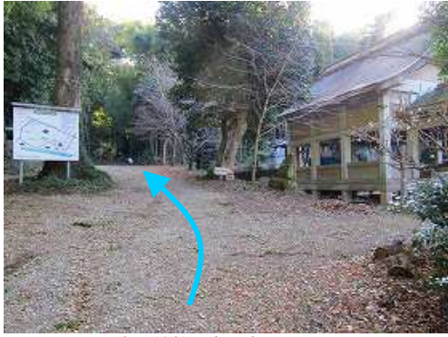
高木神社の奥に車を止める。