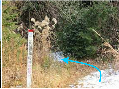
鉄塔の北側を下る。