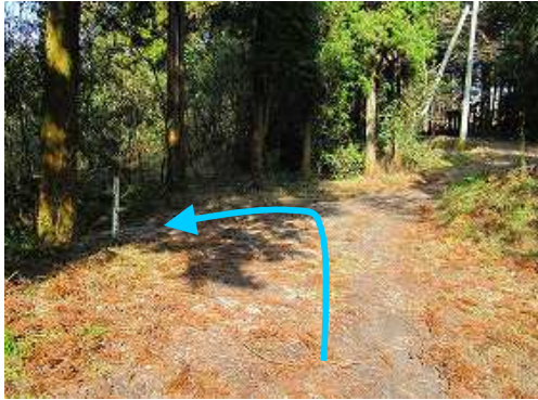
三叉路を左折する。