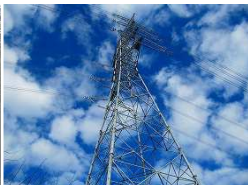
62号鉄塔が聳え立つ。