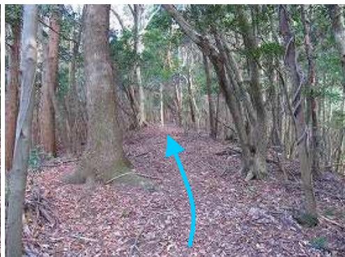
尾根筋を北北東へ向かう。