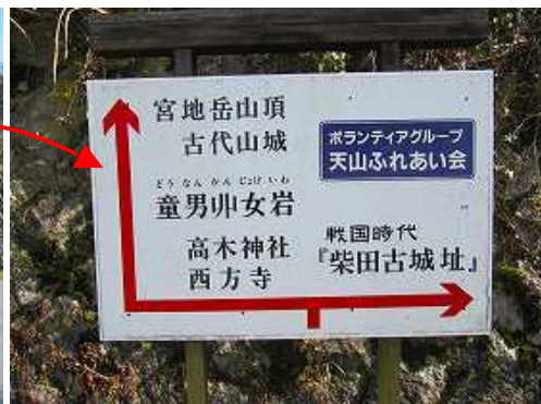
徳分24号から岸岳を眺める。