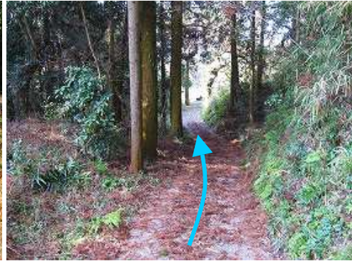
道なりに下って行く。