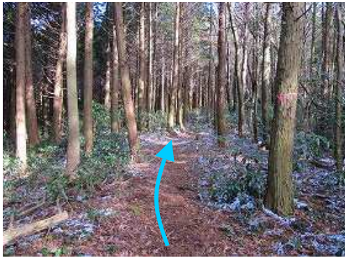
ヒノキの植林帯を行く。