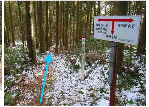
中阿志岐分岐を通過する。