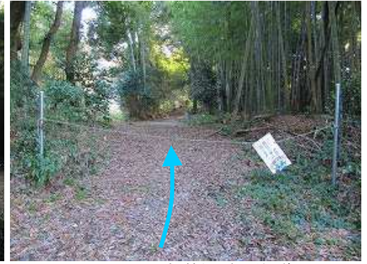
天山登山口 トラロープを越えて奥へ続く道へ入る。