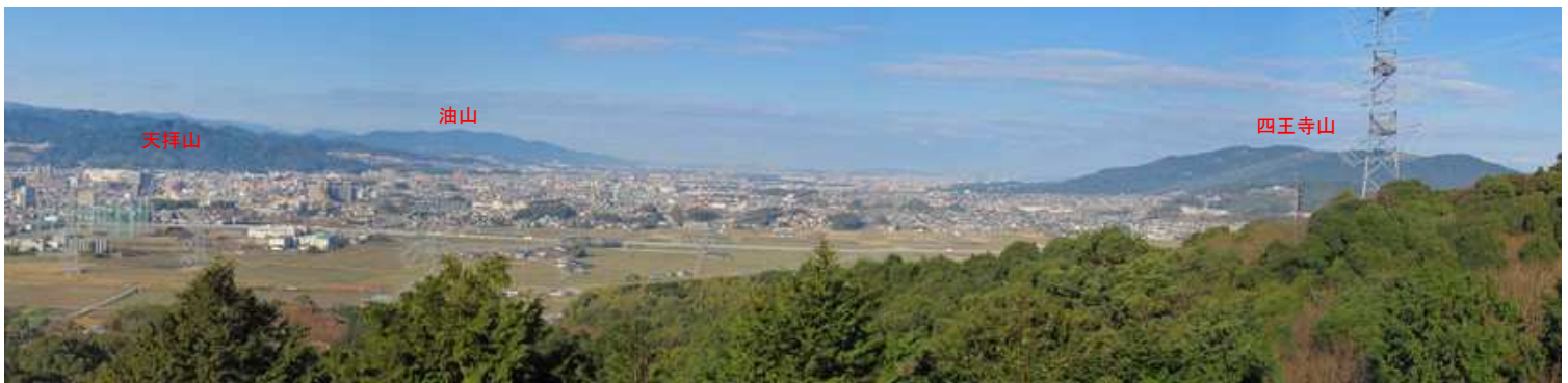
童男卯女岩からの展望(2)。