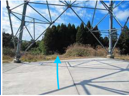
鉄塔の下を抜ける。