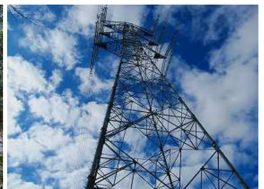
62号鉄塔を通過する。