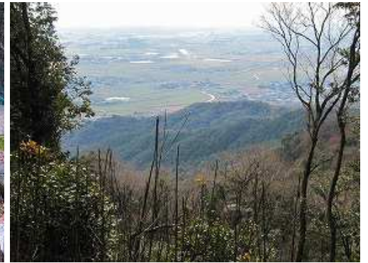
南が開け山家方面が望める。