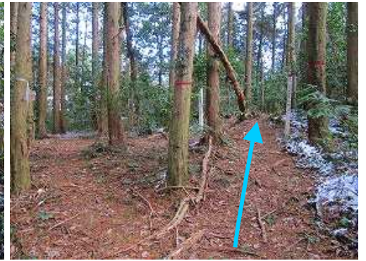
63号鉄塔分岐 右へ向かう。