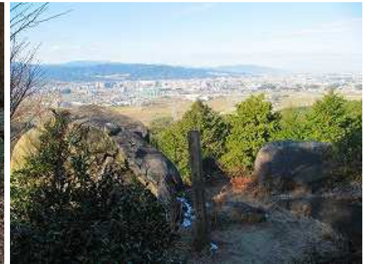
徐福伝説が残る童男卯女岩に到着。