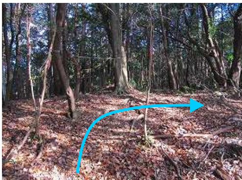
61号鉄塔分岐を右へ向かう。