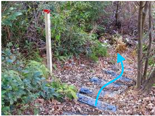
九電巡回路のブラ階段を下る。