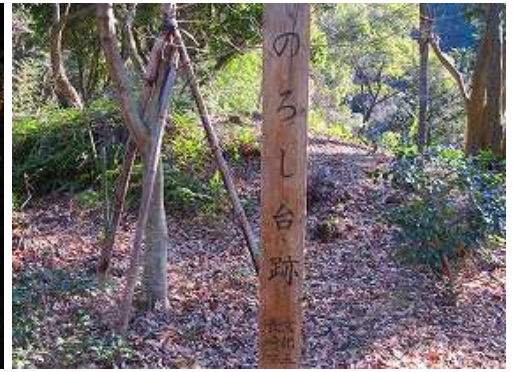
近くには烽火台跡がある。