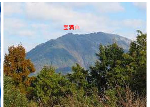
北に宝満山を望む。