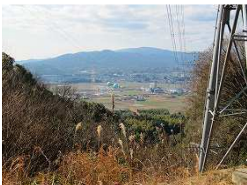
60号鉄塔からの展望。