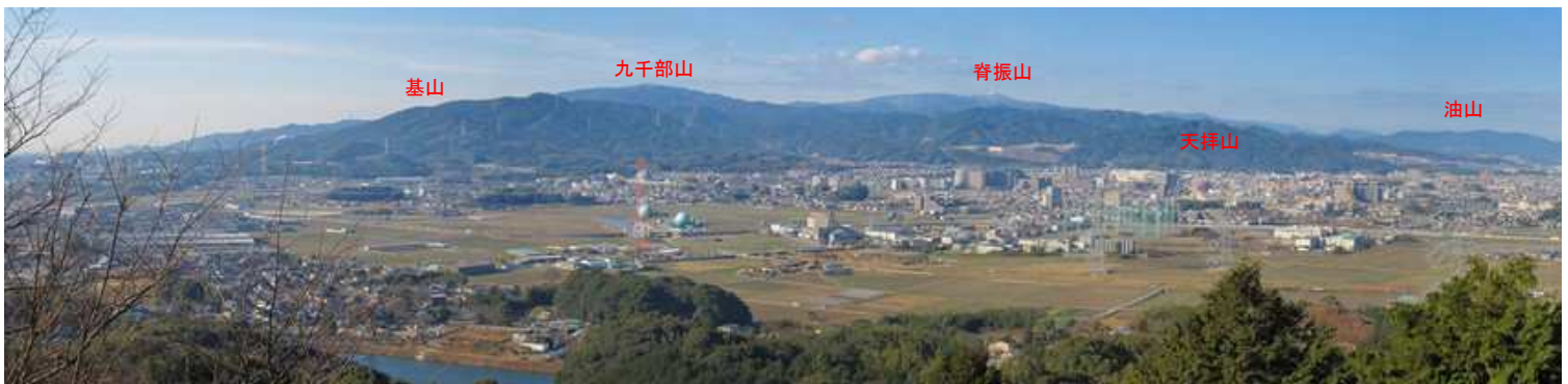
童男卯女岩からの展望(1)。