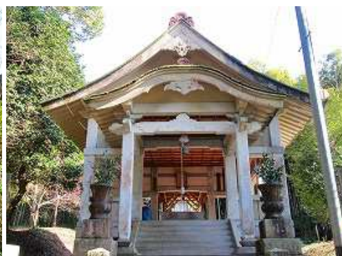
高木神社に参拝する。