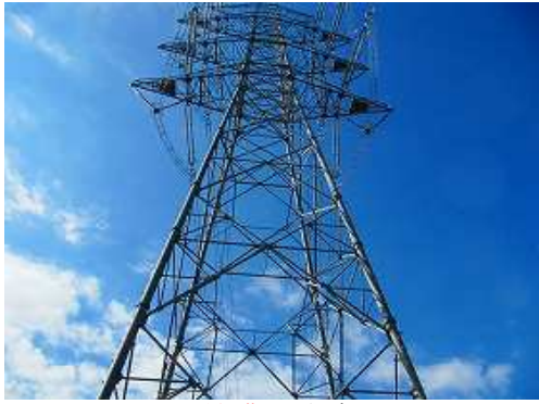
59号鉄塔を見上げる。