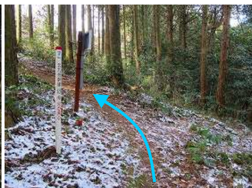
中阿志岐分岐を通過する。