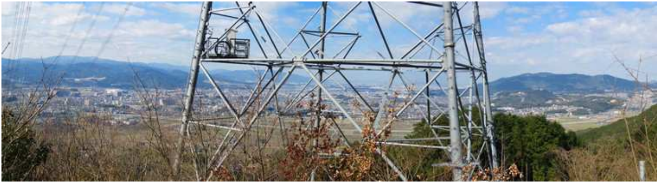
61鉄塔からのパノラマ。