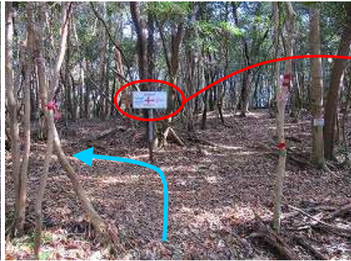
尾根出合に達する。