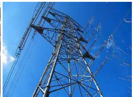
60号鉄塔を見上げる。