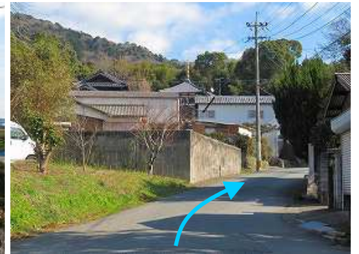
東へ緩やかに上って行く。