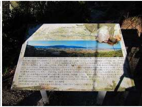
友好門に立つ童男卍女岩の案内板。