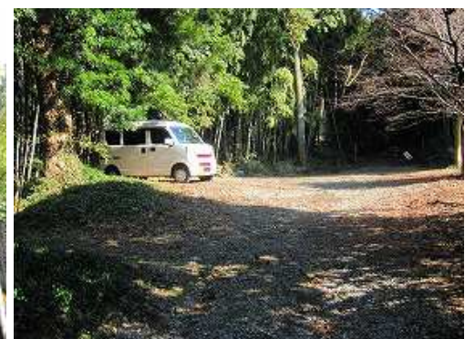
高木神社左側の駐車地に帰り着いた。