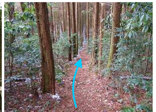
ヒノキの植林帯を引き返す。