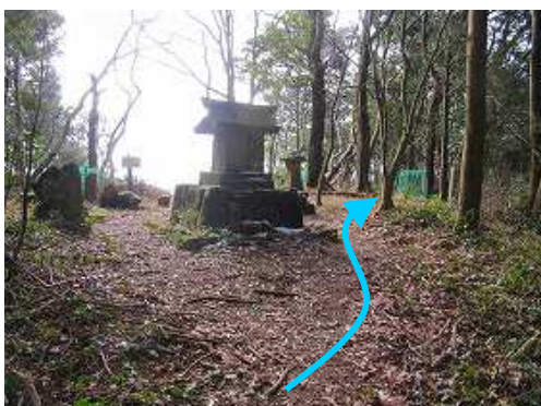
宮地岳神社祠を通過する。