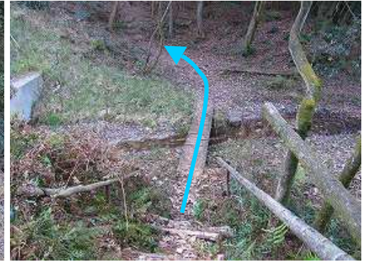
左に砂防ダムを見て流れを渡る。