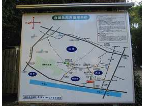
傍に立つ案内板に目を通す。