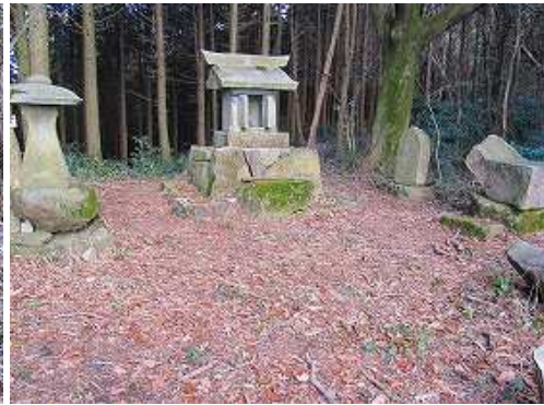
宮地岳神社祠に到着。