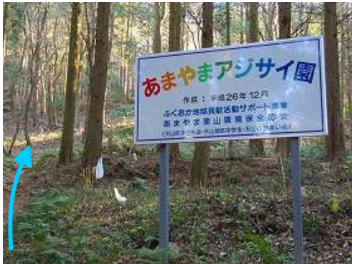
あまやまアジサイ園を緩やかに登って行く。