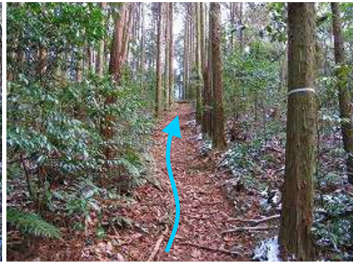
ヒノキの植林帯を緩く上る。