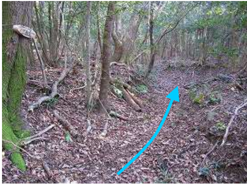
緩やかに登って行く。