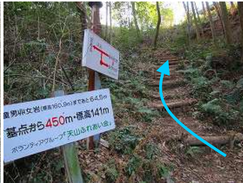
やや急な丸太階段を上り詰める。