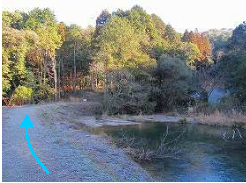
溜池の土手に行く。