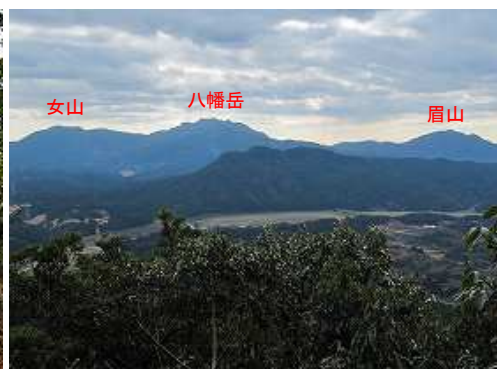
展望岩から南の展望。