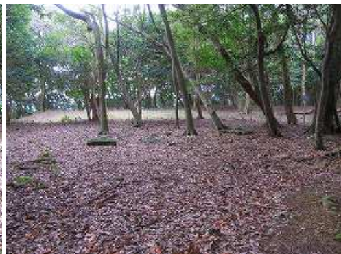
尾根筋で最大の平坦地である。