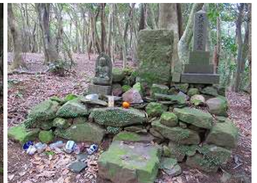
本丸の奥に慰霊碑がある。