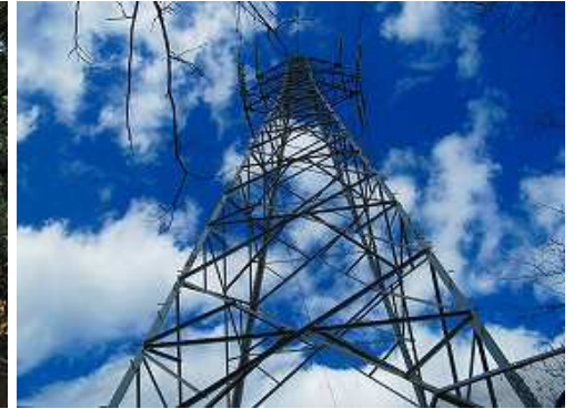
岩屋1号 を通過する。