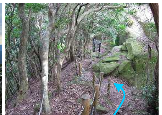
ヤセ尾根の先に姫落し岩が見えた。