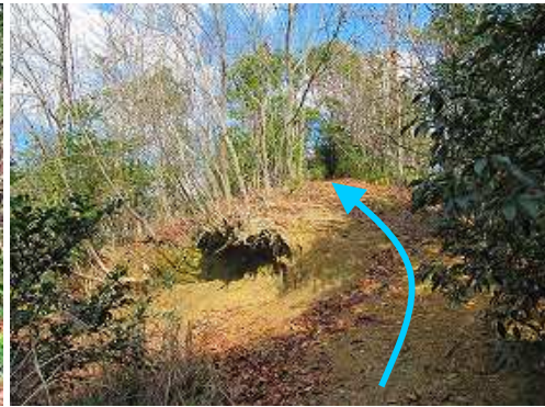
明るい支尾根に行く。