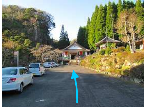
前方に法安寺が見えて来た。