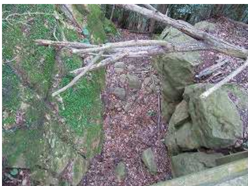
岩を削り取った堀切である。