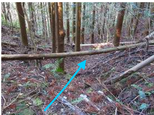
荒れた 谷筋 を下る。