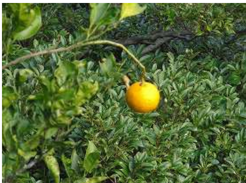
姫落し岩の傍で見つけたダイダイ。