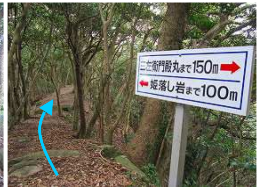
痩せた尾根筋に行く。