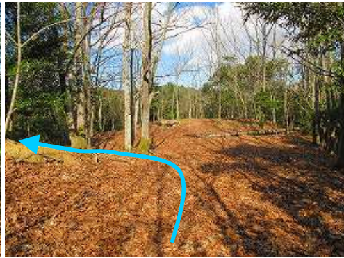
左の 徳須恵25号 に取付く。