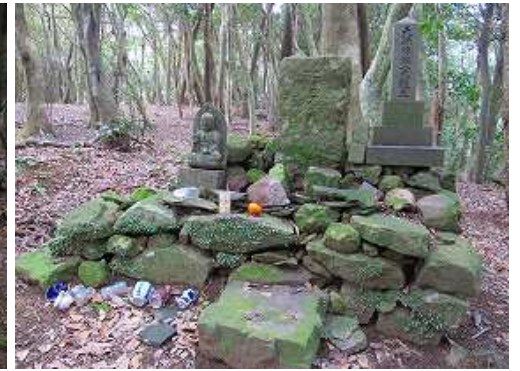
本丸の奥に慰霊碑がある。