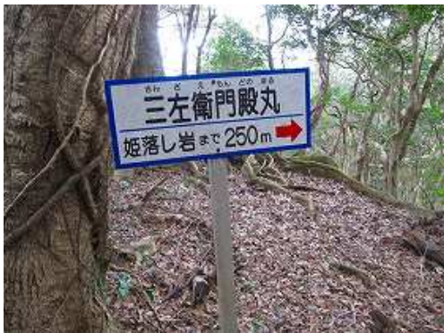
三左衛門殿丸に到着。