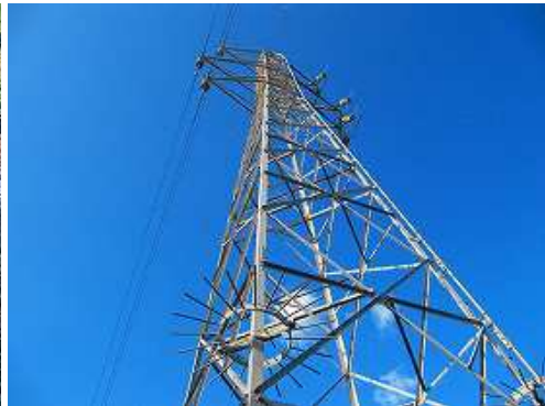
徳須恵28号を通過する。