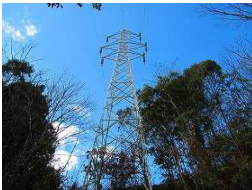
徳須恵26号 を通過する