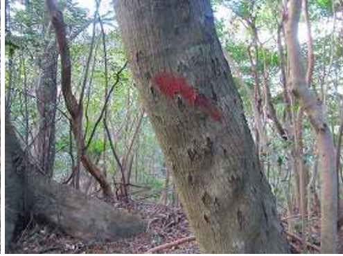
尾根上のこの印から右折して下って行く。