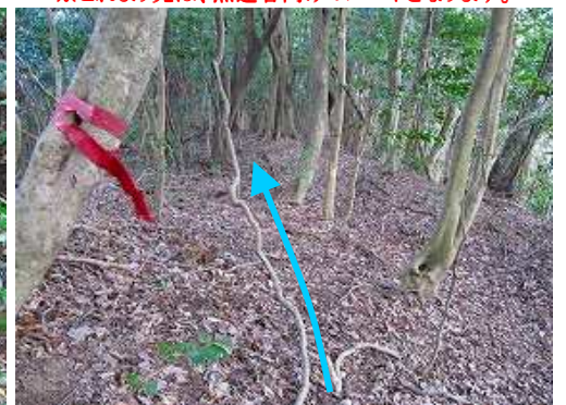
赤テープを拾いながら尾根筋を下って行く。