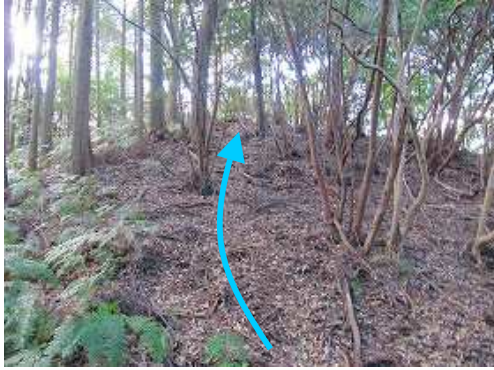
緩く斜面を登って行く。