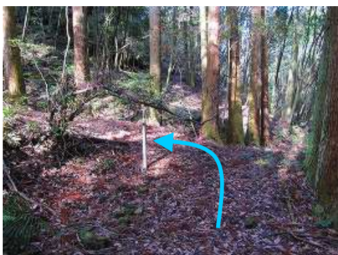
その先の 標柱 で、沢沿いから 左折 する。