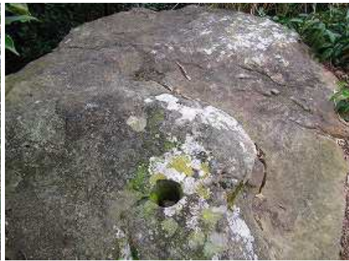
直径8cm程の穴の開いた石が旗竿石。