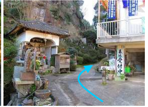
奥へ続く道へ入る。