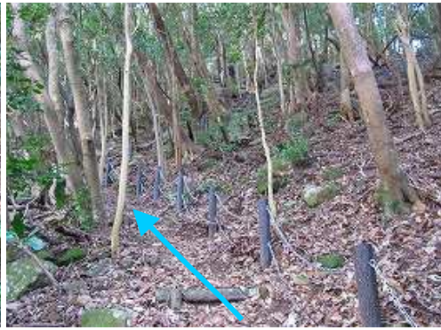
斜面の擬木階段を登って行く。