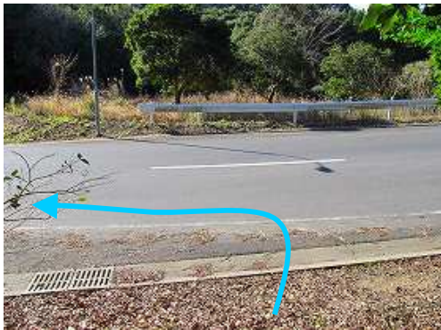
道路に出会い、左へ向かう。