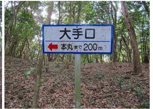
大手口を通過する。