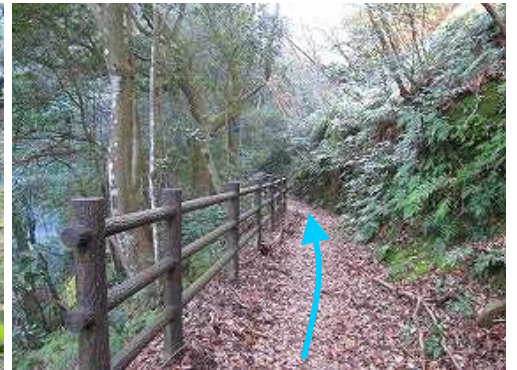
擬木の柵沿いに行く。