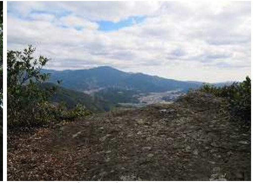
右側から岩の上上がる。