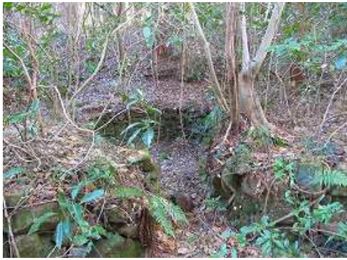
右に炭焼き窯跡を見る。