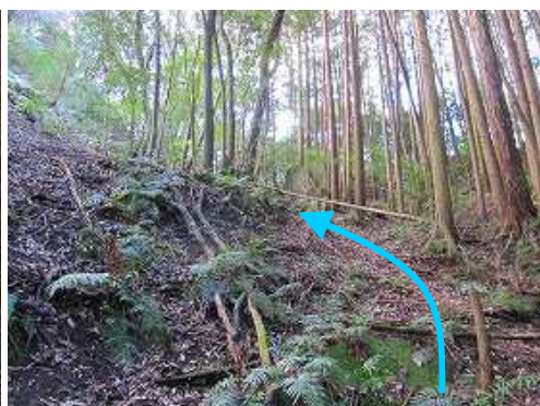
植林帯の際に登って行く。