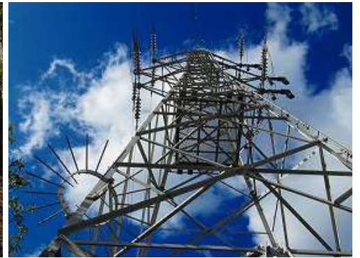
徳須恵25号 を通過する