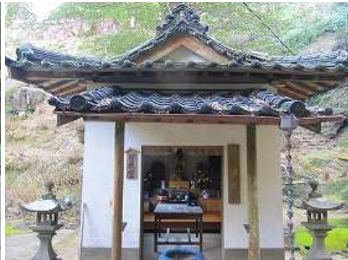
法安寺の旧本堂に参詣して、傍の登山口に取付く。