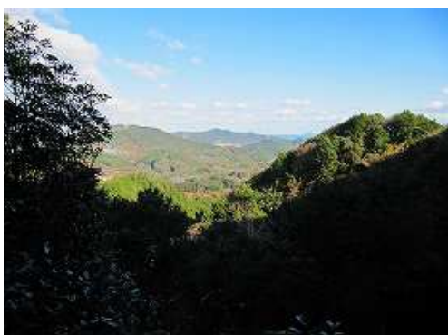
展望地からの北の眺め。