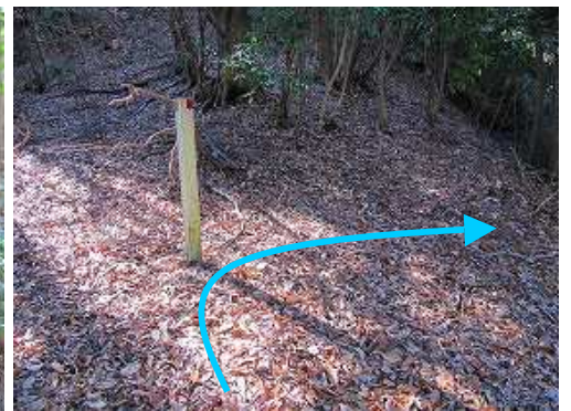
尾根上の 鉄塔標柱 から 右折 して谷筋を下る。