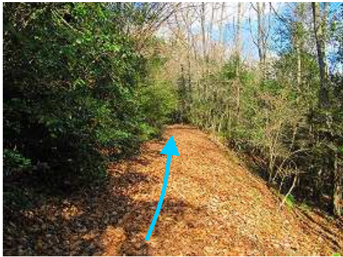
落ち葉の積もる 作業路 を行く。