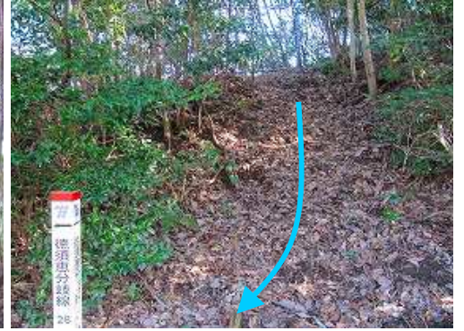
フェンスに沿って下って来た。