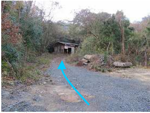
道なりに進むと前方に 作業小屋 が見えた。