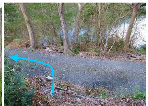
作業路に出会い左へ向かう。