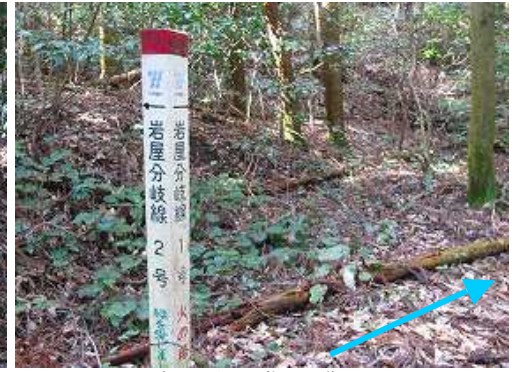
岩屋1号を目指して進む。