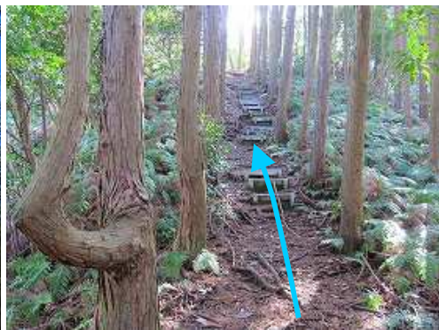
植林帯の ブラ階段 を登って行く。