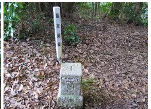
近くに四等三角点：岸岳(GL=270m)が設置されており、西側の展望が得られる。