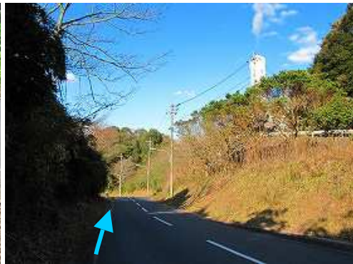
道路を下って行く。