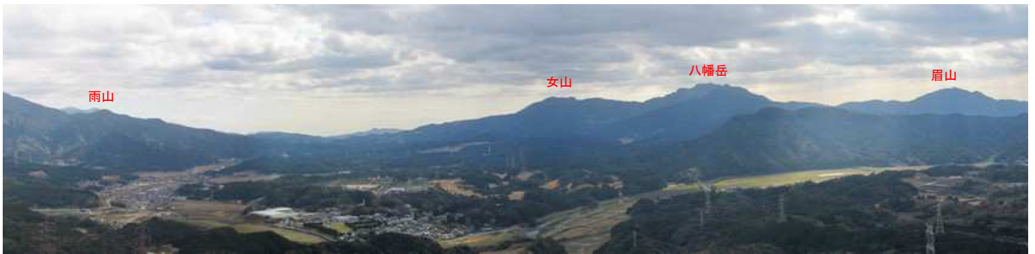
姫落し岩からのパノラマ(2)。