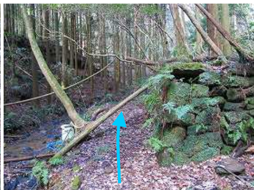
沢沿いに建つ 住居跡 の脇を抜ける。