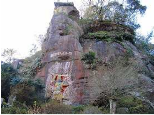
左の岩場に彫られた、お不動さんや涅槃像、仏さん等を眺めながら先へ進む。