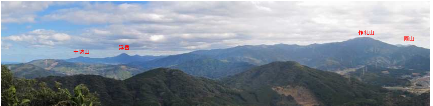
姫落し岩からのパノラマ(1)。