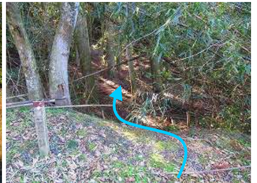
左側に立つ徳須恵29号標柱から竹やぶへ入る。