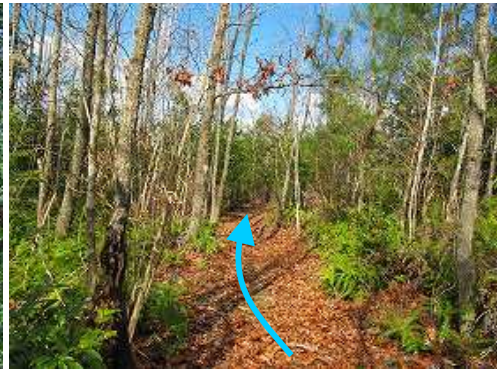
雑木林を抜けて行く。