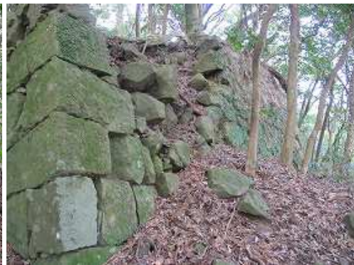
算木積の石垣が残っている。