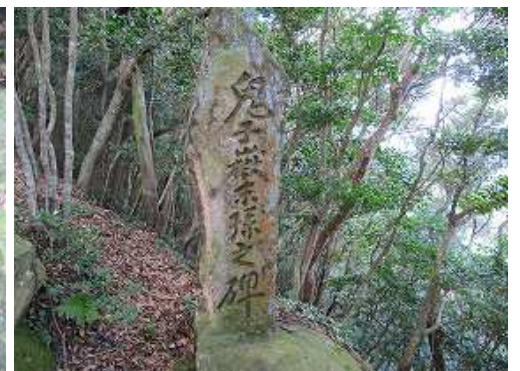
尾根筋端部に立つ鬼子嶽末孫之碑。 ※これより先は、熟達者向けのルートとなります。