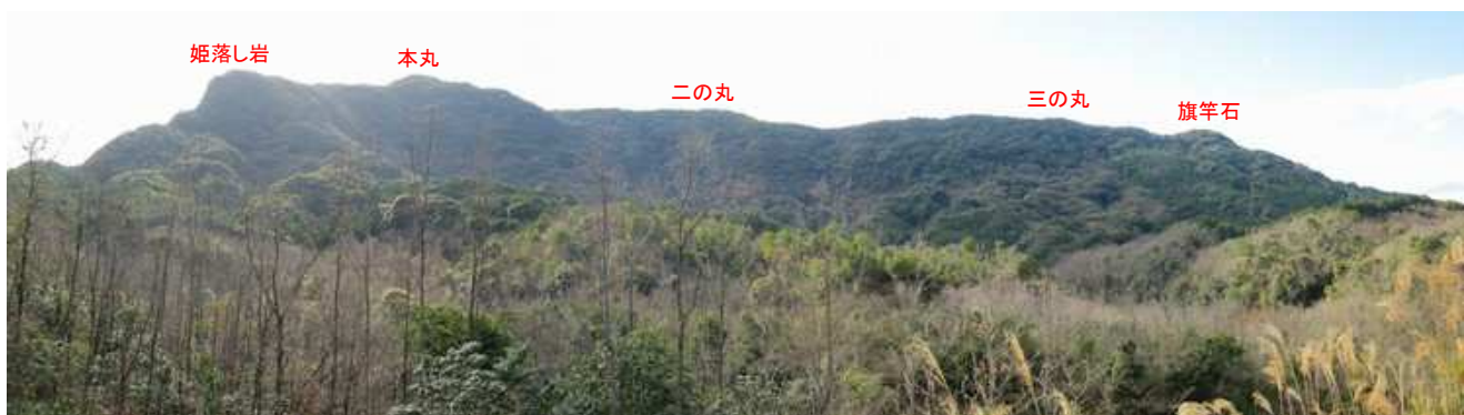
徳分24号から岸岳を眺める。