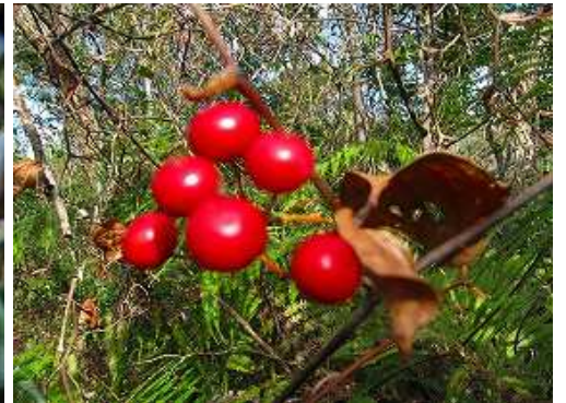
サルトリイバラの実