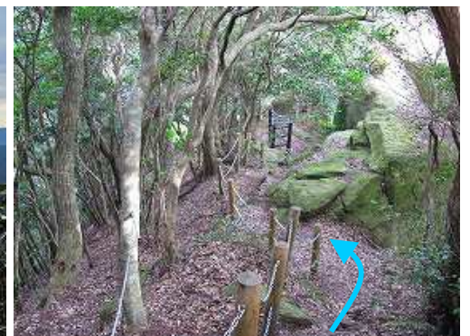
ヤセ尾根の先に姫落し岩が見えた。