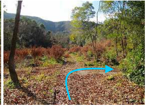
十字路を 右折 する。