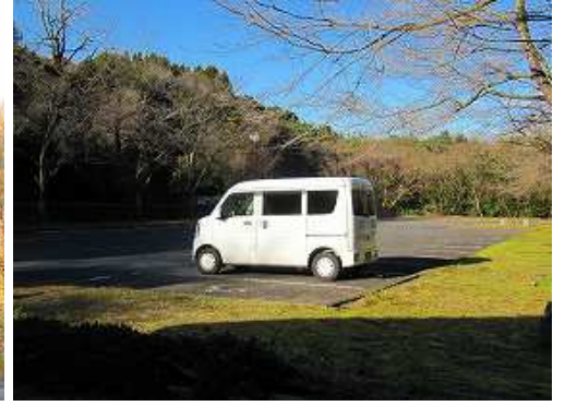
岸岳ふれあい館の駐車場に帰り着いた。