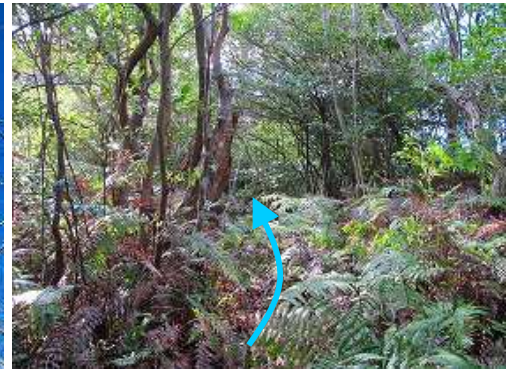
シダを掻き分けて行く。