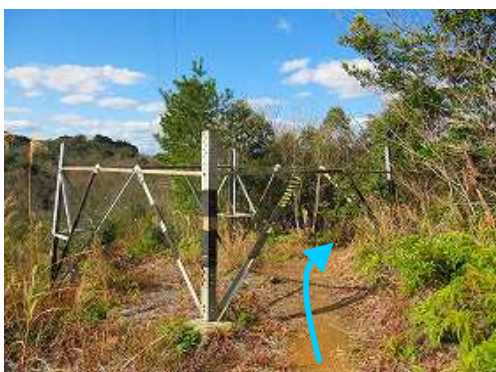
古い鉄塔の下を抜ける。