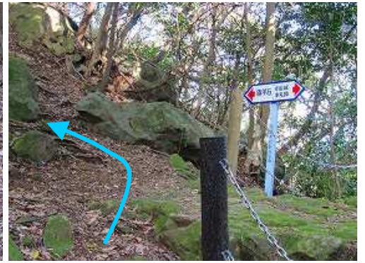
尾根筋の旗竿石分岐に出合い、左へ向かう。