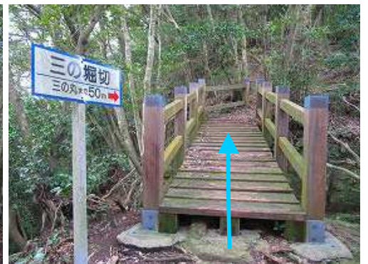
三の堀切の木橋を渡る。