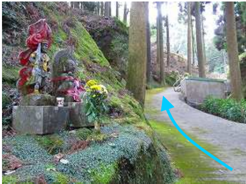
緩やかに舗装路を登って行く。