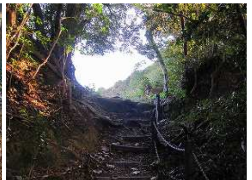
展望地に上り着いた。