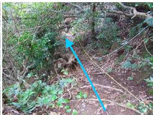
トラロープの急斜面を降る。