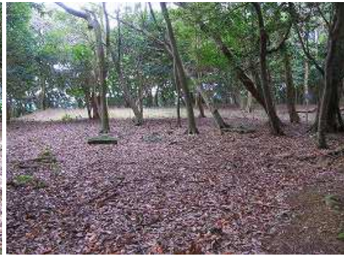
尾根筋で最大の平坦地である。