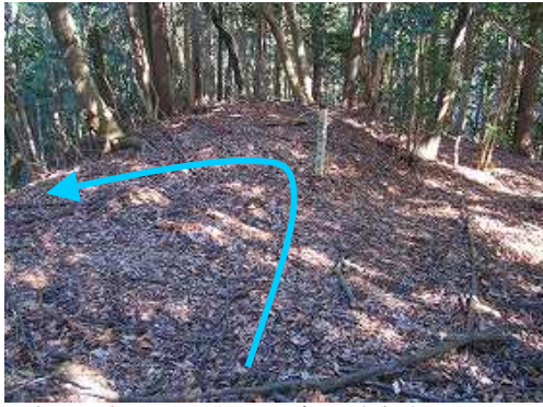
尾根上の 岩屋1号分岐 をに出会い、左折する。これから先は、九電の鉄塔標柱を確認しながら行く。