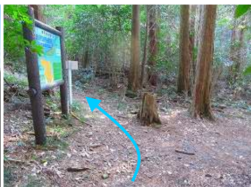
茶園の平分岐を左折する。