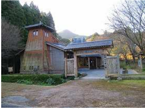
岸岳ふれあい館の駐車場に車を止める。

岸岳ふれあい館～旧本堂～展望地～茶園の平分岐～旗竿石分岐～旗竿石～三の堀切～二の堀切～本丸～姫落し岩～岩屋1号分岐～作業路出合～住居跡～右折～道路出合～徳須恵29号入口～徳須恵29号出口～岸岳ふれあい館