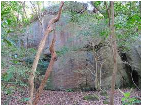
左手に大岩を見る。