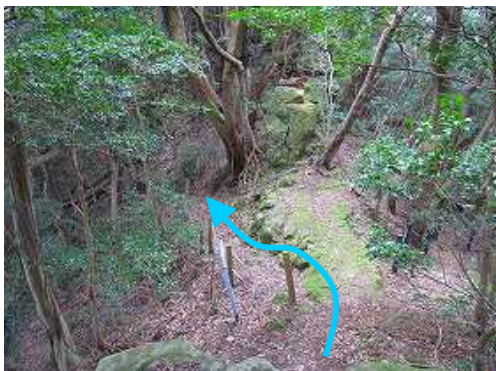
旗竿石分岐を通過する。