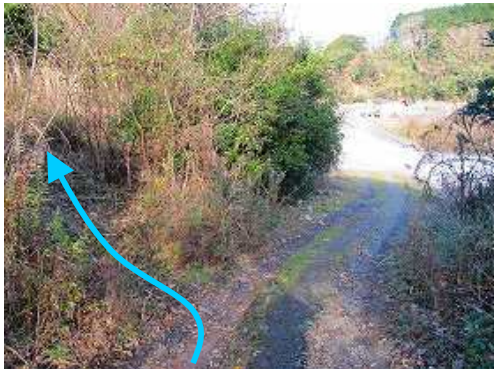
直ぐに左側の徳須恵28号に取付く。