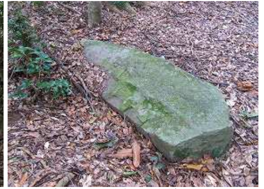
尾根筋では、切出された石を随所で見える。