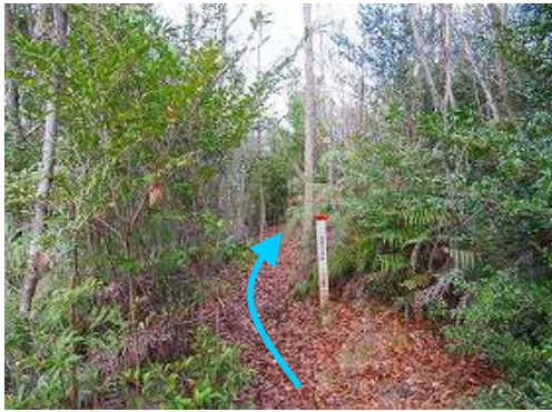
徳分24号を目指して道なりに行く。