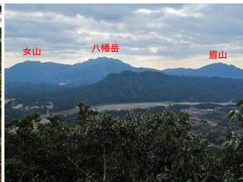
展望岩から南の展望。