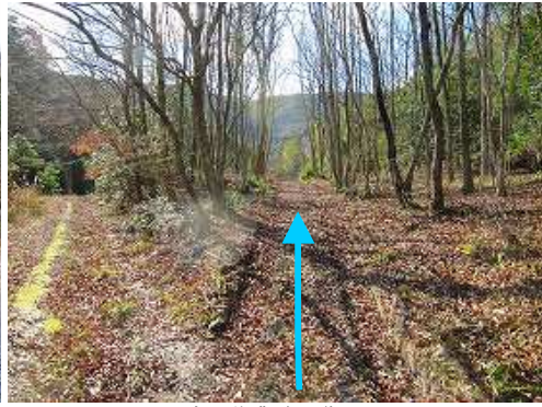
右の 作業路 を進む。