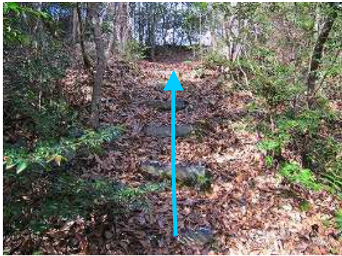
ブラ階段を登って行く。