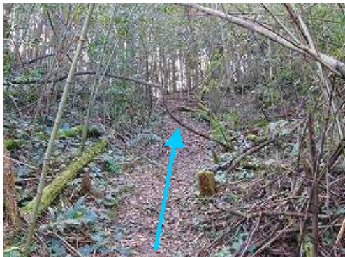
緩やかに斜面を登る。