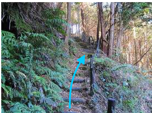
擬木階段を登って行く。