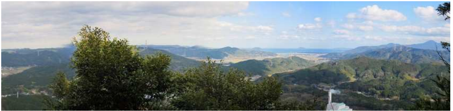
旗竿石から北の展望。