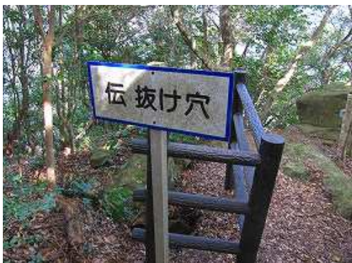
姫落し岩の傍にある抜け穴。