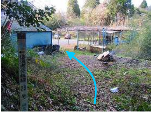
徳須恵29号標柱が立つ出口に出る。