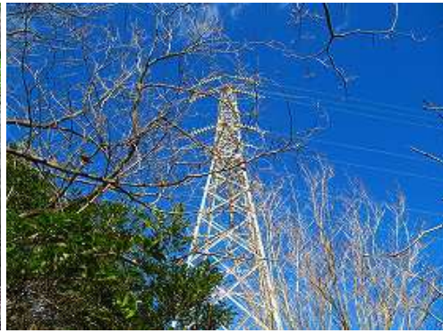
徳須恵27号を見上げる。