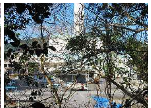
枝越しに 唐松清掃センター を垣間見る。