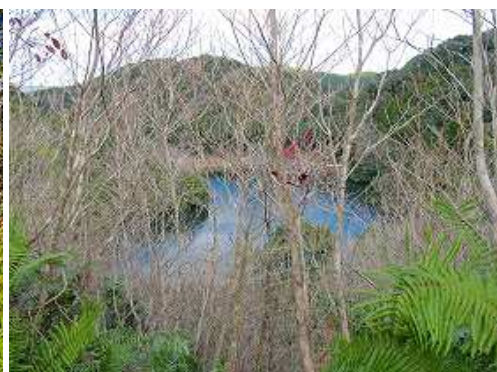
枝越しに溜池を望む。