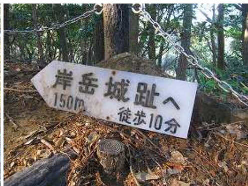
岸岳城趾への案内板を見る。