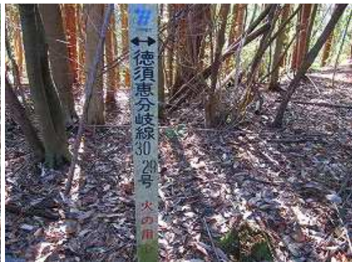
この標柱から左折する。