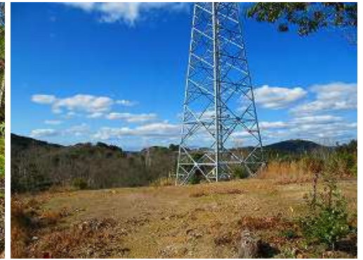
広っぱに 徳分24号 が聳え建つ。