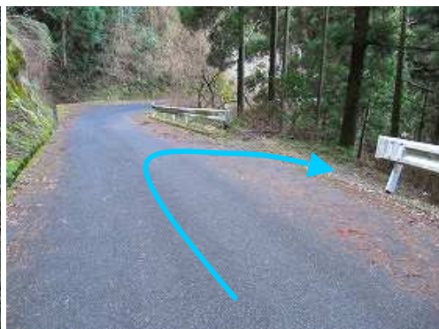
車道から右へ折れる。