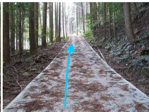
作業路を緩く登って行く。