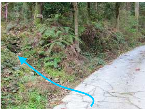
直ぐに左側の脇道に入る。