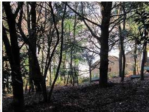
右下に「ふれあいの家 北筑後」の建物が垣間見える。