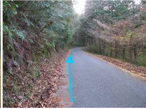
林道を道なりに歩いて行く。