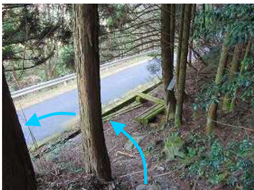
車道に降り立ち左へ向かう。