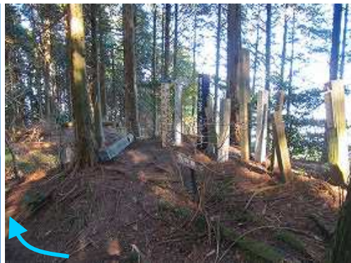
登頂記念標柱の左を下って行く。