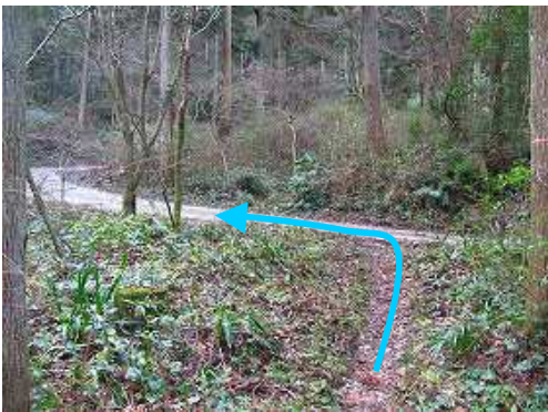
直ぐに作業路に出会い、左折する。