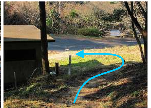
第2登山口が見えた。