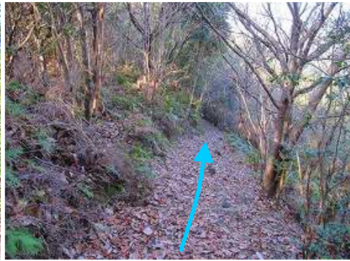
落ち葉の丸太階段を緩く下る。