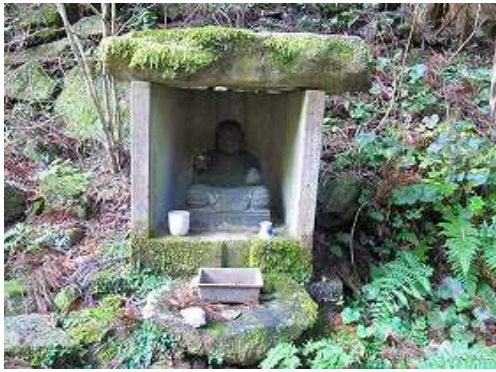
傍に石仏を安置した祠を見る。