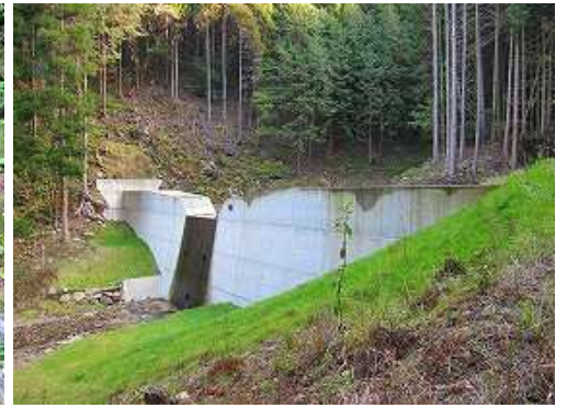
左の沢に新設の砂防ダムを見る。