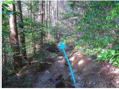
荒れた浸食路を下る。