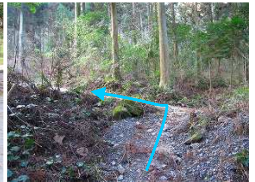
また作業路に出会い、左折する。