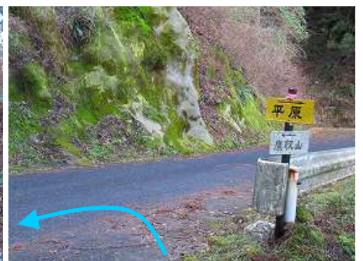
車道に出会い、左へ向かう。