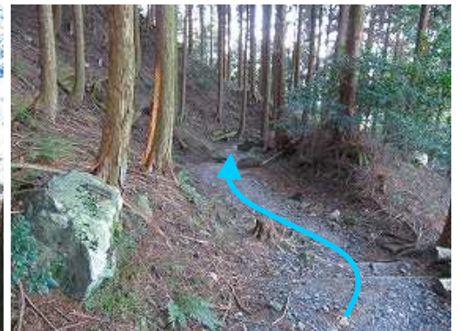
植林の中をジグザグに降って行く。