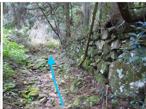
石垣の横を抜ける。