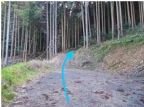
是より本格的な山歩きとなる。