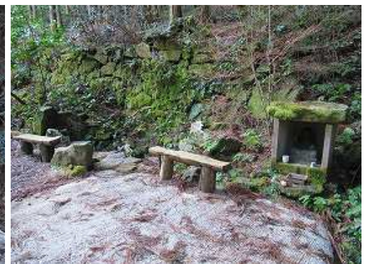
右にえぐ水を見る。