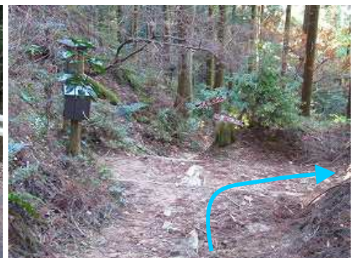
えぐ水分岐から右の尾根筋に入る。