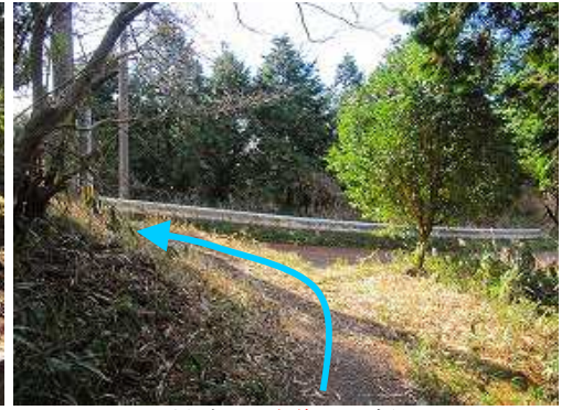
頂上直下で車道2に出会う。