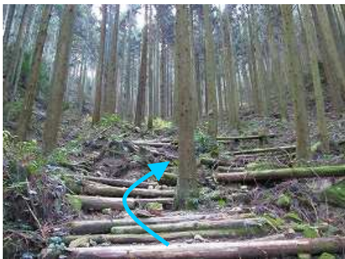
植林帯の丸太階段を登って行く。