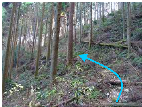
前方が明るくなってきた。