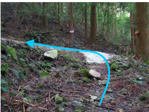
また作業路に出会い、左折する。