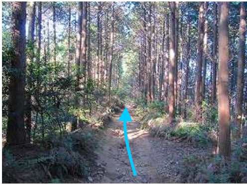
スギの植林帯の平坦路に行く。