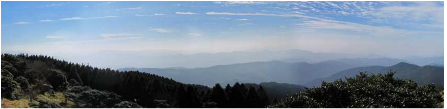
山頂から南の展望。