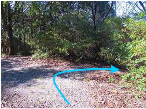
分岐2 直ぐ右へ下る。