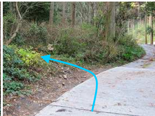
直ぐに左側の脇道に入る。