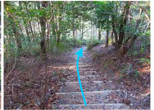
丸太階段を降って行く。