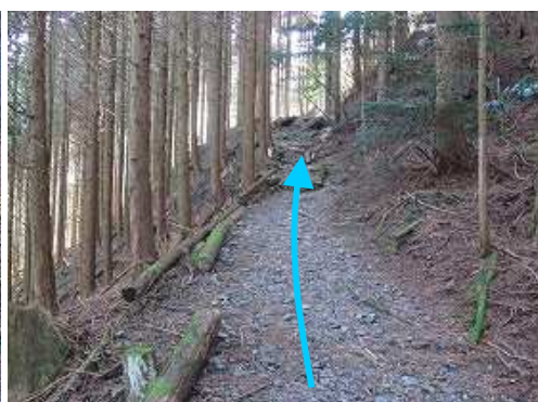
植林の中をジグザグに登って行く。