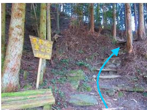
車道から右の斜面に取付く。