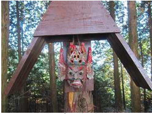
移設された「山の神」を右に見る。