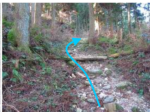
尾根筋を緩やかに登って行く。