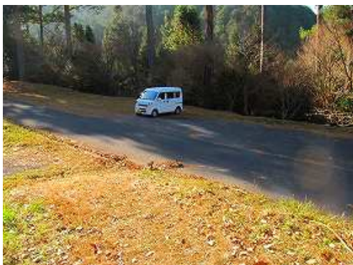
第2登山口駐車場に帰り着いた。