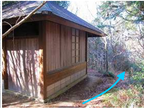
休憩所の脇を抜ける。