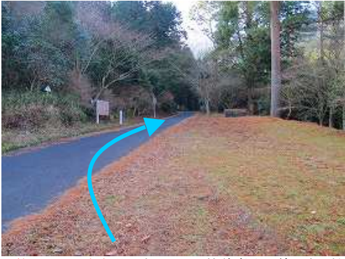
第2登山口駐車場に車を止め、林道鷹取山線を歩き始める。