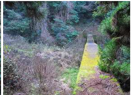
砂防ダムの右岸側に行く。