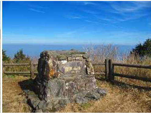
鷹取山(802m)の山頂。一等三角点：耳納山が設置されており、北と南の展望が得られる。