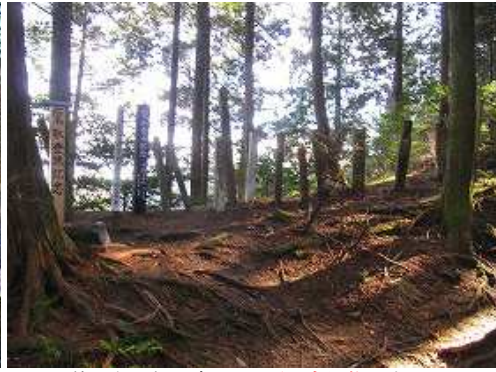
傍の左尾根に多くの登頂記念標柱が立つ。