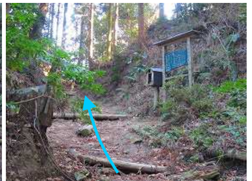
えぐ水分岐に出会う。