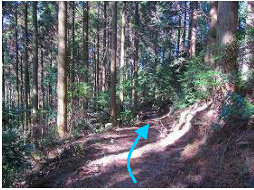
尾根筋を緩やかに降って行く。