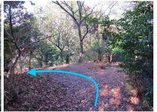
分岐3 左へ下って行く。