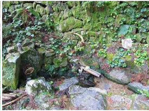
甘い水が湧き出している。