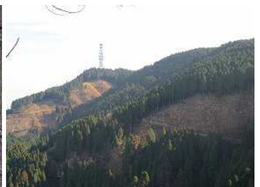
展望地から東の尾根の送信塔が望まれる。