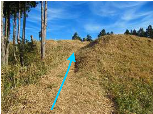
草付斜面を登って行く。