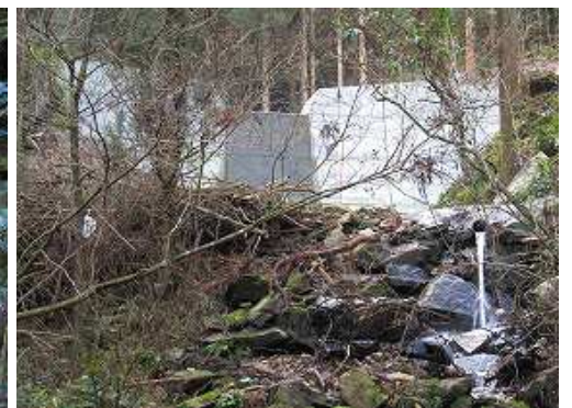
右手奥に新設の砂防ダムを見る。