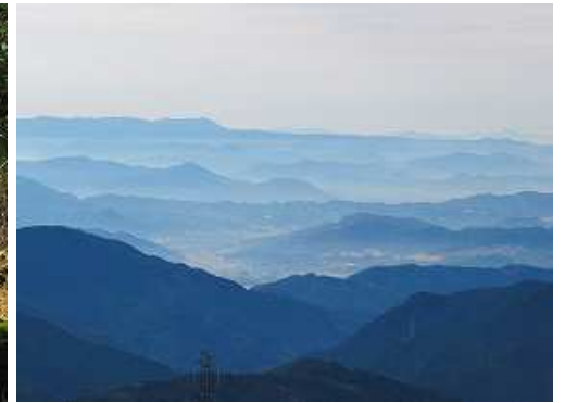
展望斜面からの眺め。