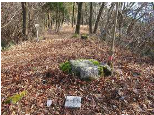
通石山(900m)の山頂には三等三角点通石が設置されているが、灌木に遮られ展望は得られない。