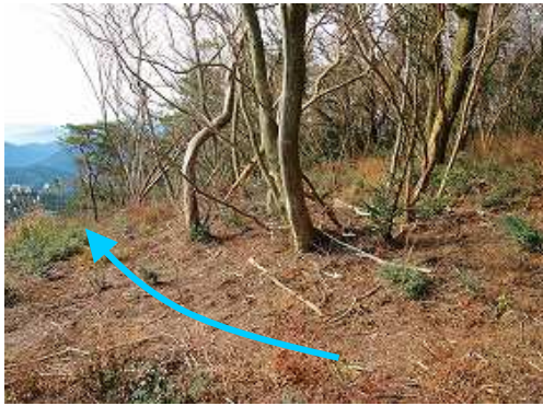
伐採斜面の際に沿って下って行く。