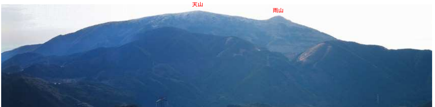
展望斜面からの眺め。