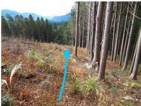
際沿いに下って行く。