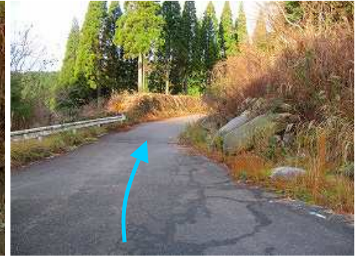
県道37号を古湯温泉から天山スキー場方面へ向かい、峠を越え巖木町天川に入ると、右に林道荒川/天川線を見る。途中3ヶ所分岐があるが、道なりに直進する。