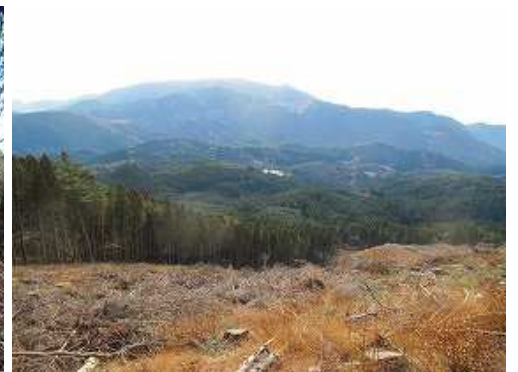
展望斜面からの眺め。