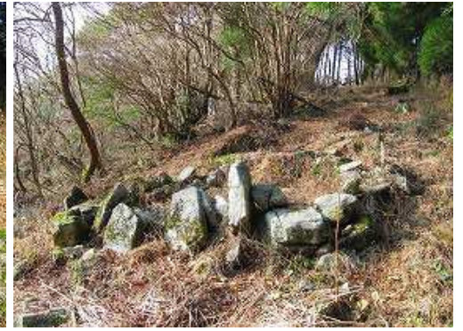
五人塚 阿蘇惟直の自害地なのか。石棺墓のようにも見えるが。