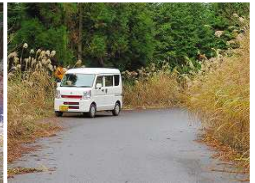
駐車地に帰着いた。