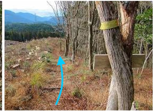
通石分岐を通過する。