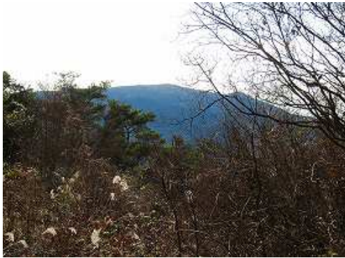
南には天山の阿蘇惟直碑が確認できる。