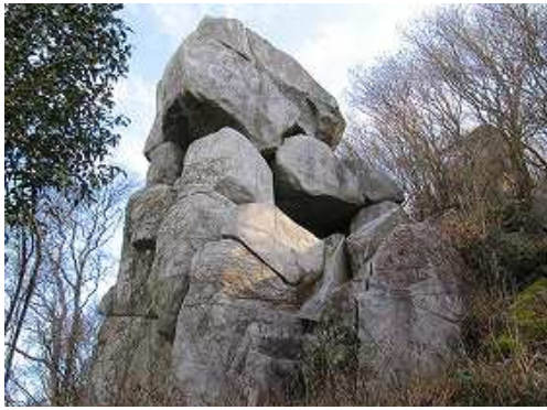
通石 自然の造形なのか人工物なのか。