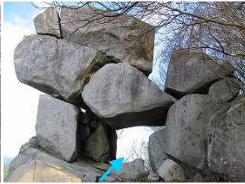
この穴を抜ける。微妙なバランスで平衡している。