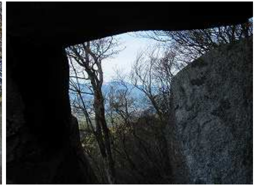
穴の先には唐津市が望める。