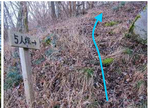
抜けた所で、五人塚の案内板を見る。