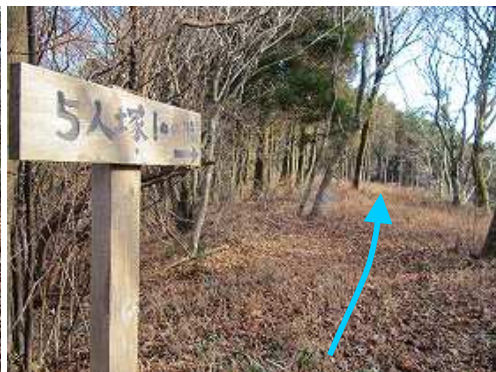
尾根筋を五人塚へ向かう。