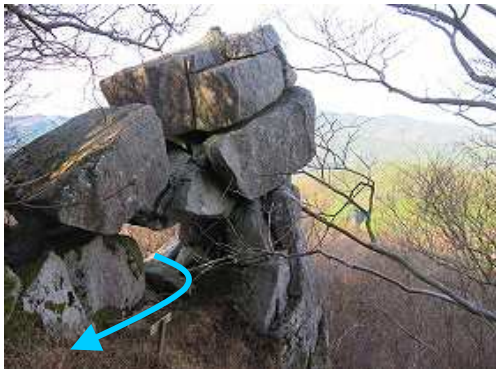
抜け出て振り返る。