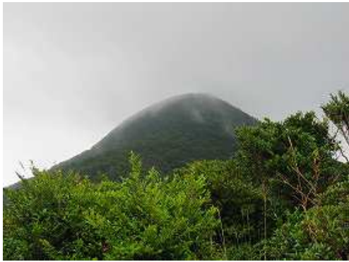
西にガスの野間岳を望む。