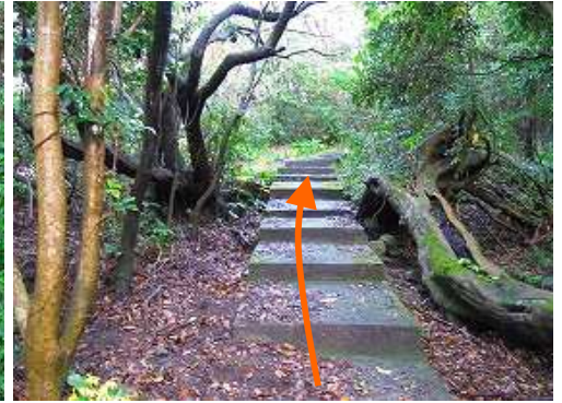
コンクリート階段を緩やかに登って行く。