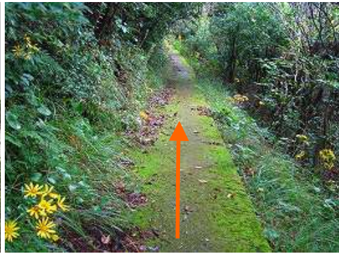
引返し苔むすコンクリート道を緩やかに降って行く。