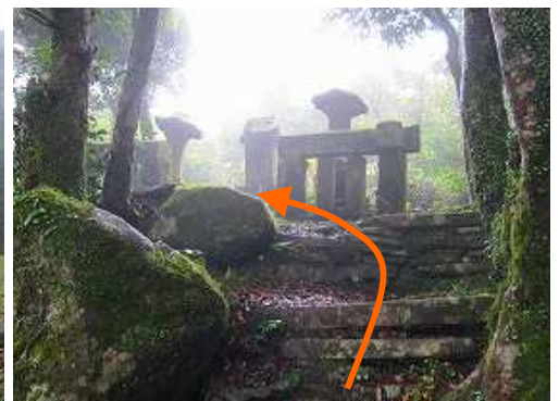
西側の上宮祠を抜ける。