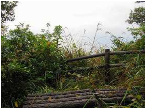
第1展望所が左手に現れる。