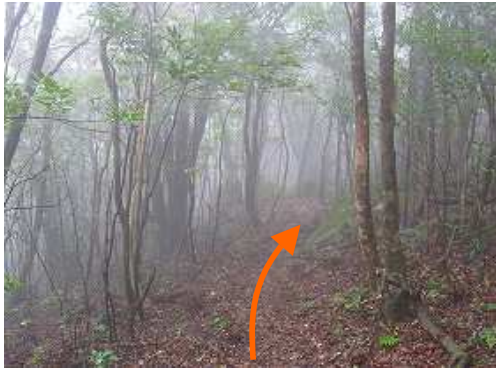
ガスが流れる中、緩やかに尾根筋を降る。