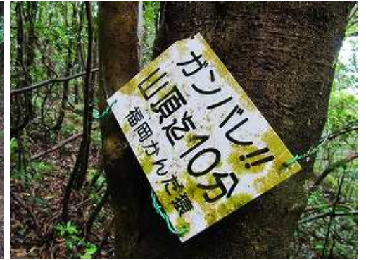
右の幹に案内板を見る。