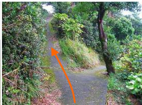
コンクリートの遊歩道が現れ、左へ向かう。