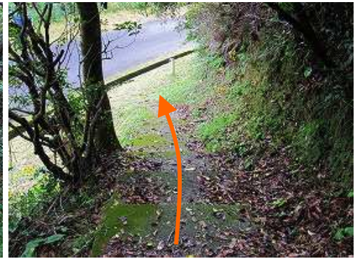
片浦登山口が見えた。