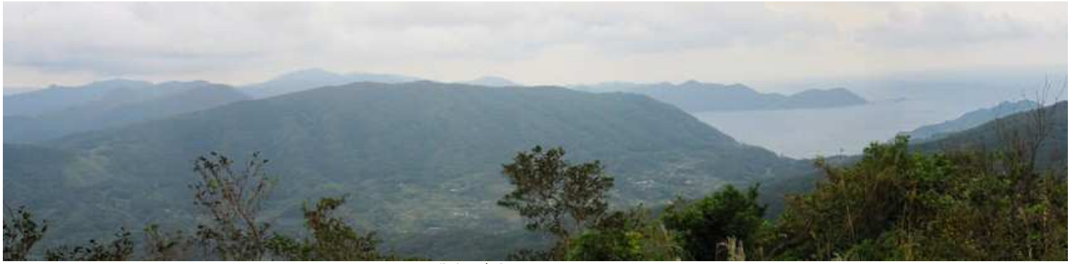
北東～南東にかけてのパノラマ。