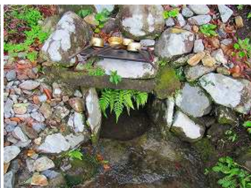
山側に湧水が湧き出ている。