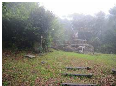
一等三角点が設置された野間岳(591m)の山頂であるが、樹木に遮られ展望は得られない。