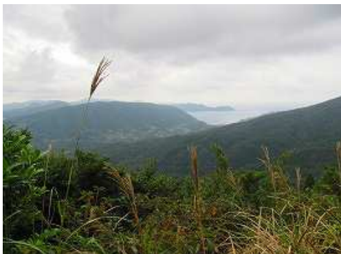
開けた所から右に坊津方面を望む。