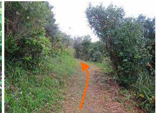
山腹を緩やかに降って行く。