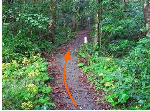
ツワブキの咲くコンクリート道を緩やかに登って行く。