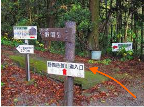
取付きには案内板が立ち並ぶ。