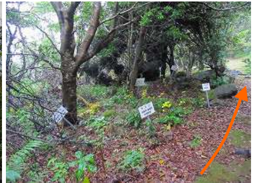
鹿児島県下の市町村の樹木が植えられている記念植樹園を通過する。