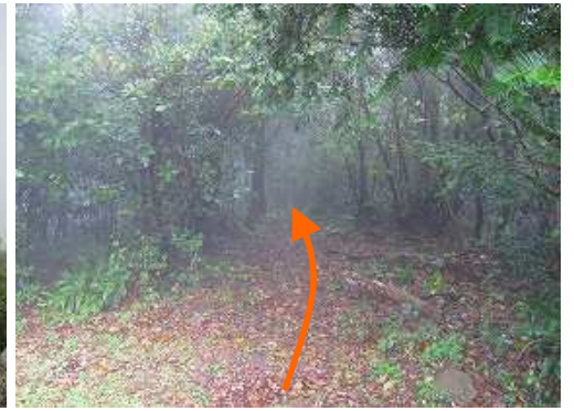
三角点傍から東方面の尾根筋に入る。