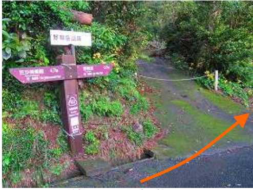
神社登山口から歩き始める。

神社登山口～野間神社～第1展望所～第2展望所～野間岳(591m)～展望岩～笠沙石門～展望所～片浦登山口～三叉路～神社登山口