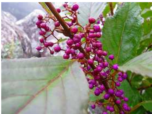
オオムラサキシキブ