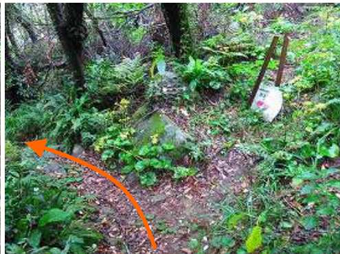
片浦口への案内板を通過する。