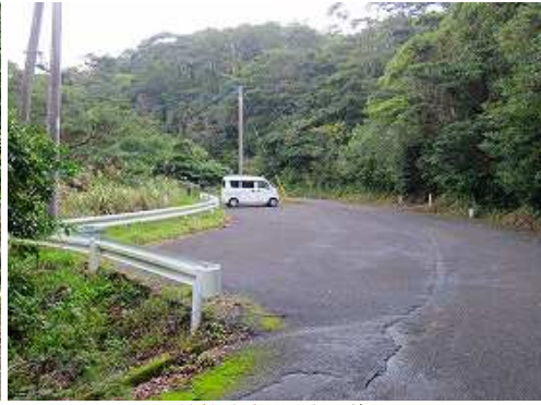
野間神社駐車場に帰り着いた。