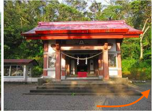
野間神社に参拝し右手へ向かう。