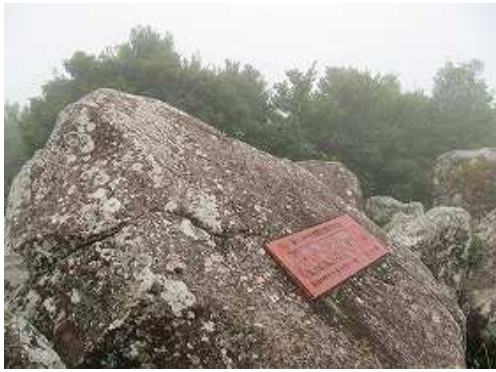
大岩の 展望岩 が転がり360°の展望が得られる。此処で鹿児島国体の炬火が採火された。