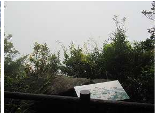
右手に第2展望所が見れる。