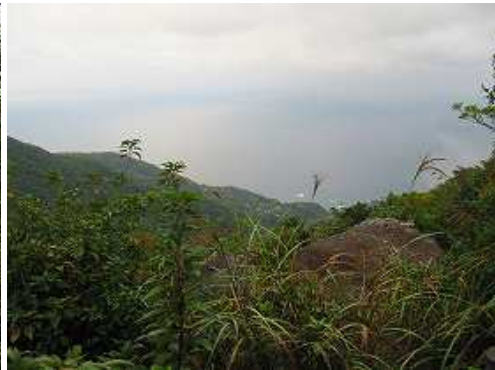
第1展望所からの眺め。