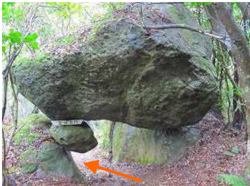
笠沙石門 を通過する。