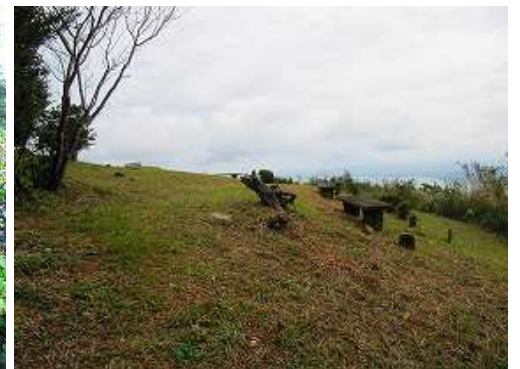
展望所 は開けた斜面で北から南にかけての展望が得られる。