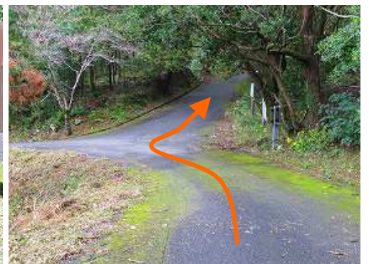
三叉路を通過する。