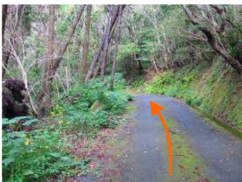
道路を緩やかに上って行く。