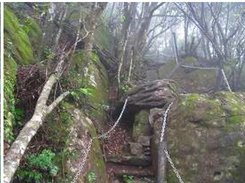
傾斜が増しくサリ場が見れる。