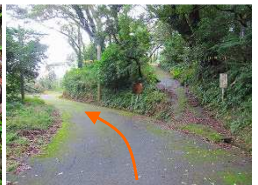
野間神社の入口が見えた。