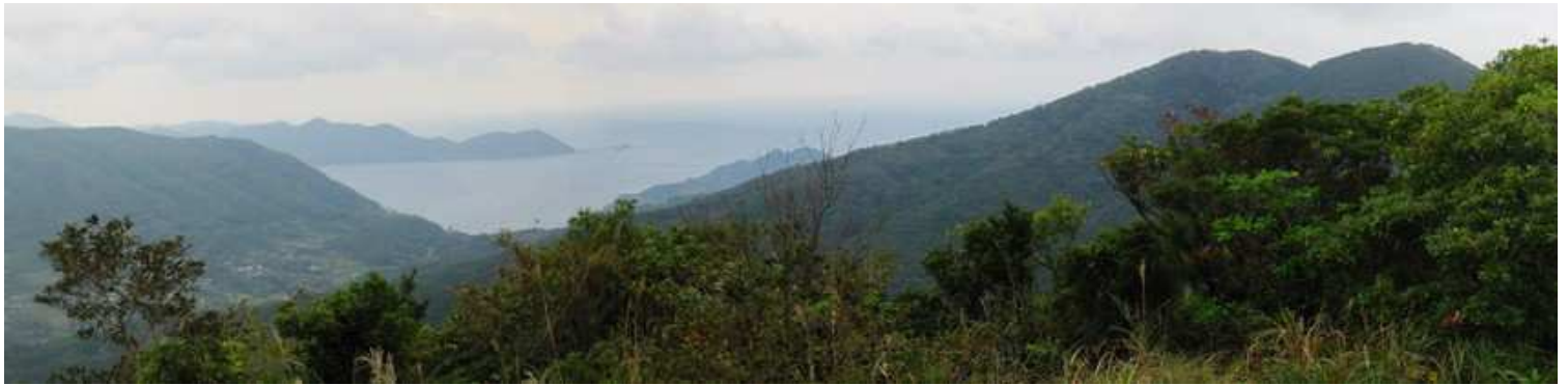
南東～南西にかけてのパノラマ。