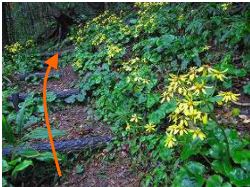
擬木階段を緩やかに登って行く。