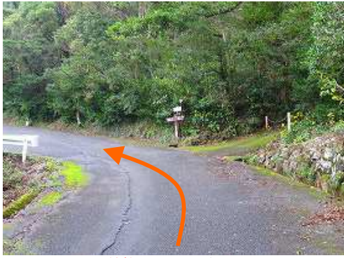
神社登山口が見えた。