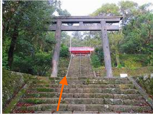
野間神社への石段を上がって行く。