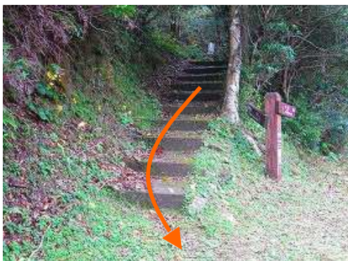
片浦登山口に降り立つ。