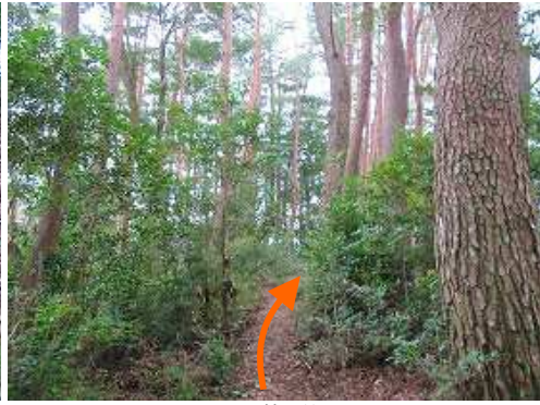
アカマツ林を抜ける。