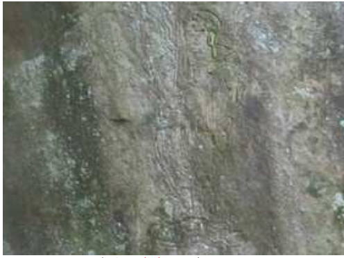
祠の右上に磨崖仏が刻まれている。