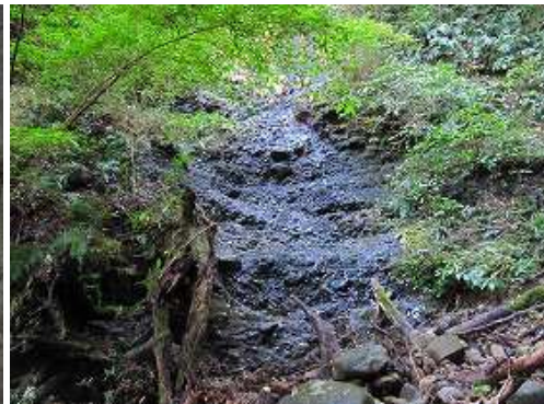
正面に流れの弱い小滝を見て左へ向かう。