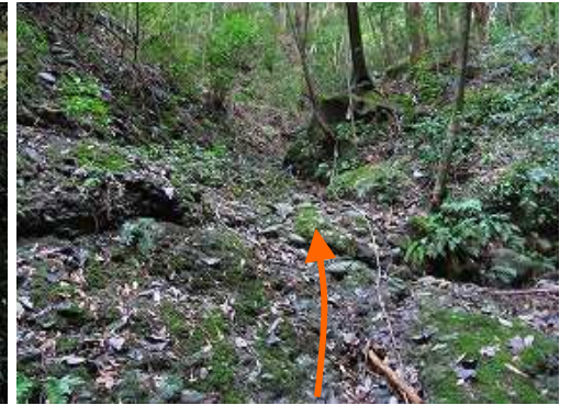
涸れた沢を緩やかに詰めて行く。