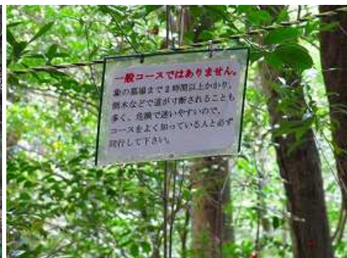
左手の注意案内板。