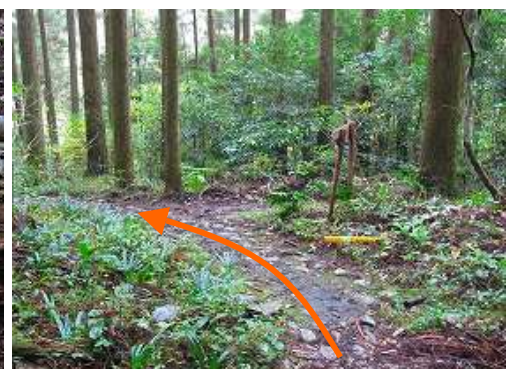
参道分岐を通過する。