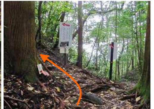
姥嶽神社へ立ち寄る。