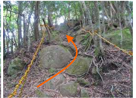
急斜面を登って行く。