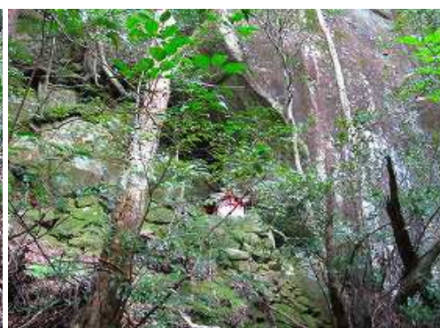
前方に赤い社が見えた。