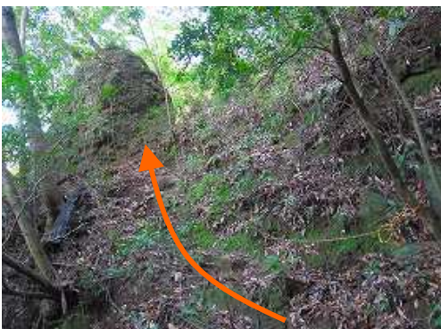
前方に行者コース分岐の岩を見る。