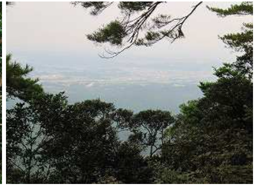
北方向に展望が得られる。