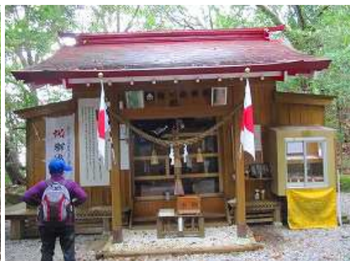
姥嶽神社へ参拝する。