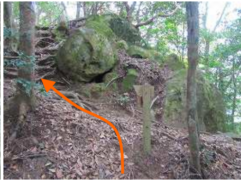
磨崖仏分岐に出会い、左へ向かう。