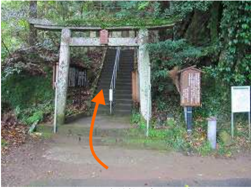
九平登山口は姥嶽神社の鳥居から始まる。

九平登山口～参道分岐～不動明王分岐～奥の院～磨崖仏～磨崖仏分岐～双石山(509m)～引返し～双石山(509m)～九平分岐～姥嶽神社～参道分岐～九平登山口