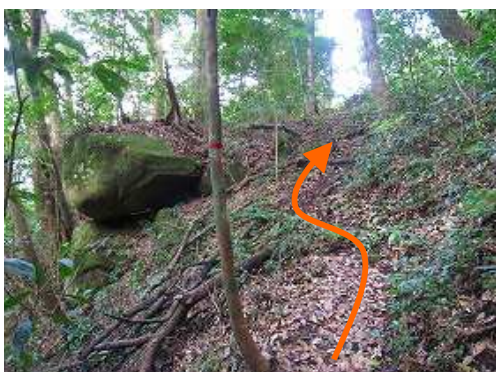
奥の院分岐まで引き返し、踏み跡を辿る。