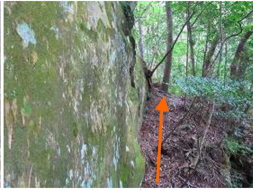
左岩壁の下を斜上する。