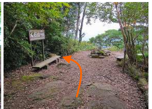
再度、双石山(509m)に立ち寄る。