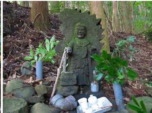
大日大聖不動明王に参拝し左上に上る。