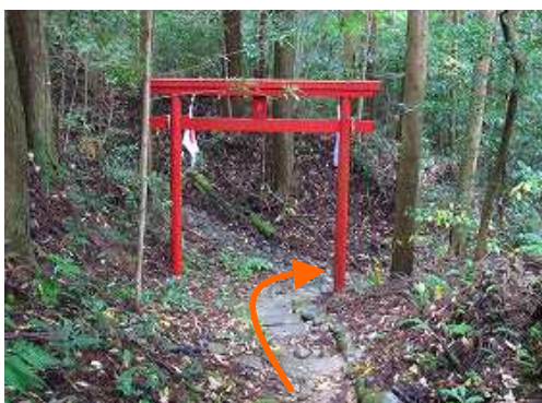
姥嶽神社入口の赤鳥居を抜け、右折する。