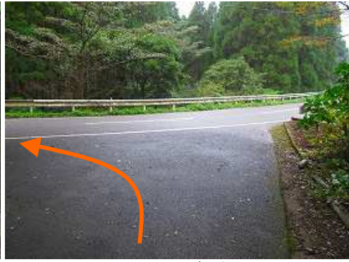
九平登山口に降り立つ。