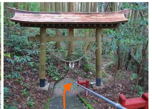
参道を下って行く。