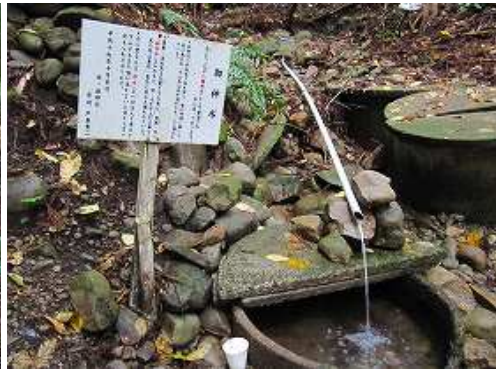
御神水で巾着を潤す。