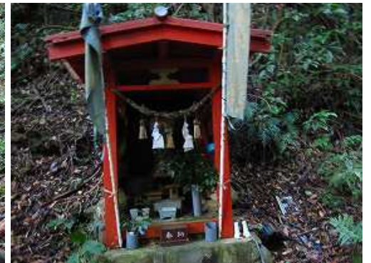
山側に不動明王を祀る祠を通過する。