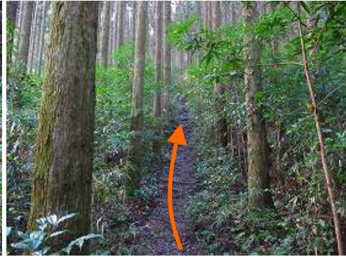
スギの植林帯を緩やかに登って行く。