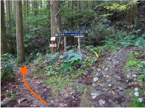
参道分岐に出会い左へ入る。