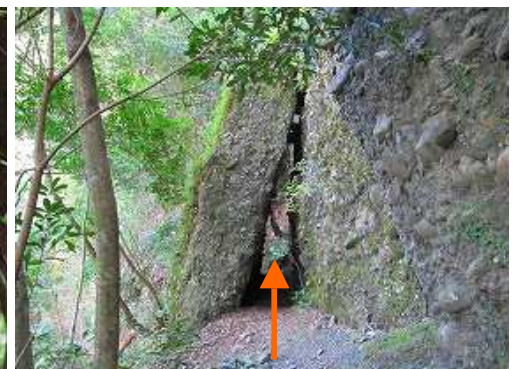
岩のトンネルを抜ける。