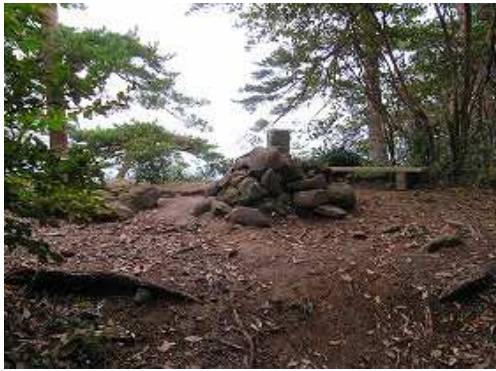
双石山(509m)の山頂には三等三角点が設置されている。