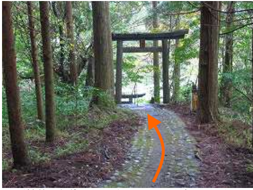
スギ植林の参道を下って行くと登山口の鳥居が見えた。