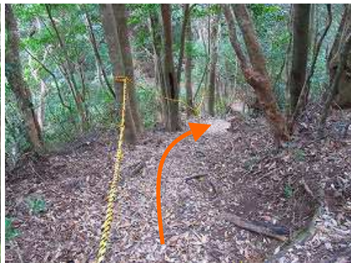
トラロープの張られた急斜面を降る。