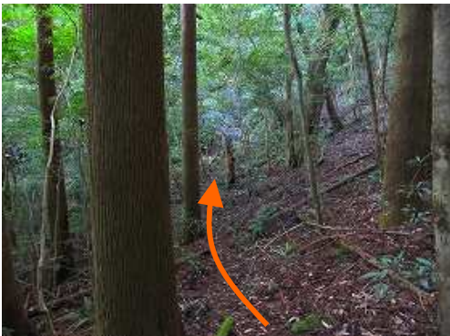
奥の院分岐からの踏み跡に出会い左折する。