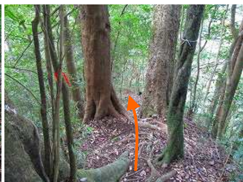
大木の間を通過する。