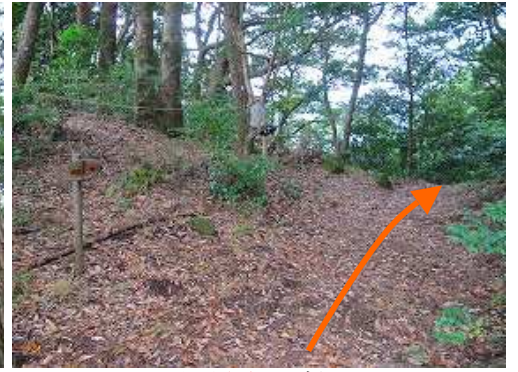
九平分岐に出会う。