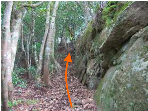
右岩場の下を斜上する。