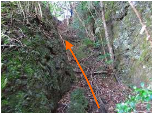
ルンゼ状の急斜面を登る。