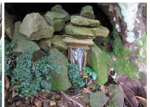
山側に木の洞に祀られた小さな祠を通過する。