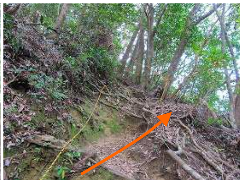
トラロープの張られた急斜面を登る。