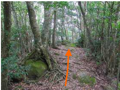
尾根筋を北北東に向かう。