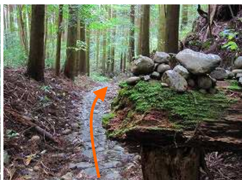
玉石の参道を緩やかに降って行く。