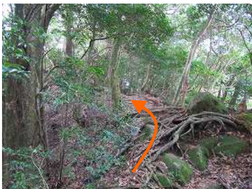
小雨が降り出し引返す。