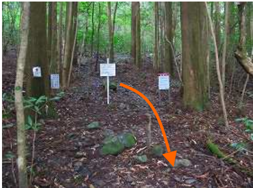
奥の院分岐まで降りて来た。