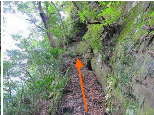
壁下の棚を斜上する。