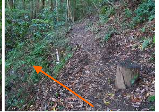
大日大聖不動明王分岐に出会い左へ入る。