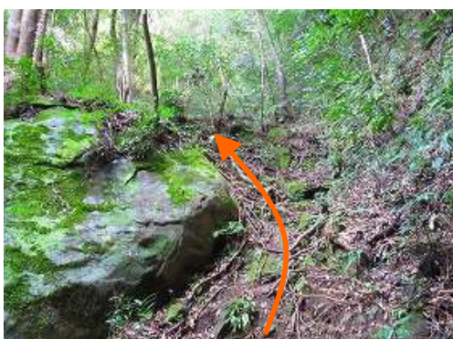
木の根の急斜面を登って行く。