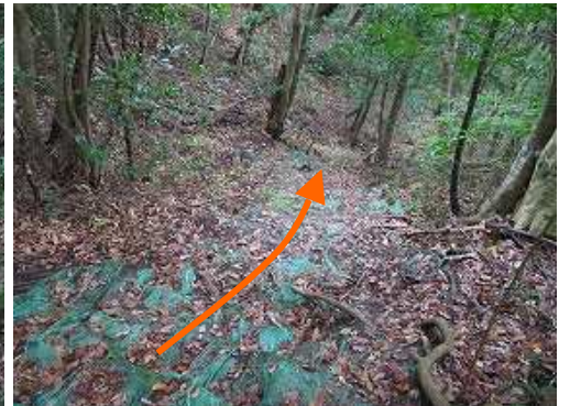
やや急な土嚢袋斜面を降って行く。