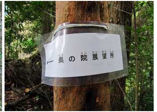
登り上がると案内板を目にする。