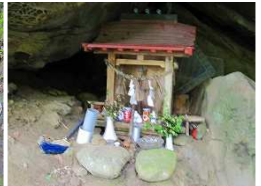
岩屋に安置された奥の院。