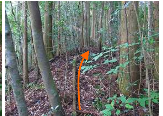
弱い尾根筋に行く。