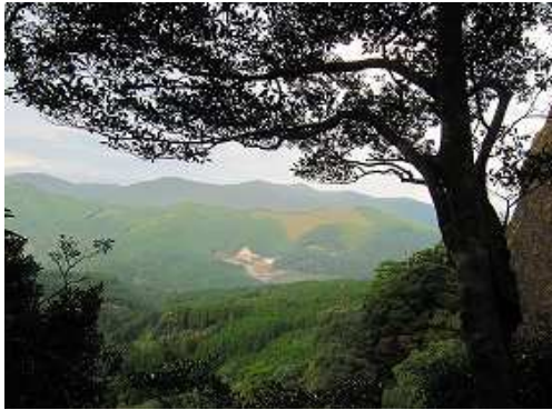
奥の院展望所からの眺め。