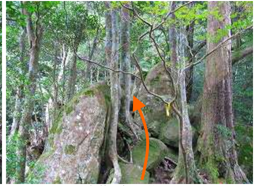
尾根筋の岩場を抜ける。