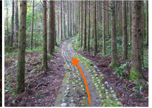
スギの植林帯の参道を緩やかに行く。