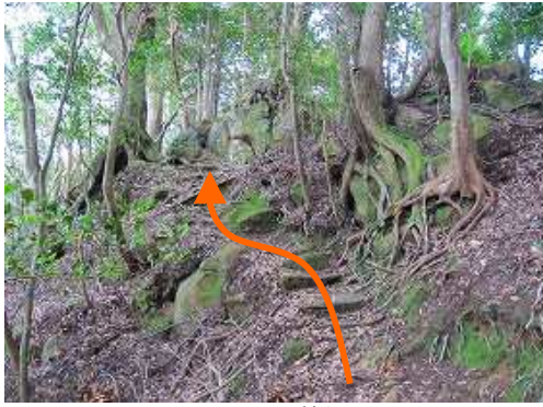
弱いピークを越える。