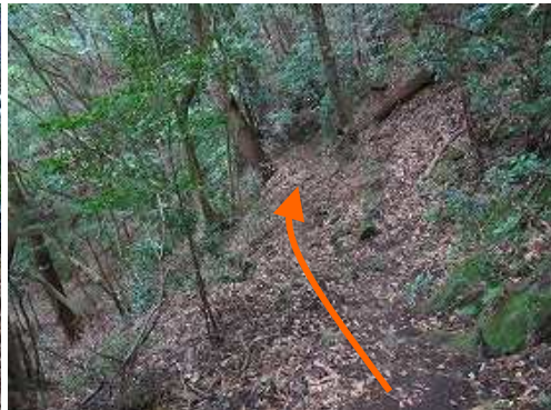
斜面をジグザグに降って行く。