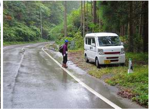
九平駐車地に降り着く。