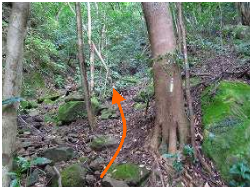
奥の院分岐 左の壁下へ向かう。