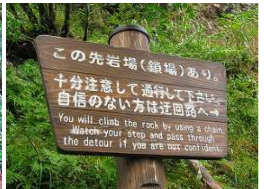
笈吊岩取付き付近の案内板。