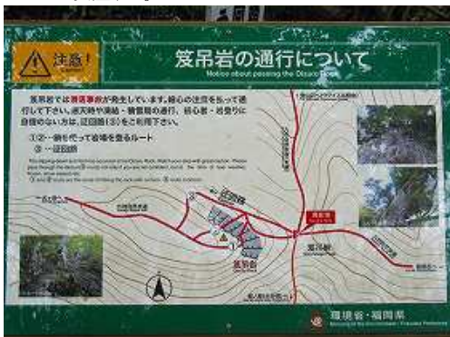
笈吊岩の注意書き。