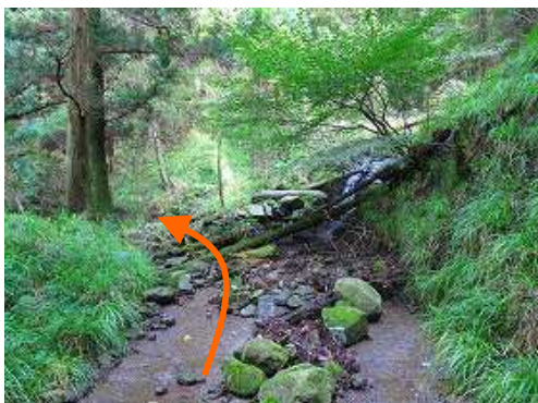
回り込んだ先で、沢が押し出している。