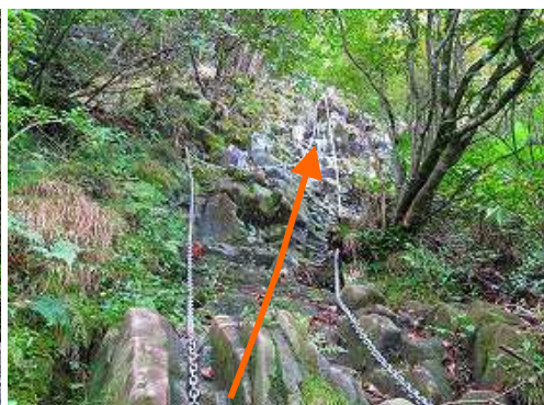
②クサリ場 岩の濡れも少なく、此处を登る。