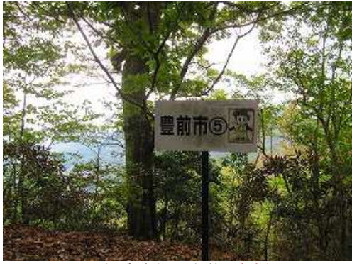
迂回路と合流する尾根筋の案内板。