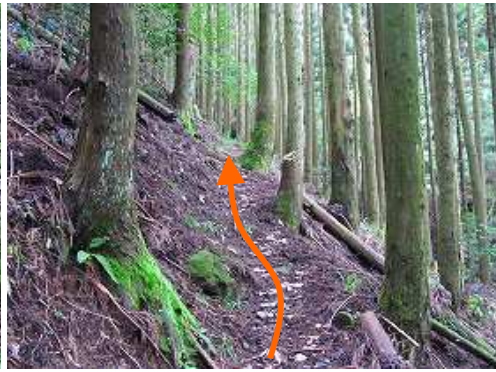
スギの植栽林を道なりに登って行く。