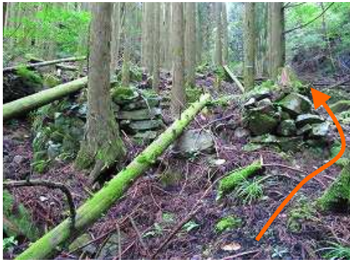
炭焼き窯跡の右を抜ける。