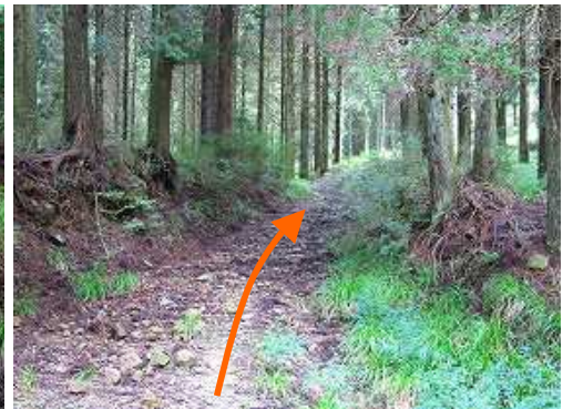
緩やかに林道を上って行く。