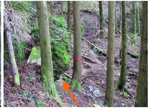
張り出した岩を抜ける。