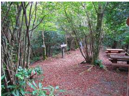
笈吊峠に到着。九州自然歩道の縦走路とウグイス谷ルートが交差する。