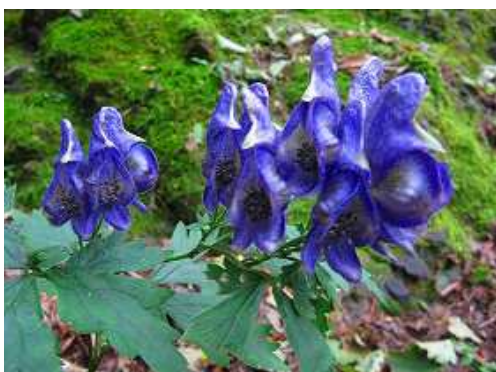
タンナトリカブト