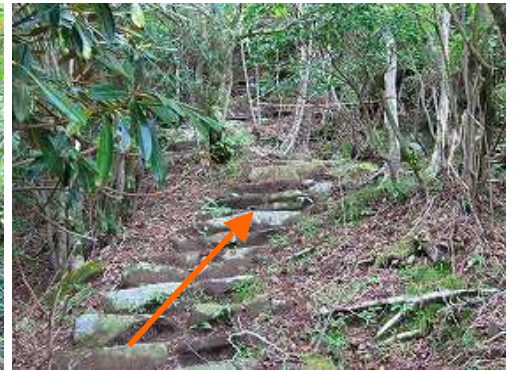
石段を登って行く。