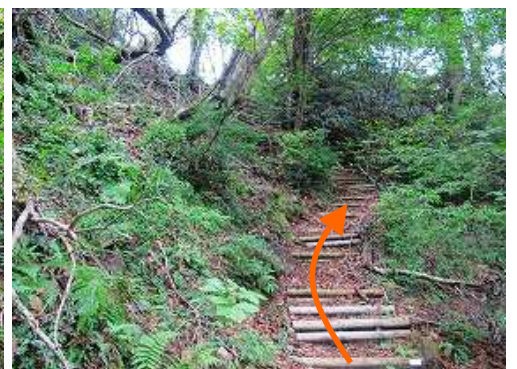
丸太階段を登って行く。