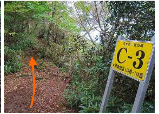
釈迦岳を通過する。