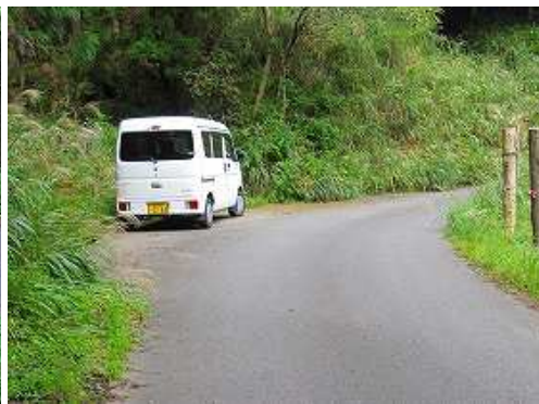
駐車地に帰っていた。