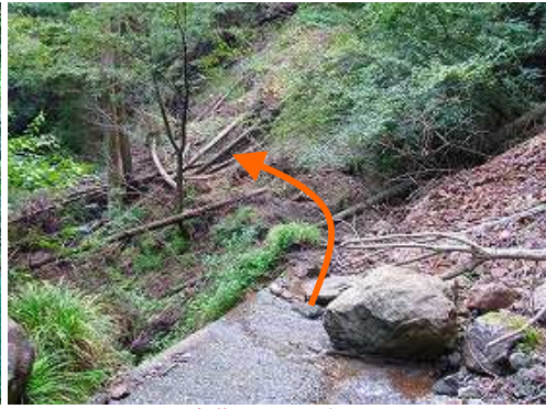
崩落地を通過する。