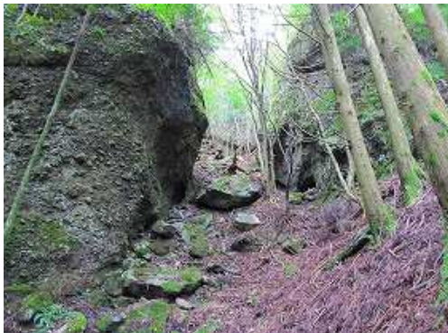
左、澗谷の上部に岩場を見る。