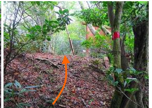
縦走路の出口が見えた。