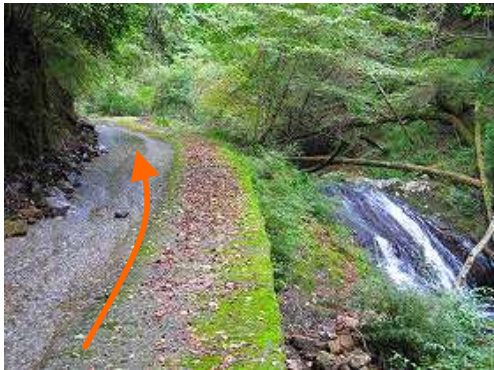
右の沢に落ちる斜滝を眺めながら緩やかに上って行く。