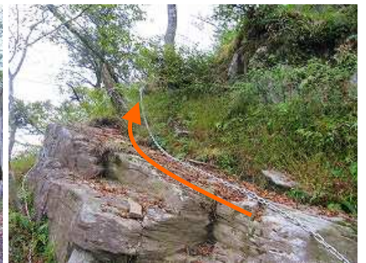
斜面に取付きクサリ場を抜ける。