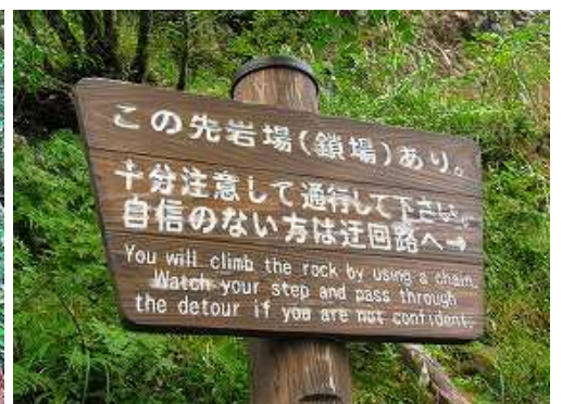
笈吊岩取付き付近の案内板。