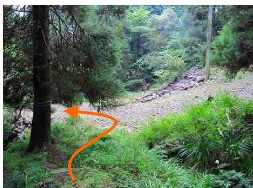
取付きに降り立ち、左へ。