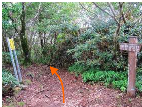
釈迦岳を通過する。