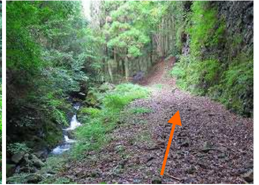
左に沢の小滝を見下ろし、道なりに緩やかに上って行く。