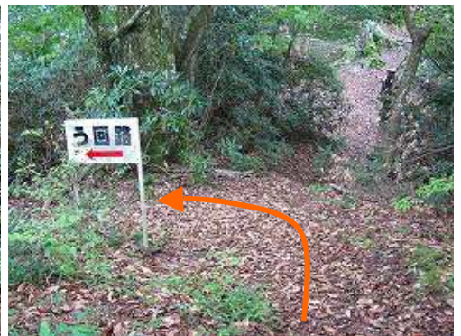
帰路は迂回路を降る。