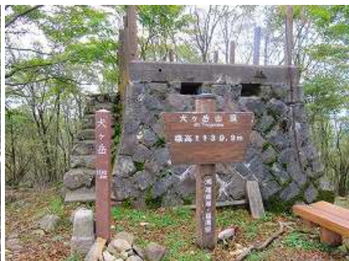
犬ヶ岳(1131m)の山頂。三等三角点や避難小屋が設置されているが、展望は樹木に遮られ得られない。