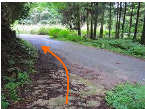
相ノ原登山口に降り立つ。