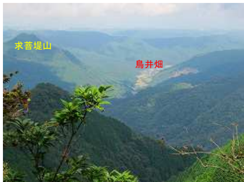
開けた所から北に求菩提山と鳥井畑を望む。