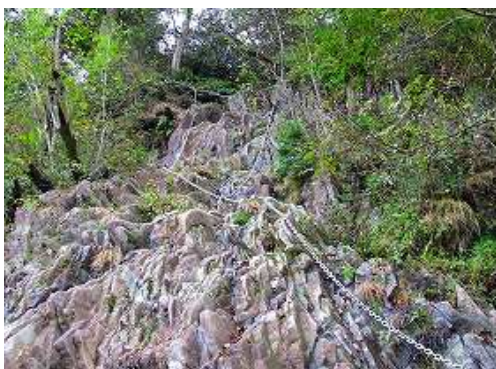
①クサリ場。岩が濡れており、傾斜が急なので断念。