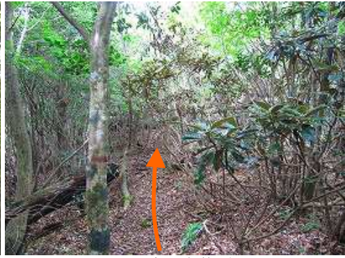
シクナゲの尾根筋を行く。