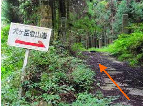
相ノ原登山口は津民の最奥にあり、路肩に駐車して歩き始める。