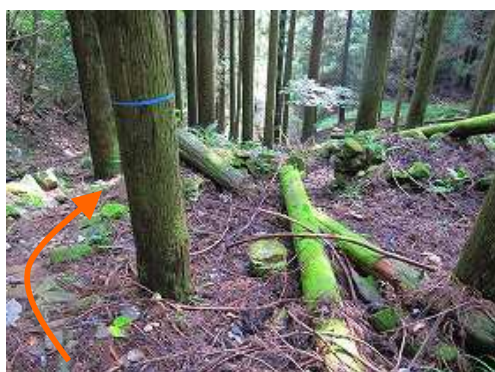
炭焼き窯跡を抜ける。