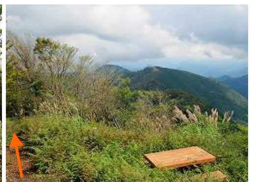
犬ヶ岳の肩から東の展望。