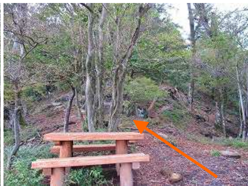
犬ヶ岳の肩には、テーブルや案内板が設置してある。