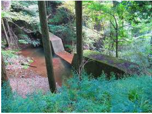
砂防ダムを通過する。