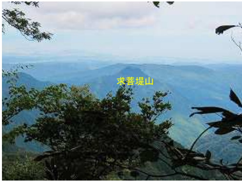
樹間から求菩提山を望む。