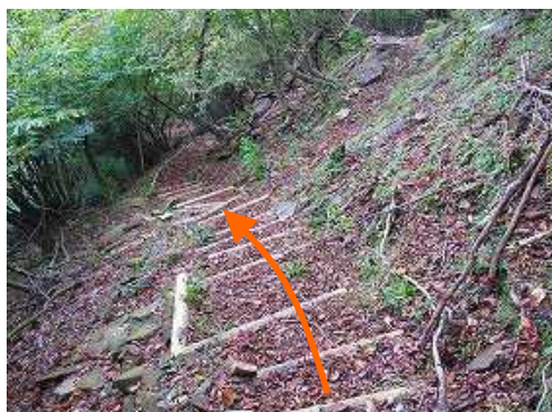
丸太階段を下って行く。