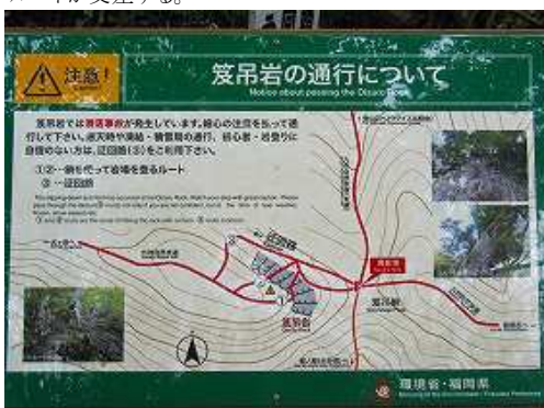
笈吊岩の注意書き。