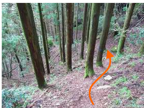
道なりにスギの植林帯を降って行く。