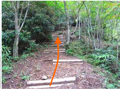
丸太階段を緩やかに登って行く。