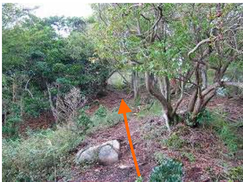
傾斜が緩み犬ヶ岳の肩に達する。