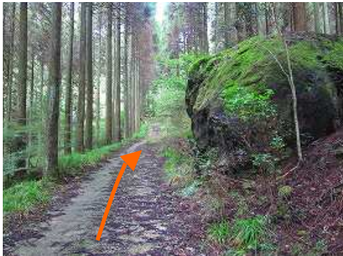
大岩の横を通過する。