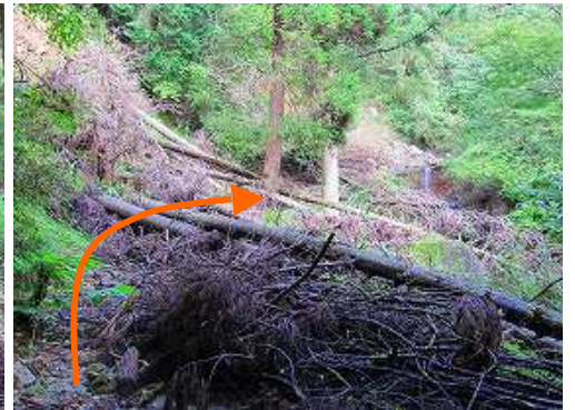
崩落地 左斜面の崩落により50m程林道が塞がれている。