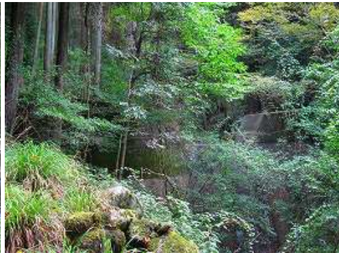
右の沢に砂防ダムを見る。