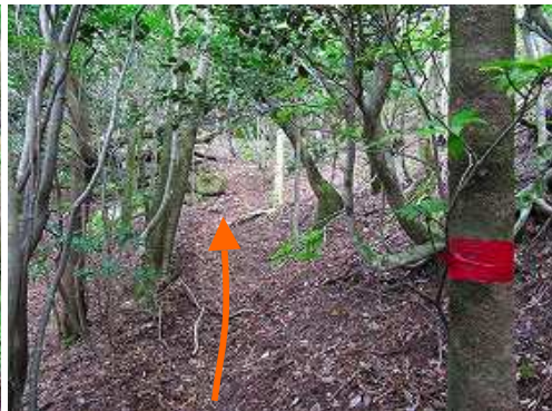
自然林に変わると傾斜も緩む。