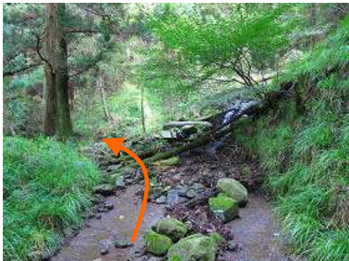
回り込んだ先で、沢が押し出している。