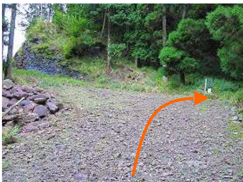
取付きに到着。此処から山道に入る。