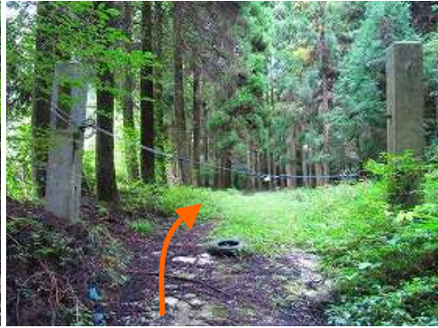
林道入口には石柱が立ち、ワイヤーが張られている。