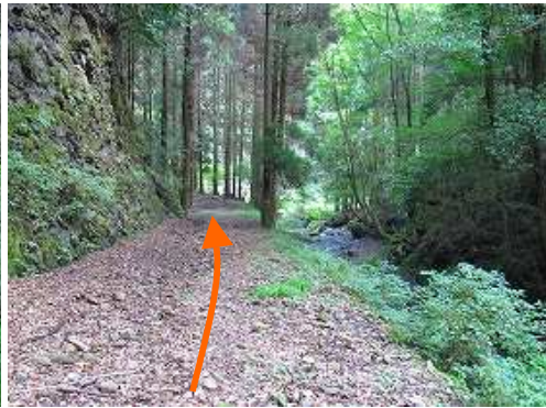
右に沢音を聞きながら下って行く。