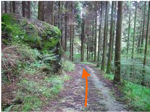
大岩の横を抜け道なりに下って行く。