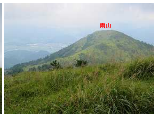
南西の雨山(996m)を望む。