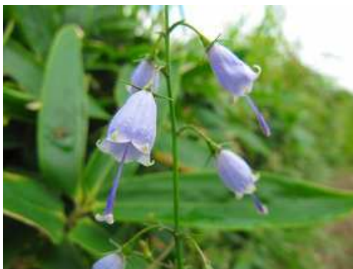
サイヨウシヤジン