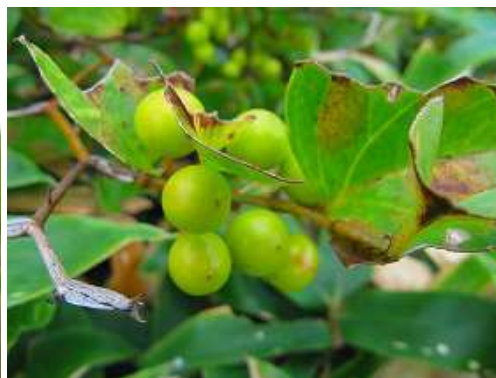
サルトリイバラ 実