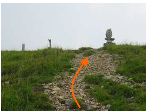
山頂部が見えて来た。