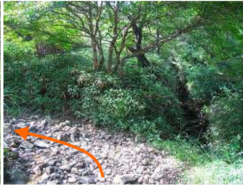
雨山分岐は左へ進む。