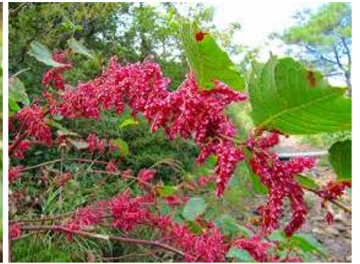
イタドリ (メイゲツソウ)