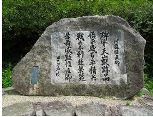
傍に阿蘇惟直の碑が立つ。