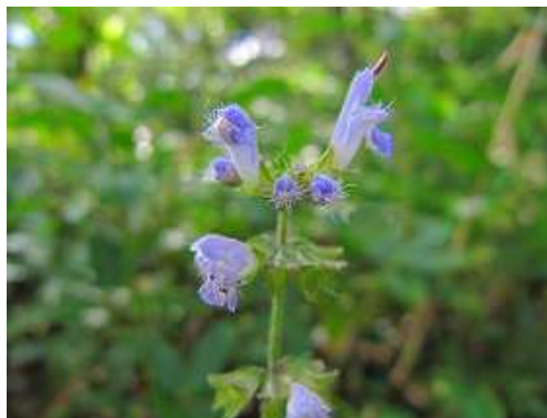
アキノタムラソウ