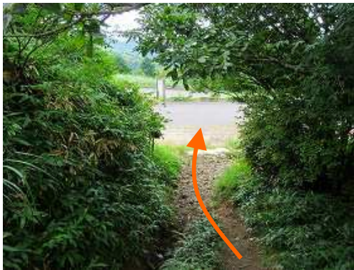
天川登山口を抜け出る。