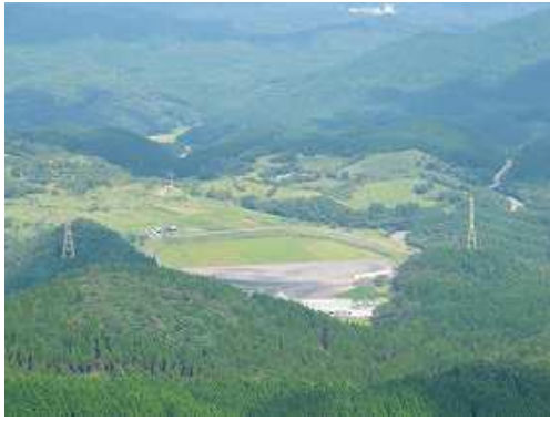
北方面に天山スキー場を見下ろす。