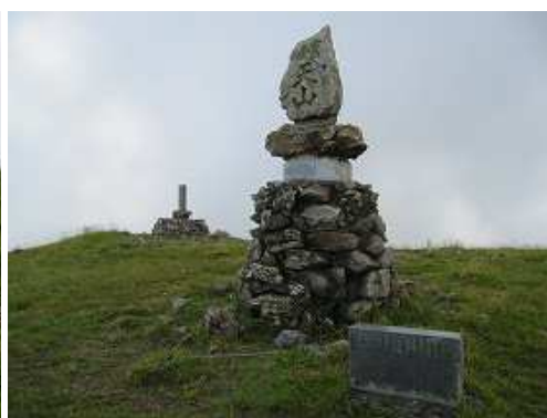
天山(1046m)の山頂。一等三角点が設置されており360°の展望が得られる。