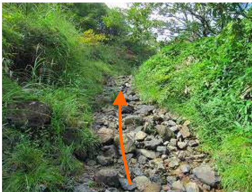
レキ・玉石混じりの水道を緩やかに上って行く。