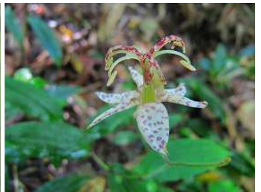
ヤマジノホトギス