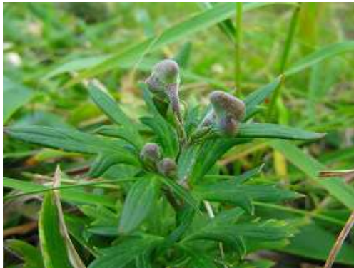
タンナトリカブト 蕾