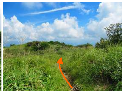
天山に向け引き返す。