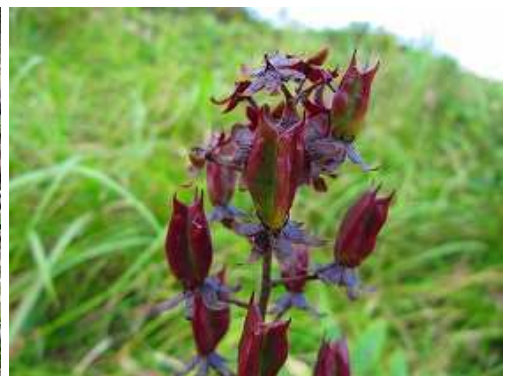
ホソバシロソウ 花後