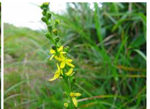
ヒメキンミズヒキ