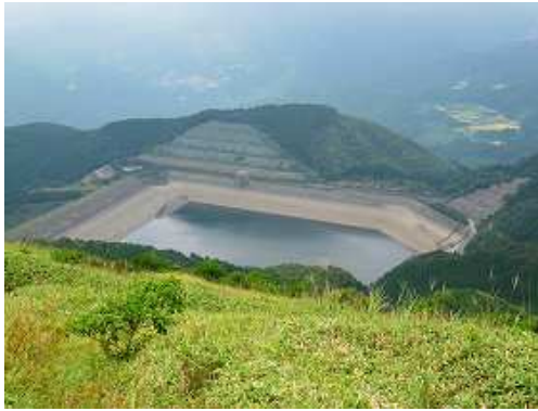
草付斜面の下りから北北西に天山ダムを見下ろす。