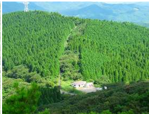
灌木帯を抜けると、左下に天川登山口が望める。