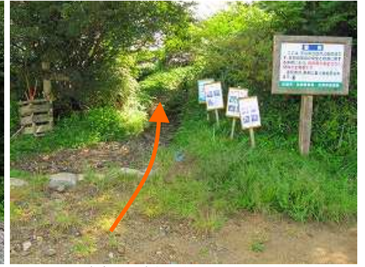
駐車場の東側にある天川登山口。