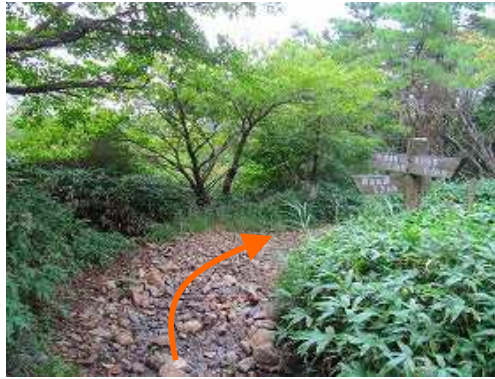
雨山分岐まで下って来た。