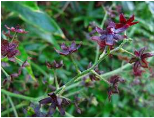
ホソバシユロソウ