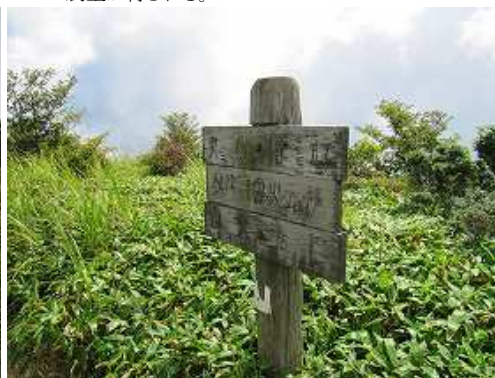
引返し点 この案内板の所で引き返す。