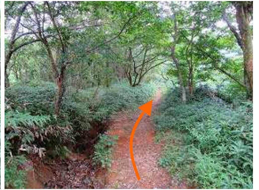
緩やかに灌木帯を下って行く。