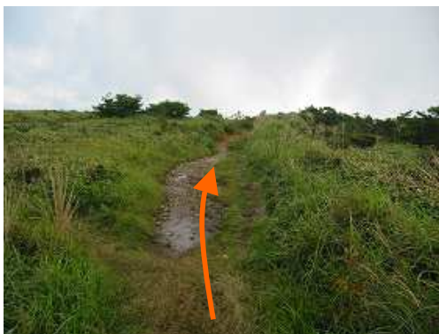
山野草を撮りながら九州自然歩道を東へ進む。