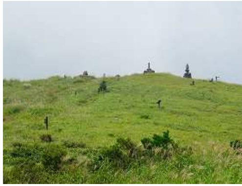
山頂部が見えて来た。