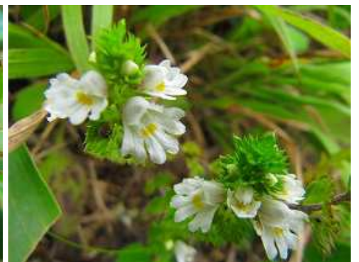
キュウシュウゴモメグサ