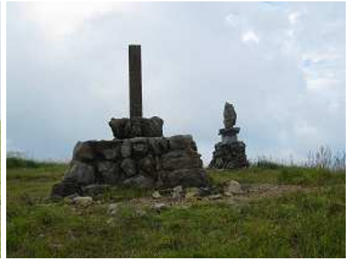
再度、山頂に立ち寄る。