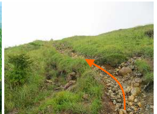
草原の斜面を緩やかに上って行く。