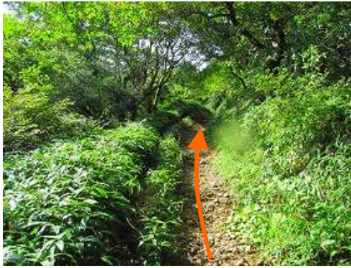
斜面を緩やかに上って行く。