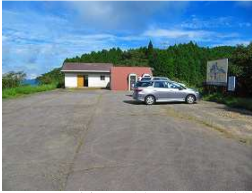
天川登山口の駐車場は20台程止められ、トイレも完備している。