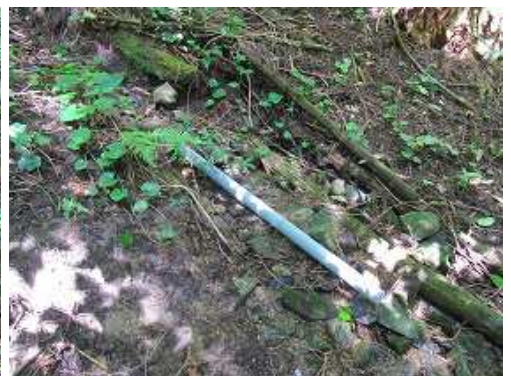
水場があるが、水は潤れていた。