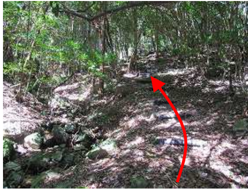
左に沢を見て、登って行く。