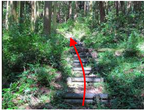
スギの植林帯の中、擬木階段を緩やかに上って行く。