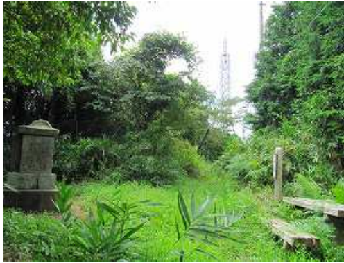
笹の斜面を抜けると、前方にアンテナ、左に祠が現れる。