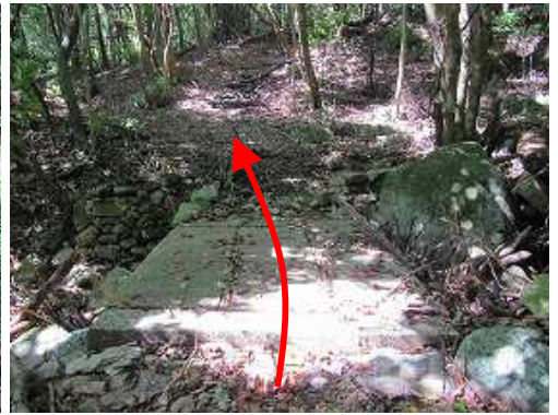
コンクリート橋を渡る。