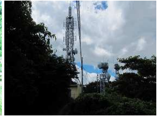
アンテナ脇の道路を進む。