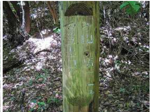
傍に山頂まで1.1kmとかるうじて読める案内柱が立つ。