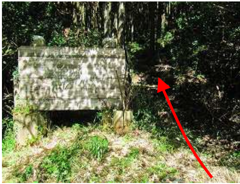
県道204号の7番カーブが大坂山登山口で傍の路肩に数台駐車可能。案内板の右から取付く。

大坂山登山口～テーブル～大坂山登山口分岐～大坂山(573m)～薬師の頭(546m)～愛宕山分岐～大坂山(573m)～境界降口～境界出口～大坂山登山口