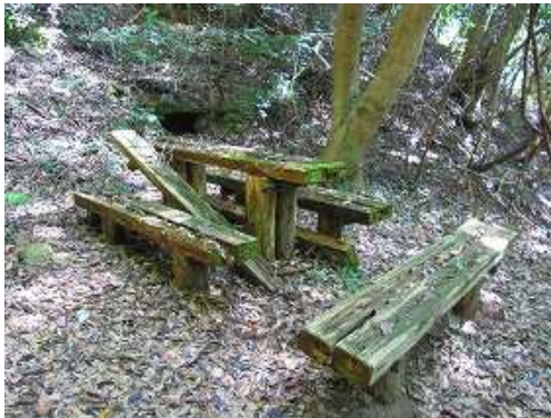
朽ちたテーブルに到着。