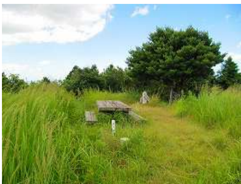
夏草に覆われた大坂山(573m)の山頂部。