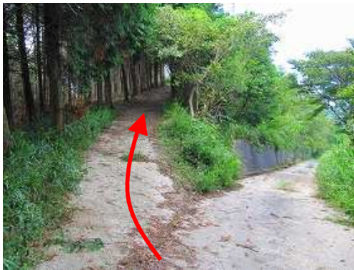
道路の分岐は、上に行く。