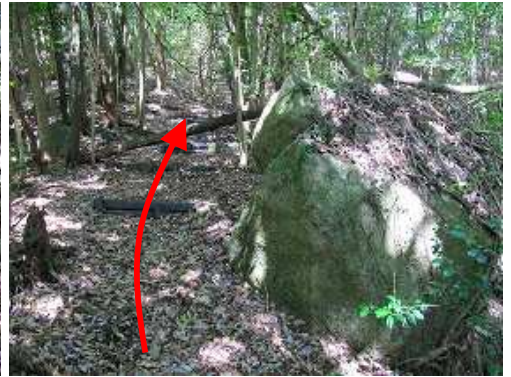
転石の左側を緩やかに上る。