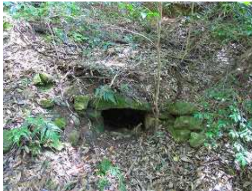
テーブルの奥に炭焼き窯跡が残る。