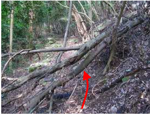
倒木の下を通過する。