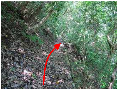
斜面の平坦路を行く。