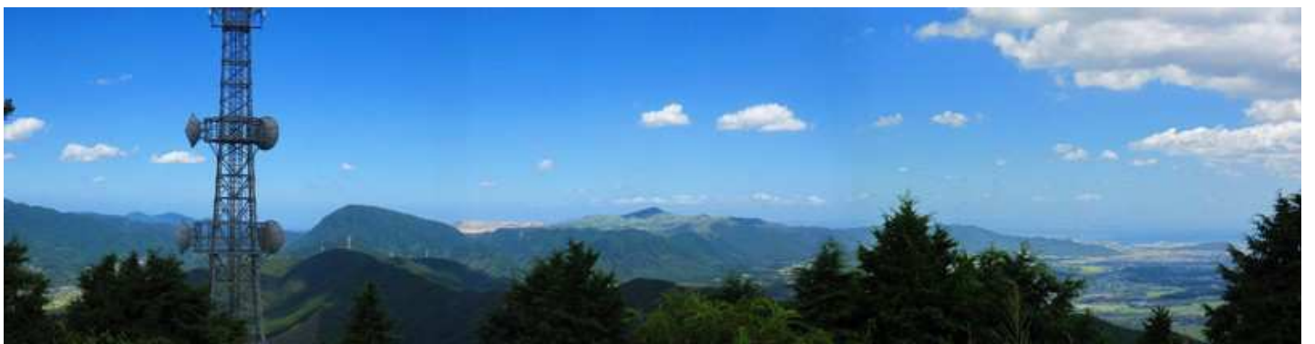
北方向に平尾台から荻田町にかけての展望が得られる。