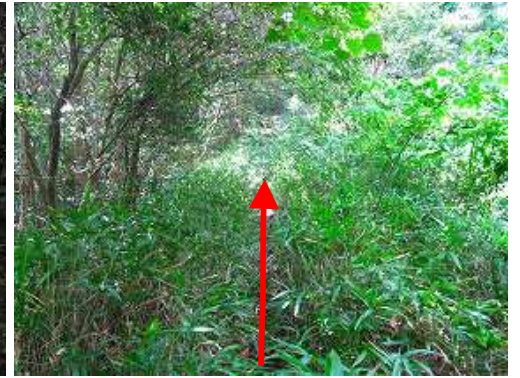
ササの斜面を漕いで行く。