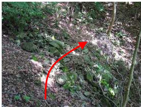
潤れた沢を渡り、残置ロープを頼りに急斜面を登る。