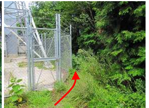
フェンスの右に沿って抜ける。