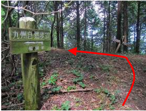
大坂登山口分岐の尾根筋に登り上がった。尾根筋に沿って左へ向かう。