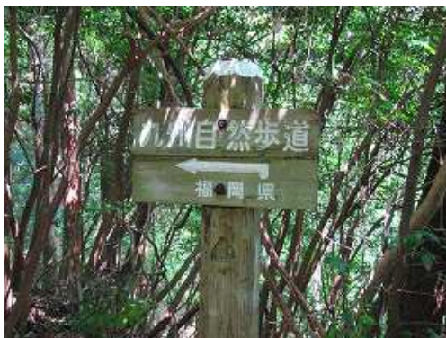
直角案内板からヒノキの植林帯に入る。