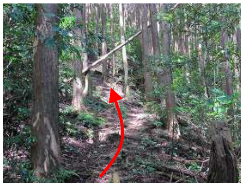
ヒノキの植林帯を緩やかに上って行く。