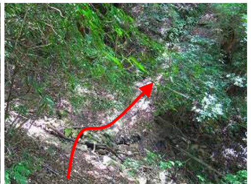
弱く下って小沢を渡り、登り返す。