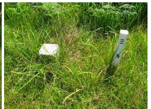
二等三角点が設置されている。