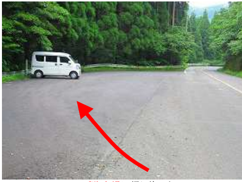
ルンゼ駐車場に帰り着いた。