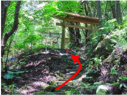
ブロック階段を詰め上がると、最後の鳥居が現れた。