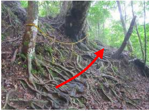
木の根とトラロープを抜ける。