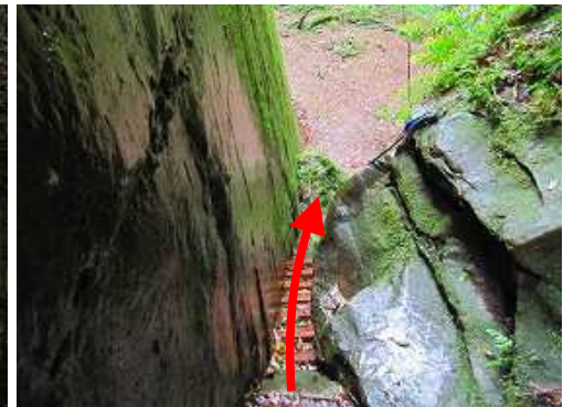
象の墓場への入口の板階段を下る。