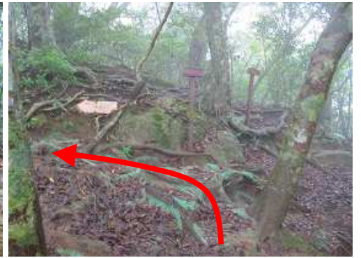
第2展望所分岐に出会い、左折する。