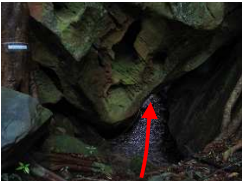
ルンゼトンネルを潜り抜ける。