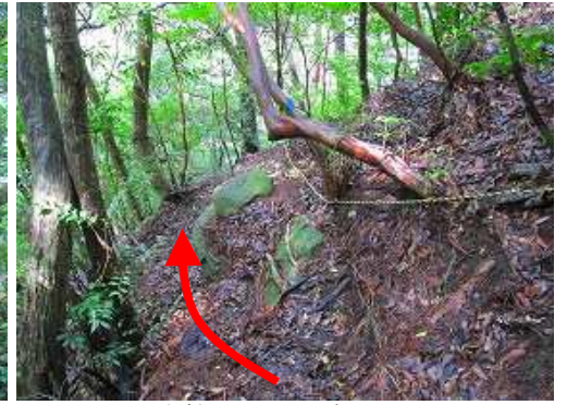
左斜面のトラロープを下る。