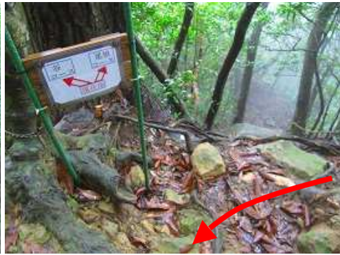
尾根谷分岐に出会い、更に尾根筋を詰めて行く。