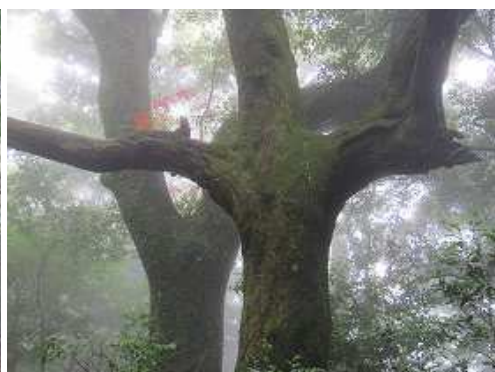
尾根筋の右に奇木を見る。