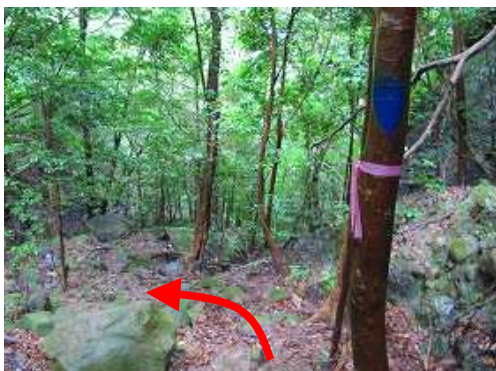
沢筋に沿って下って行く。