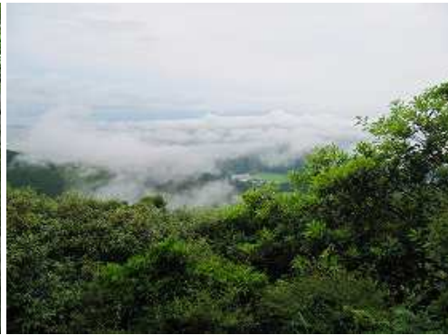
大岩展望台からの眺め。