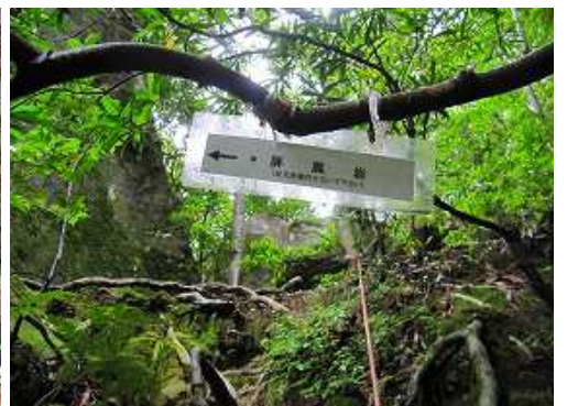
よじ登ると屏風岩の案内板を見る。