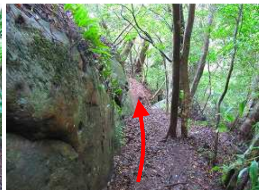
岩の右を下って行く。