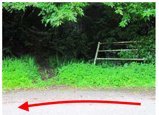
ルンゼ登山口 を通過する。