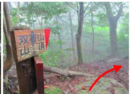
引返して、尾根筋を双石山山頂へ向かう。