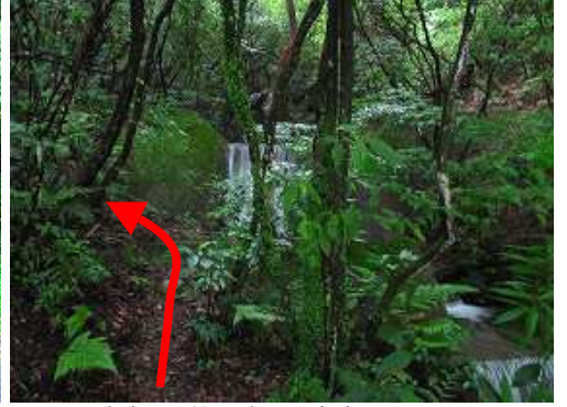
右岸に取付くと奥に砂防ダムが見える。