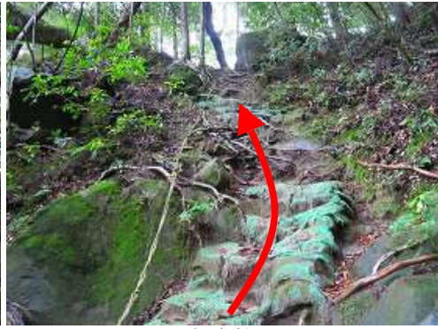
トラロープの急斜面を登る。