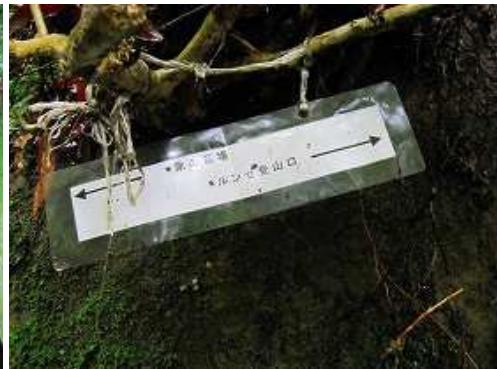
壁際に掛かる案内板。