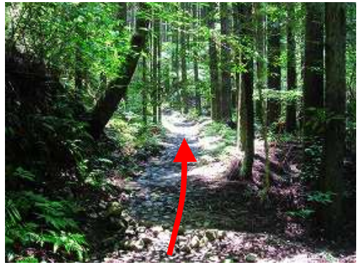
姥嶽神社への参道を緩やかに登って行く。