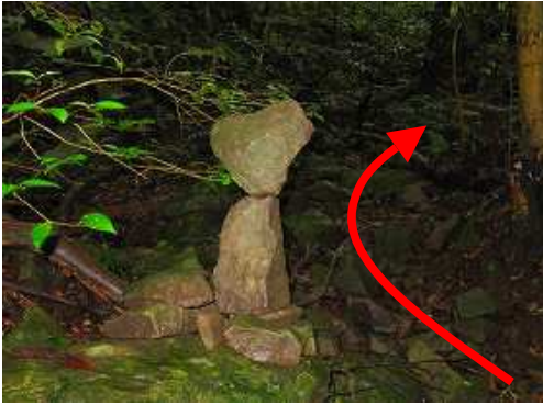
絶妙のバランスで安定しているケルンの右を抜ける。