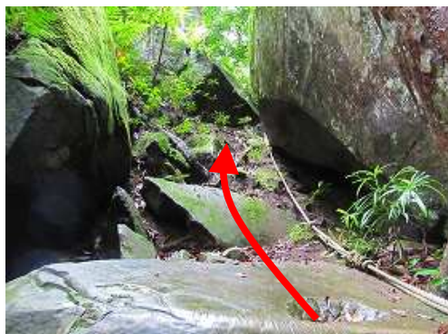
左側のロープをよじ登る。