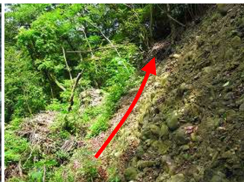
右岸の崩落斜面を抜ける。