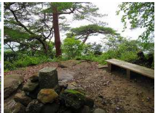
ガスって展望は得られず。