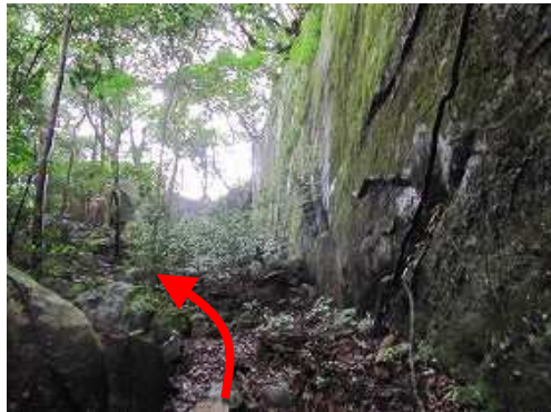
右の苔付の壁の下を抜ける。