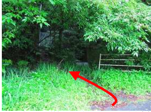
ルンゼ登山口は最初の沢の左側であるが、目印や案内板はない。