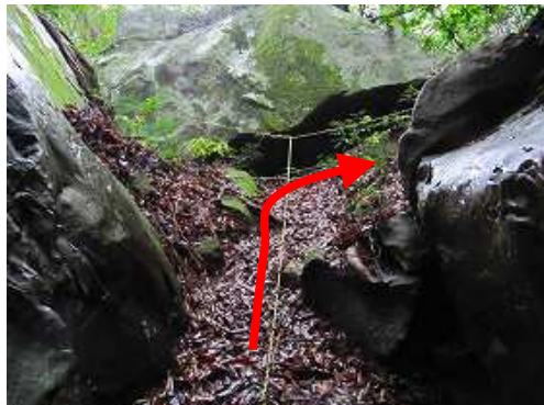
ルンゼトンネルを出て右へ進む。