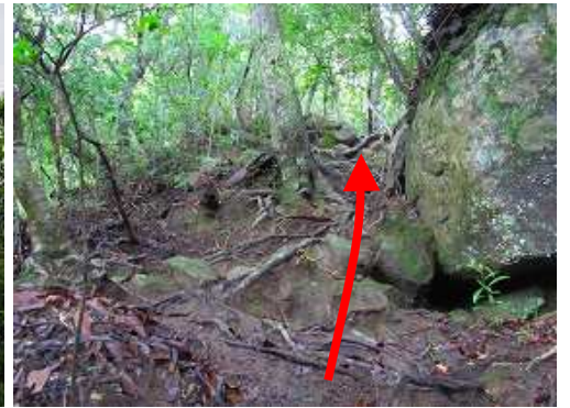
引返し大岩を慎重に降り、急な尾根筋に取付く。