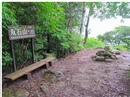
双石山(509m)の山頂には三等三角点が設置されており、北方向に展望が得られる。