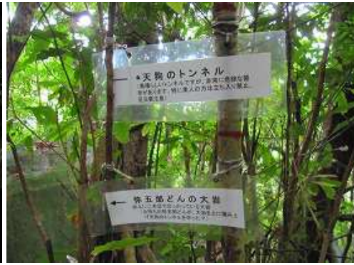
天狗のトンネルと弥五郎どんの大岩の案内板を見る。