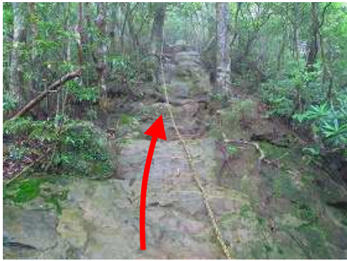
トラロープの急斜面の登りが続く。