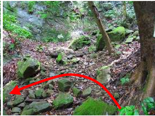
尾根筋分岐に出会い、左に沢筋を下る。