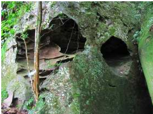
右へ進むと、めがね岩が現れる。