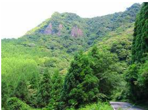
屏風岩が見えて来た。