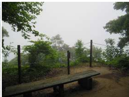
第2展望所からの展望は、ガスって得られず。