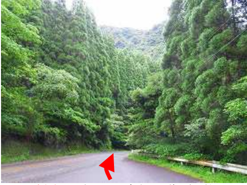
ルンゼ駐車場に車を止め、南東に県道を歩き始める。

ルンゼ駐車場～ルンゼ登山口～ルンゼトンネル～象の墓場～岩尾根分岐～大岩展望台～谷尾根分岐～第2展望所分岐～第2展望所～ひょうたん淵分岐～山小屋～双石山(509m)～磨崖仏分岐～磨崖仏～営林道合流～営林道入口～姥嶽神社～九平登山口～ルンゼ駐車場