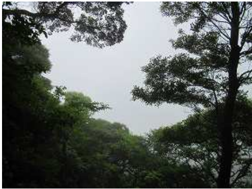
小屋裏からの展望は得られず。