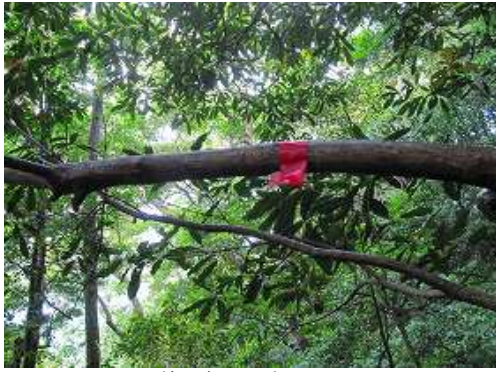
枝に赤テープを見る。