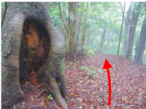
ウロのある大木を抜ける。