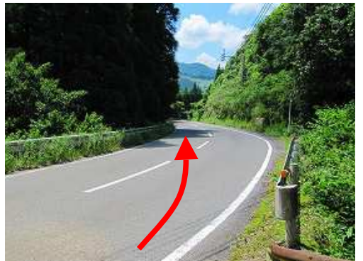
県道宮崎北郷線を道なりに下って行く。