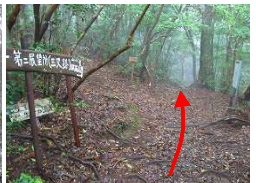
ひょうたん淵分岐に出会い、直進する。