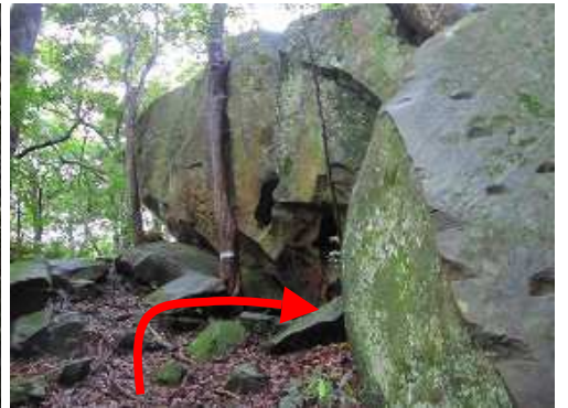
ルンゼトンネル 右折する。