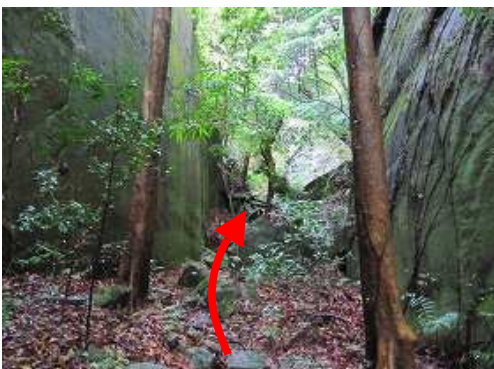
両側岸壁の中央部を抜ける。