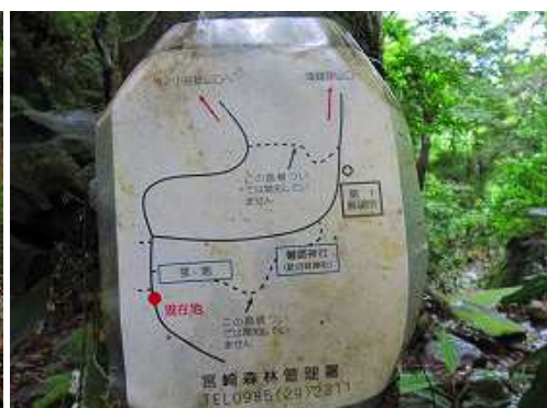
宮崎森林管理署の案内板を見る。