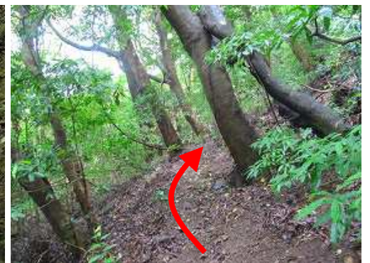
明るい樹林を下る。