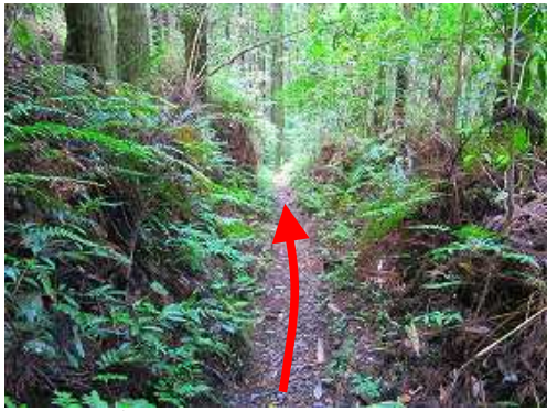
北西から南東に向かう営林署の 営林道 に合流し、北西に下って行く。