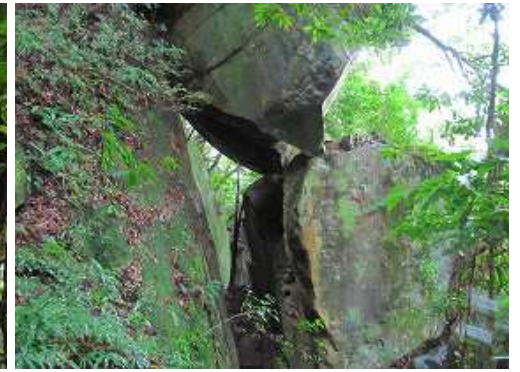
弥五郎どんの大岩