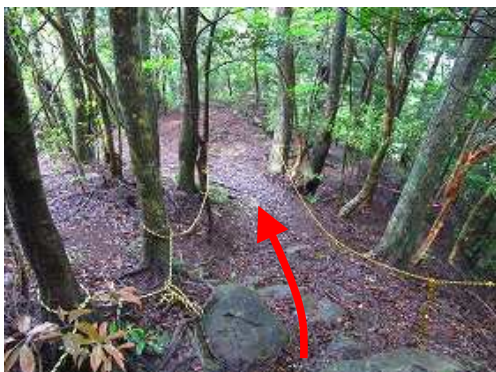
南へトラロープ斜面を下る。