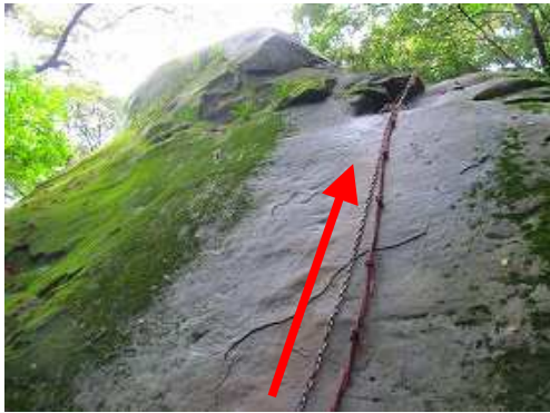
垂直に近い大岩を慎重に登る。