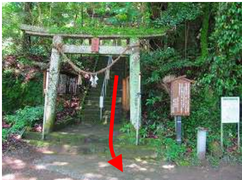
石段を下ると 九平登山口 である。