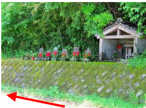
山側に並ぶ 前掛け地蔵 を通過する。