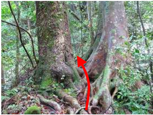
上り詰めて、2本の大木の間を抜け右に向かう。