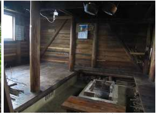
整理整頓され、きれいな室内。