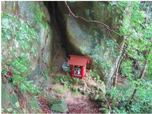
ターンして下ると岩陰に赤い祠が祀られている。