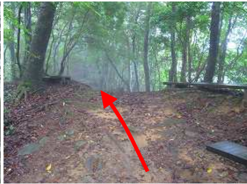
山頂を目指し、尾根筋を進む。