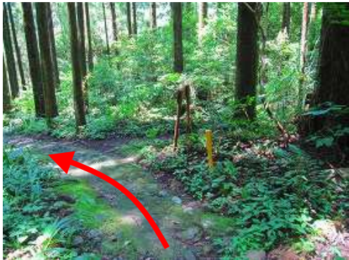
営林道入口 を通過する。