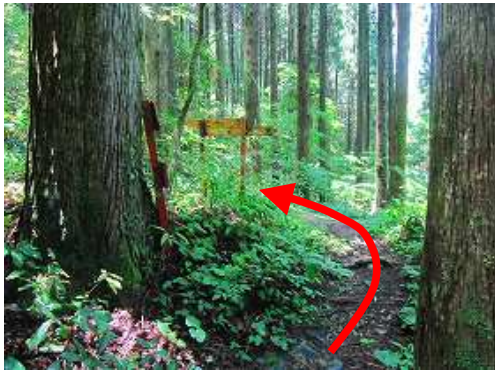
営林道入口 に出会い、左折する。