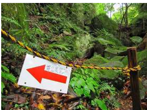
トラロープと案内板を見る。