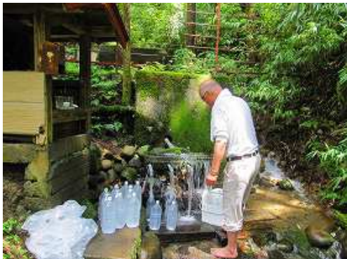
南の沢の上流にある 水場 。