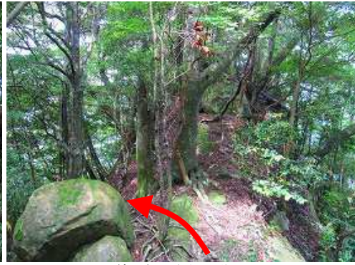
枝尾根の左側へ移る。