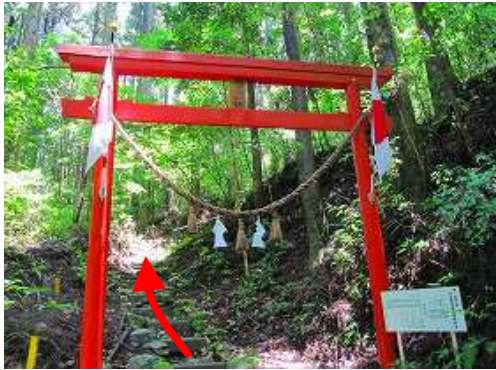
左へ 姥嶽神社入口 の鳥居をくぐる。