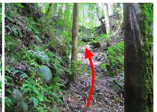
この弱い涸れ沢を詰め上がる。