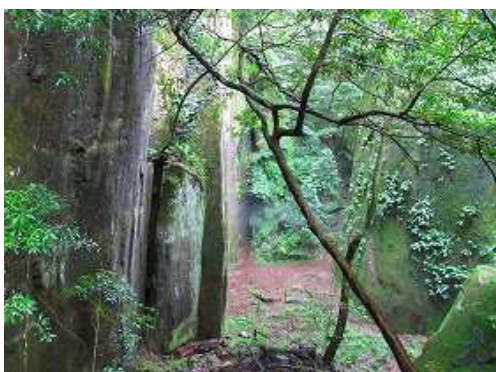
象の墓場の出口より振り返る。