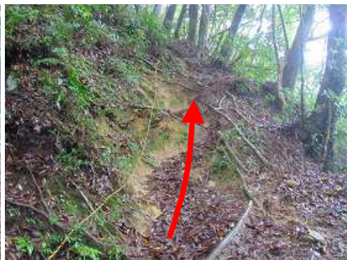
滑りやすい斜面にはトラロープが張られている。