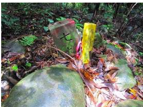
七九杭に出会い、南の沢側へ進む。