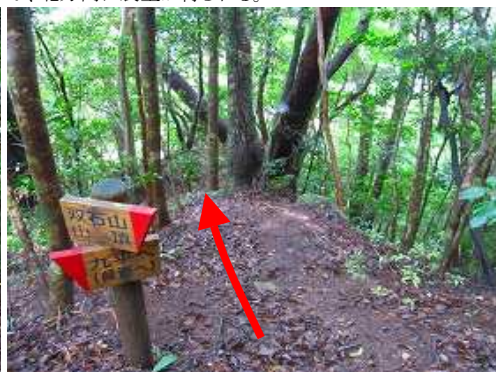
この案内板の所が磨崖仏分岐。西の枝尾根に入る。 ※初心者は、絶対に立ち入らない事!