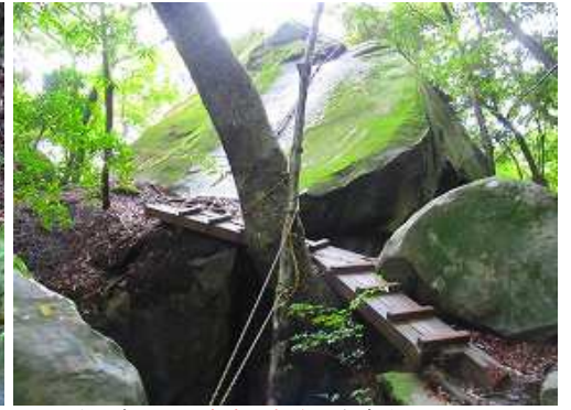
上り詰めると、大岩展望台が左方向に現れる。