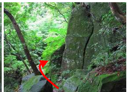
小谷からのルートに合流し、右へ進む。