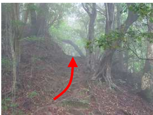
ガスの尾根筋を行く。