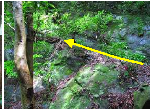
右岸の壁に沿って斜上する踏み跡がある。