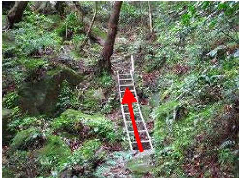
左手のステンレス階段に取付く。