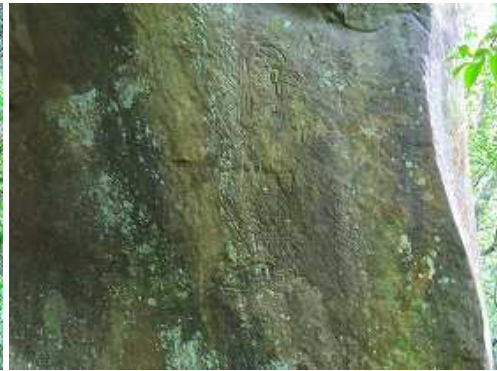
壁面の右側に彫られた磨崖仏。正式名は姥ヶ嶽仙楼巖不動明王。