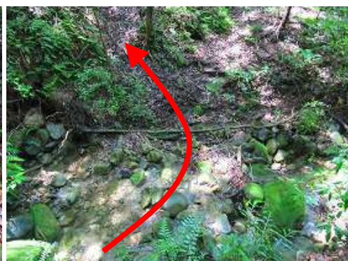
弱い沢を渡渉する。