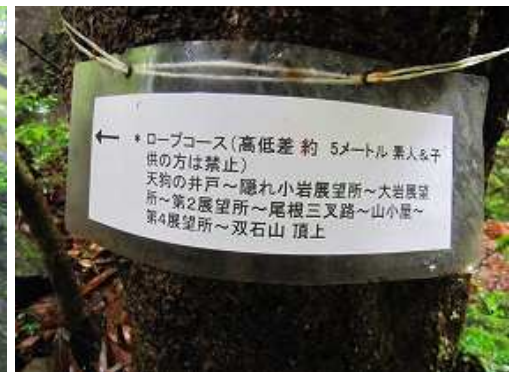
出口付近の案内板。