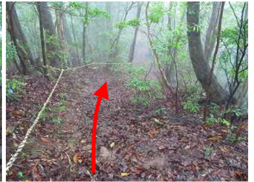
尾根筋にもトラロープがある。