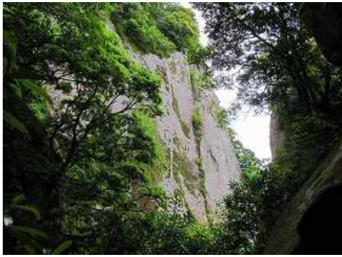
左奥に屏風岩を見る。