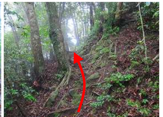
尾根筋の左斜面を緩やかに登って行く。