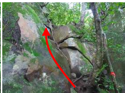
左側のロープをよじ登る。