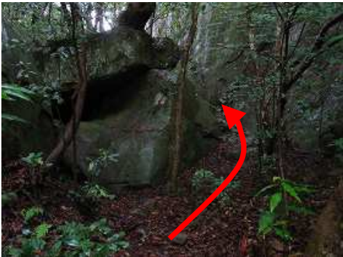
この岩の右を抜ける。