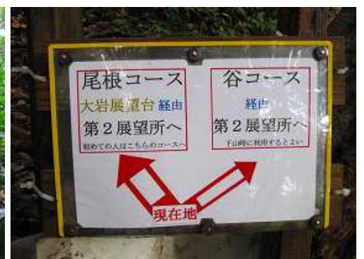
尾根谷分岐に出会い、左尾根コースへ進む。