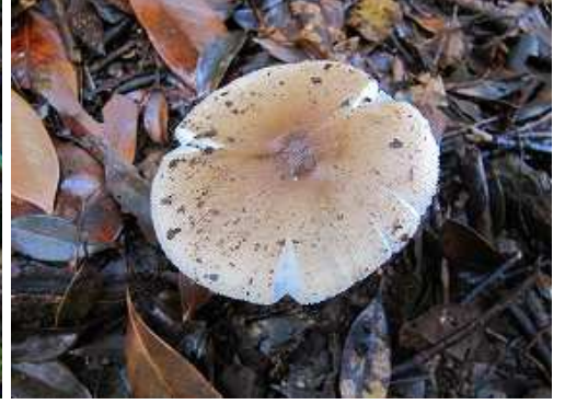
コテングタケモドキ