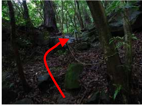
トラロープを登る。