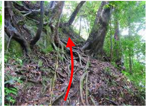
南側の枝尾根を登り返す。