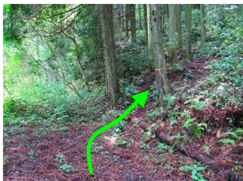
林道終点から右のスギの植林帯へ入る。