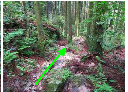
スギの植林帯を下って行く。