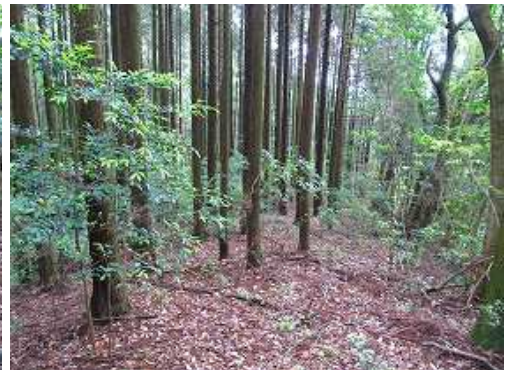
スギの植林帯を行き、前方の傾斜が急になる手前で左へ斜面を下る。