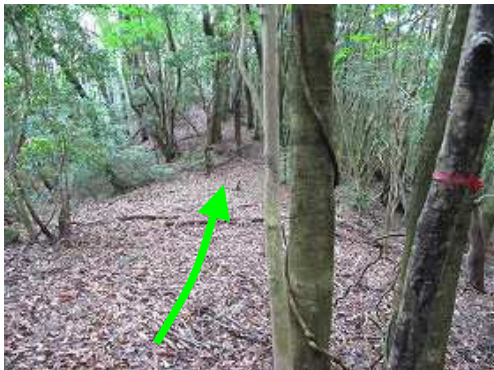
傾斜が緩み弱い鞍部を行く。