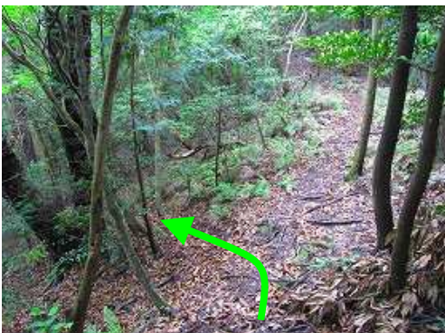
尾根筋から東側斜面の弱い踏み跡を辿る。