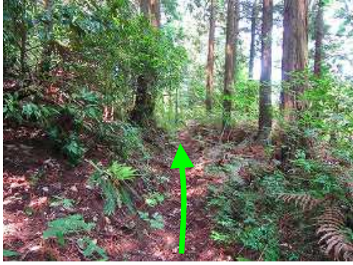
明るい山道に行く。