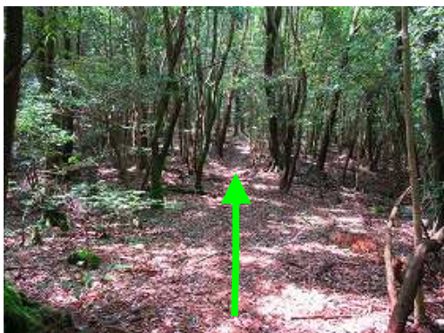
自然林を緩やかに行く。