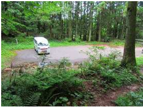
寺倉登山口に帰着いた。