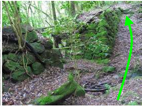
石橋の山側を抜ける。