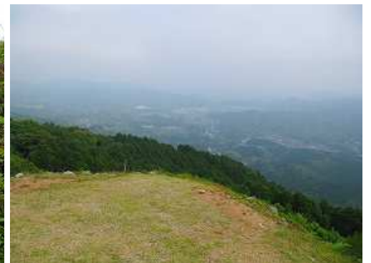
展望斜面 から北の方向を見る。