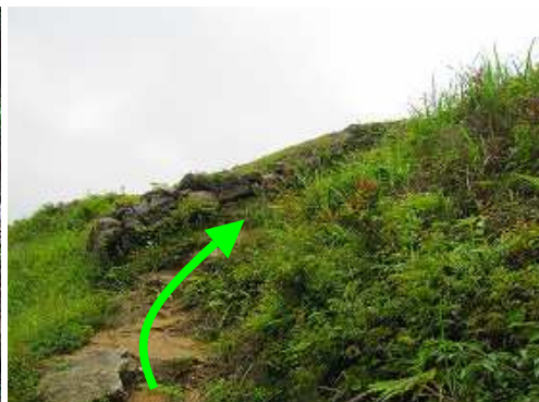
自然林を抜けると前方が開けた。