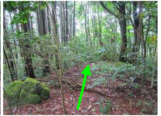
山頂から南東に派生する尾根筋へ入る。