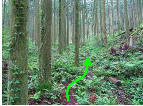
スギの植林帯の中を緩やかに登って行く。