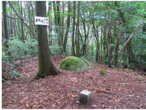
成竹山(580m)の山頂には三等三角点成竹が設置されているが、周囲を樹木に遮られ展望は望めない。