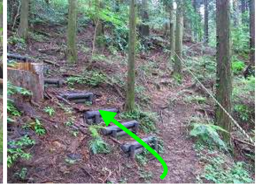
程なくトラロープが現れ、その先で左の擬木階段を上る。