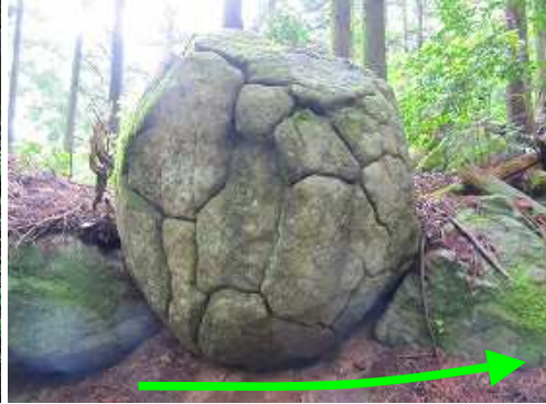
踏み跡を辿り登って行くと左側に表面にクラックが入った丸い石(恐竜の卵)を見る。