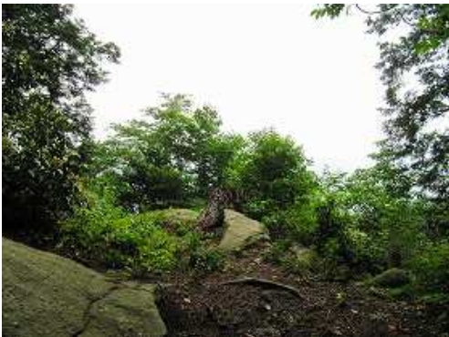
登り詰めると左手に 展望岩 がある。