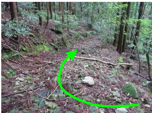
作業路に合流し右へ下って行く。