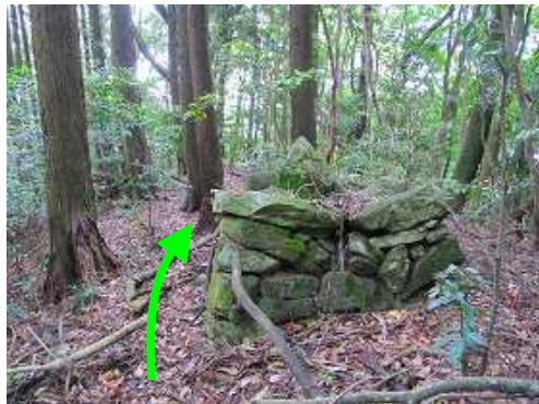
緩く登ると境界石積みが見れ、左を抜ける。