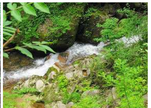
左下に沢の流れを見る。