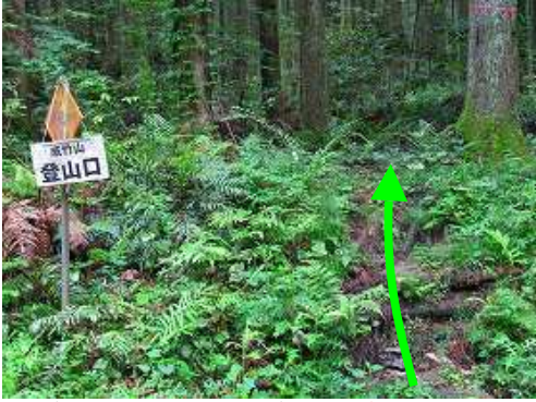
寺倉林道終点に車を止め両側の 寺倉登山口 から山へ入る。

寺倉登山口～尾根分岐～展望斜面～成竹山(580m)～作業路合流～林道合流～林道終点～展望地～二俣～山荘跡分岐～中村山荘跡～寺倉登山口