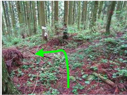
道なりに下り合流点を左へ下って行く。