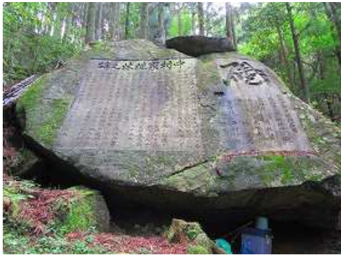
石段を下り、振り返ると大岩に刻まれた植林碑がある。