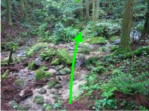
直ぐに渡渉して対岸へ渡る。