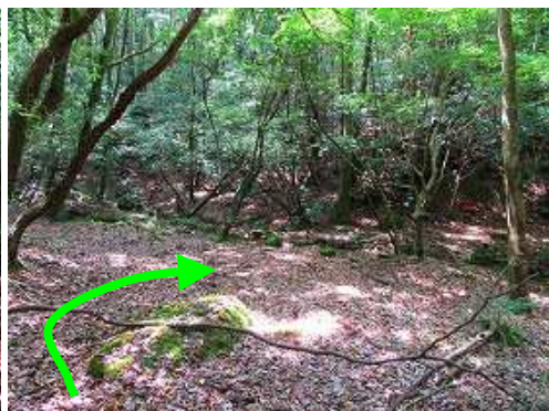
分岐に出会い右へ向かう。