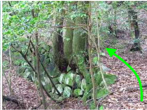
しっかりした石積みの道を行く。