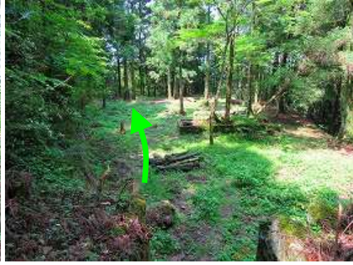
中村山荘跡を抜ける。