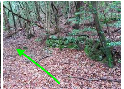
右に炭焼き窯跡を見て抜ける。