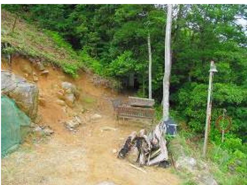
展望斜面には、ベンチやポストもある。