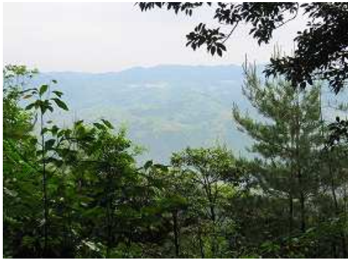
展望地からは北東の山並みが見渡せる。