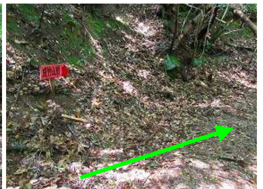
沢を渡渉した先の左にある案内板。