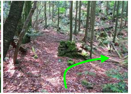
程なく山荘跡分岐に出合い右に向かう。