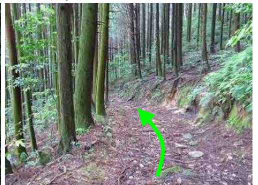
作業路らなくなった道を下って行く。