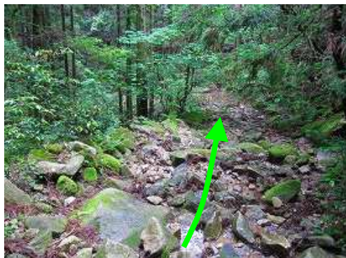
沢筋のような作業路を道なりに下って行く。