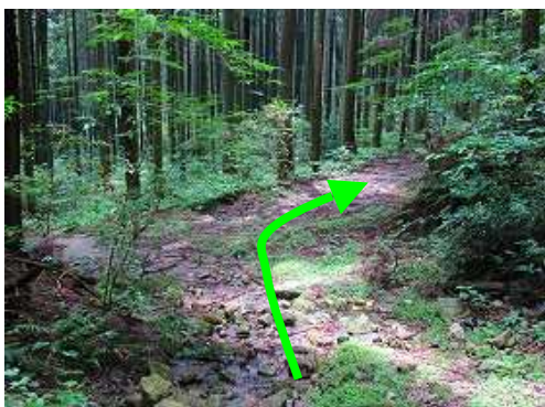
成竹林道に合流し、右へ向かう。