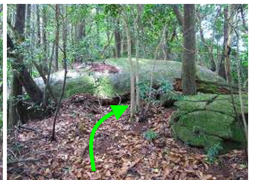
ナマコ岩 の右を抜ける。