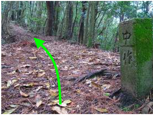
尾根筋に中作の杭を見る。