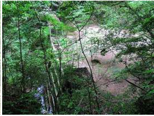
左下に砂防ダムを見る。