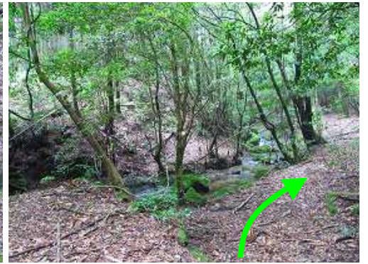
二俣に到着。右へ向かう。