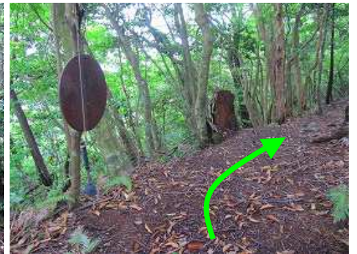
尾根に上がると左に 鉄板 と ハンマー を見る。