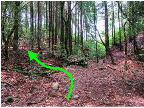
一四石柱分岐から左へ向かう。