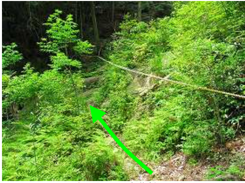
トラロープが張られた崩落斜面を抜ける。