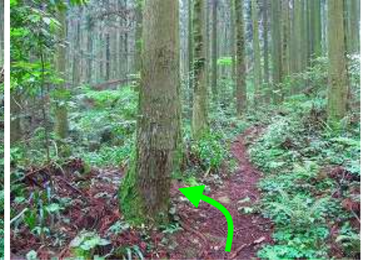
左に沢音が近づいたら 尾根分岐 から左折する。