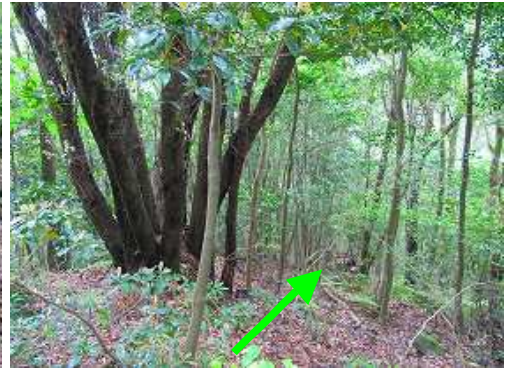
8本の幹が合体した八又木の右を下る。