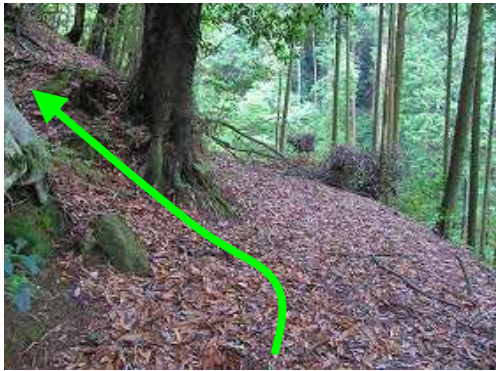
左の斜面に取付く。※直進すると崩落斜面の上部に出る。