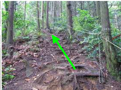
トラロープが張られた急斜面を登って行く。