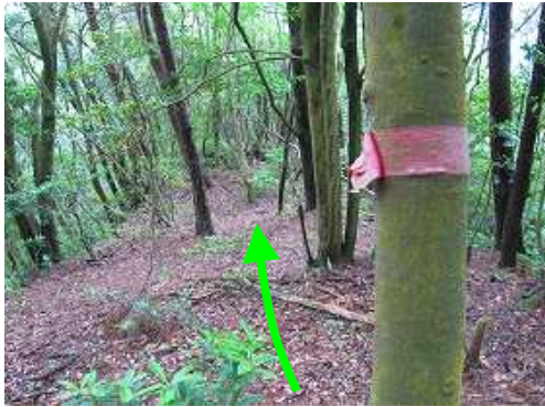
尾根筋に残る古い赤テープを拾いながら自然林の中を下って行く。