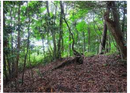
ターンして登ると展望地。