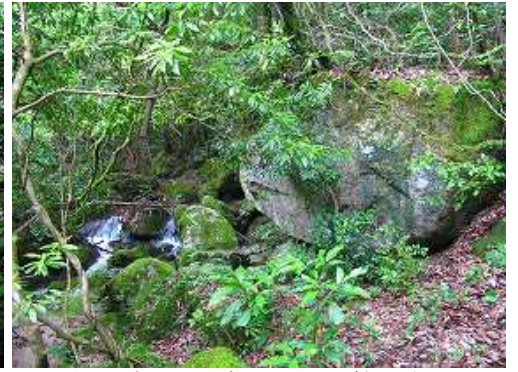
光明が滝入口から右にターンして斜面に行く。