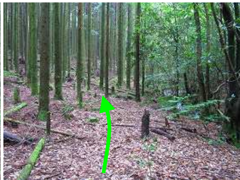
スギの植林帯を抜ける。