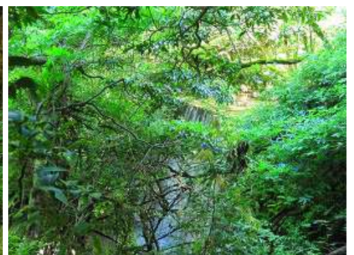
左岸を行くと、左に堰堤を枝越しに見る。