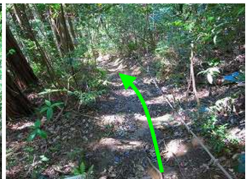
ロープの張られた土階段を下る。