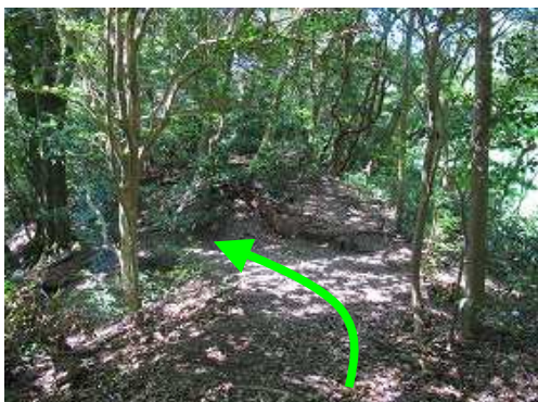
平坦な尾根筋を行く。