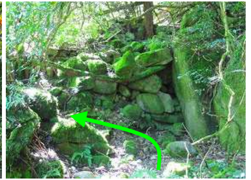
石の堆積地は左へ回り込んで抜ける。