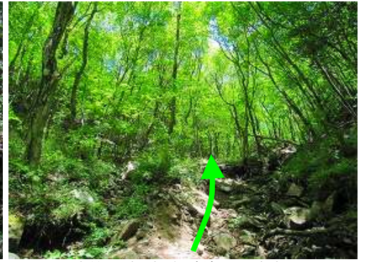
水量も少なくなり源流域の呈をなす。