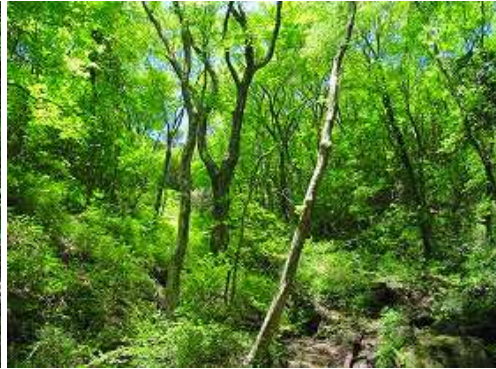
直ぐに 左斜面取付 に出会う。目印はY字の立木。