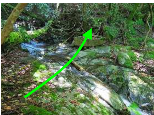
トラロープを伝って左岸へ渡渉する。大滝の下部である。