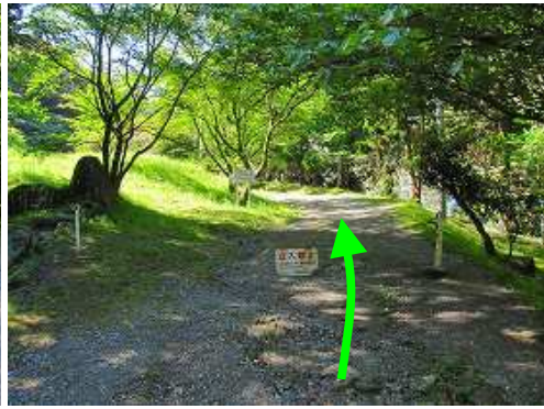
河原谷への一般路に行く。