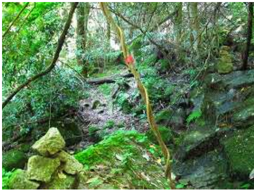
沢の中、ケレンや赤テープを拾いながら行く。