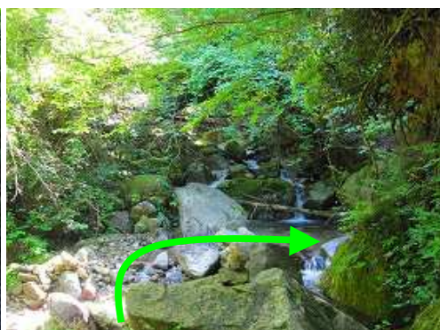
草ヶ谷に出会い、左岸を伝い自然林に行く。