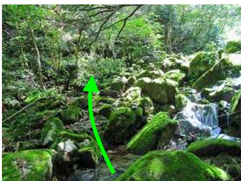
二俣の左俣に入り右岸に渡渉する。