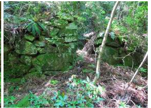
右に炭焼窯跡を見る。