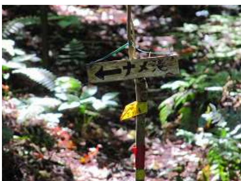
程なくナメ滝の案内板を見る。