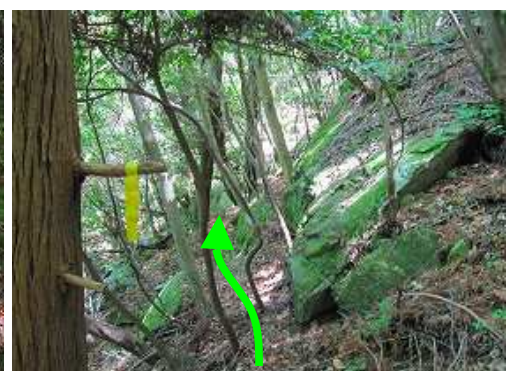
黄テープが大滝上部入口の目印で沢へ下る。