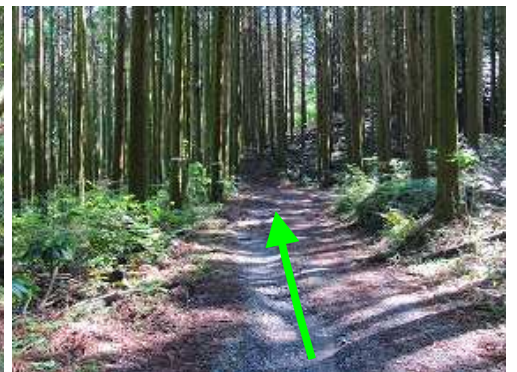
スギの植林地に入っていく。