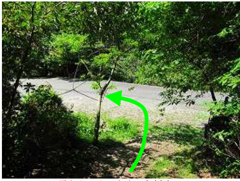
頭巾山登山口を出て左折する。