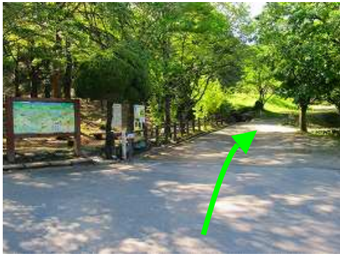
櫛谷(ツキダニ)駐車場に止めて歩き始める。

櫛谷駐車場～草ヶ谷分岐～草ヶ谷取付～ナメ滝～岸壁～二俣～大滝上部入口～角石～左斜面取付 ～頭巾山(901m)～頭巾山登山口～櫛谷駐車場