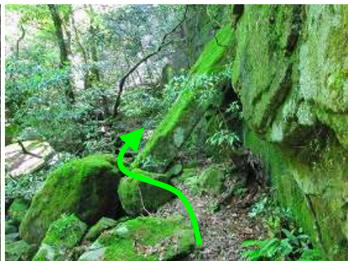
その先でもたれ岩をかわす。