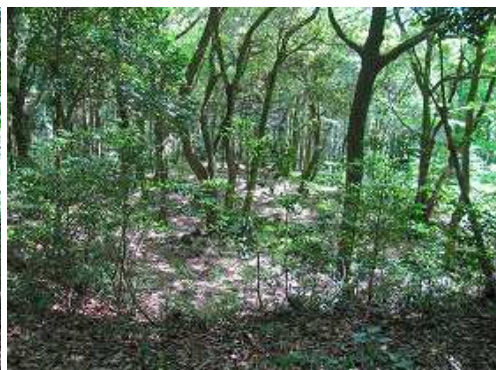
左の平坦地は 正楽寺跡 。