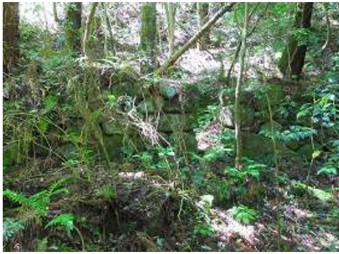
右に炭焼窯跡を見る。