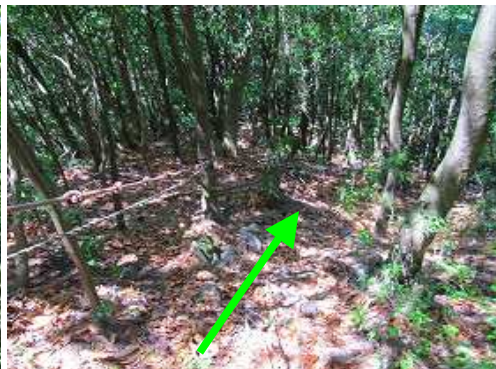
ロープの張られた急斜面を下る。