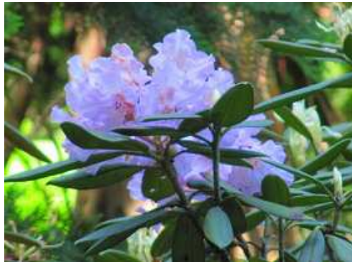
ツクシシャクナゲ