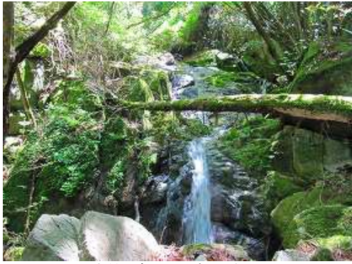
水量の多い沢を詰めて行く。