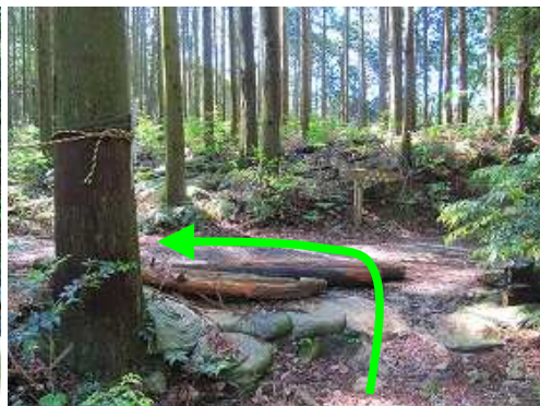
草ヶ谷分岐に出会い左折する。