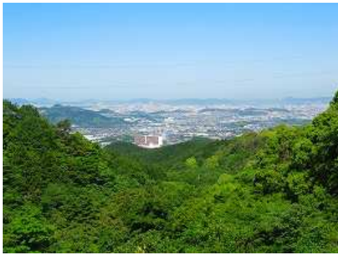
草ヶ谷ダムの堤からは福岡市方面が望まれる。