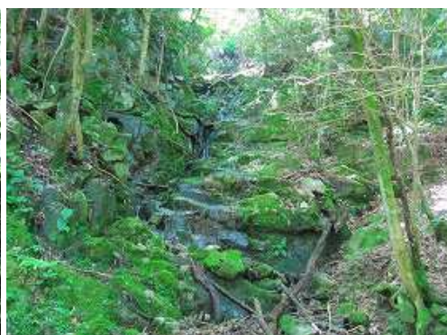
二俣の右俣は、弱い滝が落ちている。