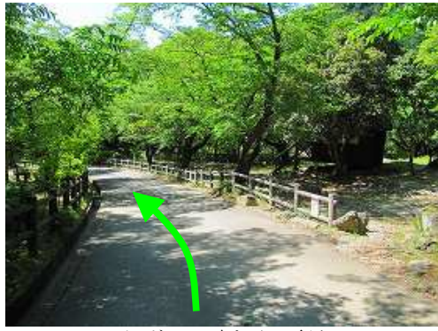
バンガローの中を下って行く。