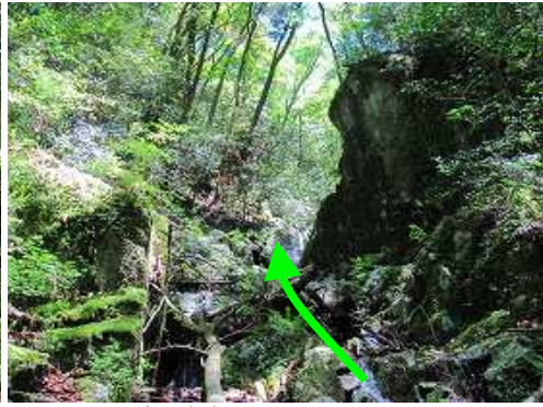
右に大岩のある 関門 を抜ける。