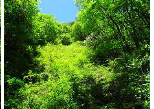
崩落斜面のヤブを漕いで行く。