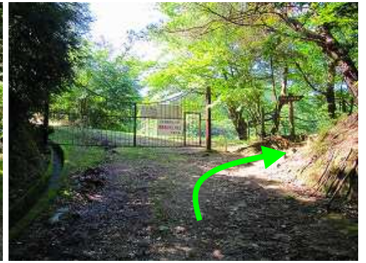
ゲートの右を巻いて抜ける。