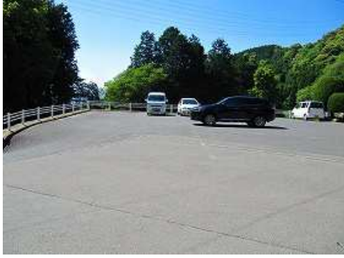
榎谷駐車場道に帰り着いた。