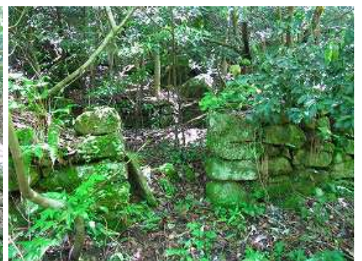
左に炭焼窯跡を見る。