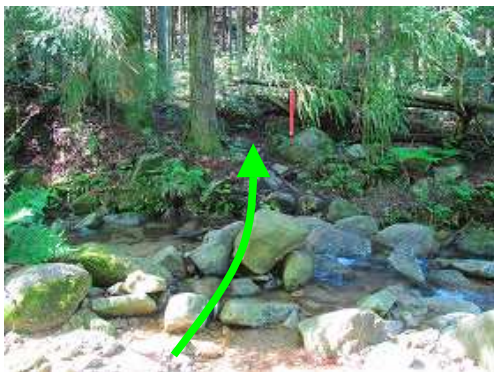
小さな沢を渡渉する。