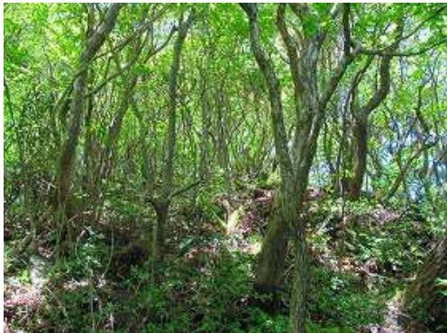
頭巾山の山頂部が見えた。