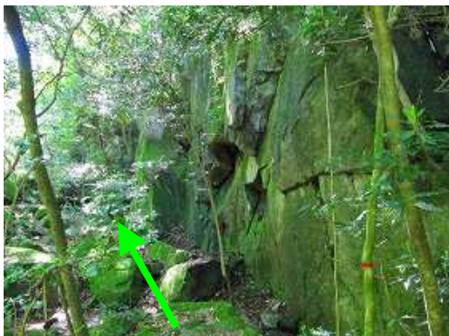
左岸の岸壁の下を通過する。