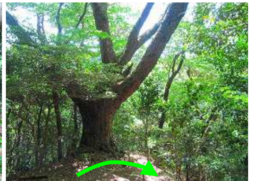
大木 の脇をターンして下る。