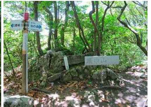
頭巾山(901m) の山頂。樹木に遮られ展望は得られない。