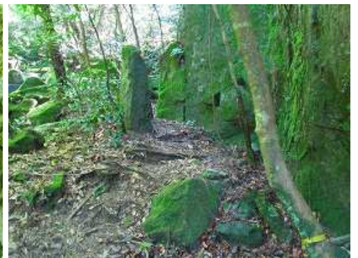
その先に板岩が立つ。