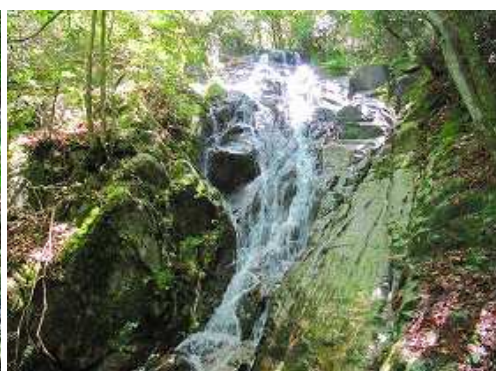
左岸から大滝上部を見る。