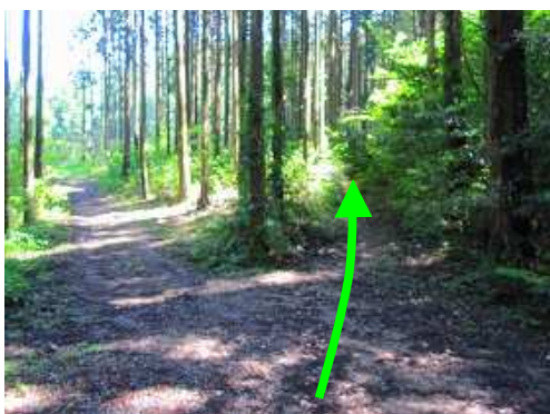
草ヶ谷取付 右の小道に入る。