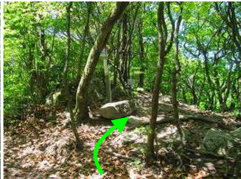
山頂の東側5mの所に出た。