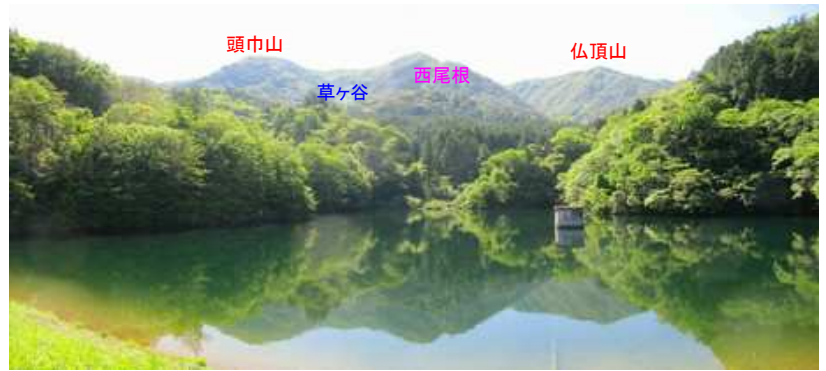
草ヶ谷ダムの堤から難所ヶ滝のある西尾根や頭巾山を望む。