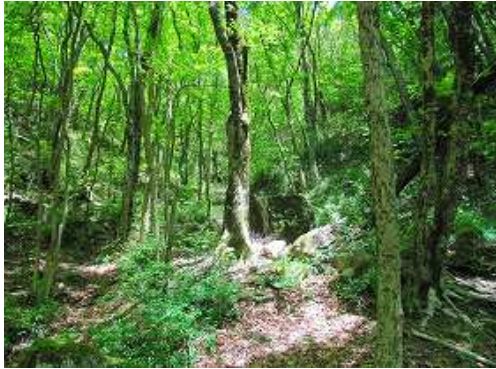
立方体の 角石 を見る。