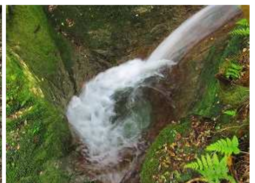
釜は結構深そうだ。