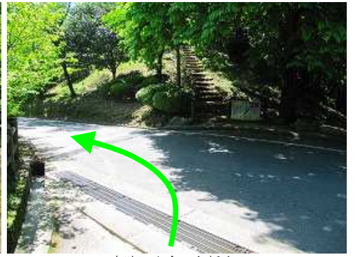
T字路に出合い左折する。