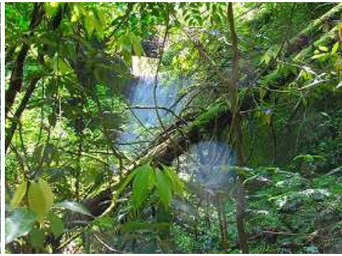
直ぐ左に堰堤を枝越しに見る。