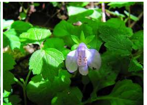
ムラサキサギゴケ