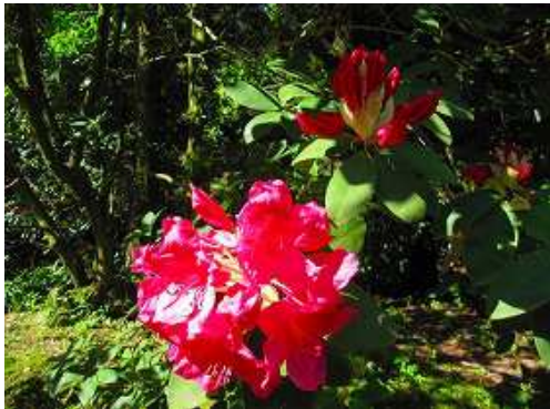
セイヨウシャクナゲ