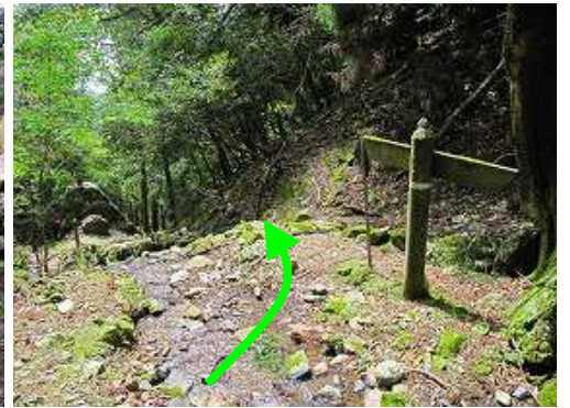
紅葉谷分岐に出会い左へ下って行く。