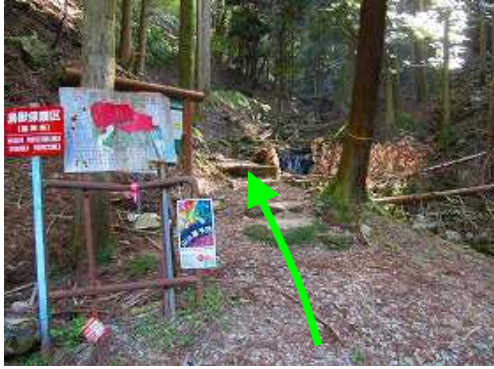
5合目登山口は古処林道の終点で20台程度駐車できる。沢の右岸を上って行く。

5合目登山口～水舟～馬攻場～古処山(859m)～ツゲ林分岐～屏山(927m)～ツゲ林分岐～ツゲ林入口～紅葉谷分岐～5合目登山口