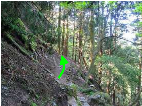
右に緩やかに巻くように進む。