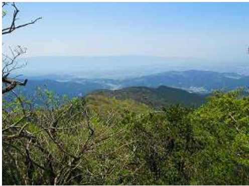
南に伸びる尾根と、その先の久留米市方面を望む。