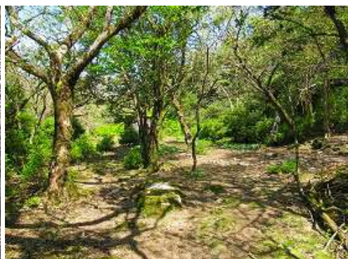
9合目の先で、左の踏み跡を辿り馬攻場に着いた。