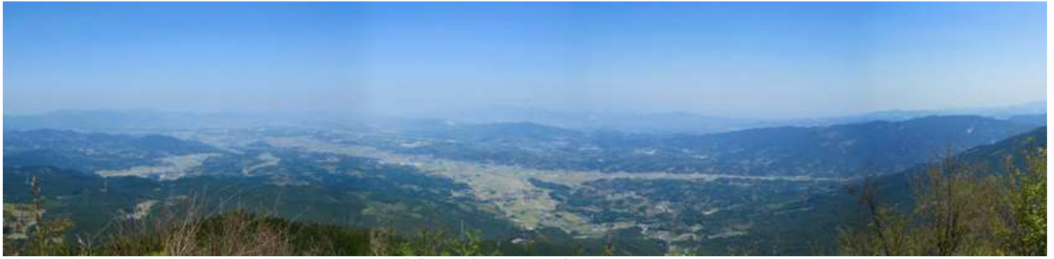
北北西から東にかけての展望が得られる。