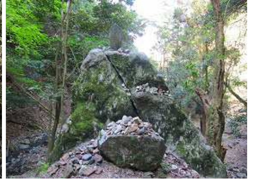
右手に牛嶺を見る。