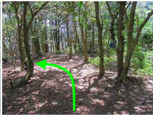
ツゲ林分岐を右に見て、直進する。