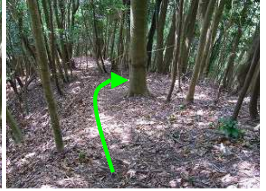
トラロープから右折する。