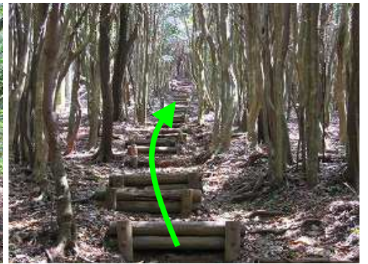
丸太階段を上って行く。