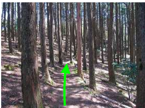
ヒノキの植林帯を抜ける。