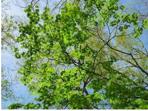
新緑の緑が輝いている。