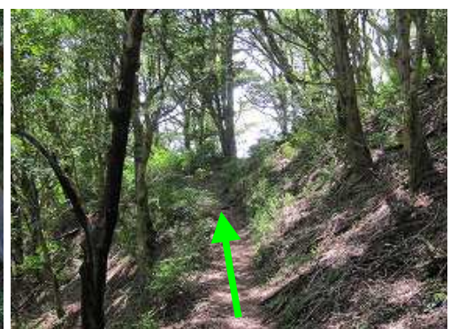
ツゲ林入口が見えて来た。