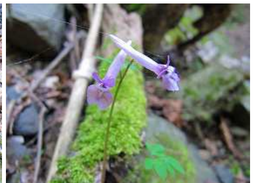
ジロボウエンゴサク