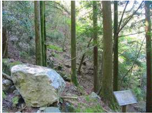
右に三角杉を見る。