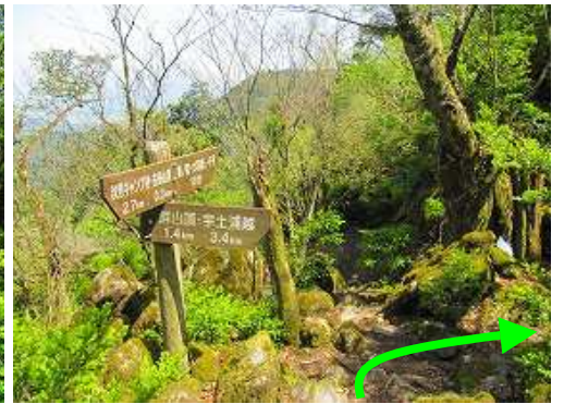
尾根筋の奥の院分岐から右に下る。