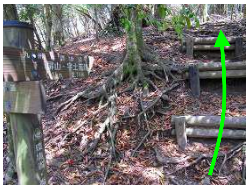
屏山0.1kmの案内板を見る。