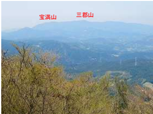
北西方向に宝満山から三郡山が望める。