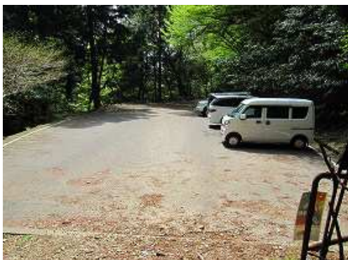
5合目登山口に帰り着いた。