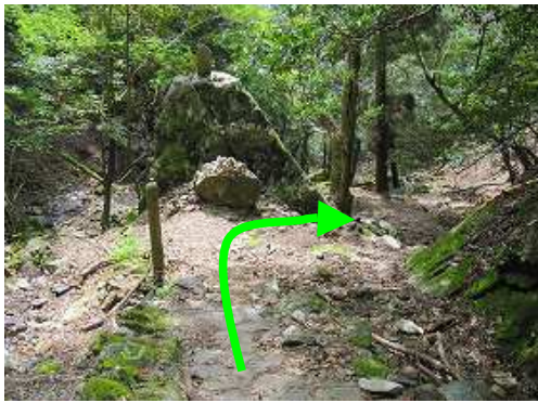
牛巖の右を抜ける。