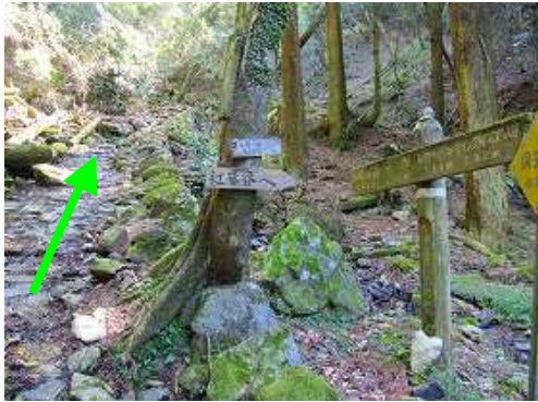
直ぐ上で右に紅葉谷分岐を見て石畳を上って行く。