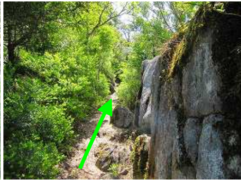
ツゲ林の中を抜ける。