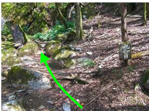
九合目を通過する。