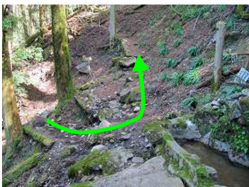
水舟で転回し斜面を緩やかに登って行く。