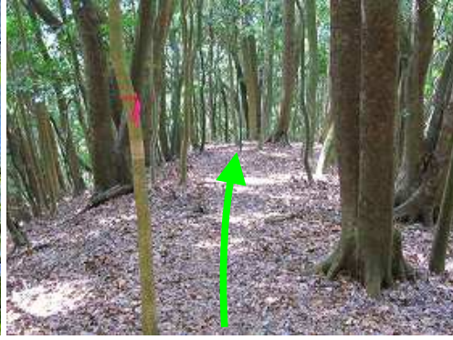
尾根筋を西へ下って行く。