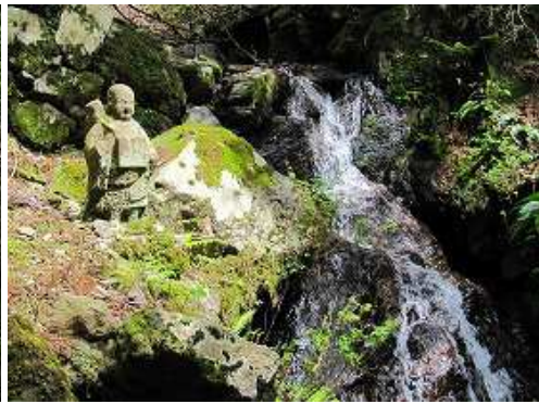
左に石仏と白糸の滝を見る。