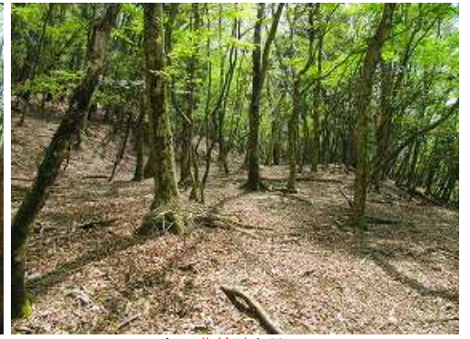
左に曲輪跡を見る。