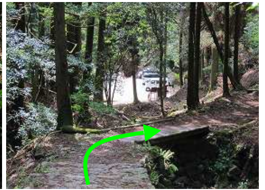
5合目登山口が見えて来た。