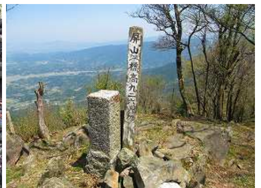
屏山(927m)の山頂には三等三角点:桶底が設置されている。