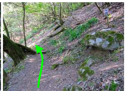
右に屏山分岐を見て通過する。