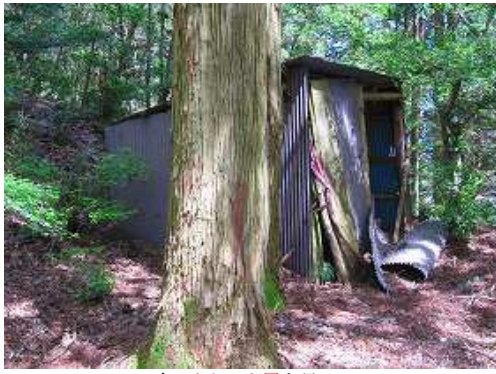
左にトタン小屋を見る。