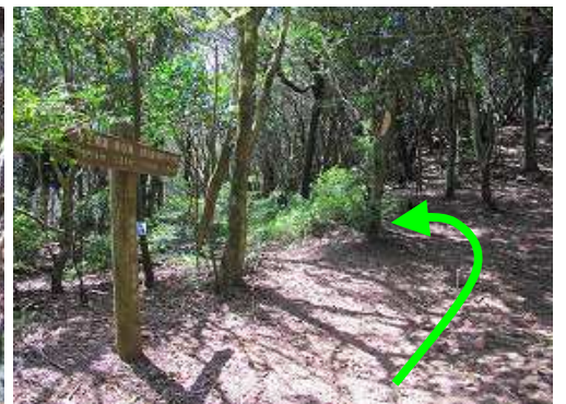
ツゲ林分岐まで下り縦走路から左へ入る。