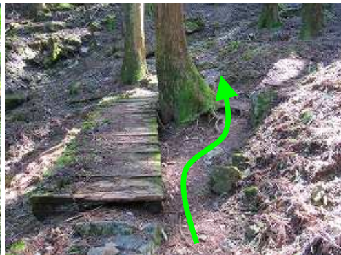
板張りの右を抜ける。