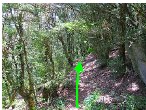
ツゲ林の中を行く。