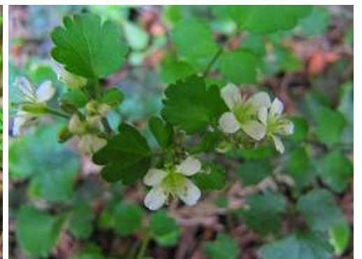
マルバコンロンソウ