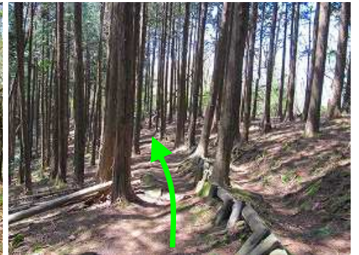
ヒノキの植林帯を抜ける。