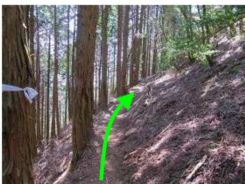
左側植林帯の山腹を下って行く。