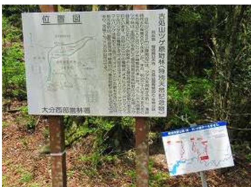
ツゲ林入口の案内板。