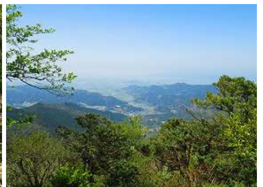
開けた所から秋月の町並みを見下ろす。