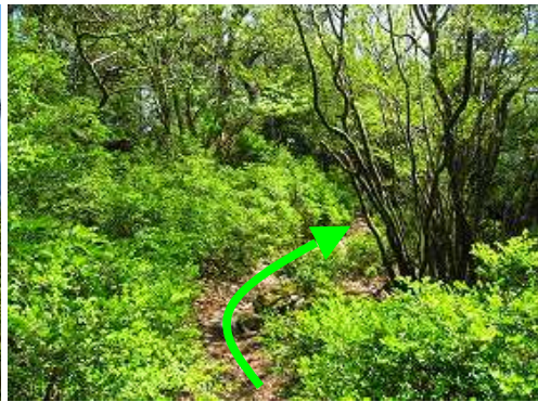
尾根筋の自然歩道に行く。