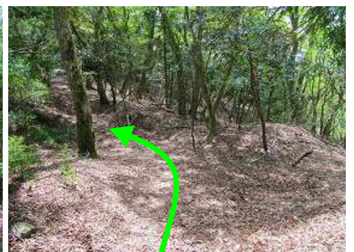
右に水舟分岐を見て直進する。