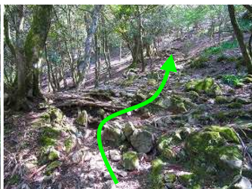
自然林の斜面を緩やかに登って行く。