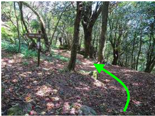
奥の院分岐を左に見て、右を下って行く。