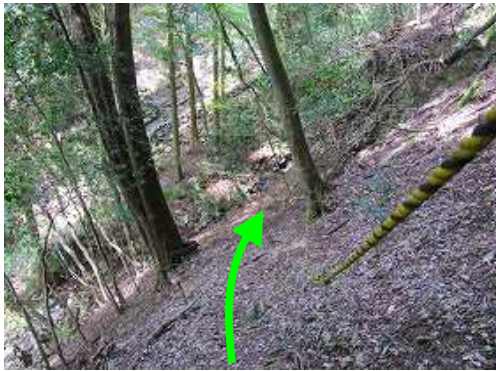
トラロープの張られた急な斜面を下ると、その先に沢が見える。