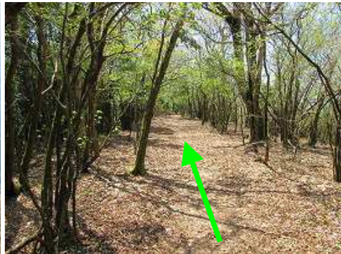
明るい尾根筋を引き返す。