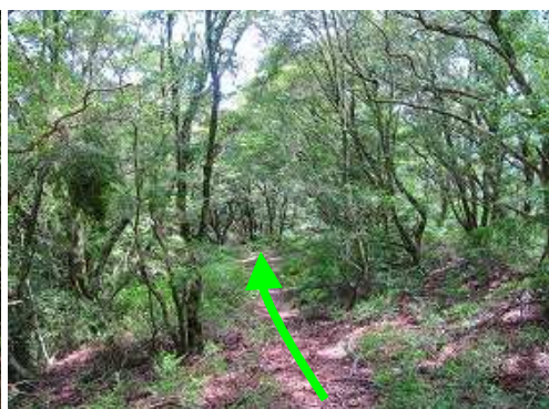
ツゲ林入口から南へ尾根筋を下る。