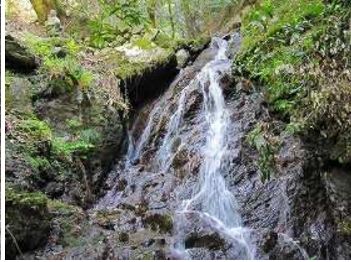
高さ3m程の白糸の滝を右に見る。