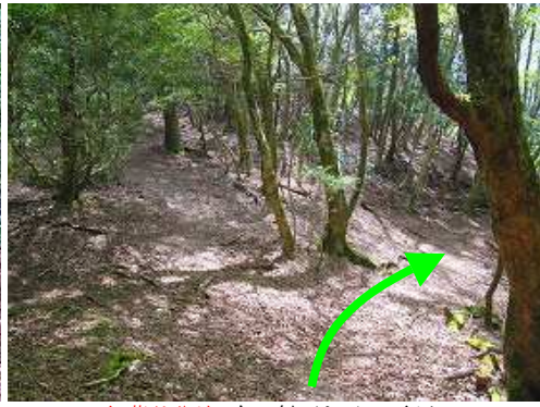
紅葉谷分岐 右へ斜面を下って行く。