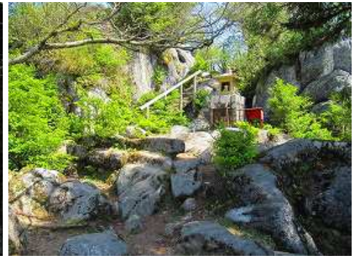
古処山山上部に到着。