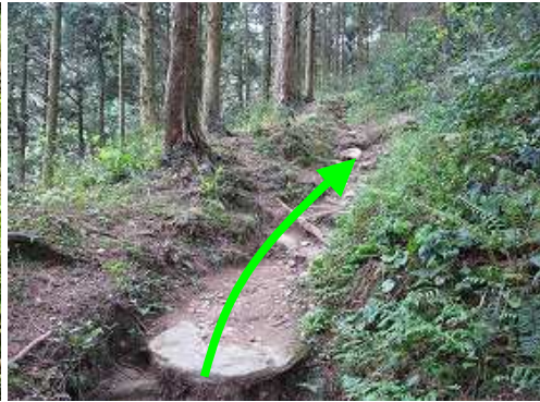
史跡コースを緩やかに辿る。