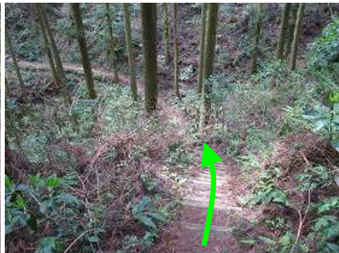
丸太階段を下り、小さな沢を渡る。