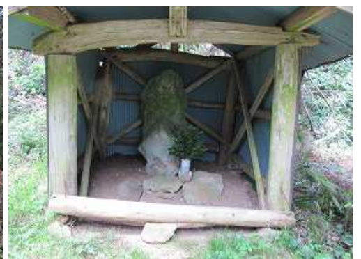
左(南側)の栗島大明神に立ち寄る。