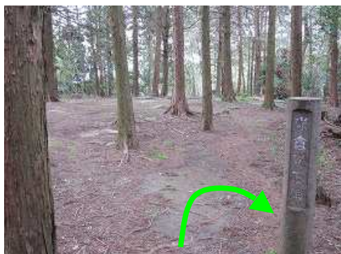
降り着いた所が米倉礎石群。西側斜面を下って行く。