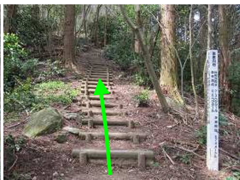
丸太階段を上って行く。