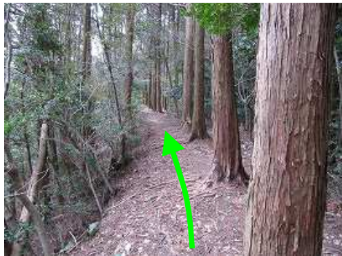
尾根筋の土塁を進む。