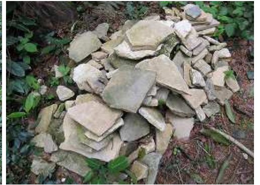
コース沿いに出土した陶器片が積まれていた。