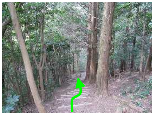
丸太階段を下って行く。