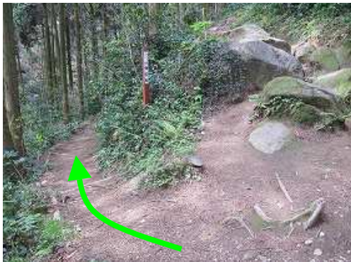
南水門分岐に出会い、左へ下って行く。