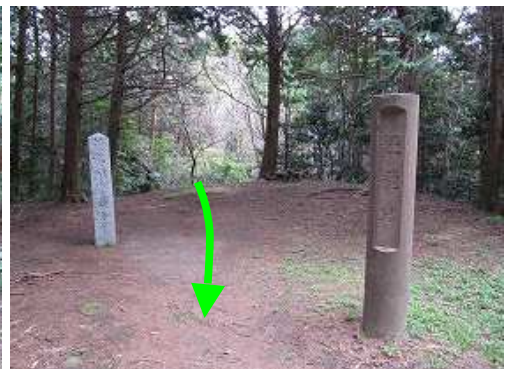
ひと登りすると鐘撞堂へ到着。