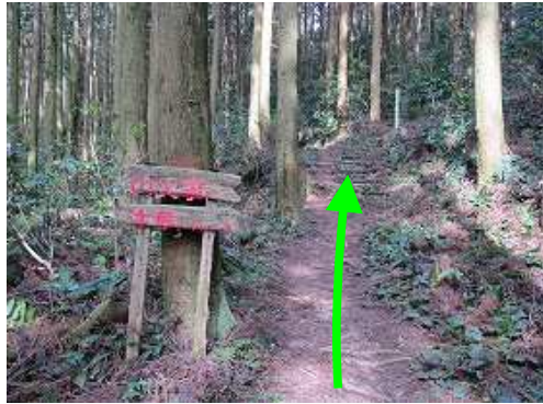
スギの植林帯を緩やかに上って行く。