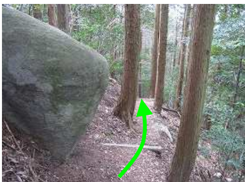
丸太階段を緩やかに下って行く。