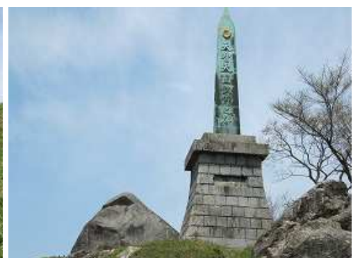
天智天皇欽仰之碑と曇々石(タマタマ石)。