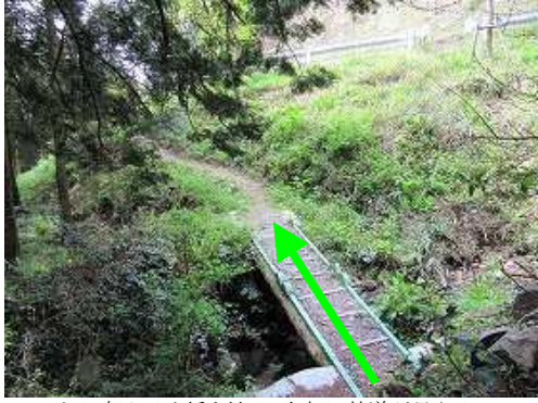
沢に架かる小橋を渡る。上部に林道が見える。