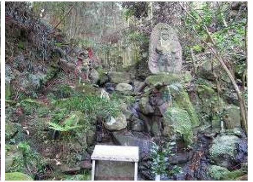
不動明王が祀られた修行場に到着する。