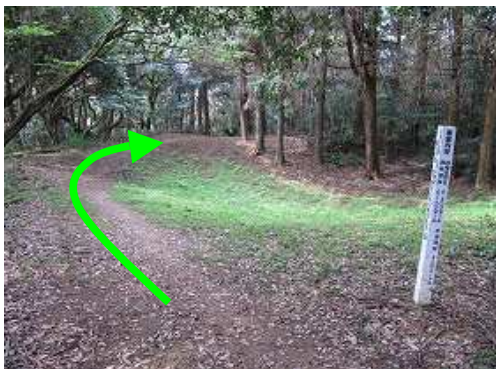
右につつみを見て通過する。