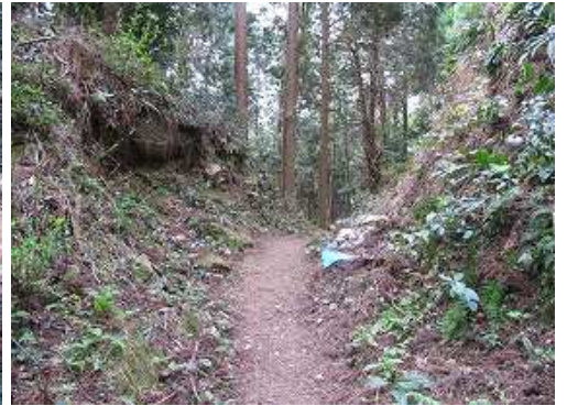
緩やかに上り詰めると東北門跡に到着する。