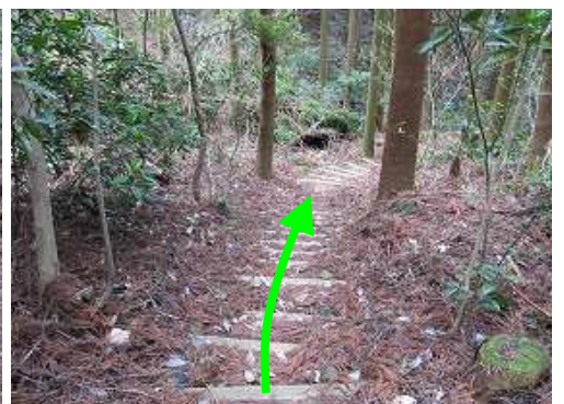
丸太階段を下って行く。