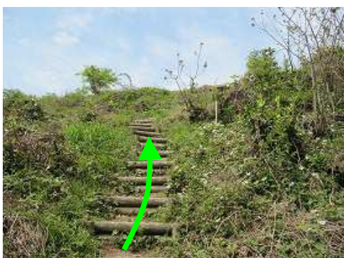
山上部が見えて来た。