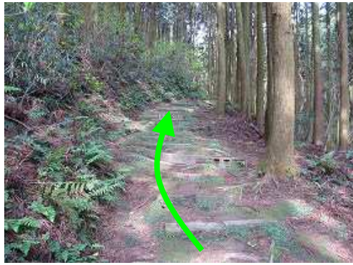
スギの植林帯脇の階段を緩やかに上って行く。