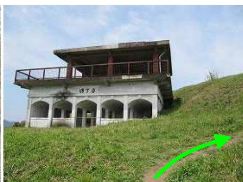
正面に東休息所を見て、右へ斜面を上る。