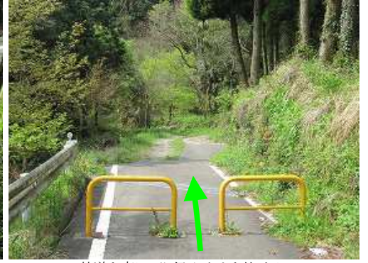
林道を南に下り侵入止めを抜ける。