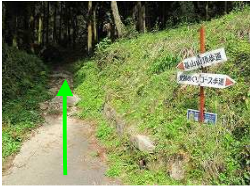
史跡コース入口の案内板から中へ入る。