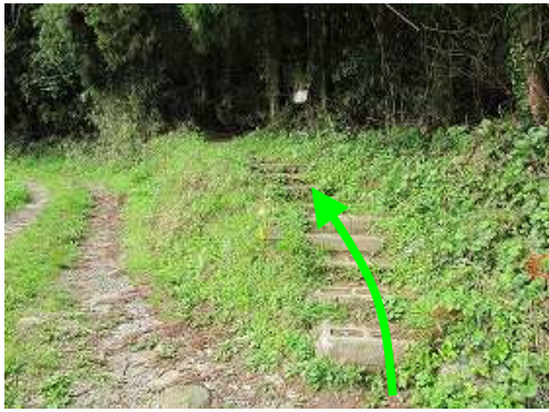
原田登山口に横の路肩に駐車し、林道脇の右手階段に取付く。

原田登山口～東北門跡～史跡コース入口～基山(404m)～展望台～北峰(412m)～鉄塔分岐～40鉄塔入口～原田登山口