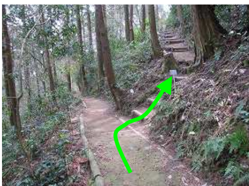
東休息所分岐に出会い、右へ丸太階段を上って行く。