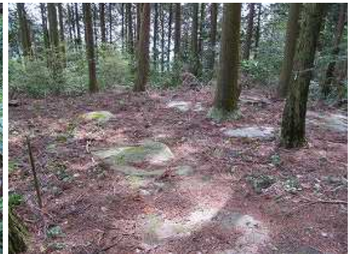
小高い尾根上にある礎石の脇を抜ける。