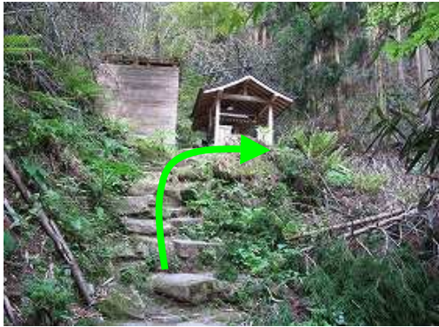
石段を上り右方向に修行場を抜ける。