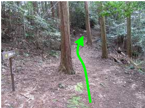
東の尾根筋に取付く。