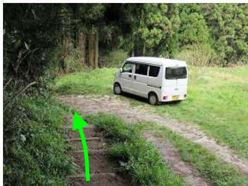
原田登山口に帰着いた。