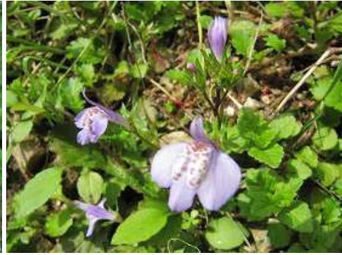
ムラサキサギゴケ