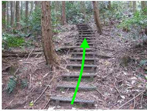
九電巡視路のブラ階段を上る。