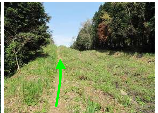
土塁線を緩やかに辿る。