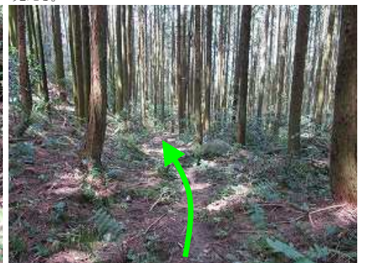
スギの植林帯を下って行く。