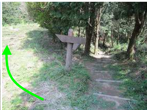
北帝門跡分岐から野焼きの済んだ土塁線を辿る。