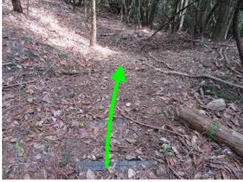
鉄塔を抜けた先で、右方向へブラ階段を下って行く。