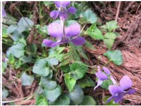
オオタチツボスミレ