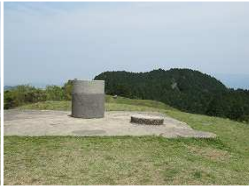
展望台からは360度の展望が得られる。