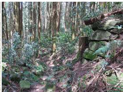
北帝門跡に残る石垣を右に見て北に下る。