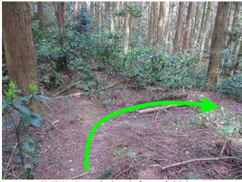
鉄塔分岐のT字路に出会い、右折する。