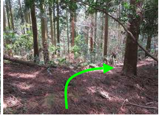
40鉄塔分岐を右折する。