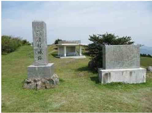
基肄城跡の石碑と西休息所。