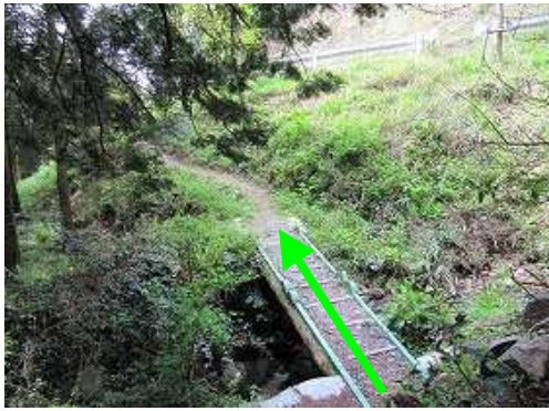
沢に架かる小橋を渡る。上部に林道が見える。