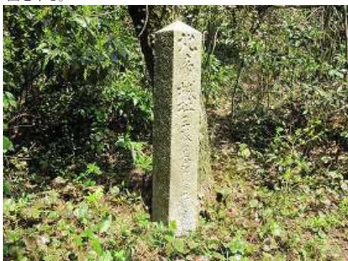
北帝城址の碑に立ち寄る。