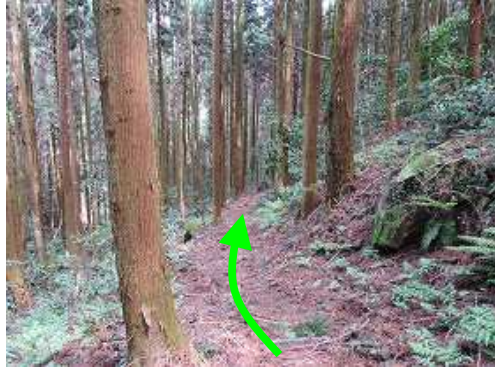
スギの植林帯の巡視路に行く。