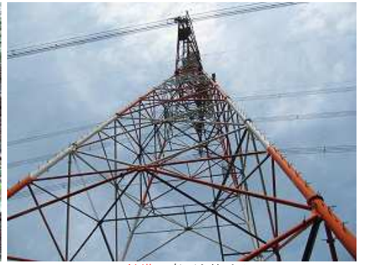
41鉄塔の真下を抜ける。