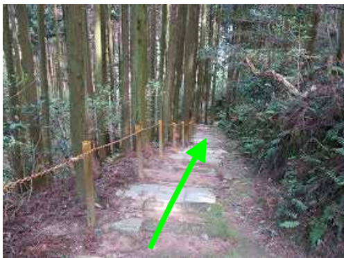
ブロック階段を下って行く。