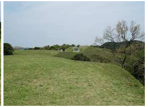
展望台方面を望む。