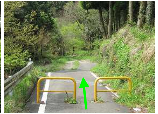
林道を南に下り侵入止めを抜ける。