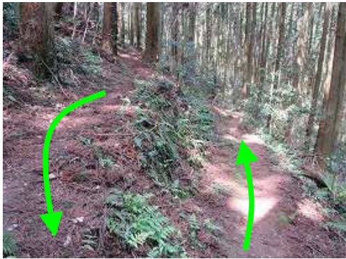
40鉄塔入口で一般道に合流し、左折して下って行く。