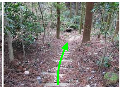
丸太階段を下って行く。