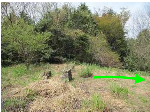
北峰(412m)からの展望は得られない。これより東側へ斜面を下る。