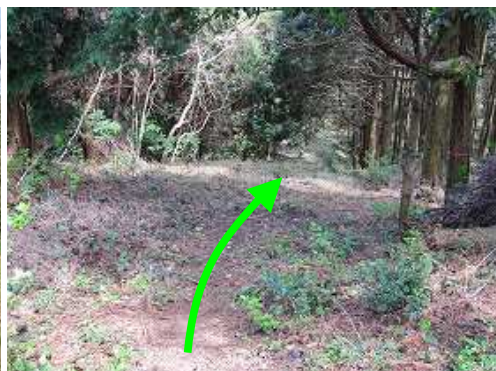
滑りやすい斜面を下る。