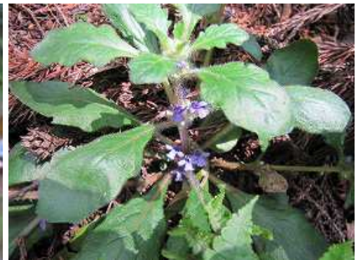
セイヨウジュウニヒトエ