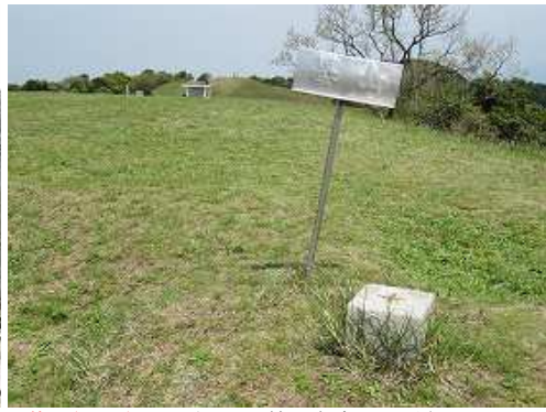
基山(404m)の山頂には一等三角点が設置されている。