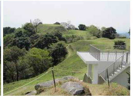
展望台から基山方向を望む。