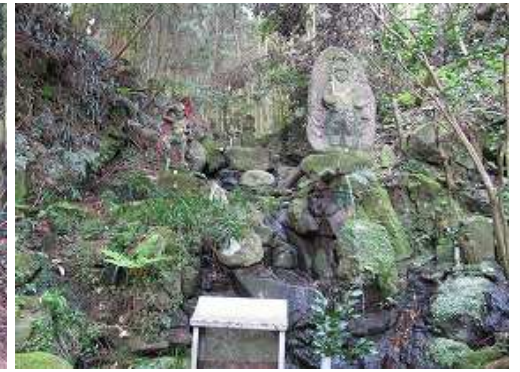
不動明王が祀られた修行場に到着する。