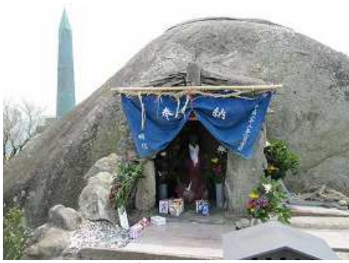
霊々石(タマタマ石)の正面。