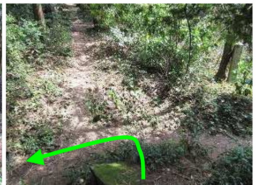
北帝分岐に降り立ち左へ向かう。右に北帝城址の碑が見える。