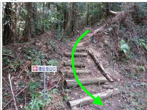
北側の雌岳登山口に降りる。