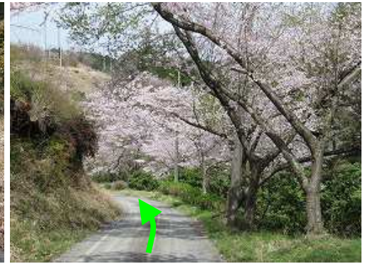
サクラ並木を緩やかに下って行く。