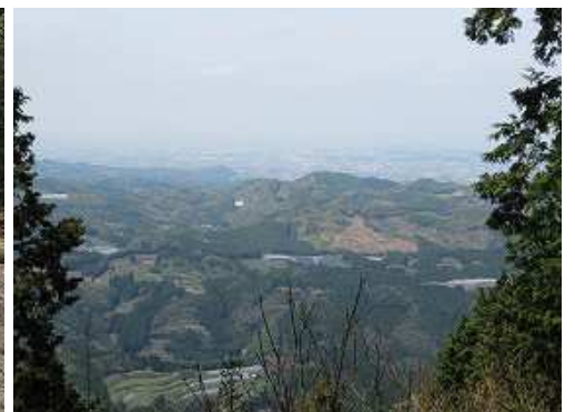
西側の開けた所から八女市を望む。