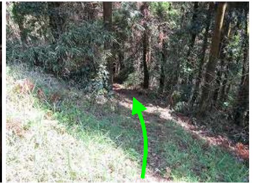
姫御所さん入口から東側の踏み跡へ下る。