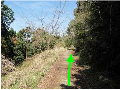
林道を道なりに引き返す。