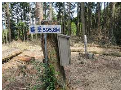
雌岳(596m)の山頂には二等三角点:女岳が設置されている。