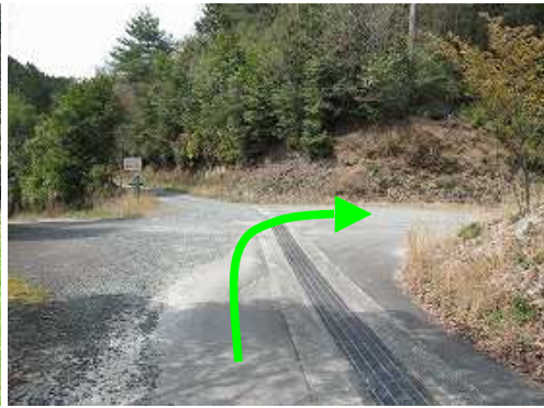
十字路に出合い右折する。