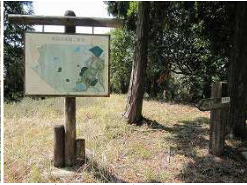
南岳(546m)の山頂部は草付である。