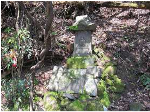
姫御所さんに参拝し、引き返す。