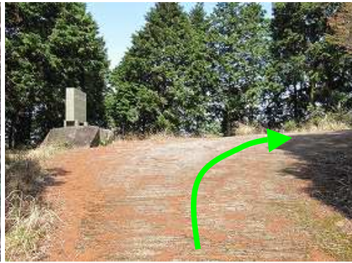
間伐作業道記念碑まで戻って来た。