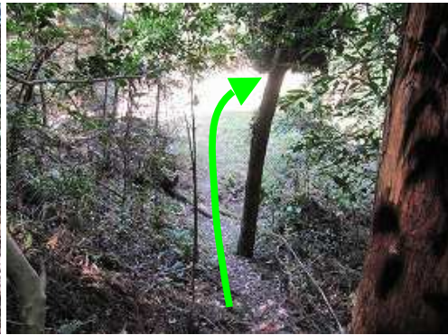
姫御前登山口へ戻り林道を右へ向かう。