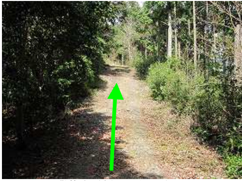
散策路を緩やかに上って行く。