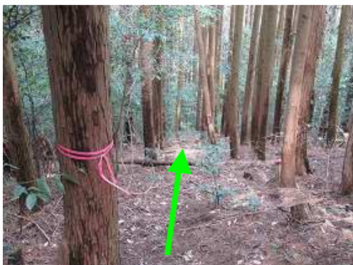
北側の滑りやすい急斜面を慎重に下って行く。