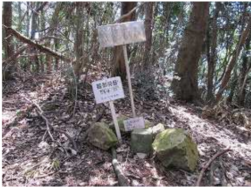
姫御前岳(514m)の山頂。樹木に覆われ展望は得られない。