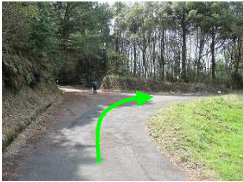
T字路に出合い右折する。