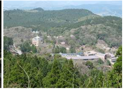
散策路からグリーンピア八女本館を望む。