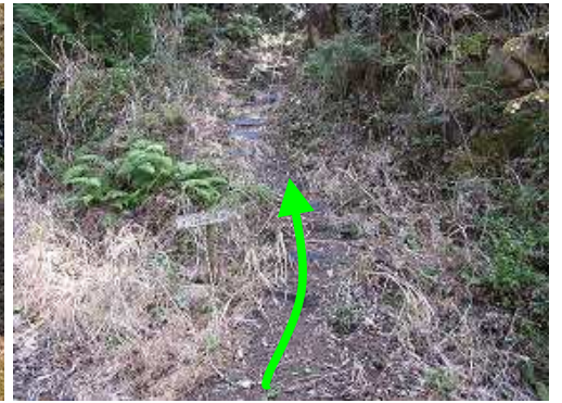
雌岳登山口からブラ階段を登って行く。