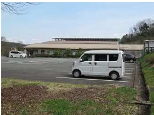
グリーンピア八女の駐車場に帰り着いた。