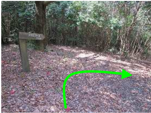
トリムコースを下って行く。