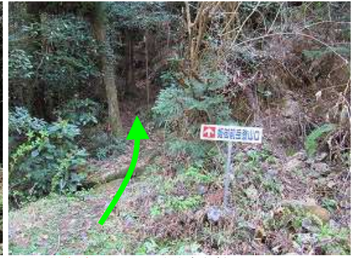
姫御前登山口からやや急な斜面をひと登り。