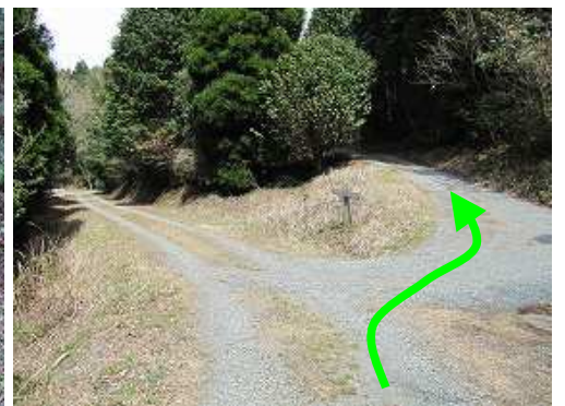
南岳分岐から右上に入るた。