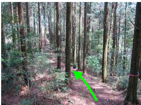
ヒノキの植林帯の中に行く。