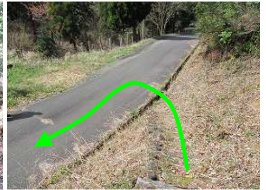
南岳登山口に下り、左折する。