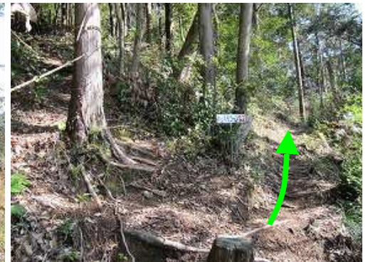
直ぐに直登コースとゆっくりコースに分かれる。ゆっくりコースを緩やかに上って行く。