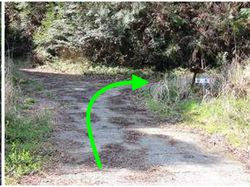
雄岳へは右方向に山腹を3/4周する。