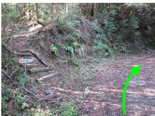
左に雌岳登山口を見て通過する。