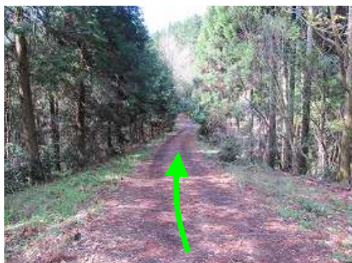
林道を緩やかに下って行く。