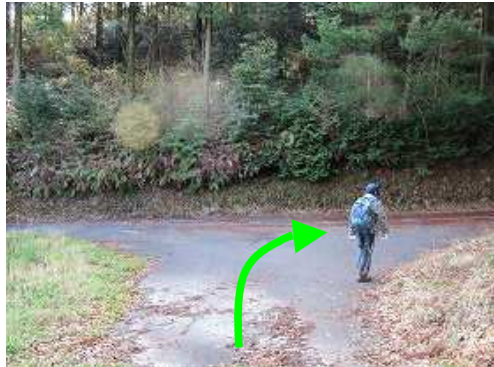
T字路に出会い右折する。