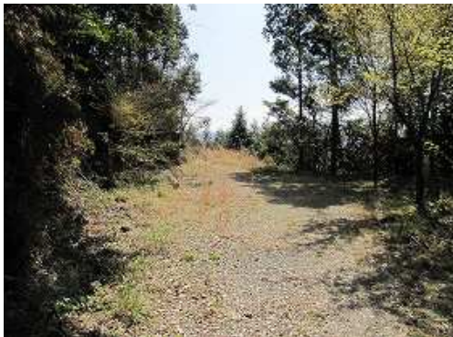
林道終点到着。此処まで車で来れる。