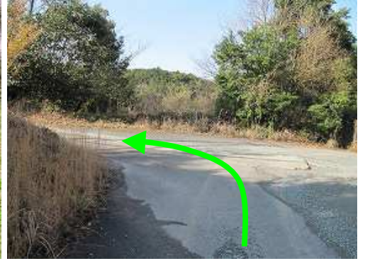
十字路に出会い左折する。