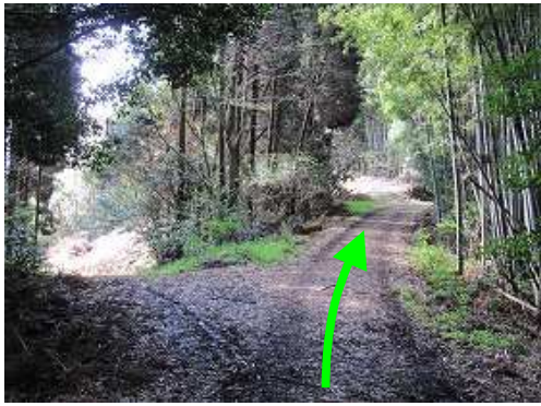
Y字路は右の林道に行く。