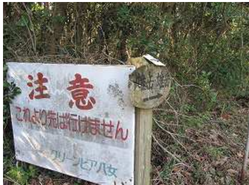
道路脇の注意書き。