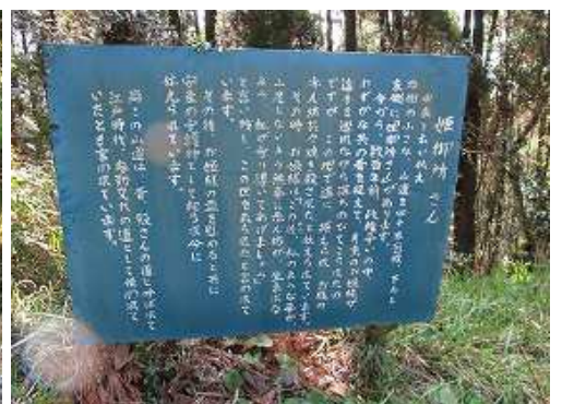
姫御所さん入口横の案内板を見る。