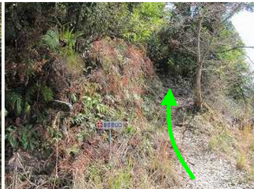
雄岳登山口は林道終点の左奥にある。