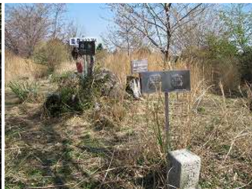
雄岳(532m)の山頂には四等三角点が設置されている。