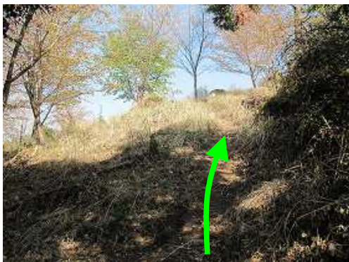
山頂部が見えて来た。