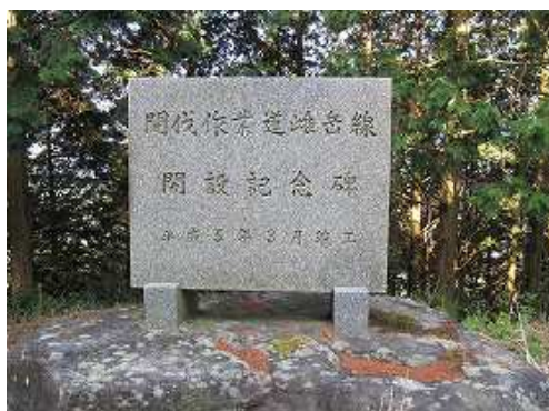
右に間伐作業道雌岳線の記念碑を見る。