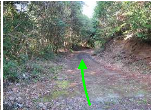
林道を緩やかに下って行く。