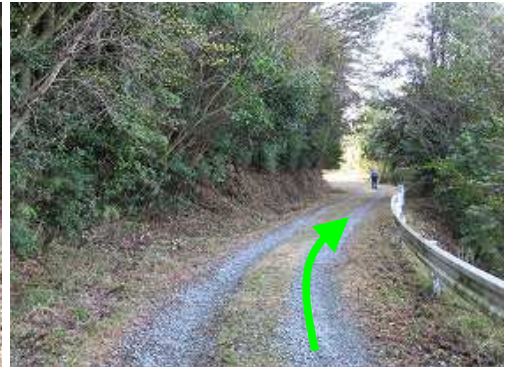
砂利道の林道を道なりに進む。