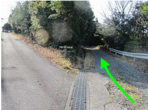
Y字路は右の砂利道に行く。