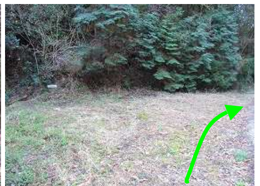
左に姫御前岳登山口を見て通過する。