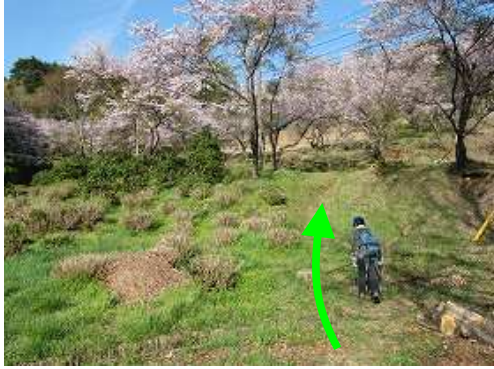
グリーンピア八女の駐車場に駐車し、背後の土手を上って行く。

GP八女駐車場～南岳分岐～姫御所さん入口～雄岳登山口～雄岳(532m)～姫御前岳(514m)～姫御所さん入口～姫御所さん～雌岳(596m)～南岳分岐～南岳(546m)～南岳登山口～GP八女駐車場