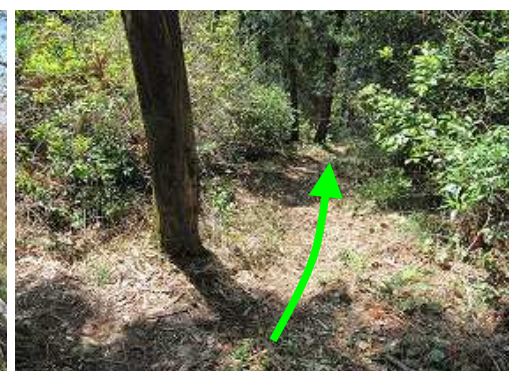
直登コースの急斜面を下る。