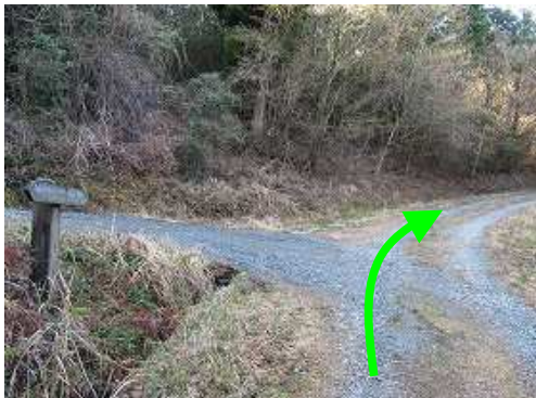
南岳分岐に出会うが、そのまま直進する。