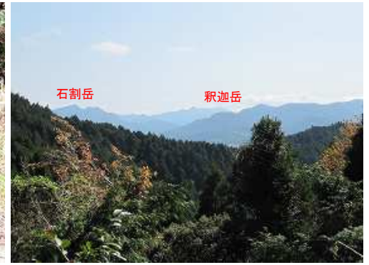
林道に開けた所から東方向に石割岳から釈迦岳を望む。