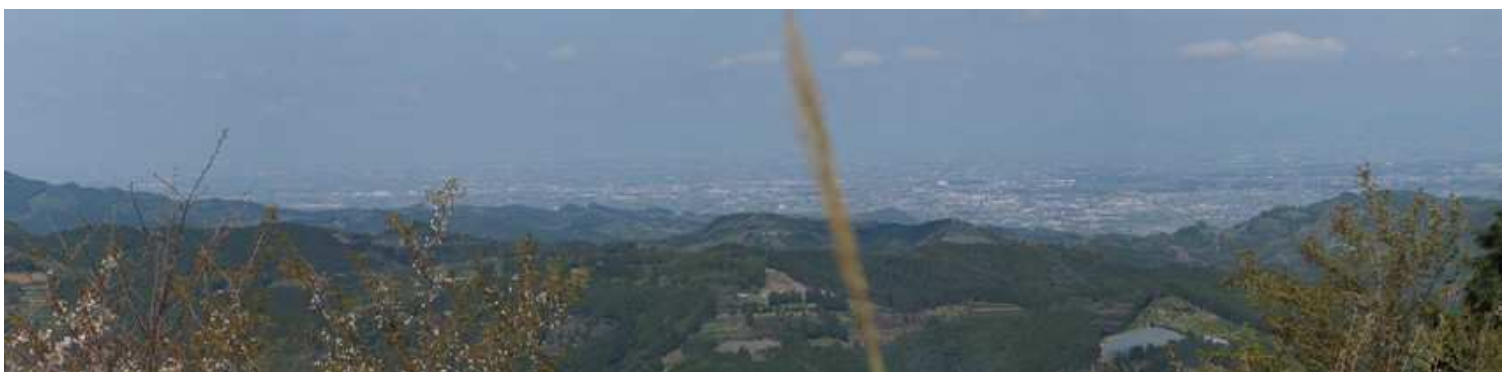
西方向のパノラマ。