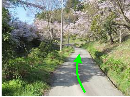
サクラの咲く散策路を緩やかに上って行く。