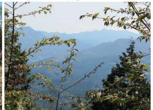
東方向枝越しに釈迦岳を望む。