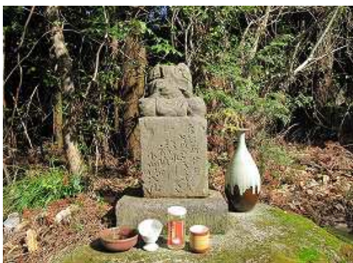
西側道路端に首なし石仏を見る。