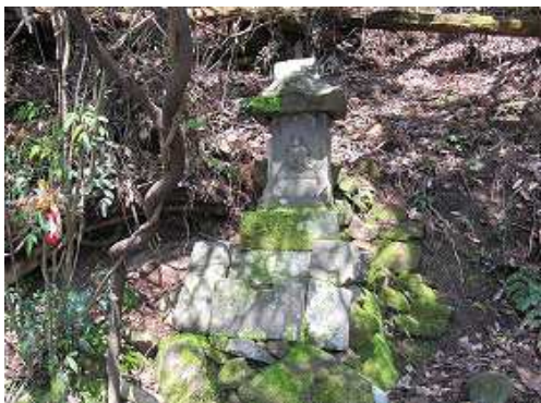
姫御所さんに参拝し、引き返す。