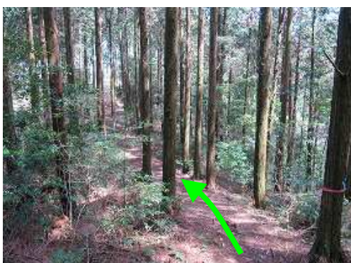
ヒノキの植林帯の中に行く。