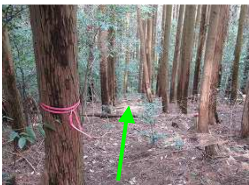
北側の滑りやすい急斜面を慎重に下って行く。