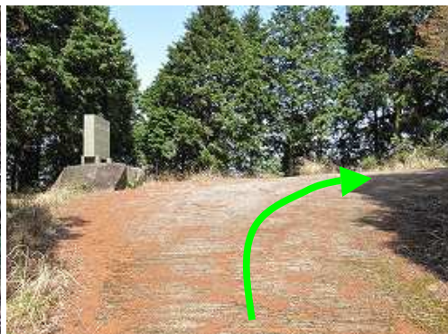
間伐作業道記念碑まで戻って来た。