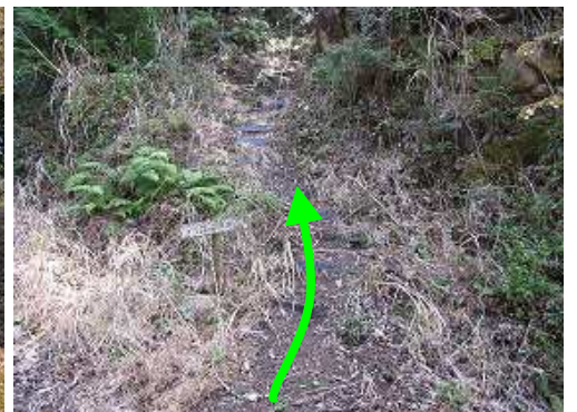
雌岳登山口からブラ階段を登って行く。