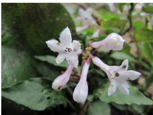
サツマイナモリが林道脇に咲いていた。