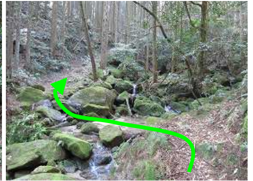
沢を対岸へ 渡渉 し作業路へ入る。