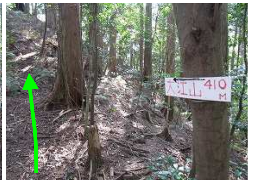
取付き付近に大江山への案内板を見る。