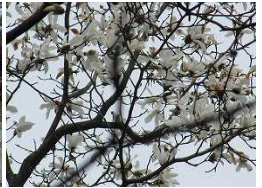
尾根筋に咲いていたタムシバ。