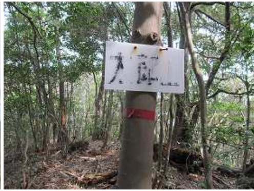
尾根上に太郎山(410m)の標識を見る。