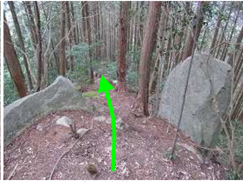
やや急な尾根筋を下って行く。