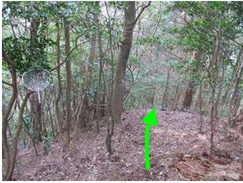
うちわ分岐から北に伸びる尾根筋を下る。