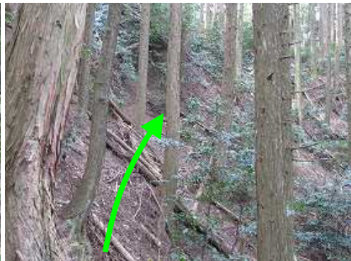
尾根の右側の急斜面を斜上する。