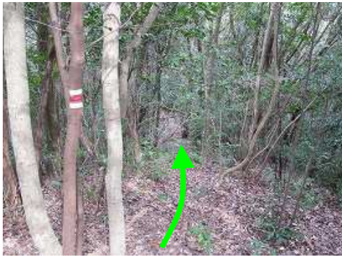
尾根筋の傾斜も緩んできた。