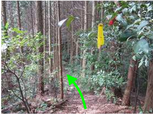
隆岳分岐からの尾根筋。