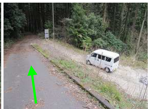
駐車地に帰着いた。