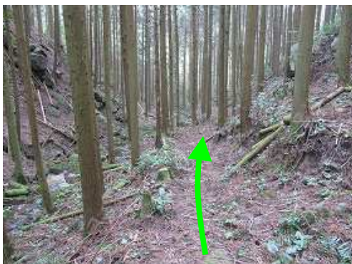
作業路に合流し、左へ下って行く。