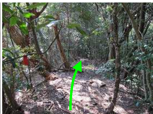
山頂の測量杭から右の尾根筋に入り、テープや杭を拾いながら進む。