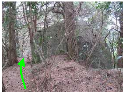
丸岩の左を抜ける。