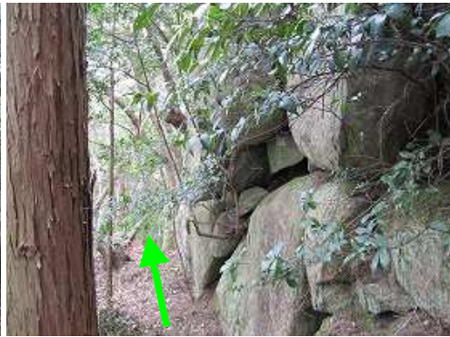
境界杭の先で岩崖に出会うが、左(西)側へ降り岩の裾を抜ける。