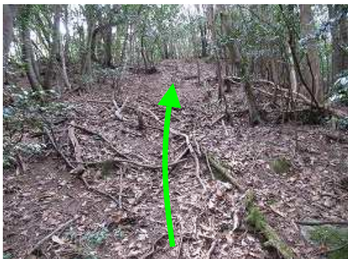
尾根筋の斜面を上る。