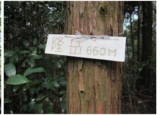
隆岳分岐に掛かる案内板。これより南西方向に、やや急な尾根筋を詰めて行く。