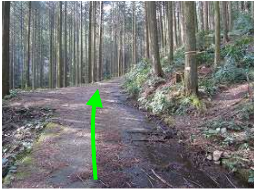
鷲ヶ岳登山口を右に見て、林道を緩やかに上って行く。