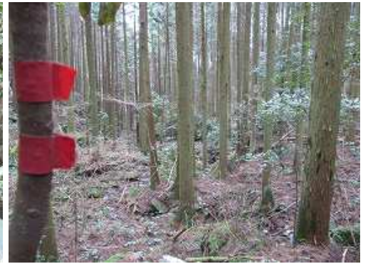
尾根端部まで降りて来た。