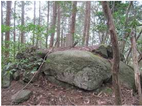
尾根筋の境界杭を抜ける。