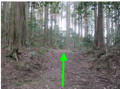
前方にスギの植林帯が見えて来た。