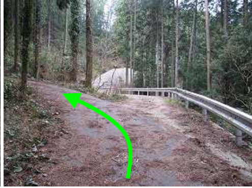
林道分岐は左上へ向かう。