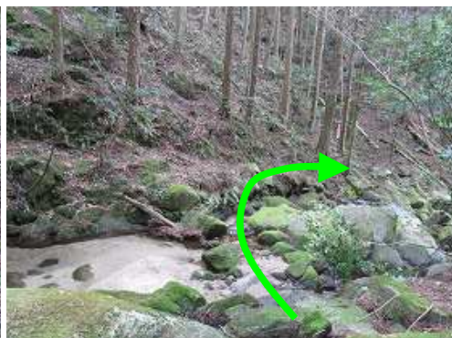
沢を渡渉し、右へ下って行く。