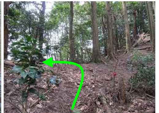
隆岳尾根に合流し、尾根筋を左へ向かう。