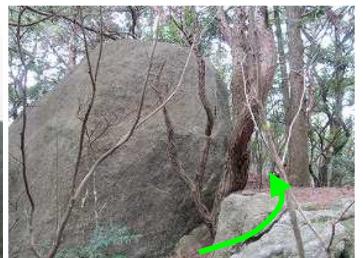
丸岩の右を抜ける。