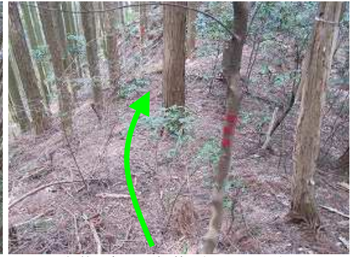
尾根筋の赤テープを拾いながら下って行く。