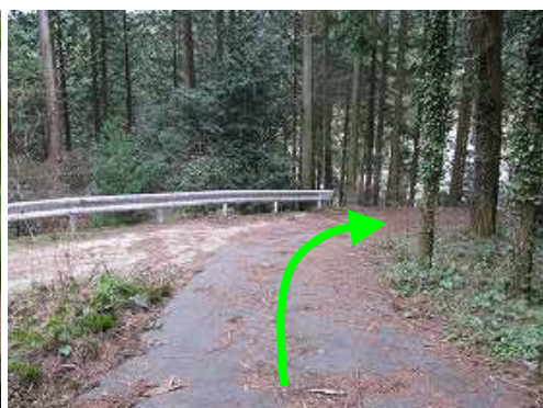
林道分岐を右に下って行く。