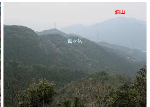
展望岩から北北西の展望。