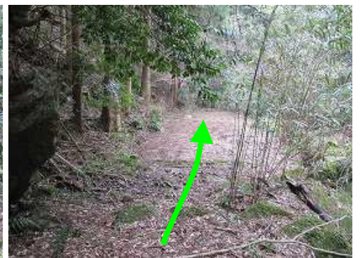
仲ノ畝林道終点に出る。