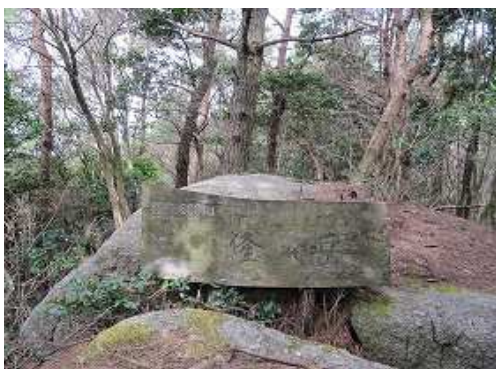
尾根筋にある隆岳(660m)。展望は得られない。ここで引き返す。