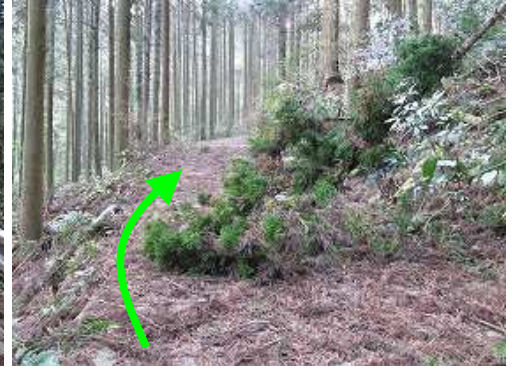
林道が倒木により塞がれており車は通れない。