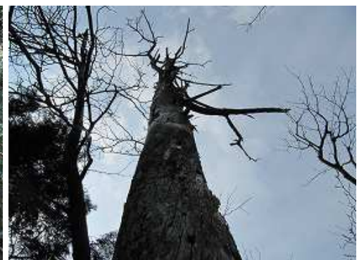
尾根筋の 枯死木 を通過する。