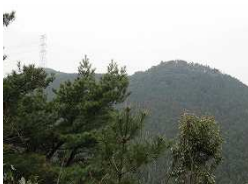
展望岩から西方向の展望。