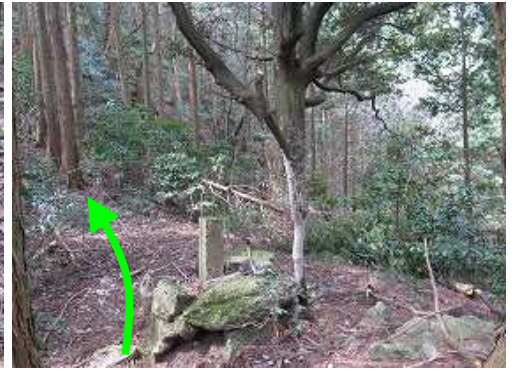
尾根筋の境界杭を抜ける。