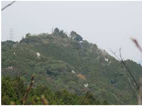
傍の開けた所から鷲ヶ岳を望む。