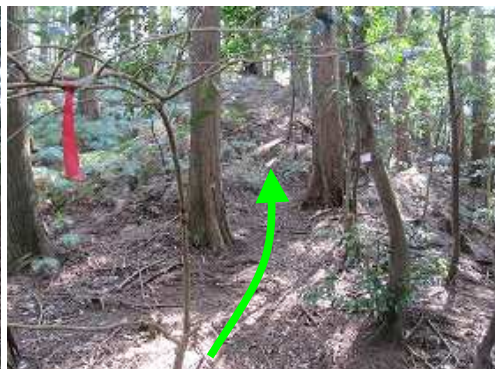
登り着いた所が大江山取付きで、右の斜面に取付く。