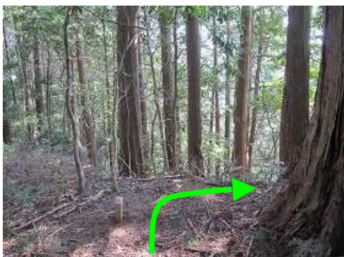
大江山(410m)の山頂と思われるが、山名板は見当たらない。樹木に遮られ展望は得られない。