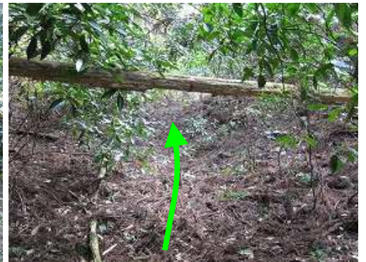
古い赤テープを拾いながら詰めて行く。