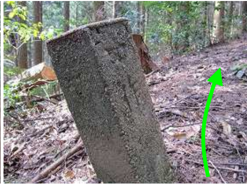
尾根筋に中作の杭を見る。