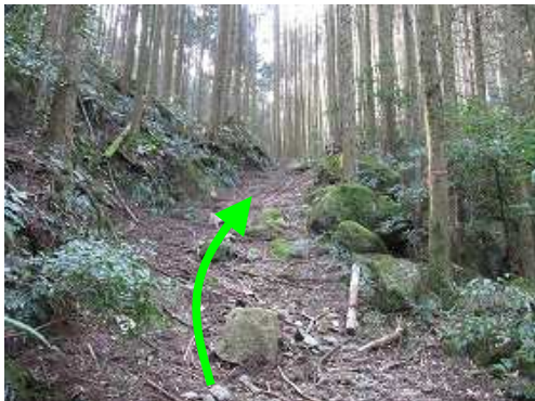
作業路を緩やかに上って行く。