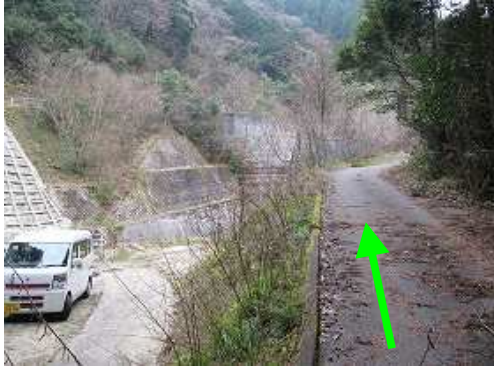
林道中ノ畝線に入るが、上部で道路を倒木が塞いでいたので、鷲ヶ岳登山口の下500m付近に 駐車 する。

駐車地～渡渉点～大江山取付～大江山(410m)～太郎山(410m)～隆岳尾根合流～隆岳(660m)～うちわ分岐～作業路合流～渡渉点～駐車地