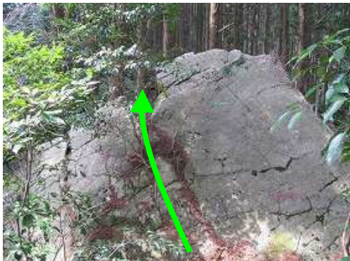
尾根筋に横たわる大岩を乗越す。