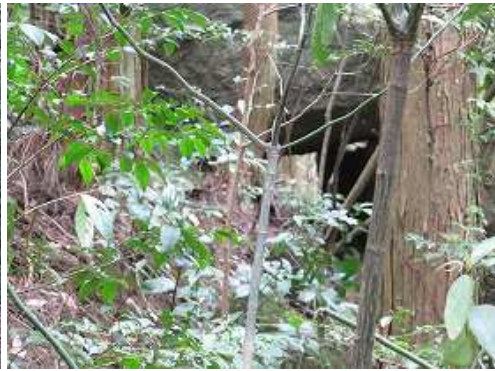
振り返ると、尾根筋西側に四角形に開いた岩屋が見えた。