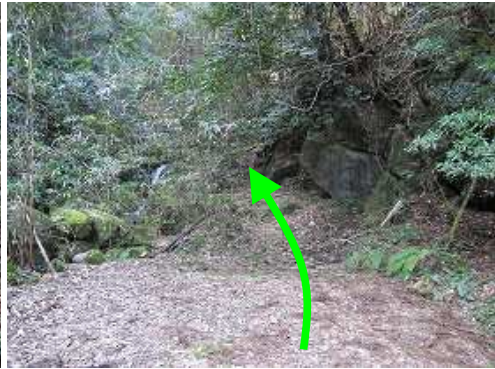
林道中ノ畝線の終点から沢の左岸に行く。