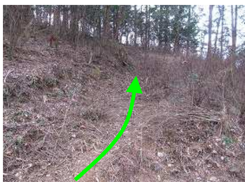
右の作業路に入ると、すぐ右側に 尾根筋 への赤テープを見るので尾根筋へ登る。