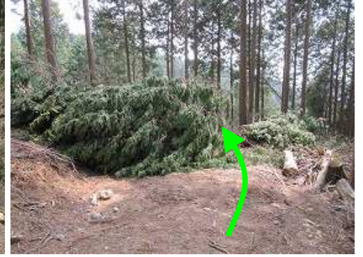
伐採木を避けながら作業路を伝う。