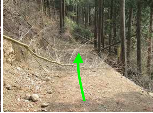
降りれる所から作業路に合流する。