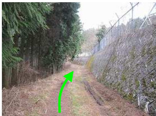
無線塔の裾を北へ向かう。