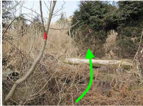
荒れ放題の カヤ斜面 をテープを拾いながら上る。