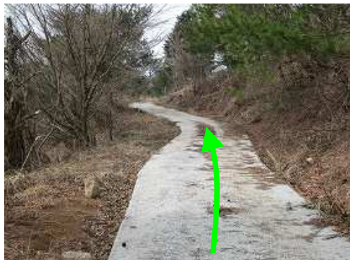
コンクリート舗装路を緩やかに上って行く。