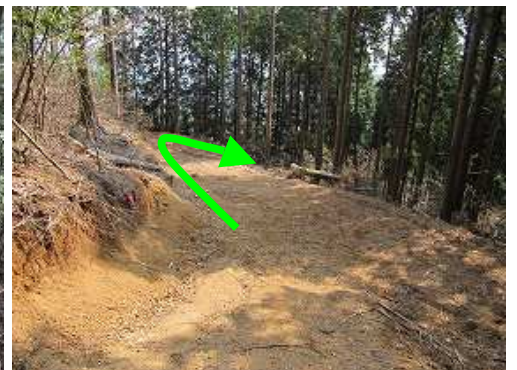
作業路合流点から右へ下る。