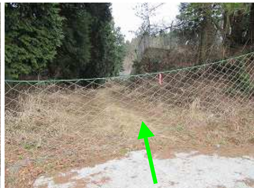
NTT無線塔の入口は ネット が張られている。中央部をまくり上げて入る。