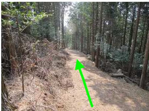
作業路へ降り立ち、道なりに下る。