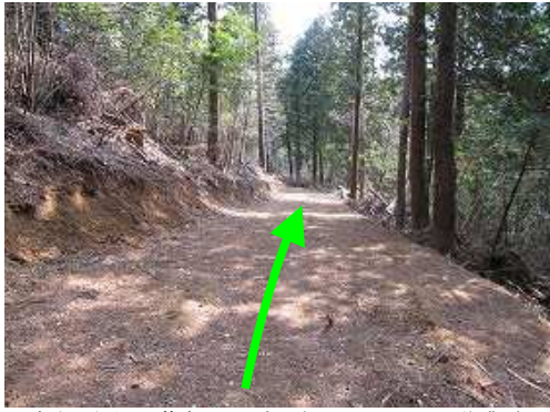
途中、左側の黄色テープを辿って、その下の作業路に出て左に向かう。