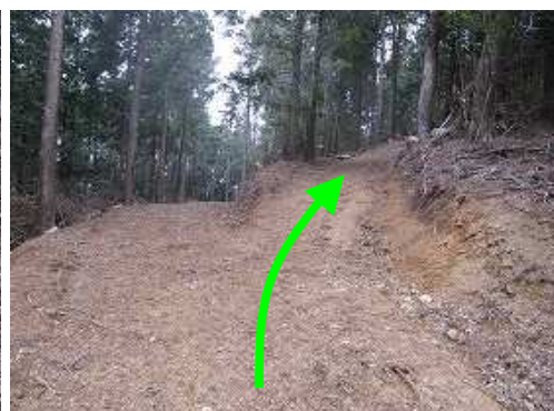
すぐ先の分岐は右の作業路を上る。