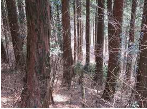
作業路終点から右下に見える作業路に向かう。