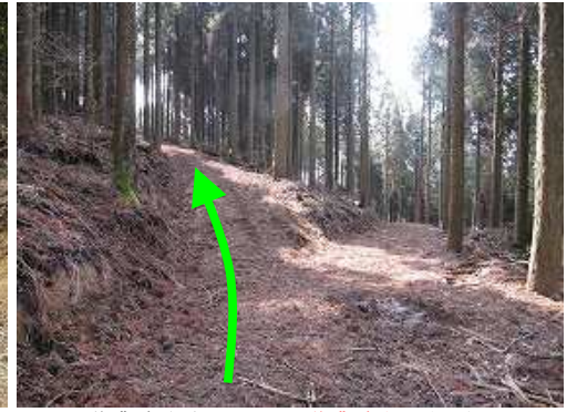
作業路分岐が現れるが作業路上へ向かう。