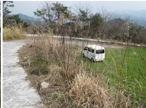
駐車地に帰り着いた。