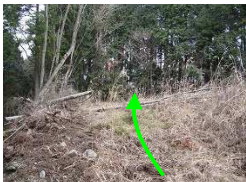
北を見ると左に作業路がある。 登山口 は中央部の土手のようだ。案内板など見当たらない。