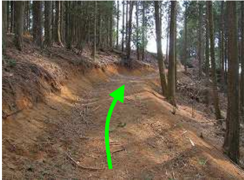
時には尾根筋の土塁に戻ったりしながら作業路を行く。