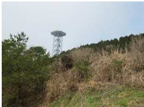
路肩に駐車適地がないので牧草地の邪魔にならない所に 駐車 する。北西方向にNTT無線塔が見える。