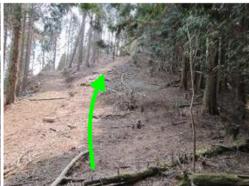
コル から弱く上り返す。左に作業路が並走する。