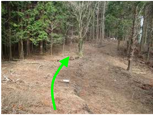
右側に作業路が走る弱い コル に着く。