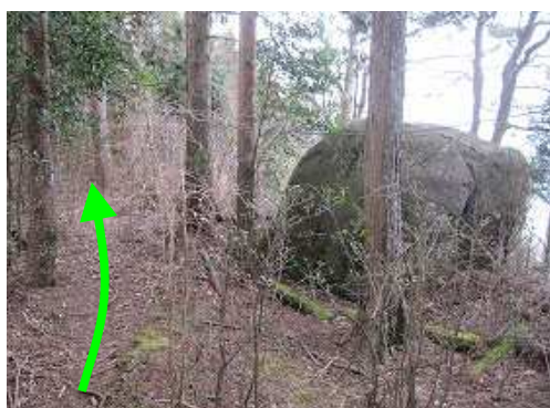
尾根筋に上がると右に丸い大岩を見る。