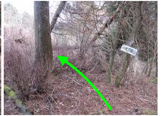
植林帯を抜けると案内板を見て カヤ斜面 に取付く。