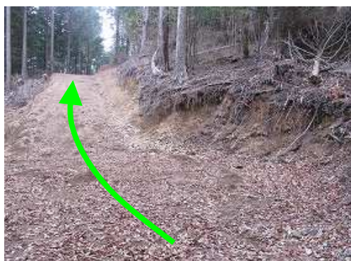
左から上って来た 作業路 に 合流 し、北へ向かう。