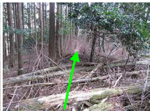
伐採木が放置されたままなので歩きにくい。