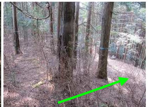
弱いピークの先から右下の 作業路 へ降りる。