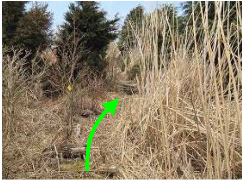
テープを拾いながら カヤ斜面 を上る。