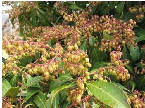
アセビの花も開花が近いようだ。