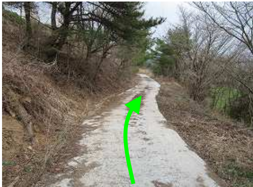
緩やかにコンクリート道を下る。