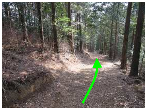
左手に尾根筋へ上がった分岐を見送り下る。