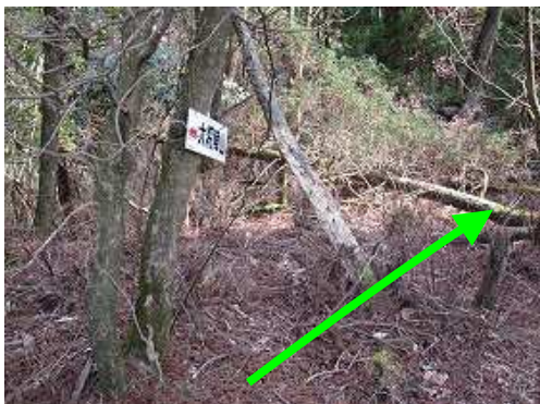
カヤ斜面 取付きまで下る。