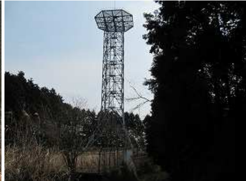
登山口横の作業路の出口は登山口であった。