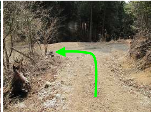
道なりに下ると、別の作業路に出会い、ここを左折する。右側に折れたプラ板の案内板を見る。