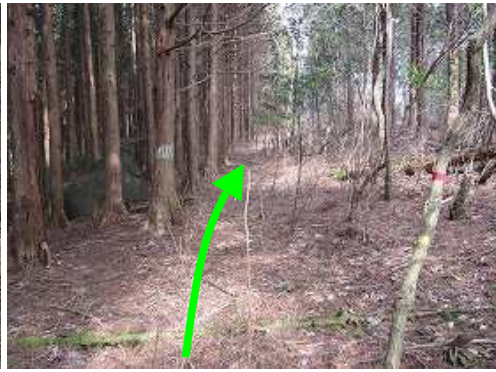
ヒノキの植林帯を抜ける。