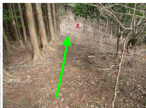
緩やかにピークを越え緩やかに下る。右側に作業路が走る。