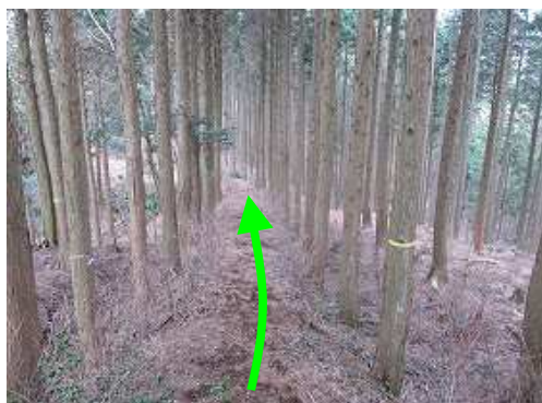
スギの植林帯の中の土塁に沿って登って行く。