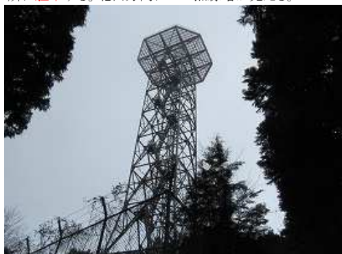
右手を見上げると NTT無線塔 がそびえている。