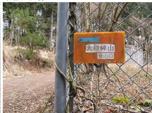
無線塔入口の右角に案内板を見る。