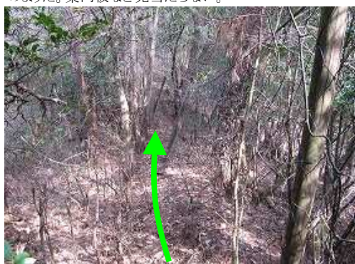
右の ネット に沿って上る。