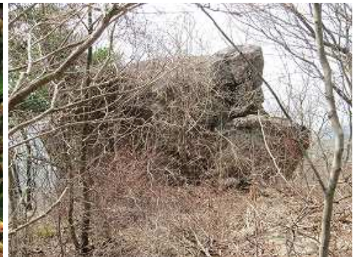
山頂南側の斜面にある大岩。