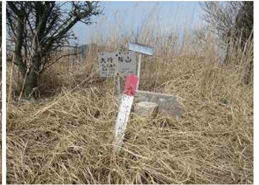
大将陣山(910m) の山頂。三等三角点が設置されており360°の展望が得られる。