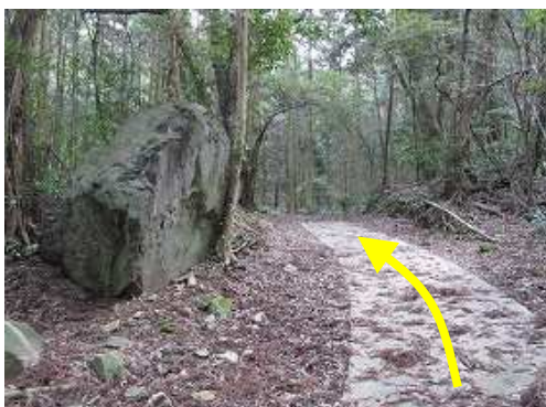
コンクリート舗装の林道を道なりに上がって行く。