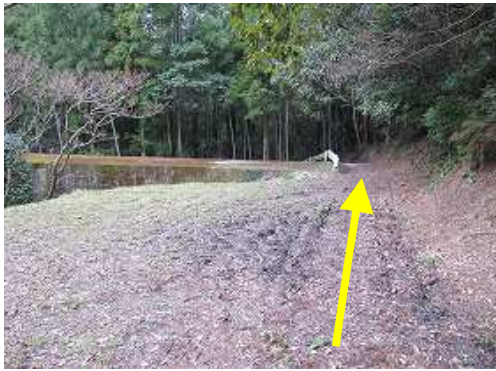
堰堤を左に見て抜ける。