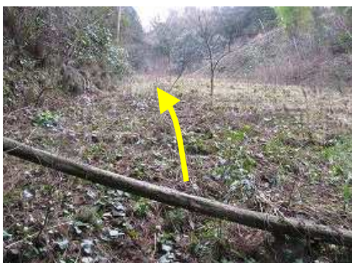
盛土斜面が現れ、左側の朽ちかけた丸太階段を上って行く。