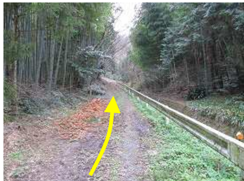
右に沢を見て林道を上がって行く。