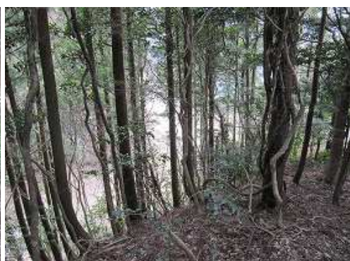
左下に林道が見えた。