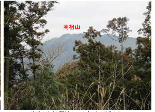
林道から樹間越しに高祖山が望めた。