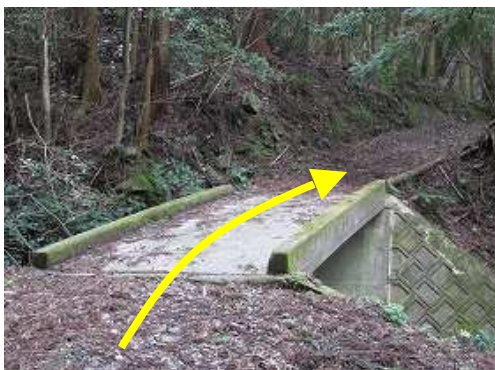
コンクリート橋を渡り、緩やかに上る。