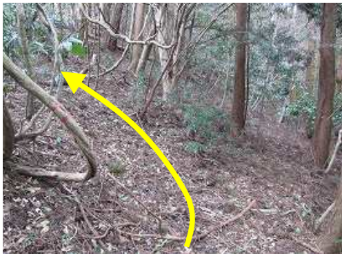
斜面から尾根筋に戻り、緩やかに上る。