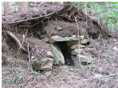
左手に古墳を見る。付近に3基ある。