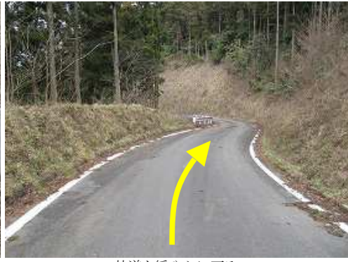
林道を緩やかに下る。