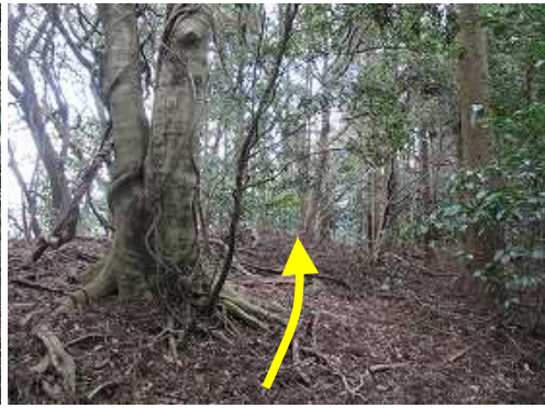
尾根筋の自然林を行く。