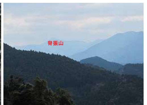
丸太階段降り口付近からの脊振山。