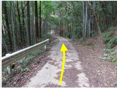
沢沿いに林道を下る。