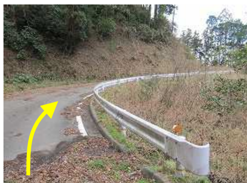
林道に出合い右へ向かう。