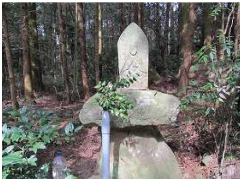
駐車地の傍に石仏が安置されていた。