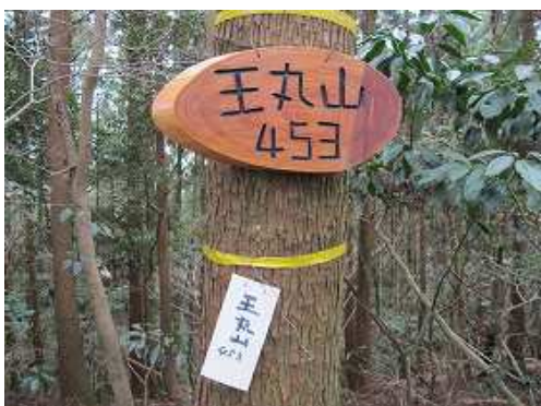
周囲はスギの植林に遮られ展望は得られない。