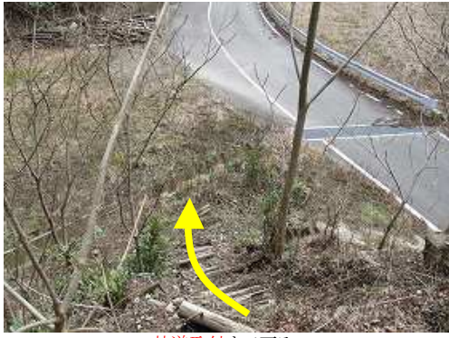
林道取付まで下る。