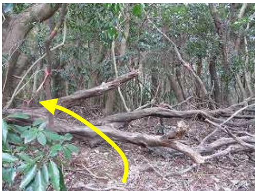
ここから左方向へ向かう。