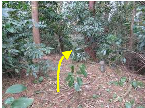
前王丸(430m)の山頂。福岡県の杭があるだけで、樹木に遮られ展望は得られない。