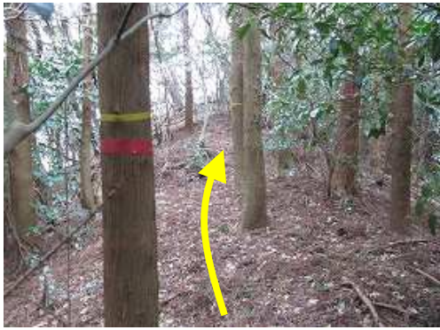
尾根筋に沿って赤テープを拾いながら上って行く。