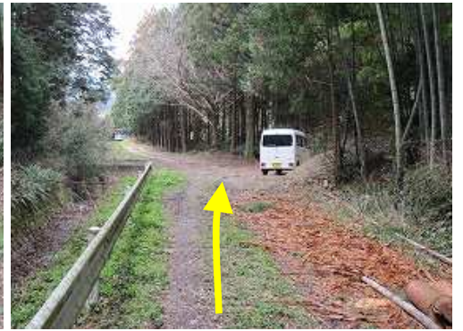
駐車地に帰り着いた。