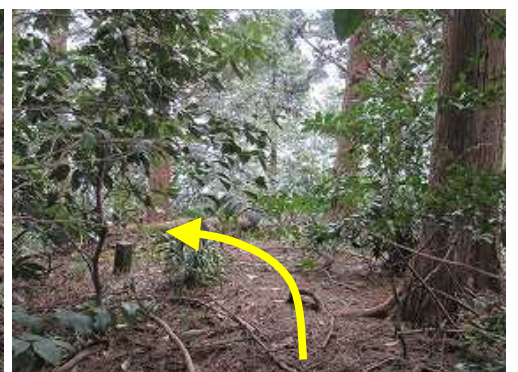
前王丸(430m)まで戻って来た。