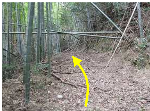
両側に竹林が現れた。