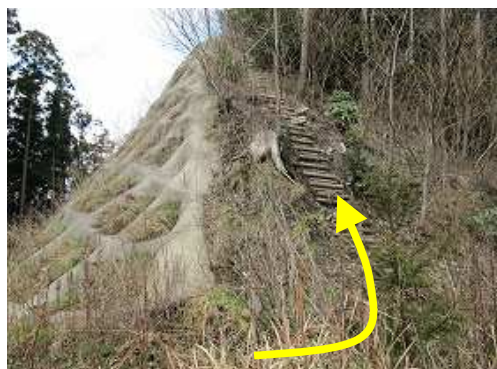
林道取付 朽ちかけた丸太階段を上る。