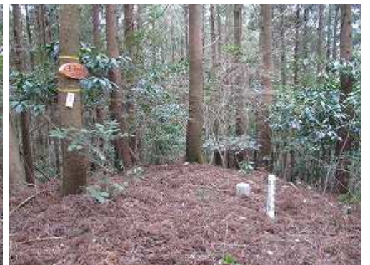
王丸山(453m)の山頂。四等三角点が設置されている。