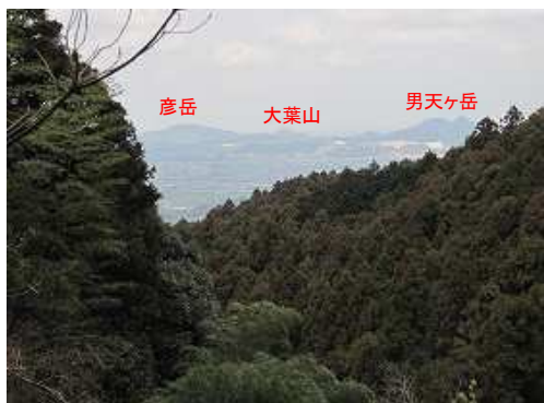
林道から北北西に糸島の里山が望まれる。