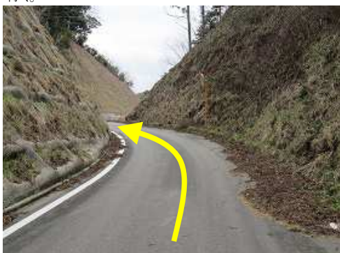
この先左が林道取付。