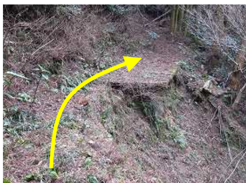
林道崩壊地を抜ける。