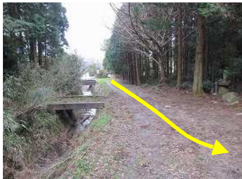
県道56号の王丸集落から東に民家を抜けた先の林道脇に駐車する。