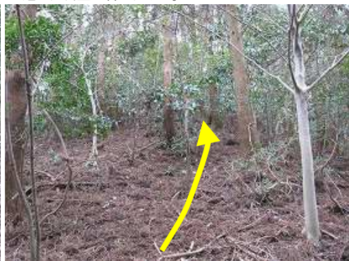
斜面を緩やかに上って行く。