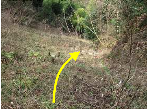
林道出合点から盛土斜面の丸太階段を下る。