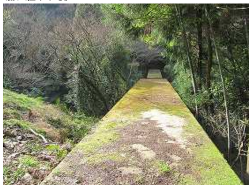
右に苔むした堰堤を見る。四駆ならここまで来れるかも。