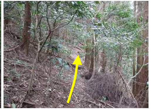
斜面をトラバーズ気味に伝う。