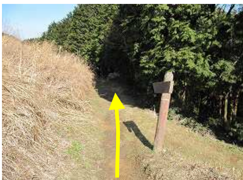
史跡めぐりコースを下る。