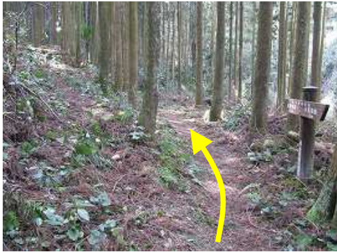
左に林道への近道を見送り、直進する。