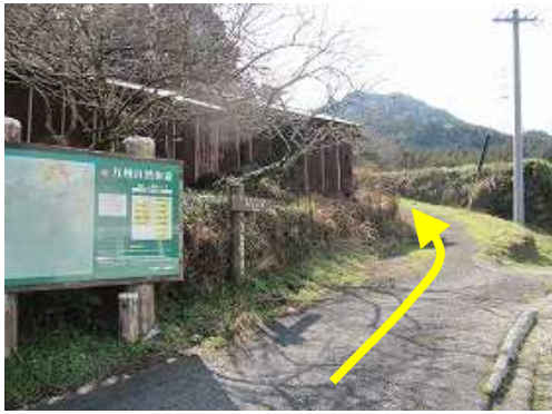
傍の空き地に駐車して山口登山口から歩き始める。