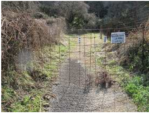
イノシシ除けの柵が設置されており開けて閉める。