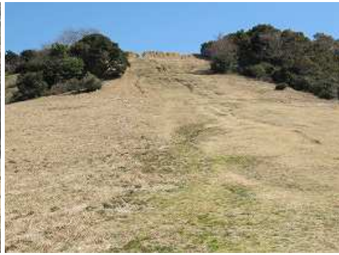
草スキー場の斜面を見上げる。