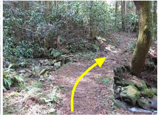
沢に架かる板橋を渡る。