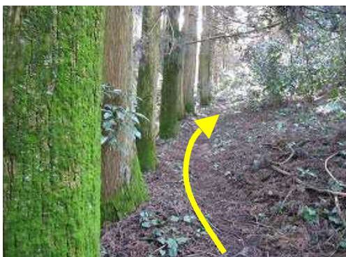
スギの植林帯を抜ける。