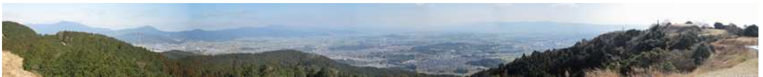
展望台からのパノラマ。