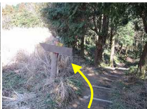
北帝門跡へ向かう。途中でカメラの電池が切れたので、引き返し山口登山口へ下った。