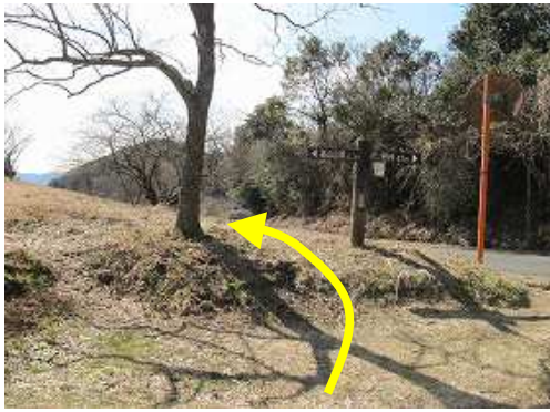
山口分岐に出会う。