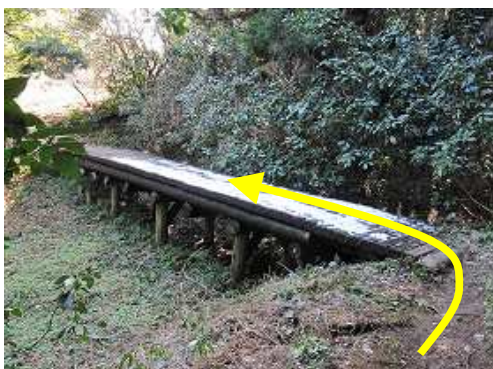
残雪の板橋を渡る。