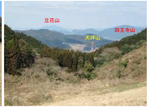
歩いて来た山口方面を望む。