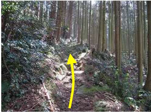
右にスギの植林帯を見ながら緩やかに上って行く。