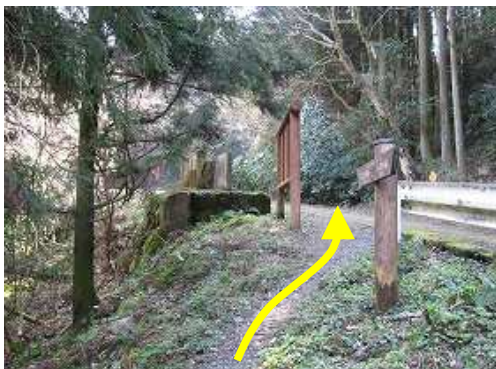
林道終点部に出る。