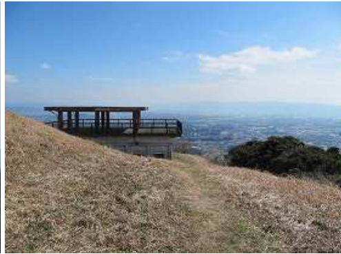
山上部に上り東休息舎と浮羽方面。