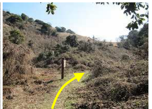
前方に基山の裾が広がる。