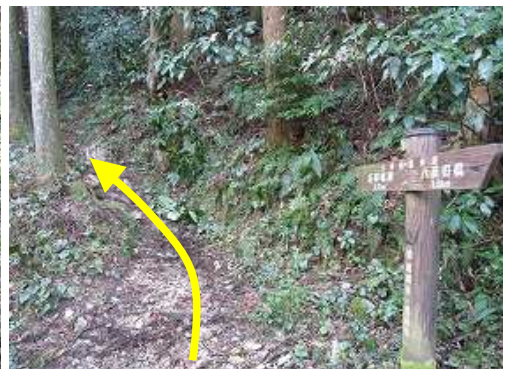
基肆城跡0.7kmの案内板を見て、緩やかに上って行く。