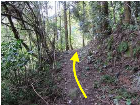
左下に沢音を聞きながら上って行く。