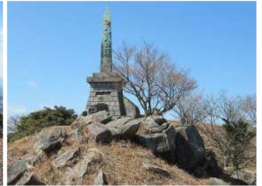
山頂部に建つ天智天皇欽迎之碑。