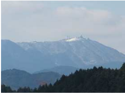
西に脊振山(1055m)のドームを見る。