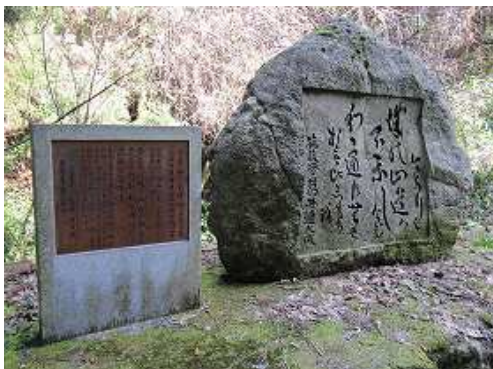
林道左には歌碑が建つ。