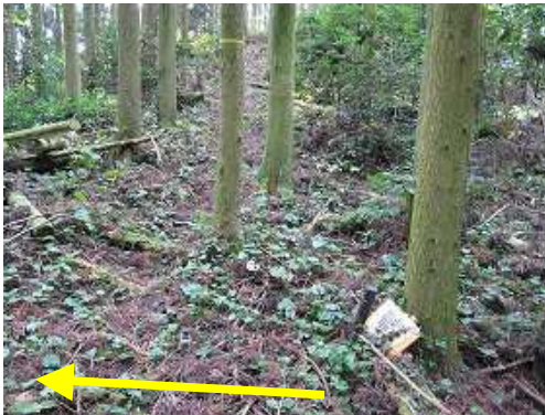
野田バス停分岐 右に尾根を下れば野田バス停へ向かう。直進する。