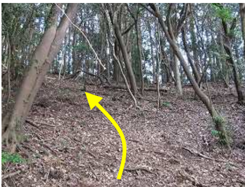
緩やかな雑木斜面を詰めると、前方が明るくなってきた。