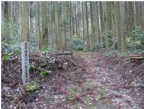
林道を道なりに登って行くと、右に安楽平城主小田部鎮元自刃之地の石柱を見る。その奥に墓所がある。