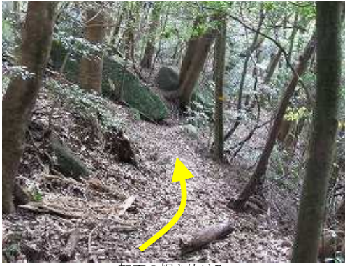
転石の裾を抜ける。