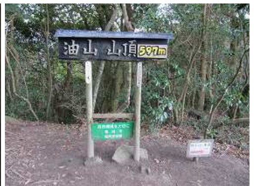
油山(597m)の山名板。北東方面に展望が得られる。