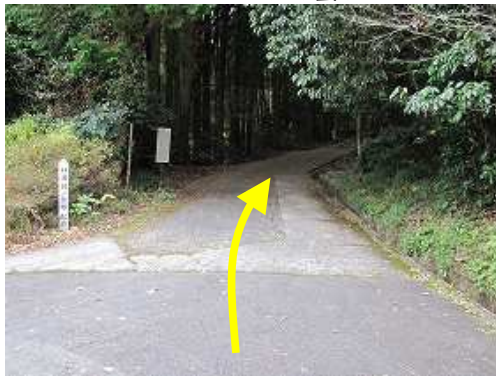
北に脇山集落を抜けると、林道城ノ原線入口の標柱を左に見て奥へ向かう。

駐車場～城ノ原登山口～18鉄塔分岐～尾根～水場～脇山分岐～油山(597m)～荒平山分岐～脇山分岐～荒平山(395m)～二の丸跡～城ノ原分岐～二の丸分岐～18鉄塔分岐～城ノ原登山口～駐車場