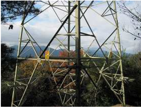
16鉄塔 鉄塔越しに脊振山を望む。