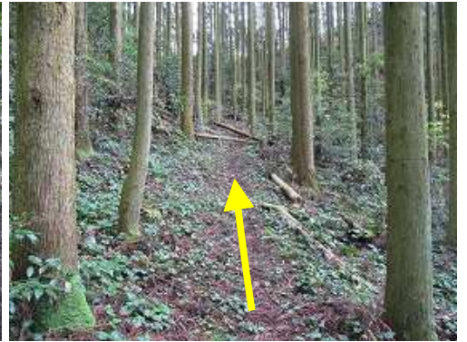
スギの植林帯の中を緩やかに上って行く。