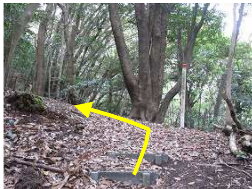
枝尾根に上がり、左へ向かう。