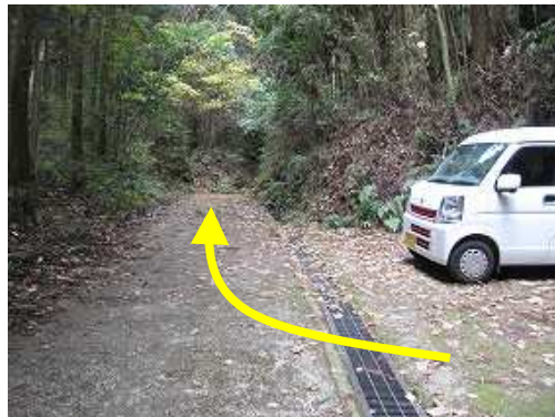
林道の終点が駐車場で5台程度駐車可能。