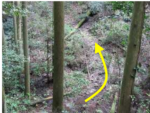
渡渉し、滑りやすい左岸を急登する。