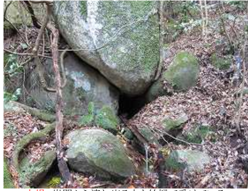
水場 岩間から流れ出る水を竹樋で受けている。