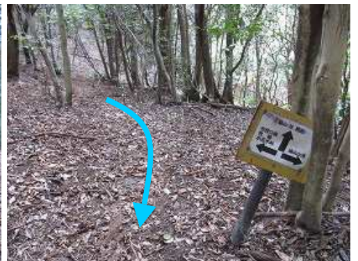
登って来た踏み跡と傍の案内板。