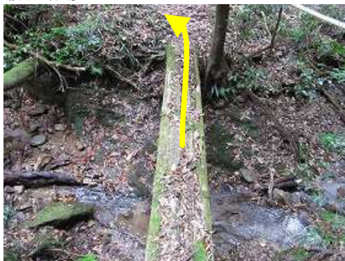
5m程の丸太橋を渡り九電巡視路のブラ階段をジグザグに上って行く。