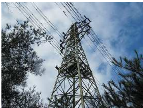
枝尾根に上がり着き、右に向かうと17鉄塔が聳える。