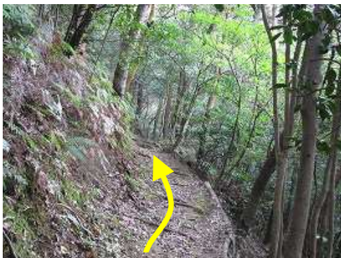
尾根の中腹を北東に向かう。