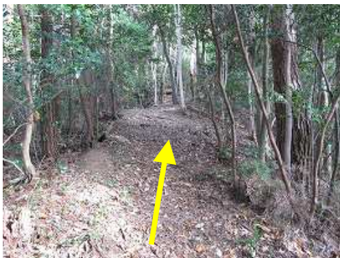
尾根筋を緩やかに上って行く。