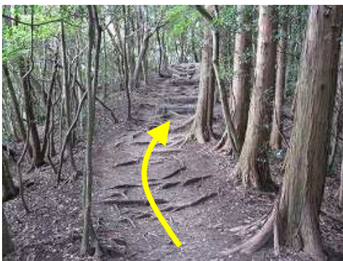
尾根筋を北西に向かう。