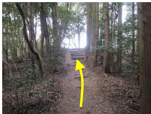
前方が開けて来た。