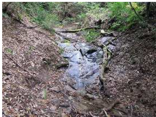
左から落ちるナメ沢を渡る。