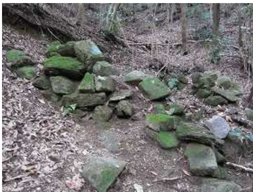
右に炭焼き窯跡を見てジグザグに上って行く。