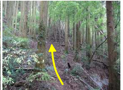
竹林が生える混在林を抜ける。