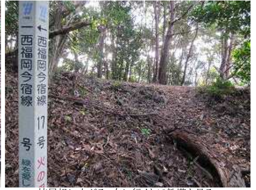
枝尾根に上がる。右に行くと16鉄塔を見る。