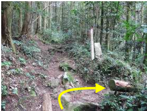
スギの植林帯を行くと18鉄塔分岐に出会い、右折する。