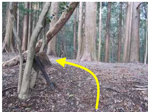
油山主尾根の脇山分岐に出会い、左へ向かう。