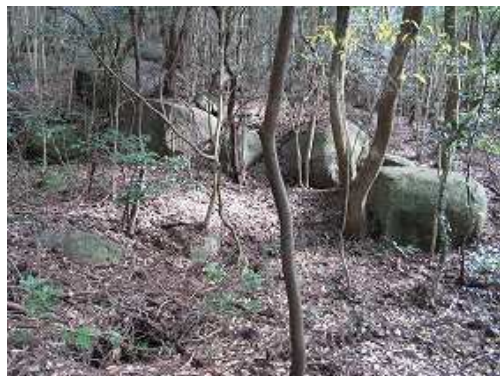
左斜面に大岩の転石を見る。