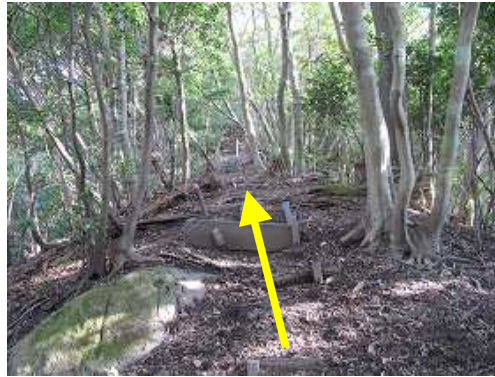
ブラ階段を緩やかに上って行く。