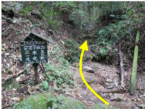
駐車場から1分ほど行くと城ノ原登山口。案内板の右を抜けて行く。