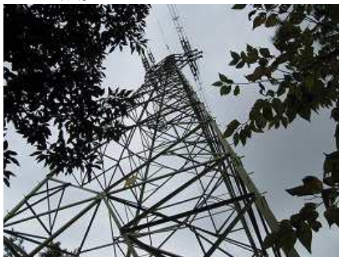
ブラ階段を緩やかに上ると18鉄塔が聳える。塔内を抜け先へ向かう。