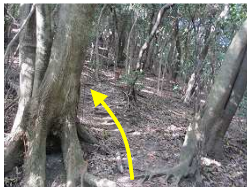
やや急な雑木の斜面に取付きジグザグに上って行く。