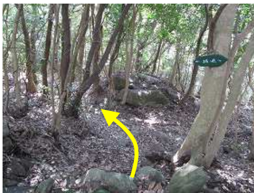
城ノ原分岐から南へ下る。