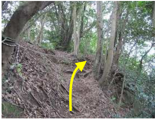
トラロープの悪場を右へ回り込んで行く。