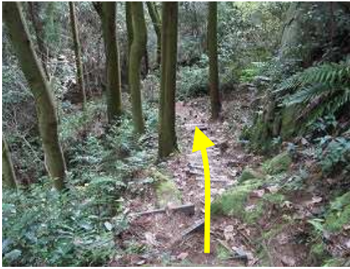
左からの沢音を聞きながらプラ階段を下って行く。