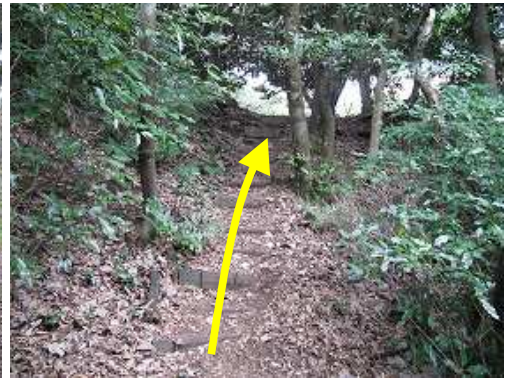
ブラ階段を上り詰めると……