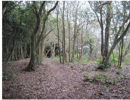
登り詰めると安楽平城三の丸跡。展望は枝越しに望める程度。