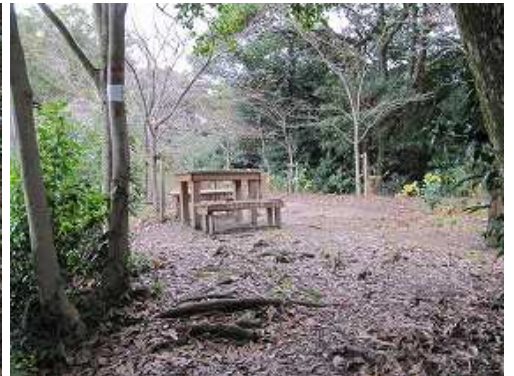
安楽平城二の丸跡。西方面の展望が得られる。