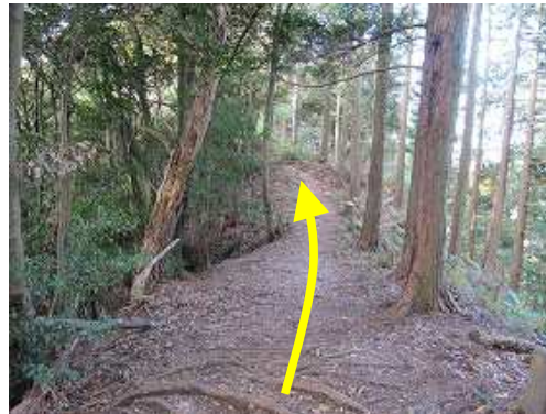
ヒノキの植林尾根を抜ける。