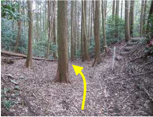
二の丸分岐に出会い、直進する。右は20鉄塔、左は荒平山へ至る。