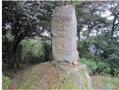
山頂部は安楽平城の本丸跡でもある。