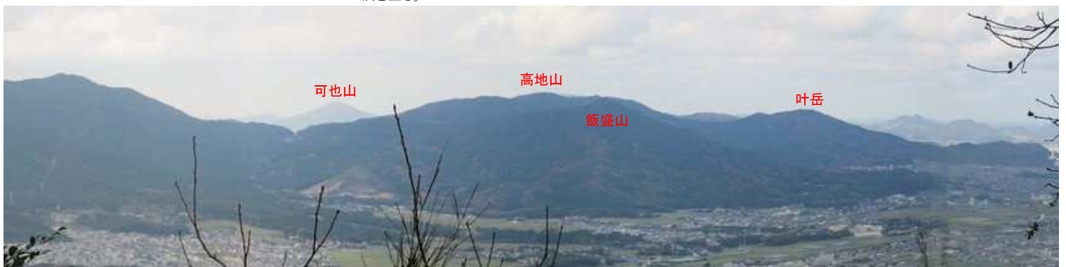
二の丸跡から西の展望。