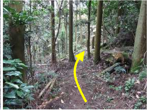
植林帯を下って行く。