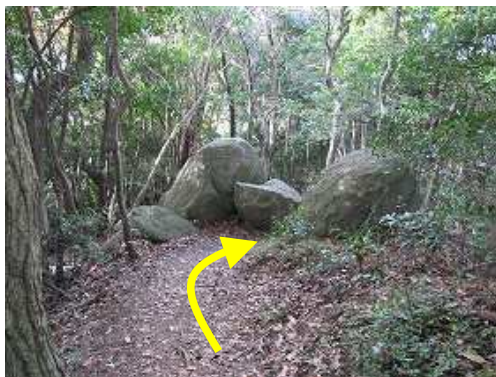
転石の間を抜ける。