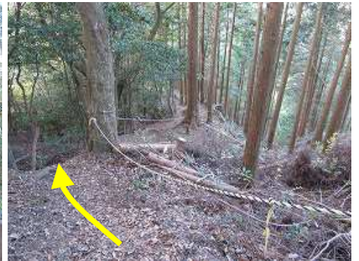
トラロープの急場を下る。