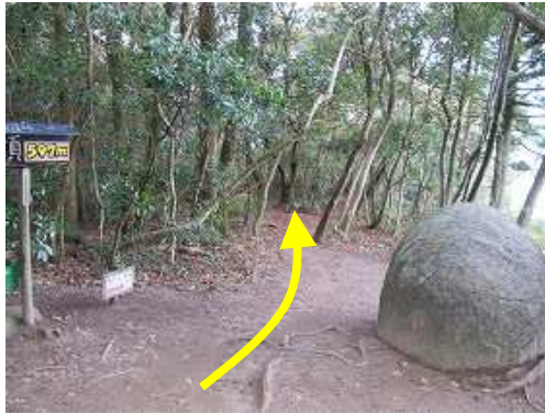
北西方向に向かう。