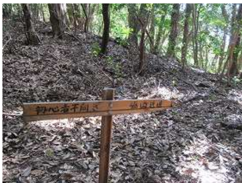
弱いコルの左側に脇山分岐を見る。