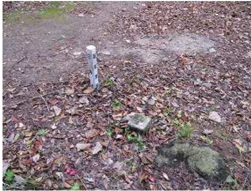
荒平山(395m) 四等三角点が設置されているが展望は得られない。