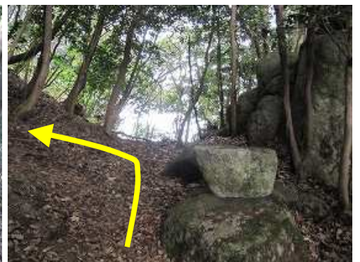
空堀に出会い、左の斜面へ。