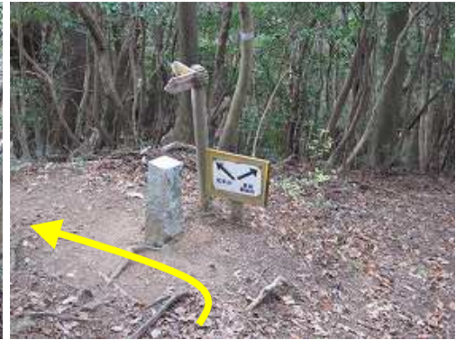
荒平山分岐に出会い左折する。