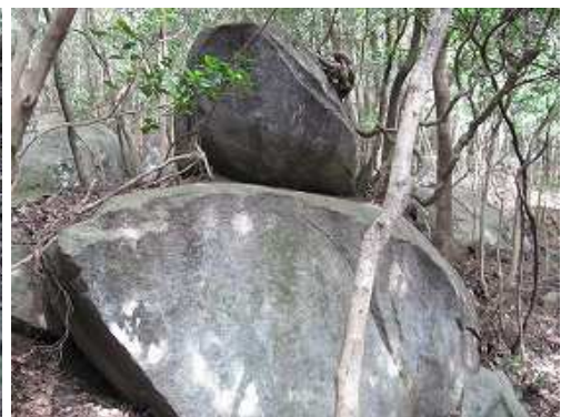
重ね岩の右を下って行く。