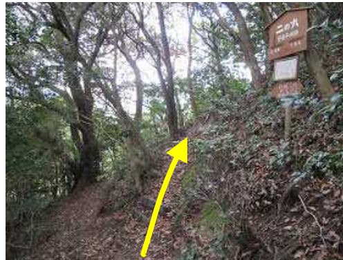
空堀や城ノ原分岐を経て、二の丸取付きの急なブラ階段を上る。