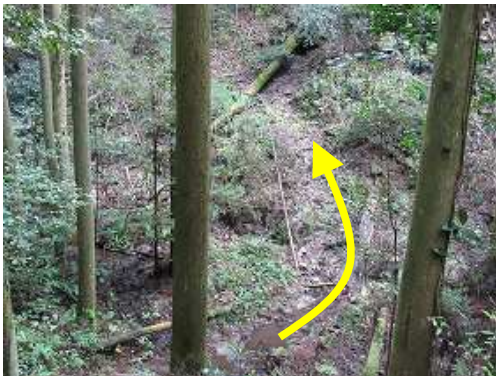
渡渉し、滑りやすい左岸を急登する。