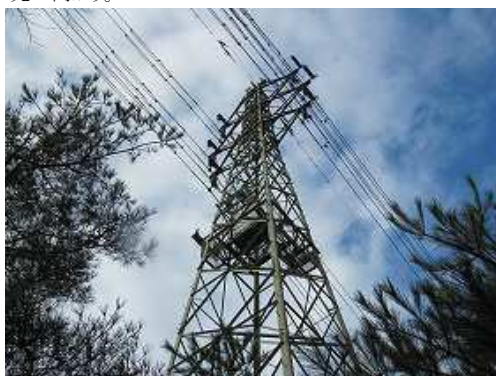
枝尾根に上がり着き、右に向かうと17鉄塔が聳える。