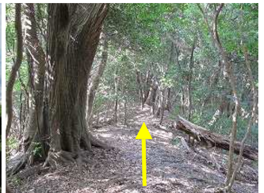
シオジの大木の右を抜けて行く。