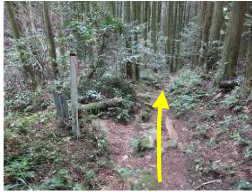
18鉄塔分岐まで降りて来た。