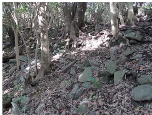
振り返ると野積み石の石垣が残っていた。