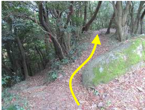
尾根沿いに二の丸跡へ向かう。