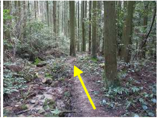
沢沿いに植林帯を下る。