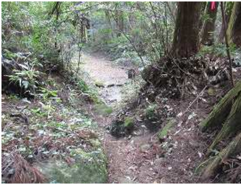
城ノ原登山口まで下る。