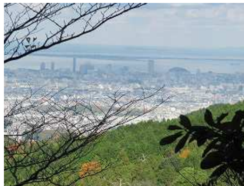
右側の開けた所から福岡タワーやヤフードームが見えた。