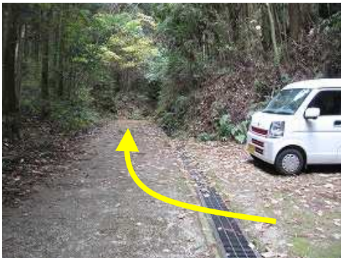
林道の終点が駐車場で5台程度駐車可能。