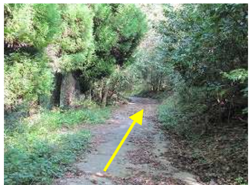
路端のミゾハギやツリフネソウ等を眺めながら舗装路を下る。