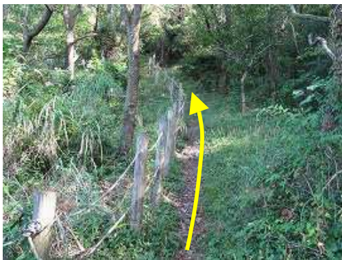
ロープ柵が現れた。