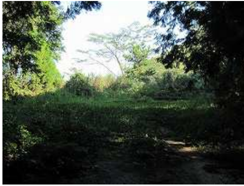
林道終点の草付広場が見えて来た。