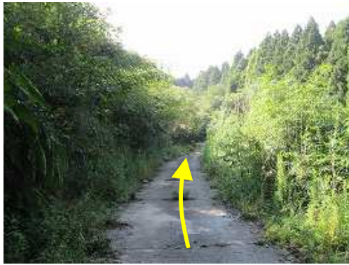
コンクリートの舗装路を緩やかに上って行く。