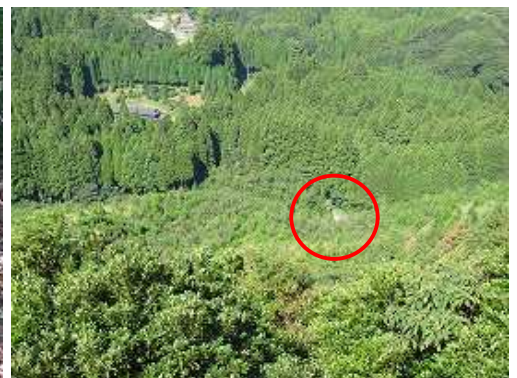
鳥居の立つ大岩に立つと西側の展望が得られる。赤枠が登山口である。