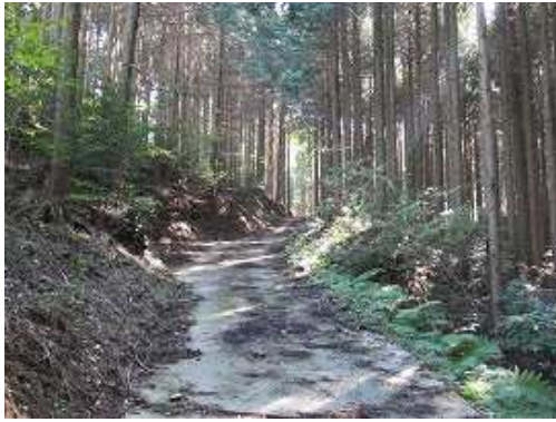
ヒノキの植林の中は傾斜が急である。