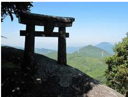
大岩の上には亀岳神社と彫られた小さな鳥居が建っている。