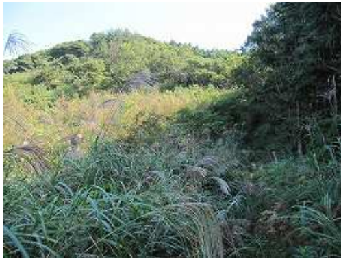
ススキの奥に山頂部を望む。