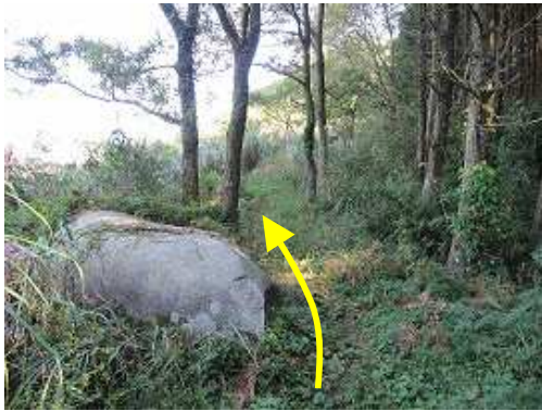
大石の脇を抜ける。