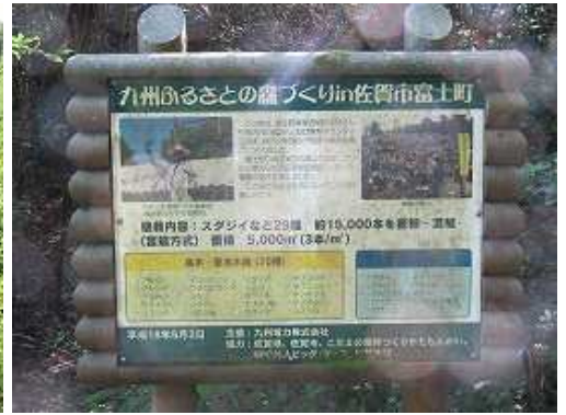
左に植林の案内板を見る。