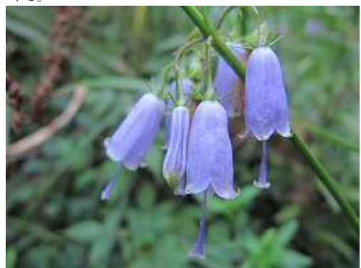
サイヨウシャジン