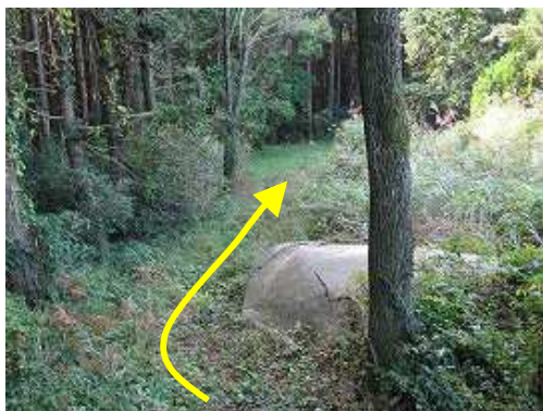
林道終点まで下って来た。