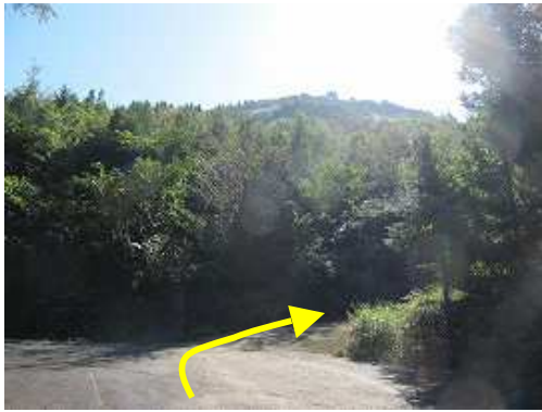
亀岳登山口 林道の路肩に車を止める。正面に亀岳の山頂部が望める。右の林道支線に入る。