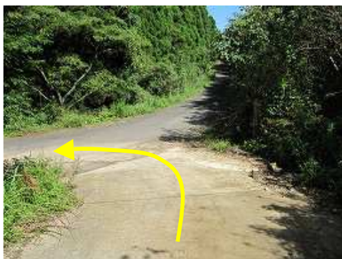
林道入口まで下って来た。