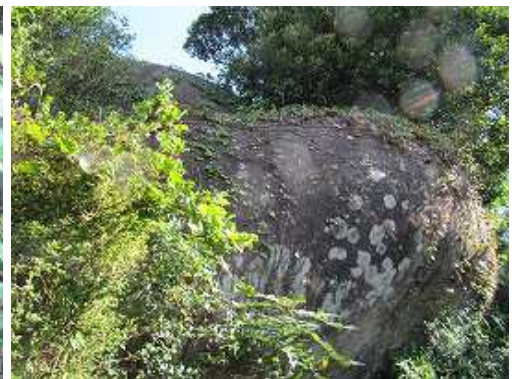
傍には大岩が迫る。右に回り込むように上がる。