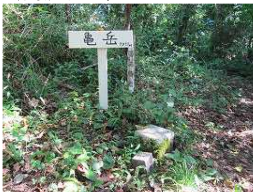
亀岳(740m) 三等三角点を設置されているが樹木に遮られ展望は得られない。