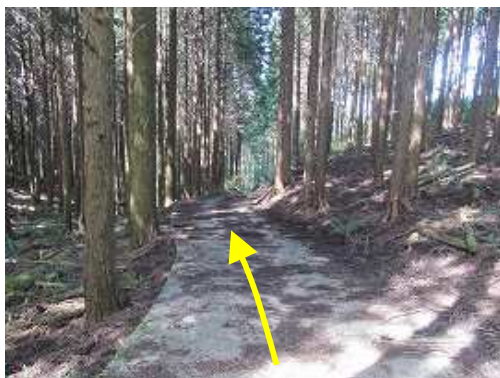
ヒノキの植林帯を下って行く。