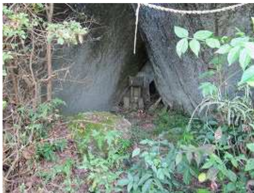
ロープ柵が終わると左手に大岩に注連縄が張られ、奥に祠が安置されていた。