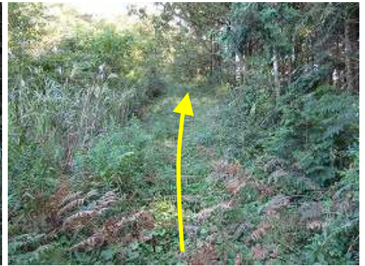
擬木階段を緩やかに上る。