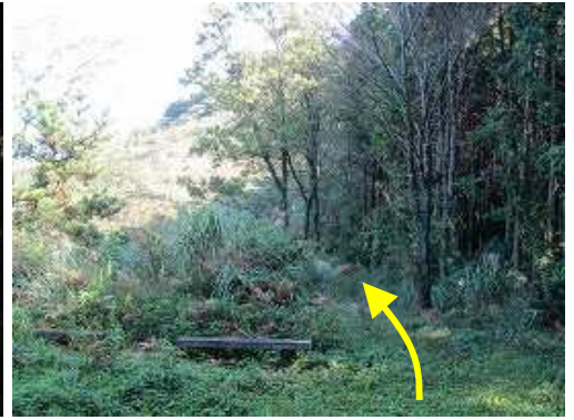
ここまで車も上がれるが、下に止めた方が無難。奥に擬木ベンチもある。ベンチの右脇を抜ける。