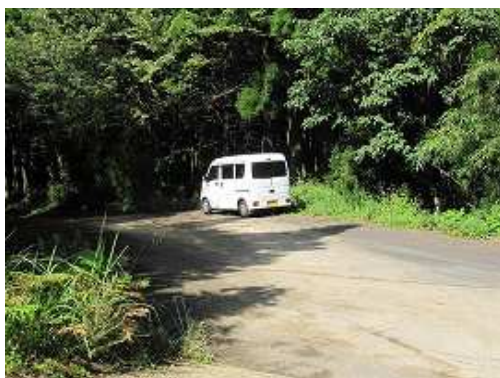
車は路肩に3台程度駐車可能。