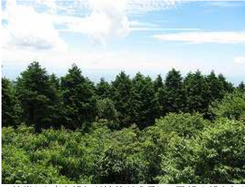
蛤岩から南を望むが植林が成長して展望は望めなくなっている。