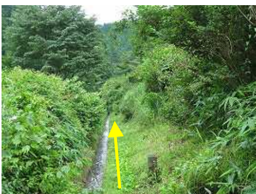
蛤水道の源流部へ続く水路を伝う。