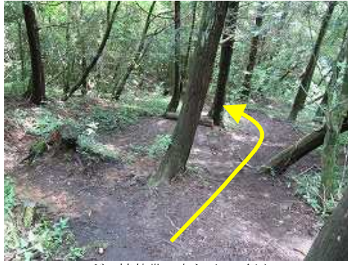
スギの植林帯の中を下って行く。