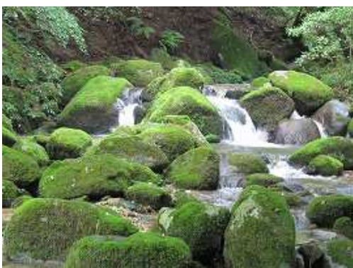
源流域の小滝を見る。