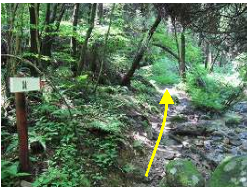
ぬかるみを抜けて行く。