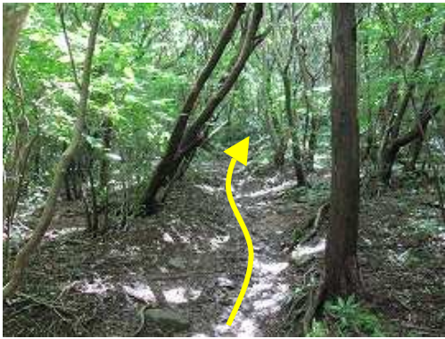
自然林が現れると山頂は近い。