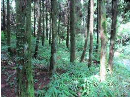
スギの植林帯を抜ける。