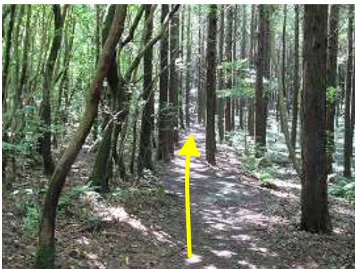
緩やかに上って行く。