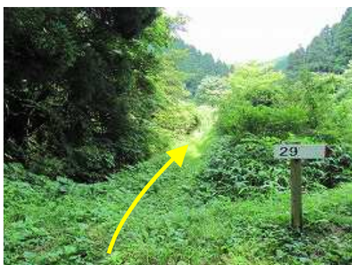
記念碑から水路側へ踏み入る。