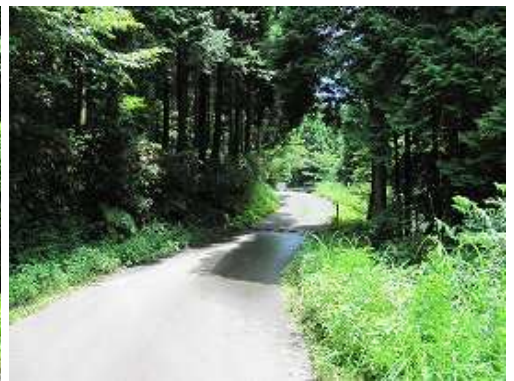
前方にゲートが見えた。