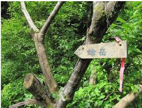
水功碑入口の案内板。