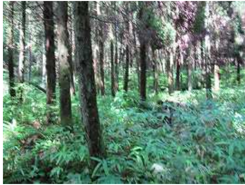
スギの植林帯を抜ける。