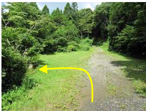
林道を20分ほど歩くと前方に広場が現れる。水功碑入口は左側。