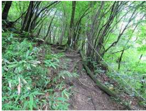
トラロープが張られた滑りやすい斜面を上る。