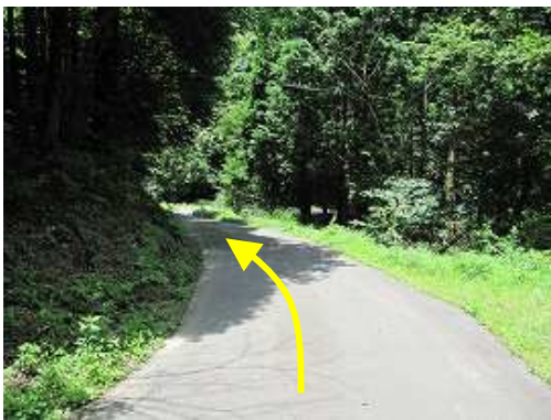
林道に出合い左に向かう。