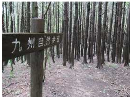
ヒノキの植林帯を抜ける。