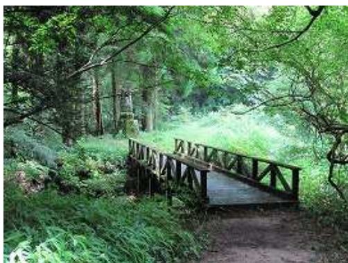
お万ヶ淵に架かる木橋の先に水功碑が見えた。