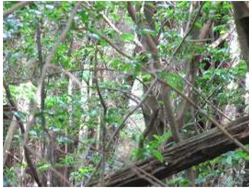
左に蛤水道の説明板が立つ。その先で左側の植林帯の奥に道路が見え隠れするので、降りて行く。