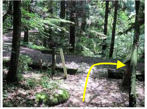
下り降りると蛤水道に出会う。右へ向かう。