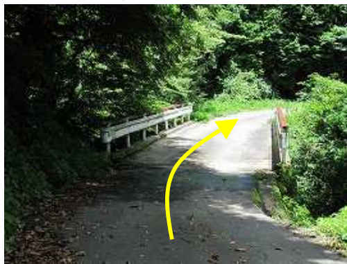
前川に架かる深谷橋を渡る。