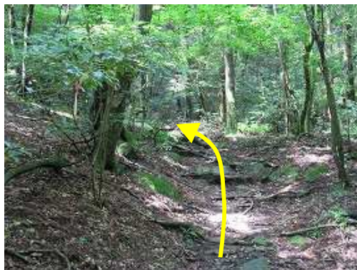
緩やかに九州自然歩道の上って行く。