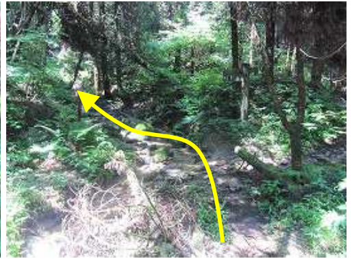
小川内分岐に出合うので、左へ向かう。