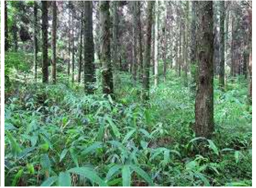
スギの植林帯を抜ける。