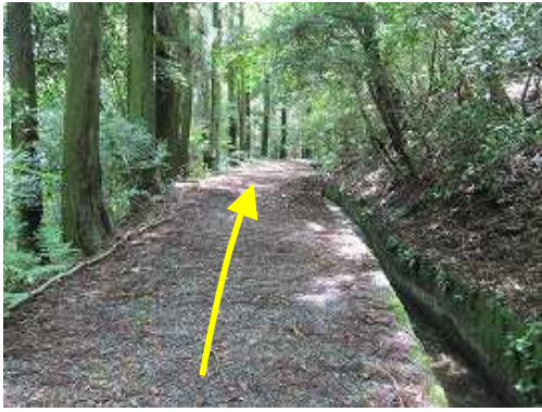
水道に沿って平坦路を行く。