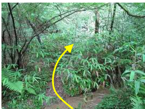
ササを漕いで行く。