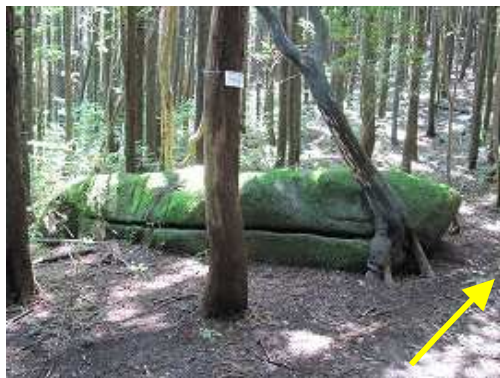
マテ岩の右を通過するた。