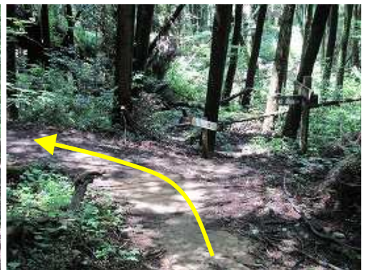
犬井谷分岐に出合う。左へ九州自然歩道を迎る。