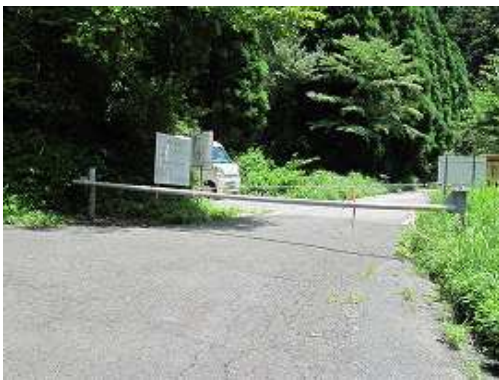
ゲートに帰り着く。左奥が駐車地(1台)。