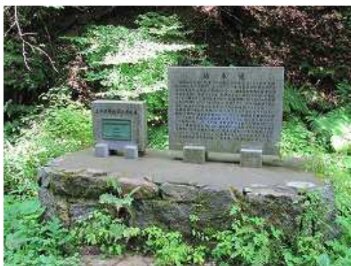
土木学会の記念碑。