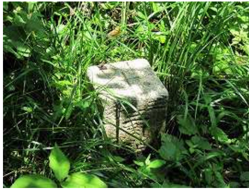
草に埋もれた蛤岳(863m)の三等三角点。