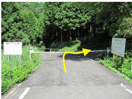
林道蛤岳線の終点はゲートになっている。傍に駐車地がある。ゲートを抜け右に向かう。