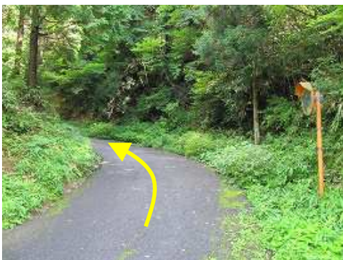
緩やかに林道を上って行く。