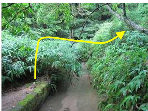
水道二俣を直進しササを分ける。