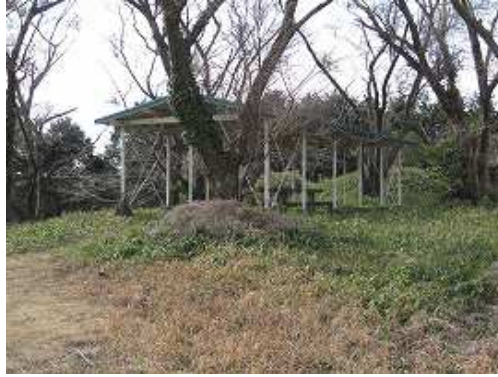
右手に休憩舎がある。