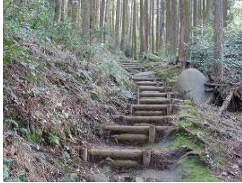
丸太階段を緩やかに上る。