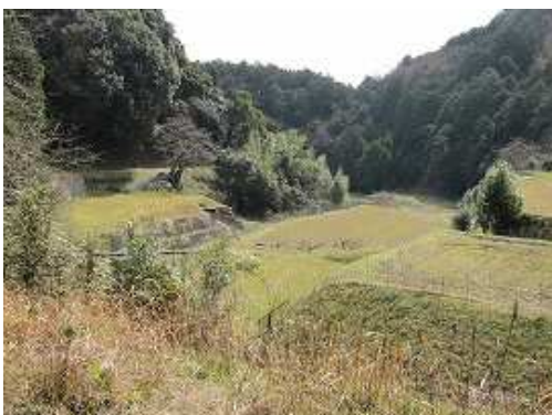
右側には棚田が広がる。