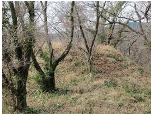
左側にある直径5m程の古墳に立ち寄り。天井部が窪んでいた。