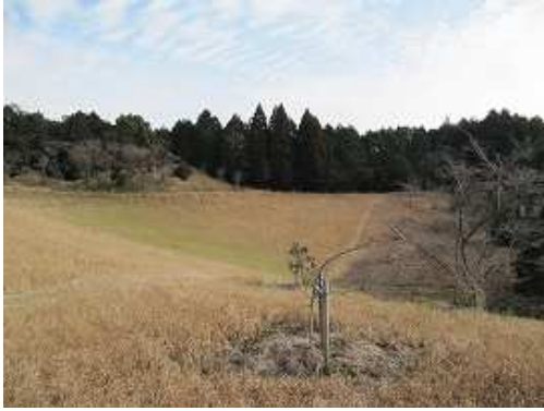
尾根に上がると正面は窪地で草斜面。奥に古墳、右奥にトイレが見える。