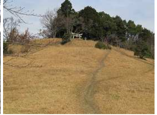
尾根の頂上に鳥居が見え、この斜面を上る。