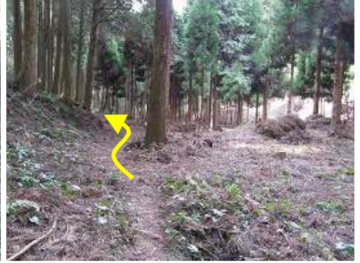
開けた場所に出て、左へ下る。