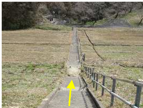
堰堤斜面の階段を降って行く。