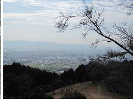
大根地山、古処山、耳納の山並みから久留米市が霞んで見えた。