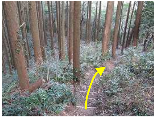
スギの植林帯を下って行く。