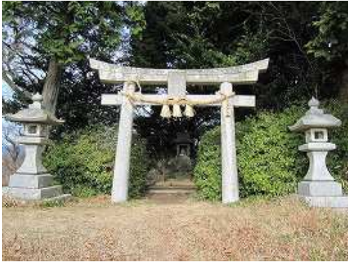
杓子ヶ峰(247m)の山頂部には宮地嶽神社が祀られている。