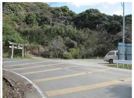
神社前広場に帰着いた。