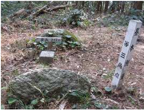
奥山(312m)の山頂は周囲をヒノキの植林に遮られて展望は得られない。三等三角点釜浦でもある。