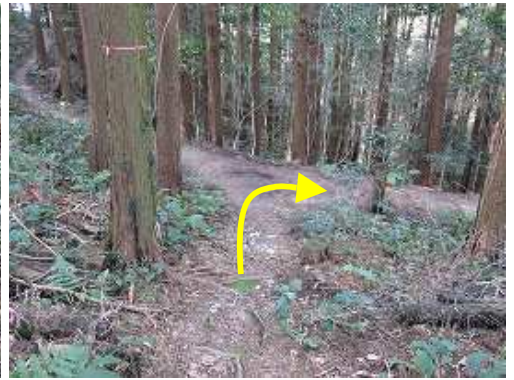
三叉路に出合うので右へ向かう。左は巻き道で二岐の下道に通じる。