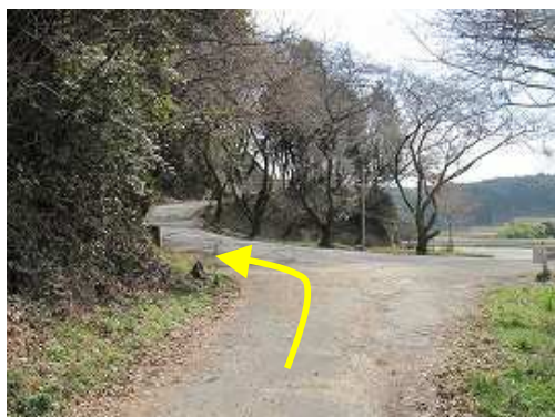
道路に出合うので左へ向かう。