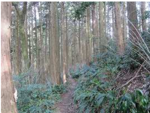
ヒノキの植林帯を抜ける。