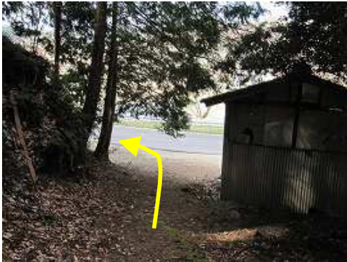
道路に出合うので左へ向かう。