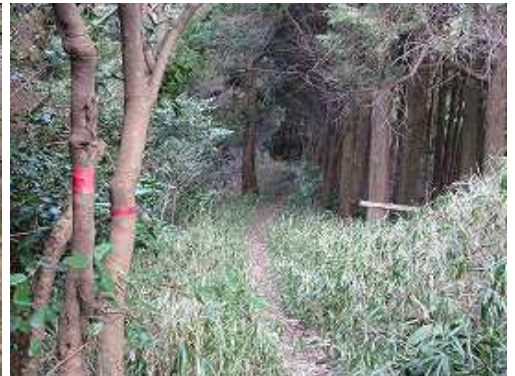
赤テープがあり、径もシッカリしている。