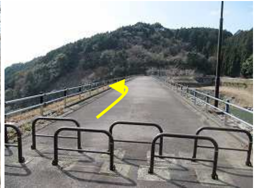
河内ダムの堰堤に着いた。堰堤中程で左に階段を降る。