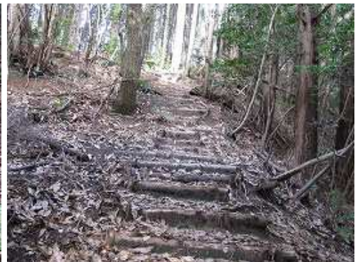
古びた丸太階段を上り詰めると奥山山頂である。