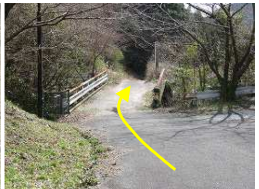
下り終え大木川を渡り道なりに下って行く。