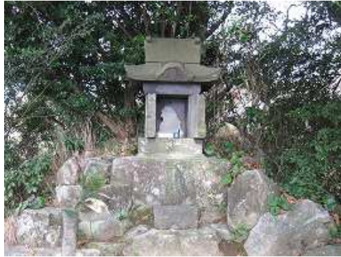
こじんまりとした祠。