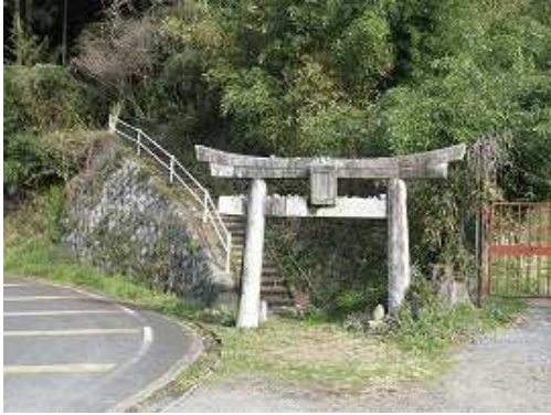
宮地嶽神社鳥居前の広場に車を止め、鳥居をくぐり階段を上って行く。広場には10台前後駐車可能。

鳥居前P～杓子ヶ峰(247m)～奥山(312m)～三叉路～道路出合～河内ダム～鳥居前P