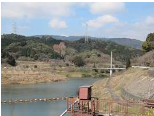
九千部山方面を望む。