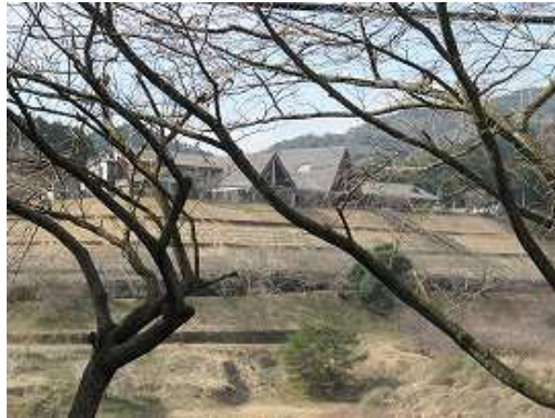
河内ダムの対岸にとりごえ温泉が見える。