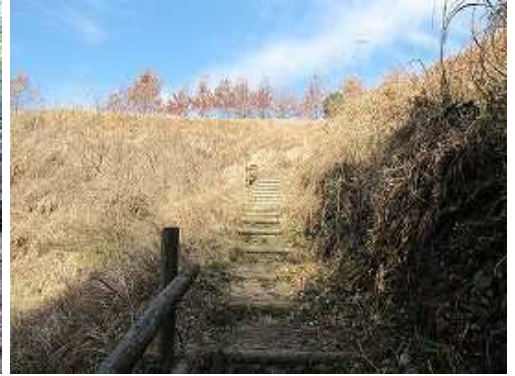
ヒノキの植林帯を抜けると、カヤ野が現れ、緩やかに上る。