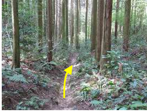
スギの植林帯の滑りやすい径を下って行く。