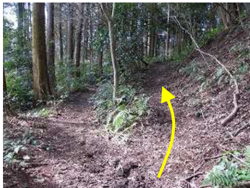
二岐は上に行く。下は山腹を巻いて三叉路にであう。