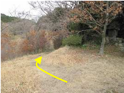
祠の左側に奥山に至る縦走路がある。